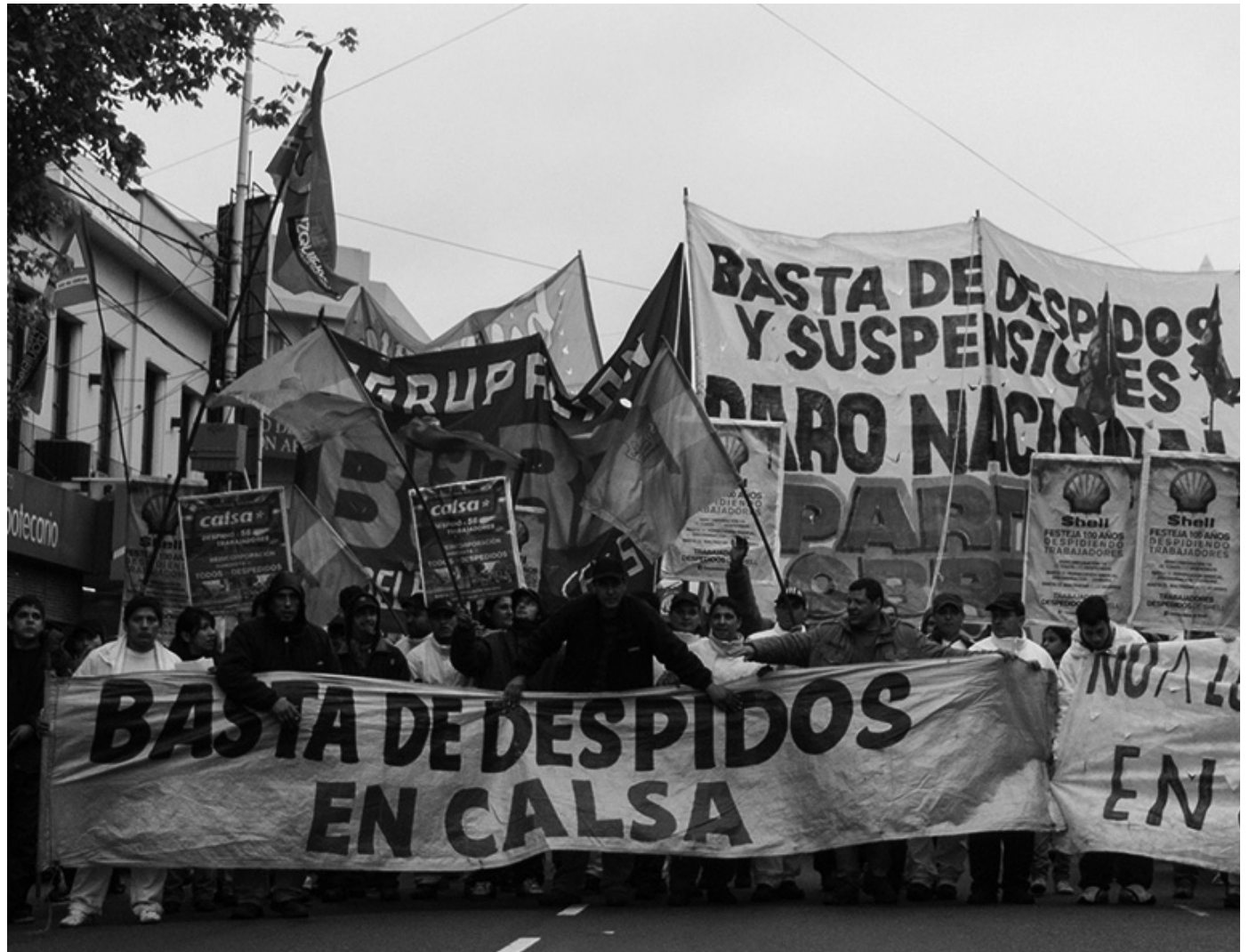
Movilización contra despidos y suspensiones. Los trabajadores ingresamos en una etapa crucial de lucha, necesitamos un programa de conjunto.

El empeño de la burocracia por acompañar el ajuste capitalista choca, sin embargo, con la envergadura de la crisis que el ajuste ha provocado. Es precisamente lo que demuestran la crisis metalúrgica en Córdoba o el enfrentamiento de la UOM con Techint y Acindar-Arcelor. El reclamo salarial de la UTA forzaría al gobierno a aumentar los subsidios al transporte y agravar el grave déficit fiscal, o producir un aumento desco-