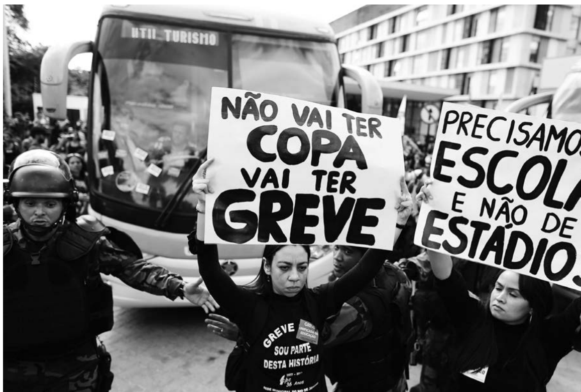
Movilización docente en Rio de Janeiro. A pocos días del inicio del Mundial hay piquetes por todas partes.

Las huelgas largas tienen su centro en el sector público, sometido a un "arrocho" (congelamiento salarial) sin precedentes, en un cuadro de inflación muy superior a los números oficiales. Los más diversos sectores de empleados estatales federales se encuentran en huelga, con sistemáticas manifestaciones callejeras; lo mismo que profesores estadales y municipales en varios estados. Los noticieros tienen que dividir la pantalla de la TV en tres partes para registrar todo lo que anda pasando. La policía reprime con todo, pero las movilizaciones crecen. Las tres universidades estatales paulistas (USP, Unesp, Unicamp), las más im-