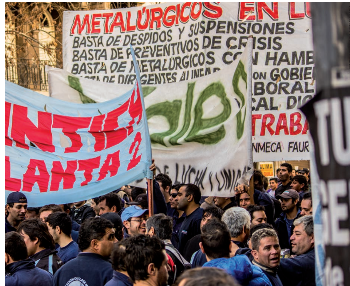
Metalúrgicos de Córdoba. El paro es la expresión de una fuerte tendencia a la lucha de los trabajadores.

Con la divulgación del proyecto, hicimos el llamado a parar este 28, establecimos un programa que es la base para un reagrupamiento clasista en el gremio; en el debate con activistas y delegados estamos organizando una alternativa para una lucha que recién empieza.