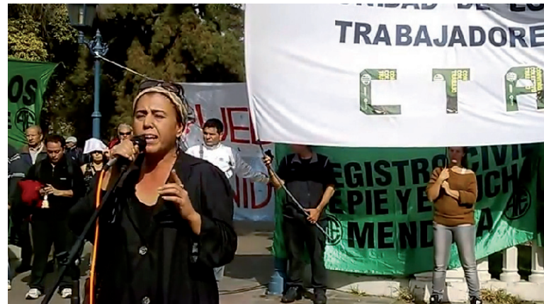
La secretaria general de ATE y CTA, en el cierre del acto del 1° de Mayo en Mendoza.

Compañeros, hoy tenemos una obligación histórica como trabajadores, más allá de las identida-