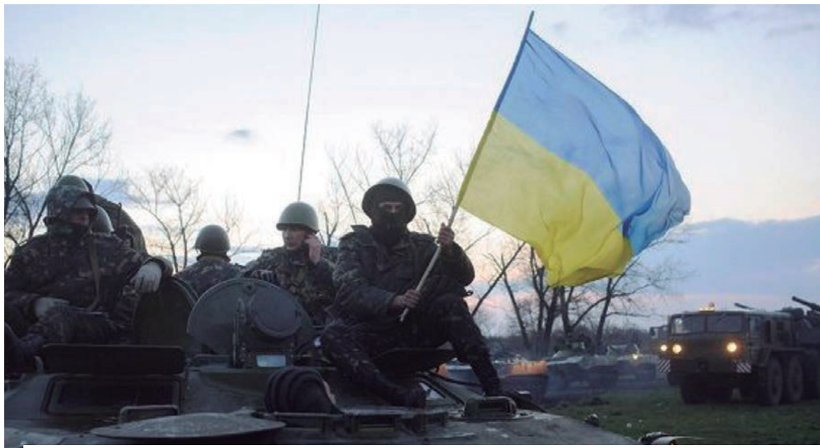
Las autoridades de Kiev, estarían planeando un asalto en regla por medio de tanques, artillería pesada y carros blindados.

El vocero de la Casa Blanca puso todas las huellas digitales el día anterior, cuando señaló, en una conferencia de prensa: "Urgimos al gobierno de Ucrania a ir hacia adelante...". El fin de semana previo había viajado a Ucrania el jefe de la CIA, John Brennan, sin que aclarara en ningún momento el propósito de semejante visita. Desde el comienzo de la crisis, el gobierno de Obama ha ido siempre más resueltamente adelante en la ofensiva política para convertir a Ucrania en un protectorado de la