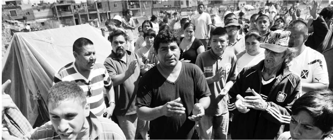
Suspensión del desalojo: una victoria popular.

Mientras se avanzaba en los aprestos del desalojo, el PRO bloqueaba todas las iniciativas legislativas dirigidas a avanzar en el reclamo de que se urbanice la villa y se construyan todas las viviendas necesarias, en un proceso controlado por representantes electos de los vecinos. Esto fue lo que planteó nuestra banca, a través de un proyecto de ley, en la Comisión de Vivienda. La iniciativa fue sistemáticamente bloqueada,