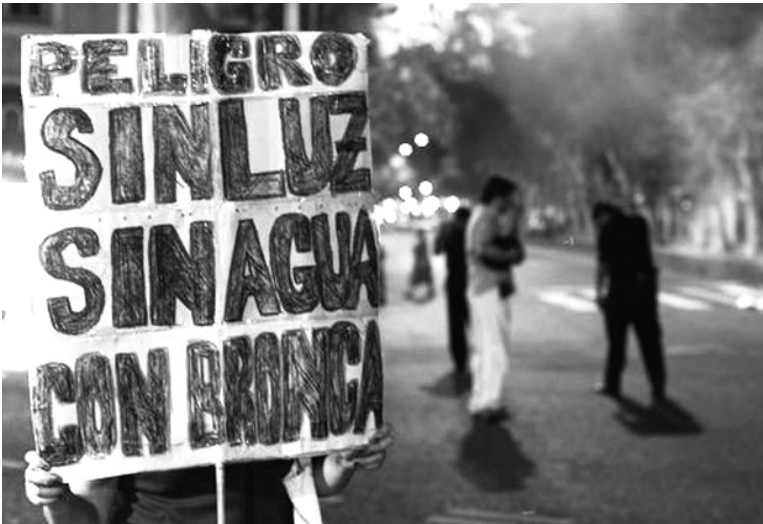
Piquete de vecinos durante los cortes del verano.

Después del agua y el gas, vienen los tarifazos en el transporte y la luz. El crecimiento del déficit fiscal. Los distribuidores, en cesación de pagos. Rescate de las privatizaciones del menemismo.