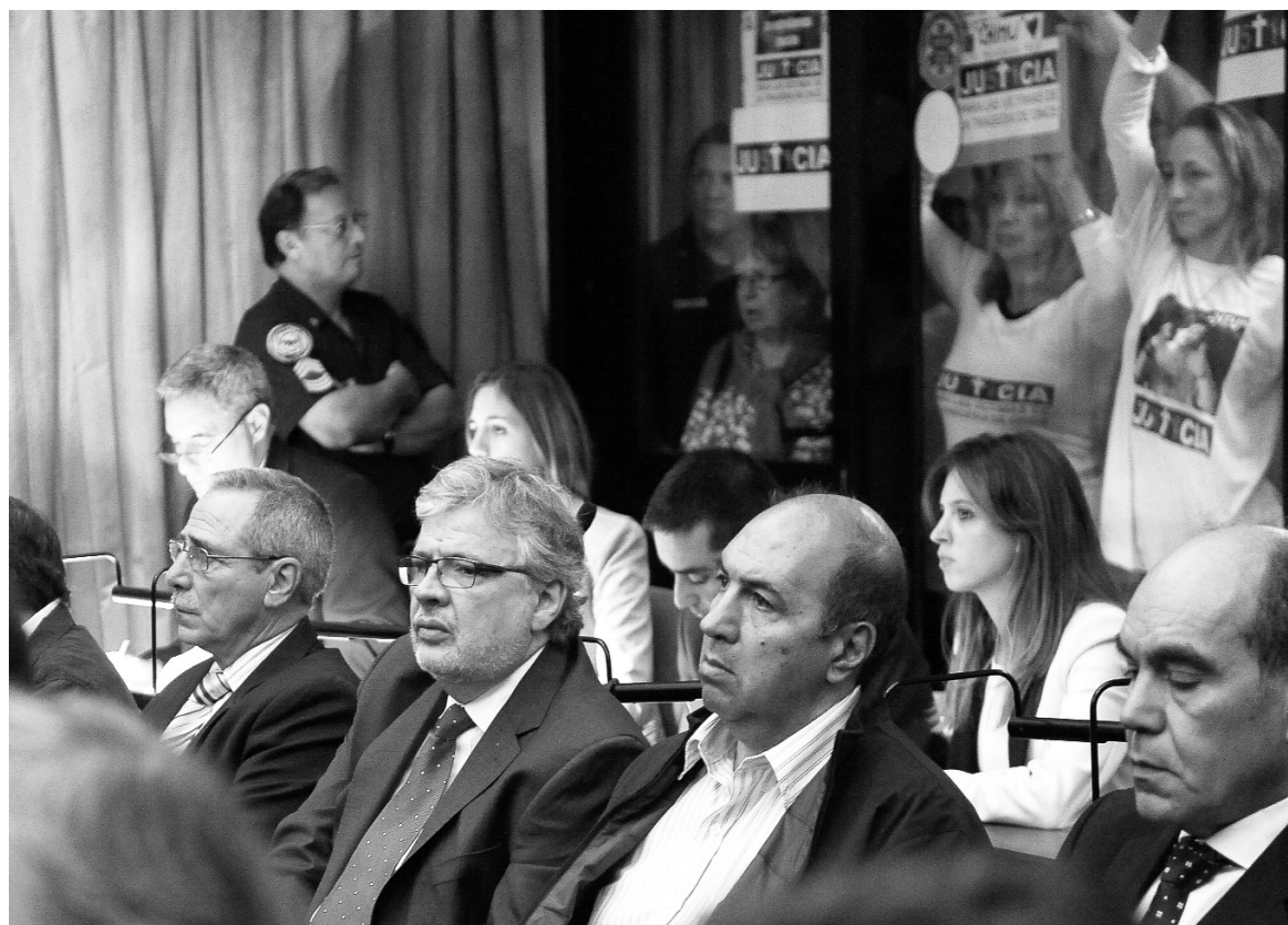
Los familiares y los funcionarios. Ha quedado probada la tríada criminal entre empresarios, funcionarios y burócratas.

La explotación ferroviaria es una operación fraudulenta, una expropiación de los subsidios del Estado.