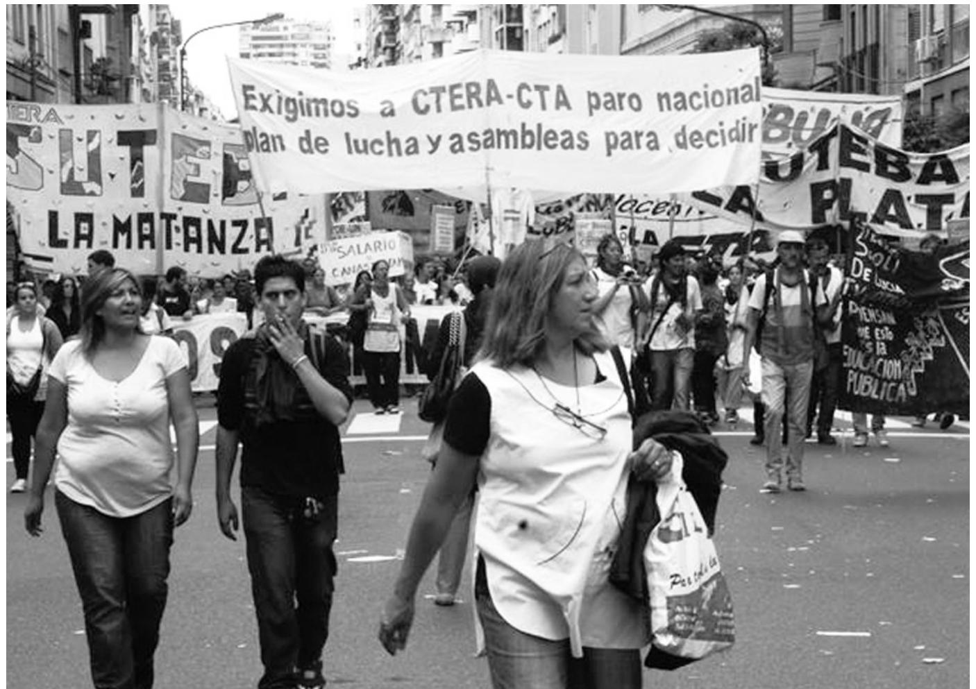
Movilización de los maestros del miércoles 26. En la victoria docente se juega el destino real de las paritarias.

En estas condiciones llamamos a deliberar sobre la convocatoria al pa-