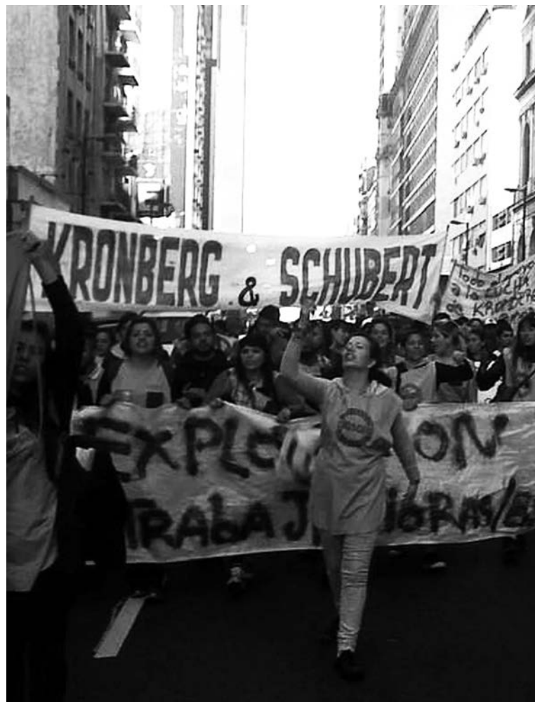
Trabajadoras de Kromberg enfrentando los despidos.

Los K se han lanzado a una carrera desesperada por obtener socorro internacional. Pretenden acceder a un financiamiento exterior que les permita atenuar el ajuste -esto cuando las condiciones para obtener ese préstamo es que lo profundice. Por eso, el Club de París exige el monitoreo del FMI. Los "nac&pop" inundan el mercado internacional con títulos para pagar deudas e indemnizaciones, lo que agranda la vulnerabilidad de Argentina para obtener más préstamos. El programa de la banca internacional es: tarifazo eléctrico y del transporte, levantamiento del cepo, arreglo con los fondos buitres y el pago de los juicios en el Ciadi. El gobierno debe decidir si paga el 'cupón PBI',