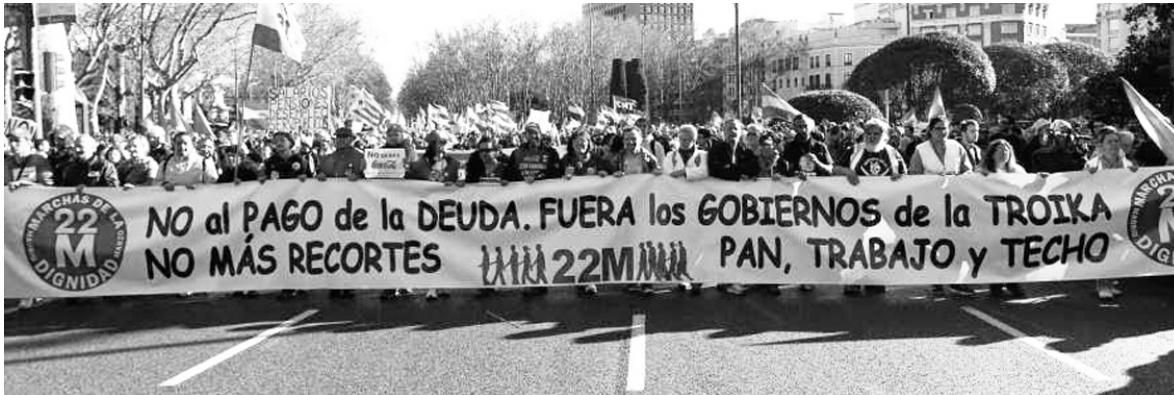
"Si hace falta, marcharemos hasta Bruselas". Cientos de miles se movilizaron contra el pago de la deuda y el ajuste.

Cientos de miles de personas (los organizadores hablan de dos millones) se congregaron en Madrid el 22 de marzo bajo las consignas "No al pago de la deuda", "Ni un recorte más", y "Fuera los gobiernos de la troika". En la etapa de organización de la marcha fue desechada la reivindicación de Izquierda Unida - "dimisión del gobierno" - porque apunta a promover, como salida política, un gobierno de coalición PSOE-IU. La continuidad de la presencia de IU en la manifestación obedeció seguramente a la ausencia de una consigna de ruptura del Estado español con la Unión Europea. Los movimientos nacionalistas, en particular en Cataluña, no solamente el bipartidismo españolista e IU, reivindican la integración en la UE, que maneja precisamente "la troika" - FMI-BCE-Comisión Europea. La realización de los Estados Unidos Socialistas de Europa pasa, necesariamente, por la destrucción de la Unión Europea. Es precisamente el punto nodal de la crisis en Ucrania, cuya unidad e independencia suponen el sacudimiento del yugo de la