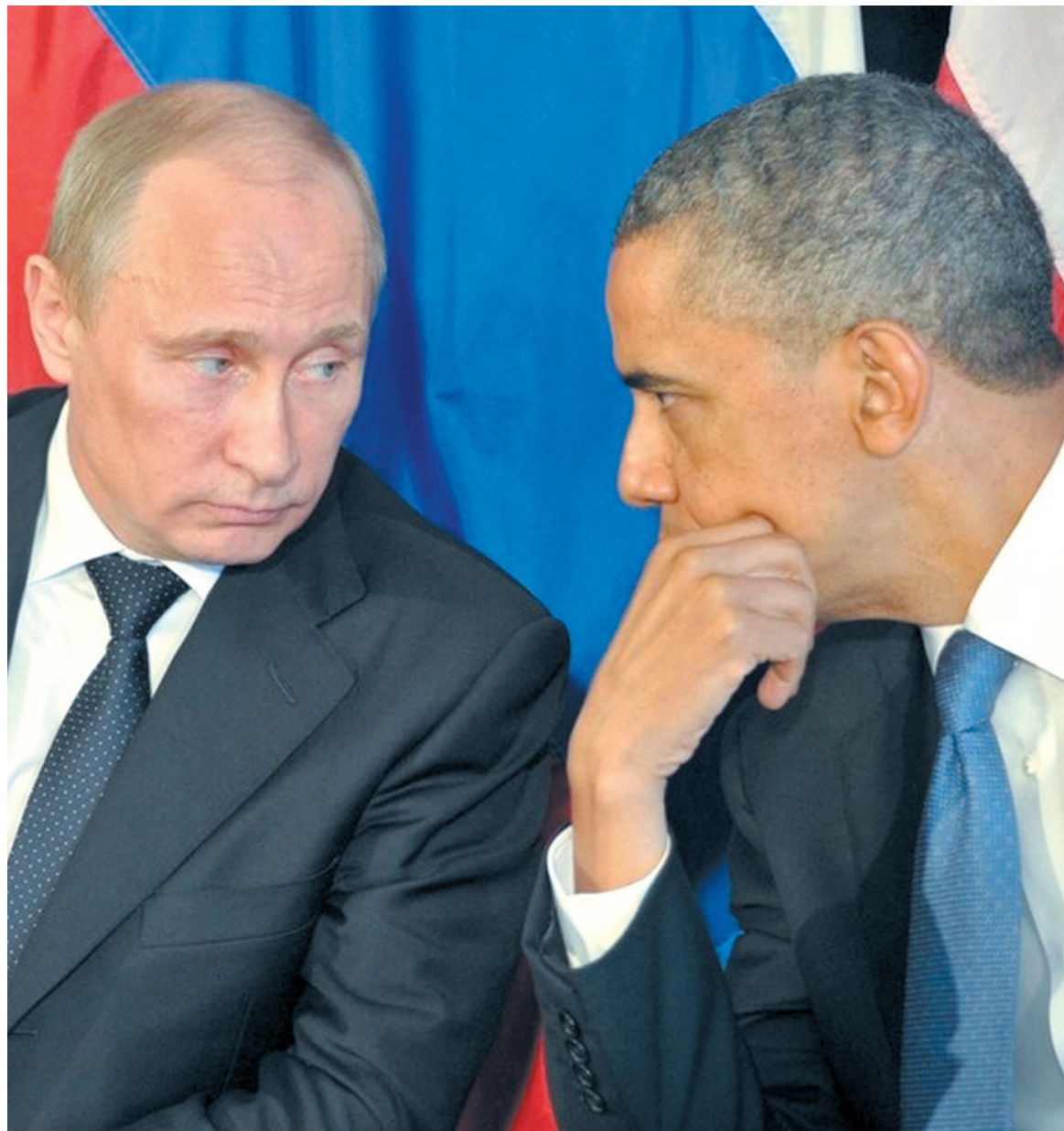
Vladimir Putin y Barack Obama

Las potencias reconocen a Ucrania como "zona de influencia" de Rusia. Reforzamiento de la "troika". Gobierno fantoche en Kiev. La oligarquía ucraniana gira hacia la Unión Europea. Intento de cambio del eje estratégico en Europa. Sólo un gobierno obrero y campesino podría garantizar los intereses de todas las regiones de Ucrania.