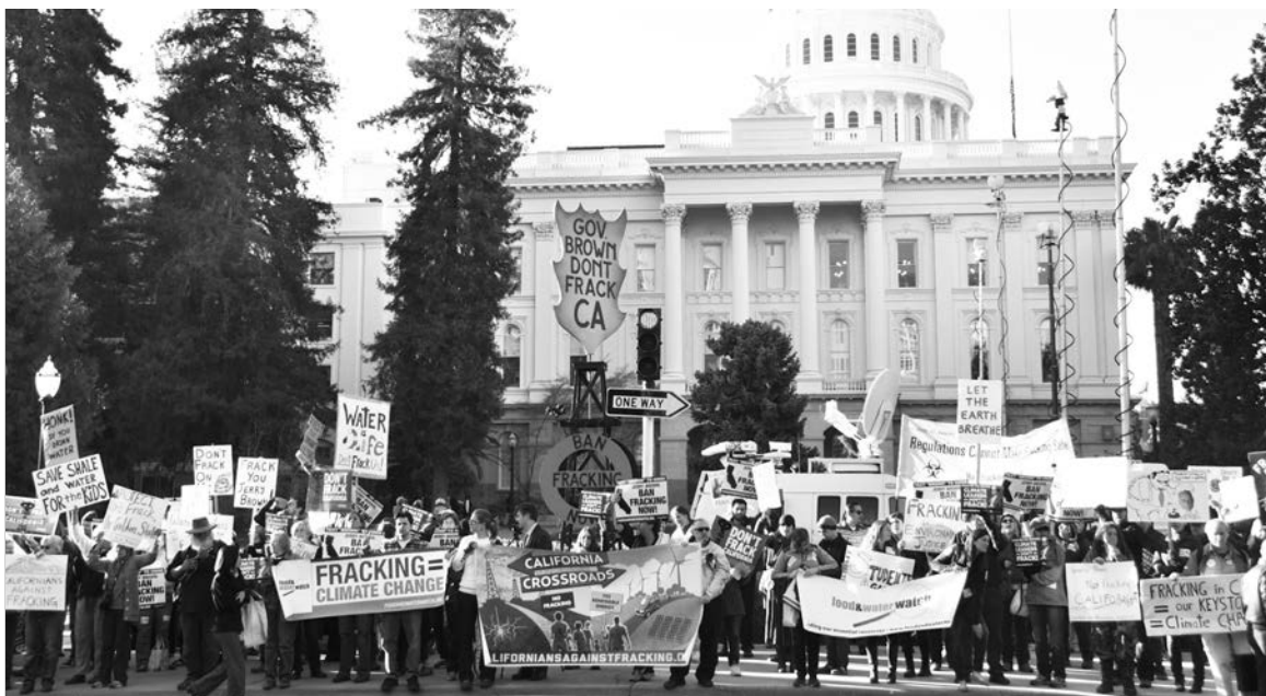
Movilización contra el fracking en California.

Cuando se acerca la fecha en que se debe decidir acerca de la continuidad de su proyecto de asociación con YPF, circulan versiones de que Chevron podría retirarse de Vaca Muerta. Las razones para ello giran en torno a la preocupación por una caída del precio del gas no convencional en el caso de que Obama autorice su exportación a Ucrania, para contrarrestar el monopolio de abastecimiento de parte de Rusia (Ucrania cuenta, sin embargo, con grandes reservas de gas no convencional y Chevron ya ha desembarcado en su territorio), o incluso a otros países de Europa Central o a toda la UE. Existe asimismo incertidumbre acerca del destino del plan de ajuste de Kirchner-Kiciloff, o sea nuevas devaluaciones del peso que licuarían los aumentos siste-