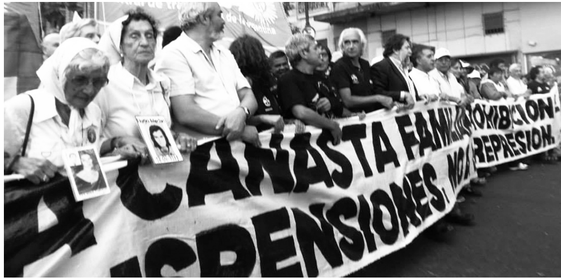
Movilización de la CTA, el 12 de marzo.

El encuentro de Atlanta empezó con un gol en contra desde el vestuario: sus protagonistas hicieron gala de su ausencia en la enorme jornada de lucha de la CTA. Un bloque político sin programa ni respaldo. Un encuentro sindical debía tener por base la claridad, hacer todo por la unidad de acción y nada por la confusión política contra el Frente de Izquierda.