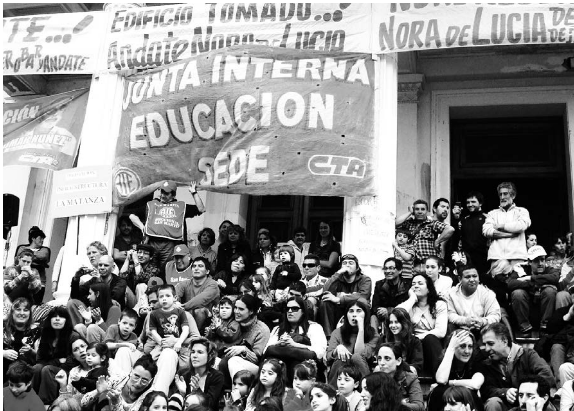
Trabajadores de ATE Educación de La Plata.

Oponer al michelismo una lista clasista. Impedir el triunfo de fracciones afines a Yasky, agencias del gobierno. Por la independencia política de la clase obrera.