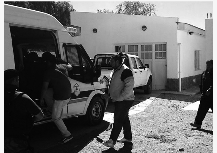
Un brutal ataque a los nuevos delegados petroleros.

La jueza Hormaechea ha negado la excarcelación de los cinco detenidos petroleros, que fueron encarcelados por su participación en un conflicto gremial en la empresa BACSSA.