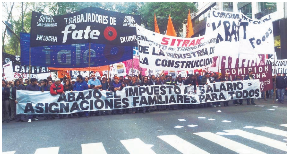
Movilización convocada por el plenario del Sutna San Fernando, el 29 de noviembre pasado.

El Frente de Izquierda tiene la capacidad para tomar iniciativas de reuniones y luchas en el movimiento sindical sin la necesidad de formar bloques políticos con el "Perro", Marea Popular u otras variantes de la izquierda democratizante, cuya política de compromiso con el centroizquierda fue derrotada sin atenuantes en los comicios recientes. Nosotros,