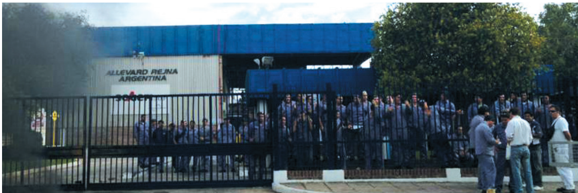
Operarios de la empresa Allevard Rejma (ex Liggett).

Varios conflictos en la industria cordobesa ocupan un lugar central en la situación política provincial.