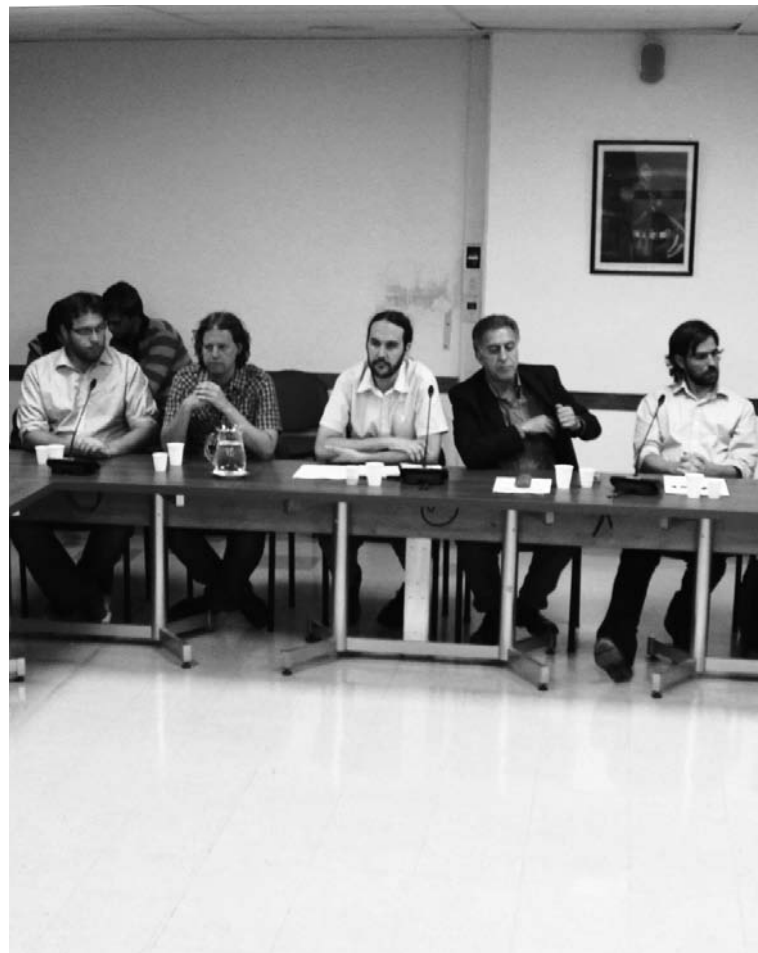
Conferencia de prensa del Frente de Izquierda, anunciando sus primeros proyectos.

Las burocracias sindicales y la UIA, con el aval del gobierno y de