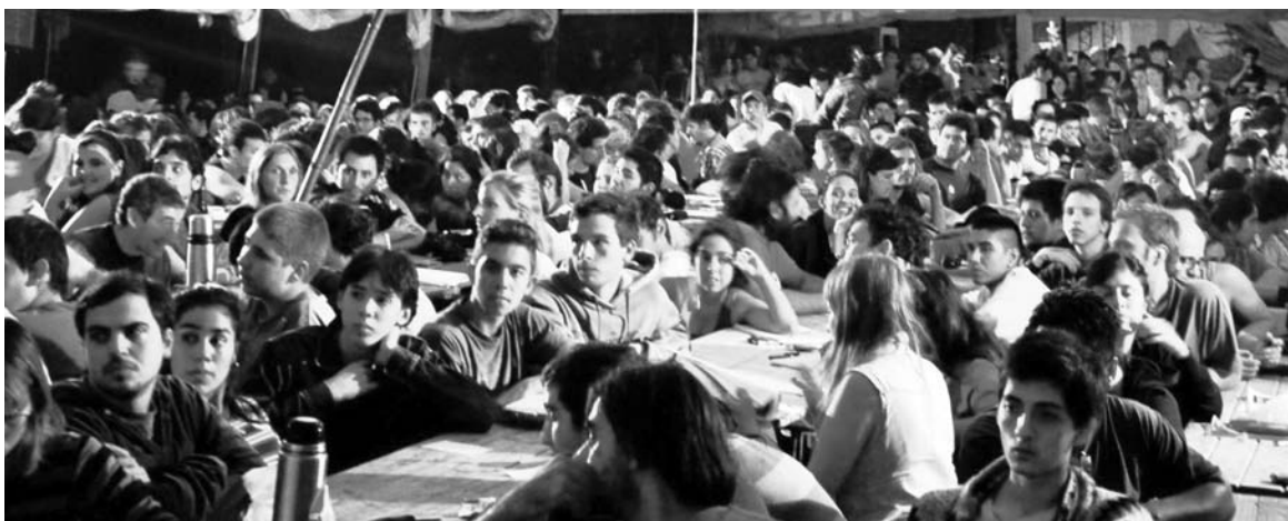
Imagen del campamento realizado en Ramallo, entre el 1 y el 4 de marzo.