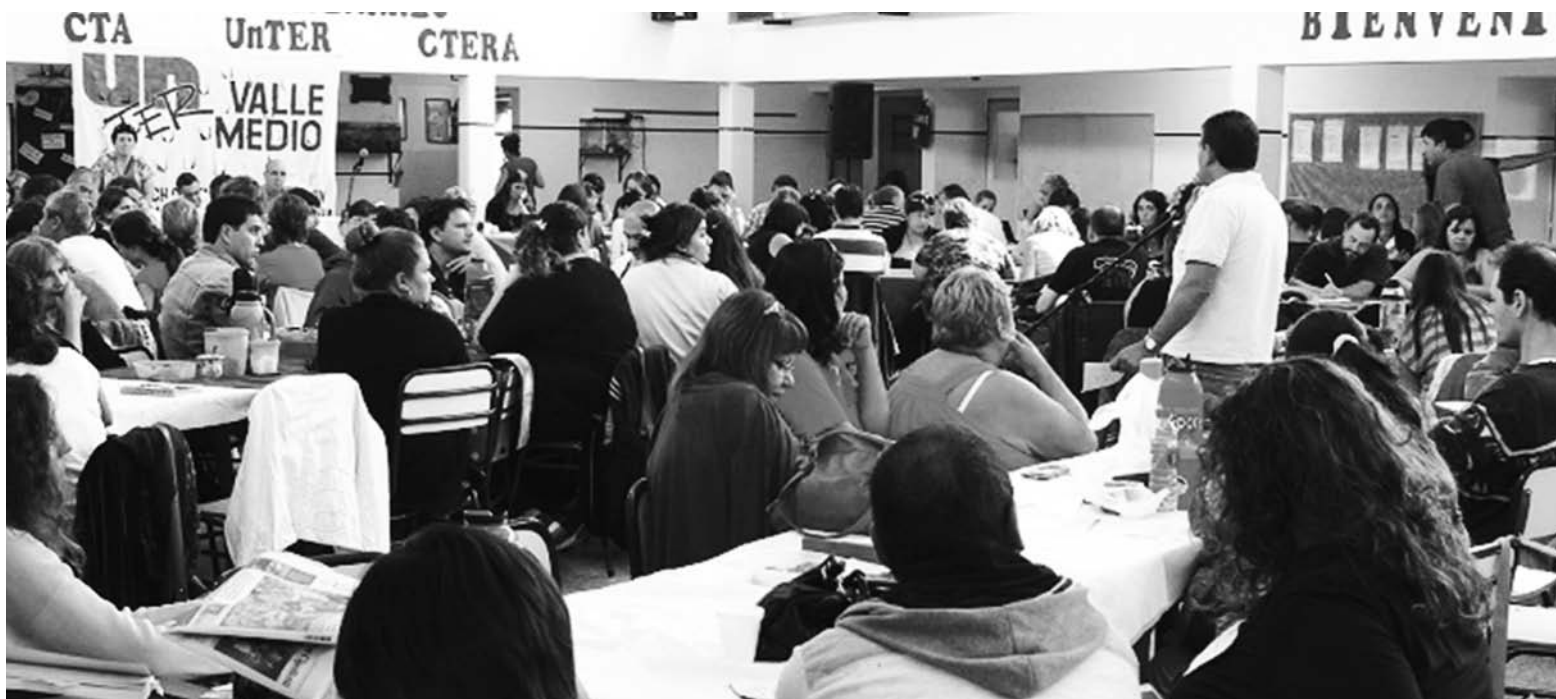
Congreso de gremio docente de Río Negro. Es necesario el impulso de un plan de lucha de todo el movimiento obrero en defensa del salario, el trabajo y las jubilaciones.

El gobierno de Weretilneck impulsa un ajustazo "modelo" contra los trabajadores. Ha ofrecido un provocador tope salarial del 20% en cómodas cuotas a docentes y estatales. La fuerte inflación generada por la megadevaluación, junto a los tarifazos que ya se han desatado en todos los servicios provinciales -o los que están en puerta- significan un mazazo al poder adquisitivo de los salarios.