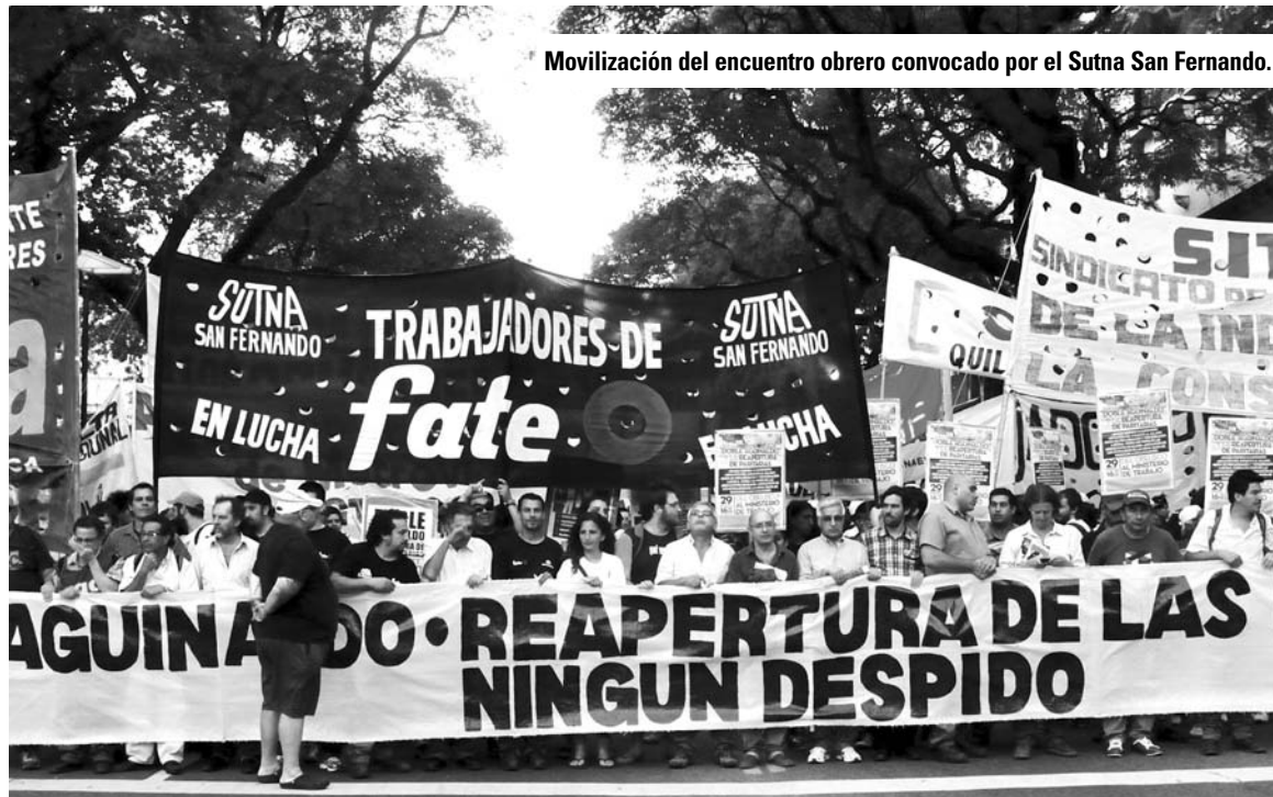
Movilización del encuentro obrero convocado por el Sutna San Fernando.

Una "unidad de acción" que puntualiza su condición de transversal respecto de centrales sindicales y sindicatos, equivale a la formación de un bloque político dentro del movimiento obrero. Sin embargo, un bloque político no puede tener por base solamente la "unidad de acción", sin asumir, por definición, un carácter confusionalista. El Sutna (Sindicato del Neumático) de San Fernando ha convocado a varios plenarios para impulsar acciones reivindicativas. La convocatoria a la que nos referimos pretende establecer una Coordinadora Nacional, lo cual ya supone un acuerdo sobre cuestiones estratégicas. En lugar de discutir sobre esas cuestiones, el latiguillo de la "unidad de acción" disimula, en cambio, un acuerdo entre tendencias que, en la lucha política que se desarrolla en el país, han tomado posiciones divergentes. No solamente esto. Una de ellas, el Frente de Izquierda y los Trabajadores, ha mostrado un claro crecimiento, obtenido casi un millón trescientos mil votos y derrotó al peronismo en la capital de Salta, lo cual significa que ha logrado avanzar como una perspectiva po-