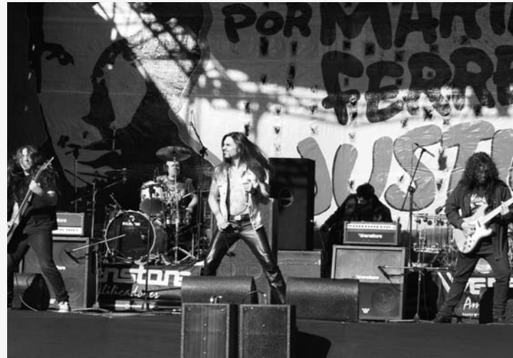
La banda Ayre lanzó su primer disco.

Finalmente, y "después de tantas luchas", como nos escribieron, los compañeros de Ayre lanzaron "Asesino político", su primer disco.