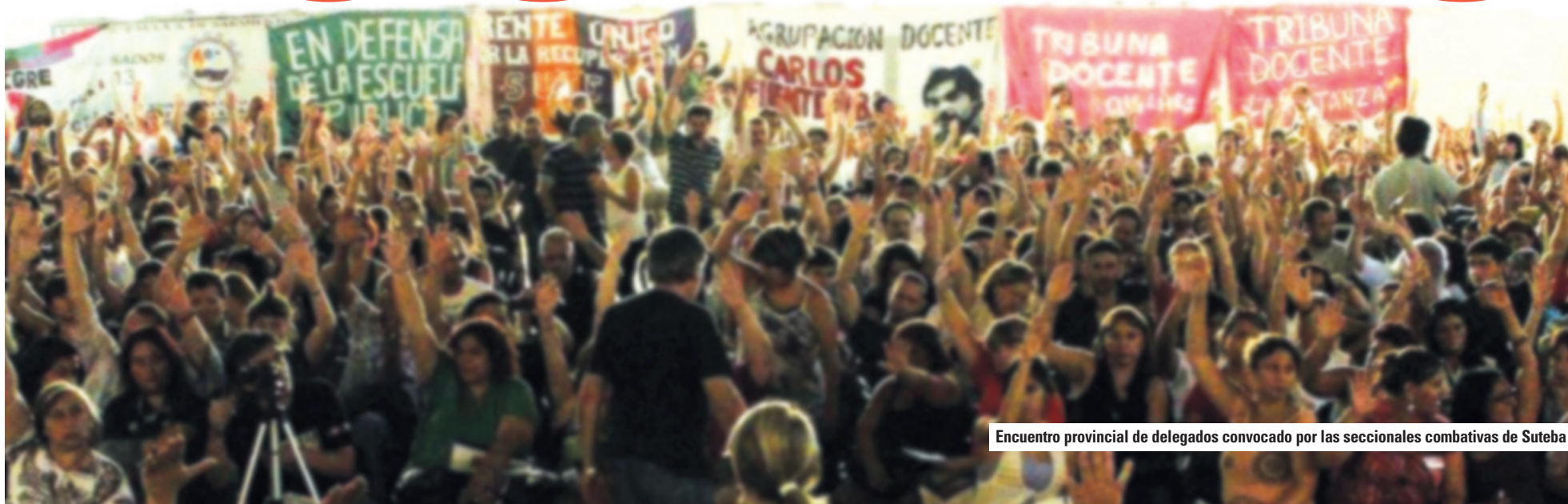
Encuentro provincial de delegados convocado por las seccionales combativas de Suteba

La indemnización que el gobierno le dará a Repsol es escandalosa.