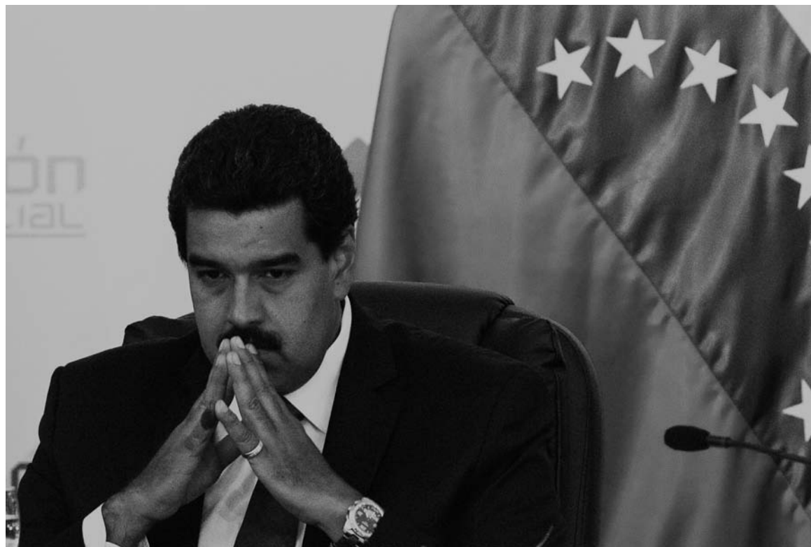
Nicolás Maduro, presidente venezolano. El chavismo se encuentra en una situación histórica terminal.

Lo que Guerrero viene a decir, en un lenguaje un poco más "ortodoxo", es que el imperialismo no quiere un golpe en Venezuela hasta donde alcanza la vista. Es curioso que no cite, en apoyo de su caracterización, el planteo del dirigente opositor Henrique Capriles, para quien la descomposición política y económica del proceso bolivariano todavía no ha alcanzado su punto de madurez y tampoco ha volcado a una masa significativa del chavismo hacia la oposición de derecha. Es probable, decimos nosotros, que este vuelco no ocurra nunca y que el verdadero temor de la derecha es que un golpe de Estado desate una crisis revolucionaria. Guerrero, de nuevo, cita a quien define como "el acadé-