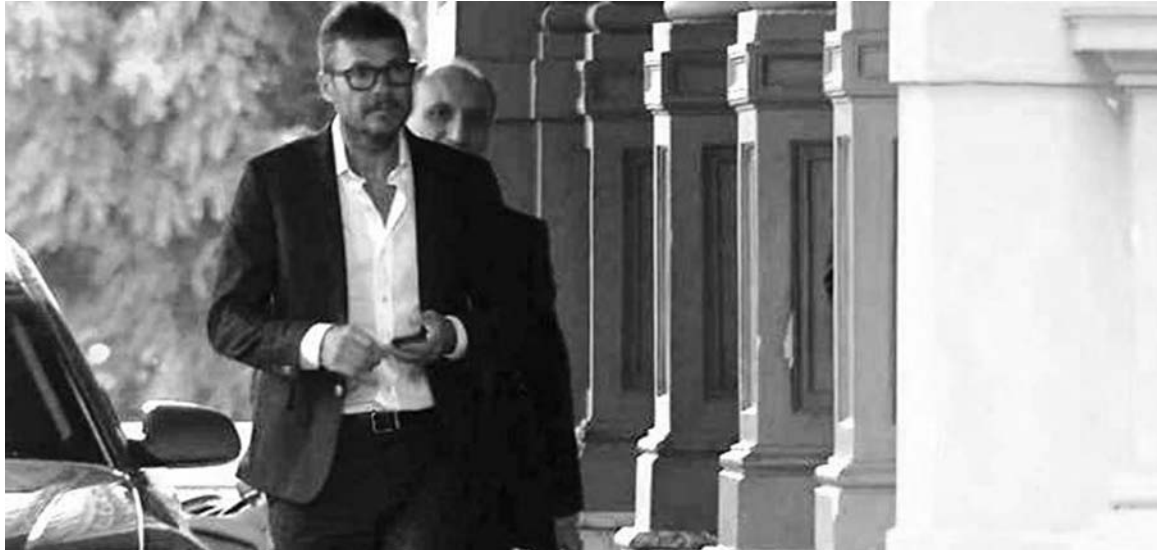
Marcelo Tinelli ingresa en la Casa Rosada.

El gobierno y Grondona alientan la restitución de las apuestas en el fútbol. El proyectado Prode "bancado" es un sistema de apuestas al que se accede por teléfono o Internet, que tiene cobro inmediato. Las apuestas se pueden realizar hasta el último segundo, como en las carreras de caballos. Uno puede jugar a quién gana, cuántos corners habrá, quién hace más goles, etc., cobrando y apostando vía