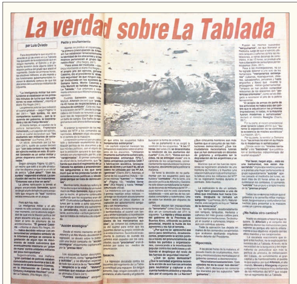
Los únicos que repudiaron la masacre de La Tablada fueron las Madres de Plaza de Mayo, la Asociación de Ex Detenidos Desaparecidos y el Partido Obrero.