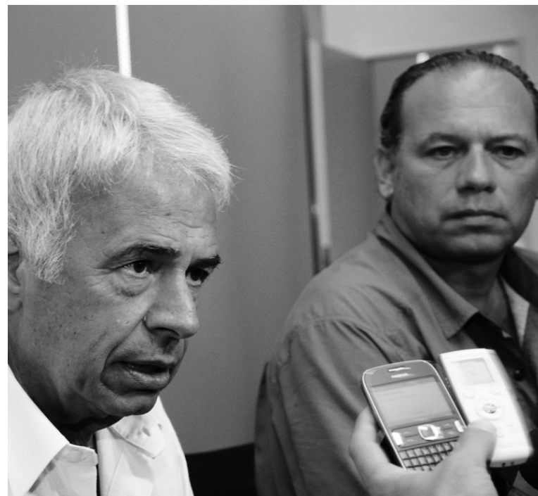
De la Sota, gobernador de Córdoba, junto al secretario de Seguridad Sergio Berni.

El fiscal provincial que sigue la causa del amotinamiento policial y los saqueos del 3 y 4 de diciembre pasados resolvió el encarcelamiento de 16 agentes de policía (entre oficiales y suboficiales) y de Adriana Rearte, ex empleada del servicio de penitenciaria y esposa de un policía. Rearte estuvo a la cabeza de las mujeres que iniciaron los reclamos salariales a fines de noviembre. Luego de tomarles declaración, el fiscal liberó a tres de los policías y a Rearte, aunque informó que el número de implicados y detenidos podría crecer.