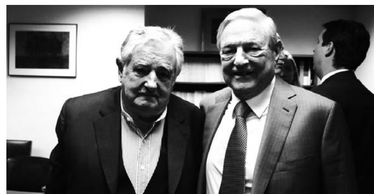
José Mujica, presidente uruguayo, junto al especulador, accionista de Monsanto e impulsor de la legalización de las drogas, George Soros.

Hay quienes defienden esta ley como un avance en las libertades democráticas, por permitir el autocultivo y la venta legal. El artículo 3 los contradice, porque estipula que se realizará un registro de todos aquellos que consuman o que tengan plantas de autocultivo. También que todos aquellos que superen los cánones establecidos por la ley (45 gramos mensuales) o no se registren podrán ser penalizados. Como complemento, el gobierno aprobó una nueva ley (que ha sido fuertemen-