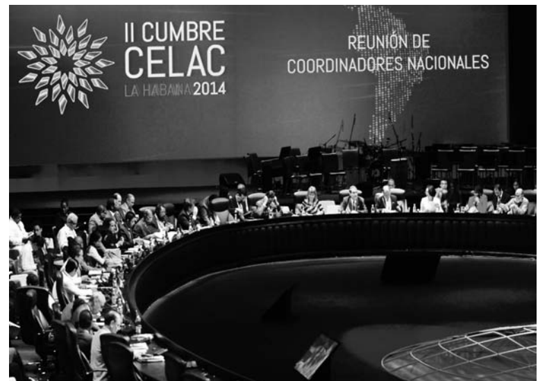
Reunión de la Comunidad de Estados Latinoamericanos y Caribeños.

La devaluación del peso "alarmó", dicen los cables, a los socios comerciales de Argentina, que han respondido con sus propias devaluaciones de sus respectivas monedas. En vez de unirse contra el capital financiero, las burguesías latinoamericanas compiten pa-