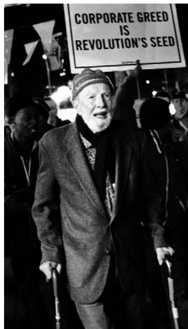
Seeger, marchando con Occupy Wall Street.

Fue mentor de jóvenes que empezaban en el folk, como Bob Dylan, Don McLean y Bernice Johnson Reagon; Bruce Springsteen cantó sus canciones en "We Shall