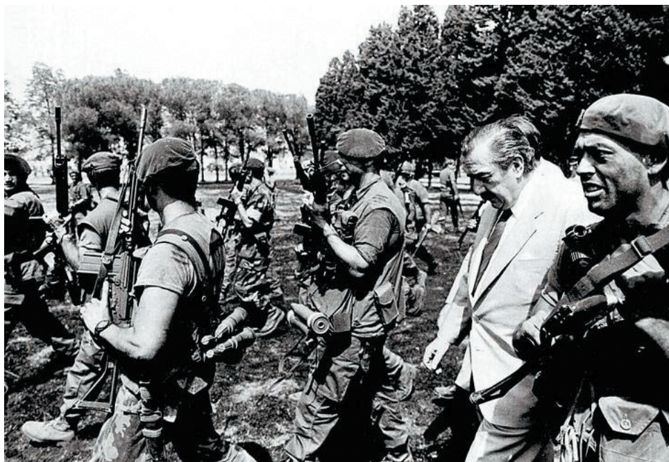
El ejército y Alfonsín reprimieron el mini-asalto de La Tablada como nunca lo habían hecho con los levantamientos carapintados.

Gorriarán Merlo había tratado de recrear un foco guerrillero rural en Jujuy, en la etapa final de la dictadura: "suponíamos que la dictadura iba a perdurar, no se vislumbraba (...) que dos años después se desmoronaría" ( Memorias , de Gorriarán Merlo, citado en La Tablada... ). Cuando estalló la guerra de Malvinas, sin embargo, Gorriarán viajó de emergencia desde Nicaragua y subió al monte jujeño para "desarmar la tropa". "No le fue fácil. Un grupo suponía que la Junta Militar no retrocedería y