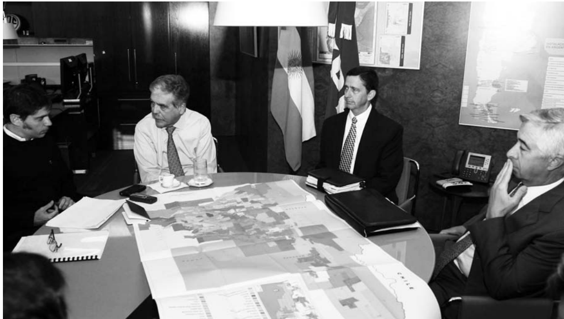
Kicillof y De Vido con directivos de Chevron

Una variante consistiría en el relevo de Capitanich por parte de Kicillof, quien viene actuando como vehículo del capital extranjero. El keynesiano fue uno de los artífices de los acuerdos en el marco del Cidi y fue el principal arquitecto del acuerdo con Repsol. Es el hombre que lleva adelante las tratativas para que el FMI vuelva a auditar las cuentas públicas, lo cual se inscribe en una negociación más general dirigida a regularizar la deuda con el Club de París, al cual ofreció constituir un fideicomiso especial (con cuentas y fondos administrados en el exterior) para asegurarles a los acreedores el cobro de sus acreencias. La propuesta fue vista con beneplácito por los representantes de la banca europea. Los "nacionales y populares", por lo tanto, pretenden salvarse recostándose en el capital extranjero y en un mayor acercamiento a los círculos financieros internacionales. Esto ocurre cuando el "neoliberalismo" empieza a levantar cabeza en América Latina nuevamente. El semanario The Economist acaba de ensalzar el núcleo de países conformado por Chile, Perú, Colombia y México (el llamado "eje del Pacífico"), el cual -según su óptica- es