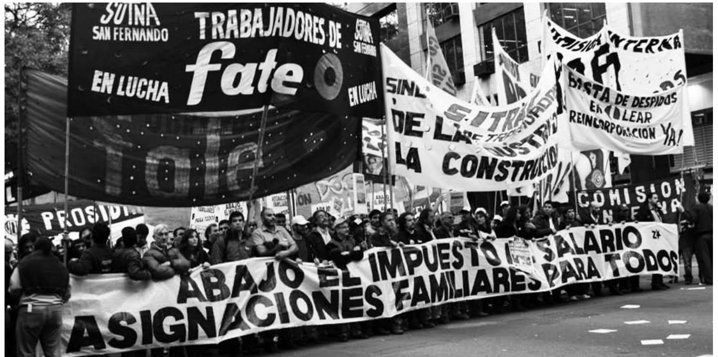
Movilización de la Coordinadora Sindical Clasista con el Sutna San Fernando, el Sitraic y otras organizaciones.