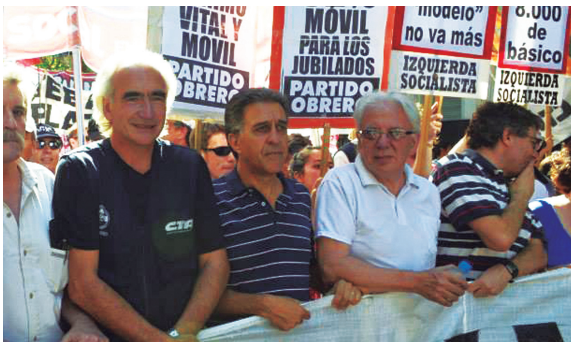
Cabecera de la movilización obrera del 19 de diciembre.

Los recientes motines policiales han sido el emergente de una crisis inflacionaria y de una crisis económica, social y política de enorme alcance. No aceptamos la