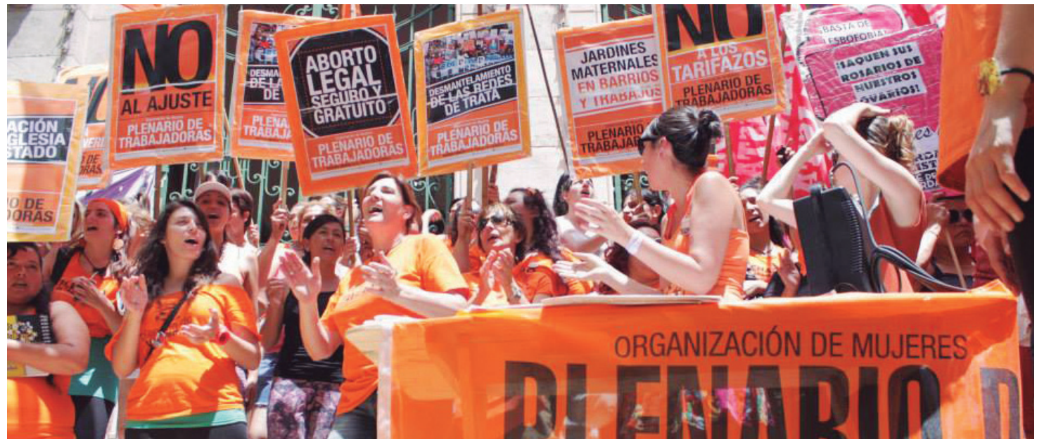
Plenario de Trabajadoras. Lanzamos la campaña hacia la movilización del Día internacional de la Mujer Trabajadora.

Estas comisiones han sido un bastión histórico de las socialistas, allí cuando empezaban a organizar a la mujer trabajadora tras su programa específico. Las bolcheviques fueron las más destacadas, con la conformación de miles de delegadas al entonces llamado Zhenotdel (departamento del partido