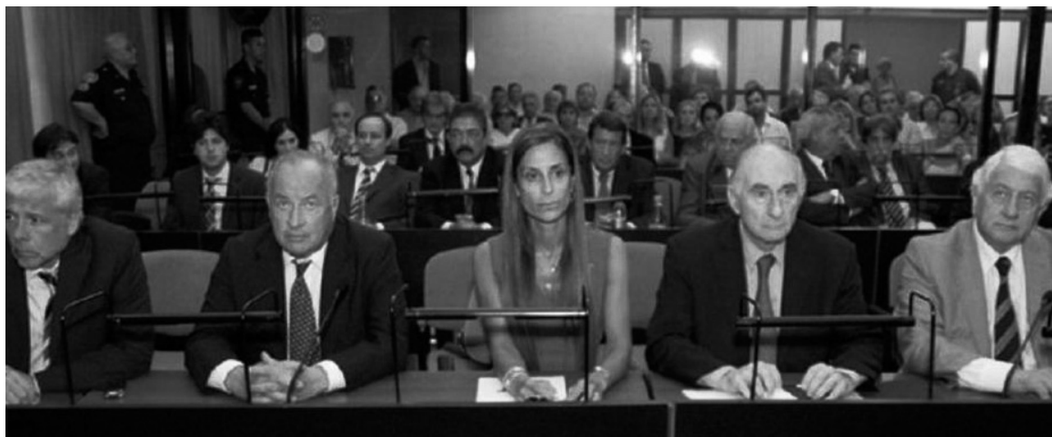
El ex presidente Fernando de la Rúa, durante el juicio por las coimas en el Senado. La absolución de todos los acusados defiende la continuidad de un régimen social y político, donde la corrupción remunera la defensa de los intereses estratégicos de la clase capitalista.

tereses estratégicos de la clase capitalista. Esa clase, que no va al banquillo, como no lo fue con la dictadura, protege desde luego a su "personal" político.