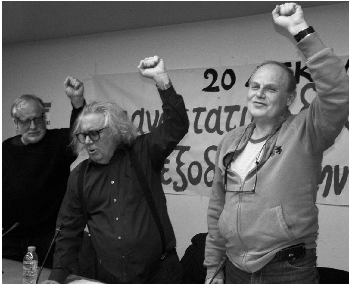
Acto de cierre de la reunión de la Coordinadora por la Refundación de la Cuarta Internacional.

Sobre América Latina, los representantes del Partido Obrero expusieron las consecuencias de la crisis capitalista, por un lado, y las alternativas del desarrollo de la izquierda. Destacamos el fracaso del intento de querer construir un partido de la burocracia sindical, en Bolivia, el llamado Instrumento Político, sobre la base de un planteo centrista ('partido de trabajadores'). Este fracaso había sido adelantado en el documento de nuestra conferencia latinoamericana realizado en 2011. El agotamiento de las experiencias como el chavismo, lulismo y frenteamplismo, abre una posibilidad política en los términos de la experiencia argentina, a condición que se apoye en un programa, o sea en una delimitación política del nacionalismo y del centrismo. Hemos llamado la atención hacia las elecciones, en 2014, en Brasil y Uruguay.