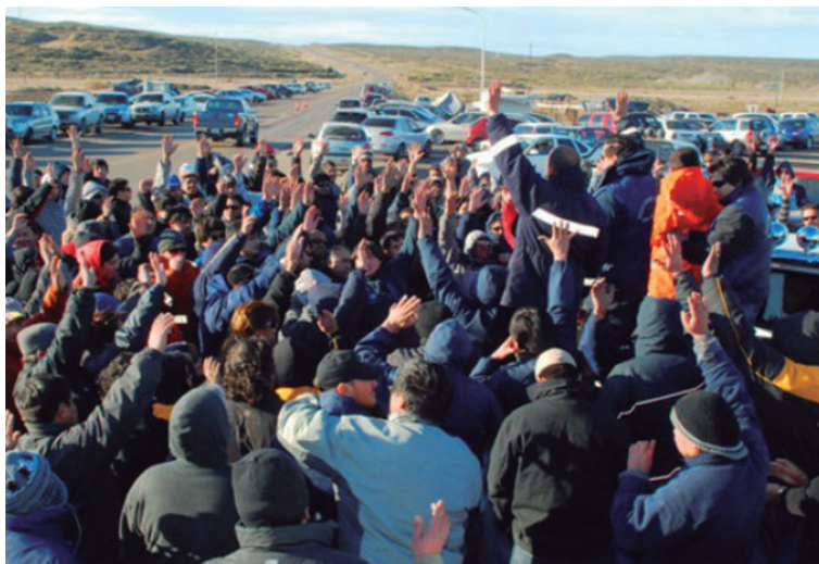
Asamblea de trabajadores petroleros.

Vamos por 8.500 pesos del básico de convenio