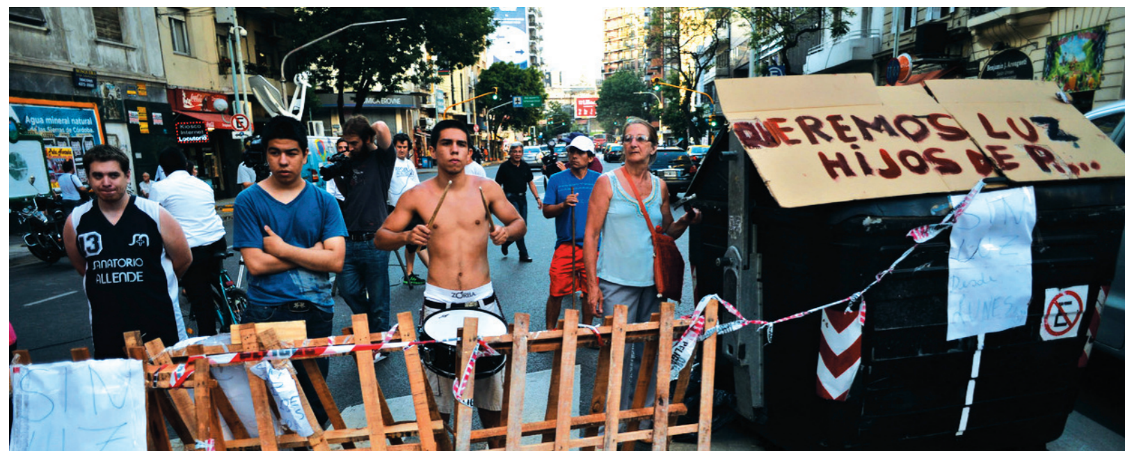
Piquete de vecinos. Los cortes de luz revelaron la fundición del régimen de rescate de la burguesía, puesto en marcha en 2002; el Frente de Izquierda impulsa la nacionalización integral de la industria energética, desde la extracción de petróleo y gas hasta la energía eléctrica, bajo la gestión de sus trabajadores.

amigos del “modelo” se han devorado estos recursos sin invertir un centavo. Ahora, el gobierno y sus opositores pretenden explotar el desasosiego popular causado por los cortes para imponer un tarifazo en regla. En oposición a este desquicio, nuestra iniciativa de “emergencia eléctrica” aportó un programa y una orientación de lucha para los trabajadores y vecinos afectados.