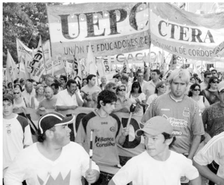
Docentes cordobeses en lucha por el salario. Los gobernadores buscan descargar sobre los trabajadores de las provincias el costo de su inexorable quebranto financiero.