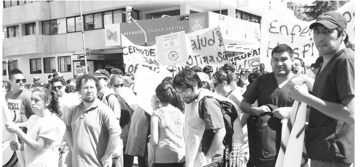
Enfermeros neuquinos. La enorme huelga de salud ha dejado planteada la necesidad de reestructurar la provincia sobre nuevas bases, que partan de la defensa del salario, la salud y la educación públicas.

Ha quedado en evidencia el papel de la burocracia de ATE y CTA, que operó conscientemente para aislar el conflicto, en momentos donde se instaló entre los estatales la lucha por los 10 mil de inicial, el doble aguinaldo y el fin de la precarización. Mientras se caía de maduro la necesidad de una huelga general que quebrara la intransigencia del gobierno -la que incluso fue reclamada por la propia asamblea interhospitalaria- la dirigencia de ATE pactó