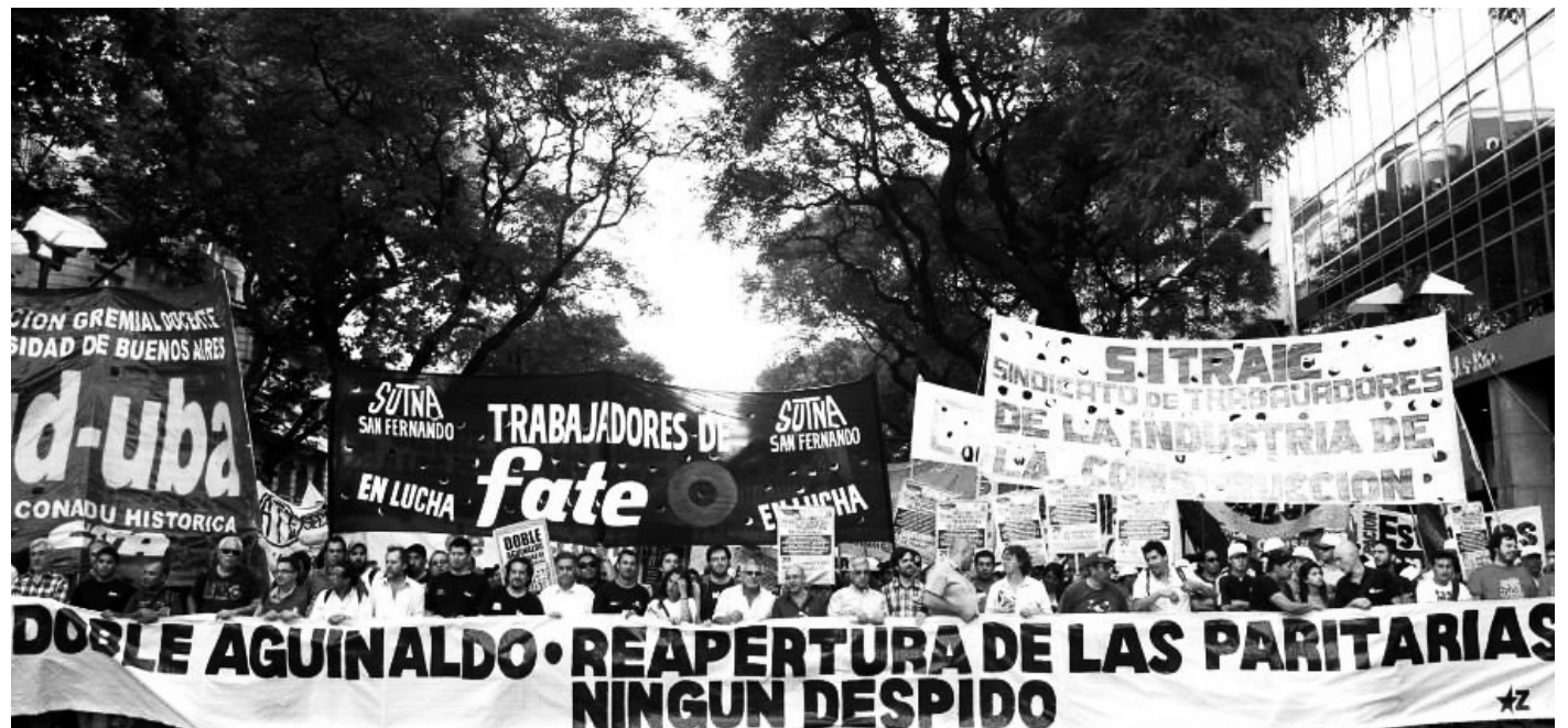
La clase capitalista está decidida a descargar la crisis sobre las espaldas de los trabajadores.

Toda la política diseñada por el "soviético" Kicillof se reduce a intentar que la tasa de devaluación sea superior a la de inflación, para lograr de este modo la devaluación real del tipo de cambio que reclama al unísono toda la clase capitalista. Y mediante esta devaluación, lograr el levantamiento del cepo cambiario, para permitir el giro de utilidades y lograr un