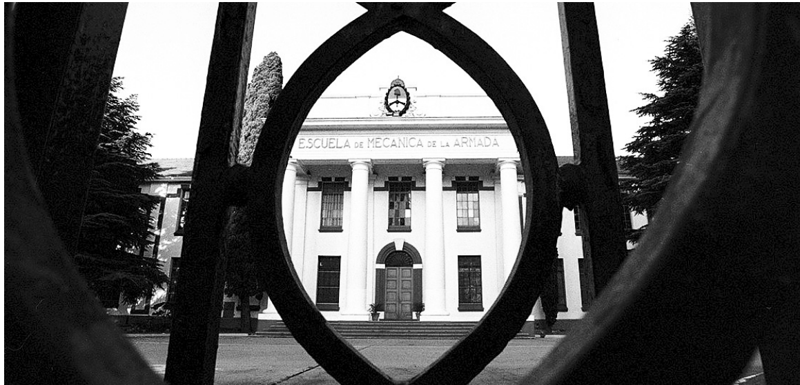
Entrada de la Escuela de Mecánica de la Armada. Los juicios se desarrollan por la tenaz movilización y compromiso de familiares, sobrevivientes, organismos de derechos humanos y organizaciones populares.