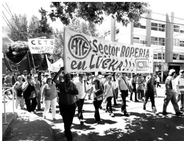
Movilización de trabajadores estatales. Crisis, disputas y realineamientos por arriba; pronunciamientos políticos y luchas obreras por abajo.

Pero las crisis, disputas y realineamientos por arriba, tienen como contrapartida un pronunciamiento político masivo contra el