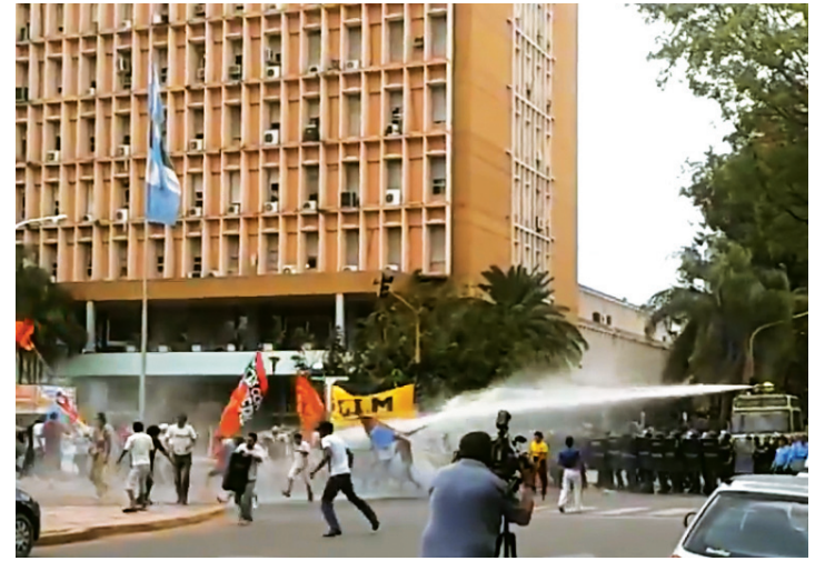
Represión en Resistencia. Una postal habitual en el gobierno de "Coqui".