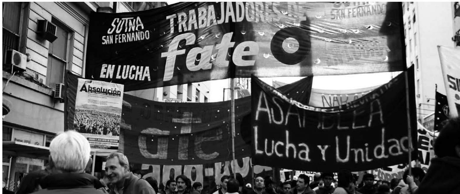
Movilización del Plenario clasista de San Fernando.

Caló, Yasky y Palazzo fueron dócilmente a escuchar de Capitanich el pedido de "previsibilidad", cuando el costo de vida es-