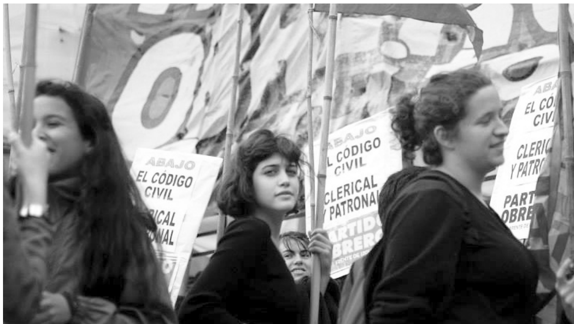
En el Congreso, la izquierda denunció el Código clerical y patronal. La reforma también precariza las condiciones de los trabajadores.