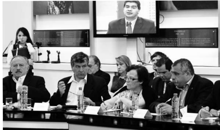
La dirección de la CTA oficialista en el "diálogo social".

Ese mismo día, una diluida reunión de secretarios generales de Suteba y el Congreso de Ctera votaron el plan de acción gremial del sindicalismo docente K en plena