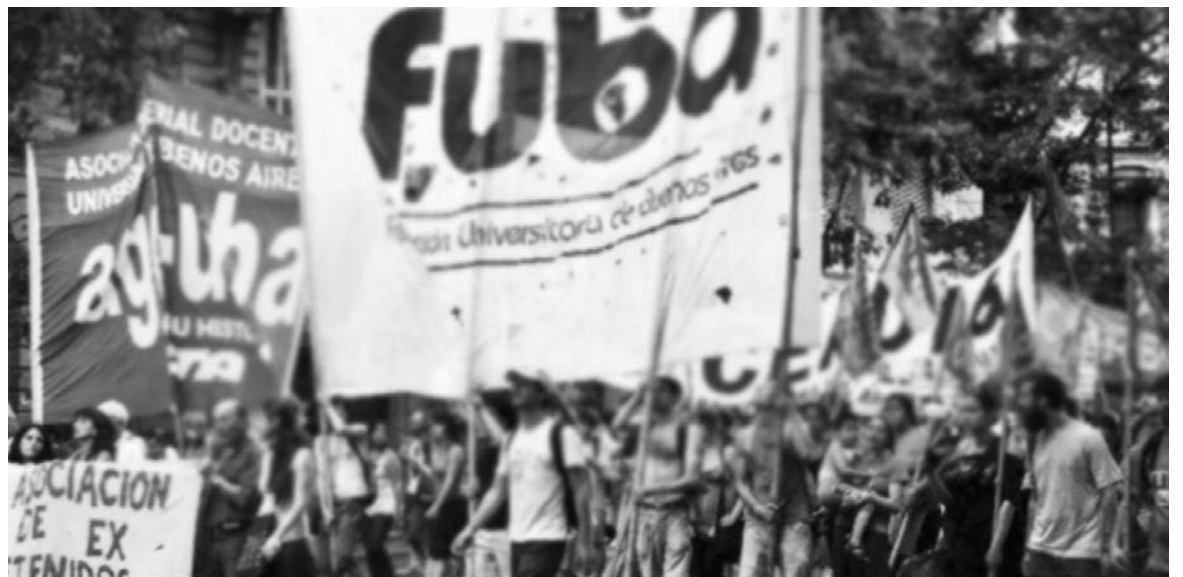
La Fuba sale a la calle contra la Asamblea Universitaria reaccionaria.

Hay que revolucionar la universidad, sacarla de las garras de una camarilla descompuesta, y reorganizarla sobre nuevas bases sociales.