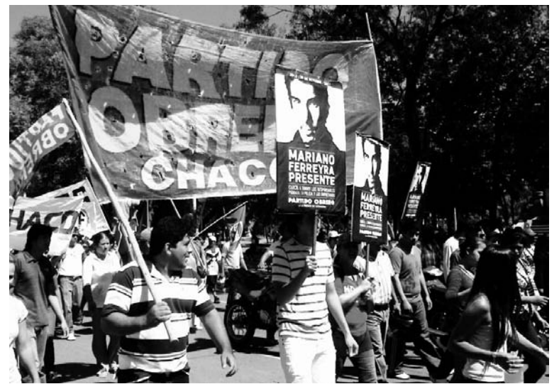
Una gran campaña del PO de Chaco. Hemos desarrollado la perspectiva de la izquierda revolucionaria, no la adaptación política al democratismo formal.

El acercamiento de fiscales durante la elección nos pone en condiciones de dar un salto en el reclutamiento al partido. Nuestro método de incorporación tiene que replicar el método de la campaña: