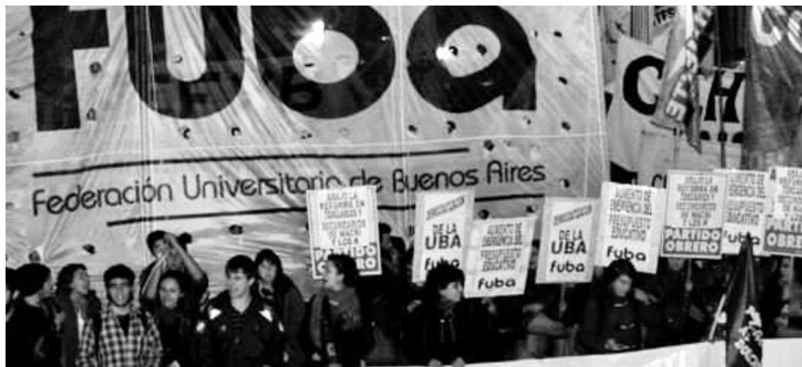
La Federación Universitaria de Buenos Aires. Luchamos para poner fin al régimen de gobierno de una pequeña camarilla profesoral -menos del 1% de la población universitaria (2.900 profesores, frente a 30 mil docentes y 13 mil no docentes y 300 mil estudiantes).

La condición de profesor titular, académico graduado o científico con el debido diploma, no califica para ejercer la gestión de una universidad, como sí ocurre en lo que atañe a impartir la enseñanza correspondiente. Tan es así que ha surgido un posgrado para la licenciatura de la gestión universitaria, como una especialidad. Si esta calificación prosperara, podría ocurrir que esa gestión sea transferida en cualquier momento a un CEO, como ocurre con las sociedades anónimas, en especial si cotizan en Bolsa, algo que ya debe es-