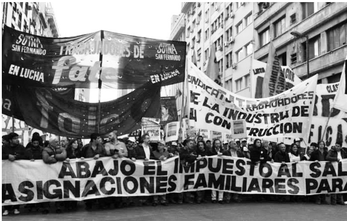
Marcha del Plenario del Sutna San Fernando contra el impuesto al salario, por las asignaciones familiares y contra la precarización. La gran elección del Frente de Izquierda prepara las condiciones para colocar al clasismo en la ofensiva en el movimiento obrero.

mente, en la Capital. La "construcción" Binner 2015 con la que lanzaron su campaña desde Racing, como izquierda de la centroizquierda, se ha fundido como alternativa política para los luchadores. Los dirigentes del sector estiman que la mitad de los votos de sus "militantes" se fueron con Massa y la otra con el Frente de Izquierda en provincia, donde la dirección se abstuvo de definir a quién votar. Esto fue todavía más grave que quedar afuera de las Paso.