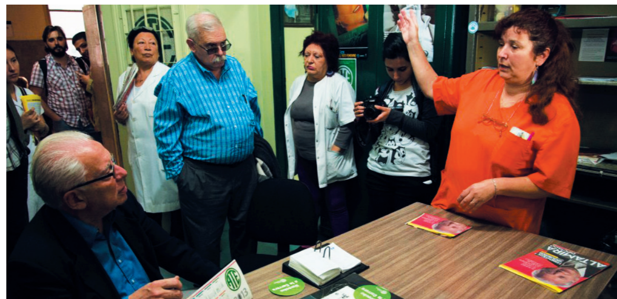
Altamira, en la sede de ATE del Hospital de Clínicas, en una de sus recorridas. La campaña puso de manifiesto un giro en el movimiento obrero.

En otro formato, asados de fábrica o de agrupación, se destacaron las reuniones ferroviarias y, especialmente, la de camioneros, que agrupó un número sin precedentes de compañeros. Se votaron agitaciones especiales en el folleto por la abolición del impuesto al salario que tuvieron gran recepción en los centros de recolección de la Capital. Una actividad de gran nivel político tuvo lugar con técnicos aeronáuticos de Apta, a la que asistieron también compañeros de APA y tercerizados, que duró más de tres horas y dio lugar a una serie de conclusiones de acción muy importantes.