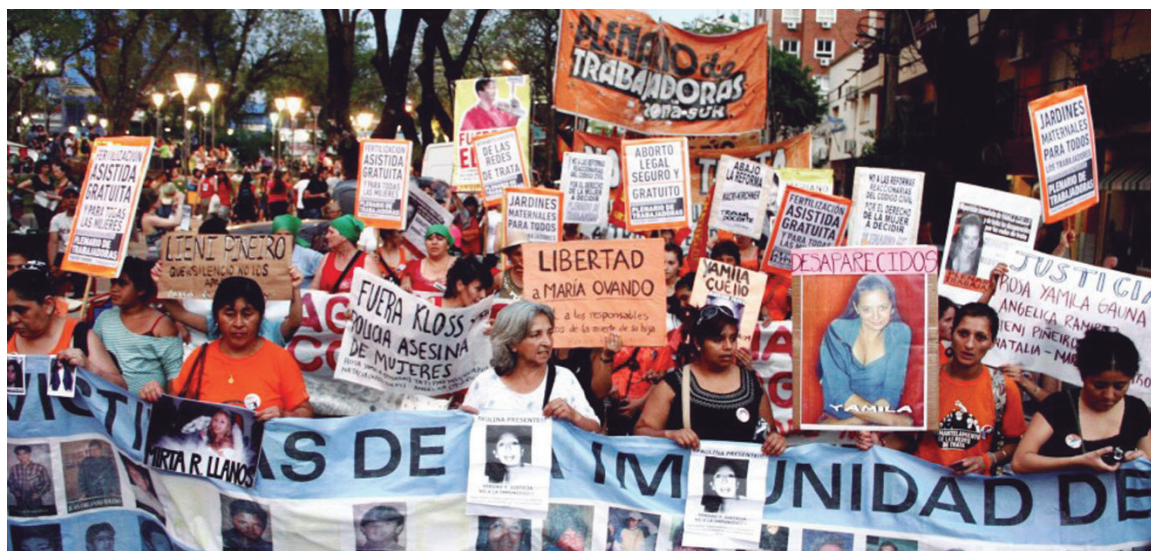
Marcha en el Encuentro Nacional de 2012, realizado en Tucumán.

El movimiento de mujeres necesita organizarse frente a los ataques cotidianos y contra aquellos que se profundizan en las etapas de ajuste.