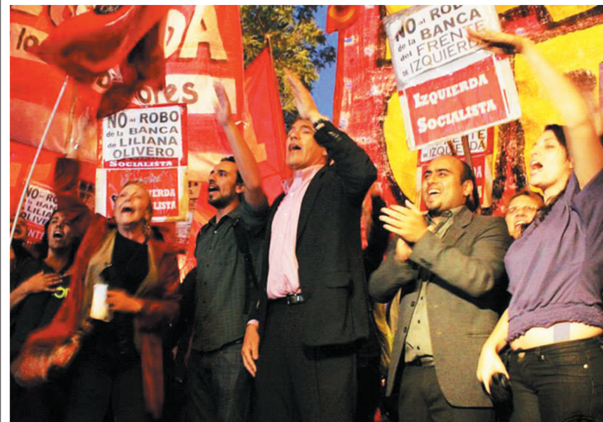
Movilización contra el fraude en Córdoba. Los radicales quieren la banca para votar impuestazos, el Frente de Izquierda la quiere para luchar contra los impuestazos y los ajustadores de todos los colores políticos.

La campaña contra el fraude que pretende quitarle al Frente de Izquierda la banca obtenida en las elecciones del pasado 27 comenzó rápidamente. El lunes 28, una masiva concentración bloqueó la céntrica esquina de Colón y General Paz, frente al Correo, donde se realizó el escrutinio provisorio. Allí una asamblea determinó una nueva movilización y una fuerte campaña de pronunciamientos. El jueves 31, cuando en los tribunales federales finalizaba el conteo de telegramas y actas, bajo una intensa lluvia más de 1.000 manifestantes marcharon hacia el lugar y realizamos un acto.