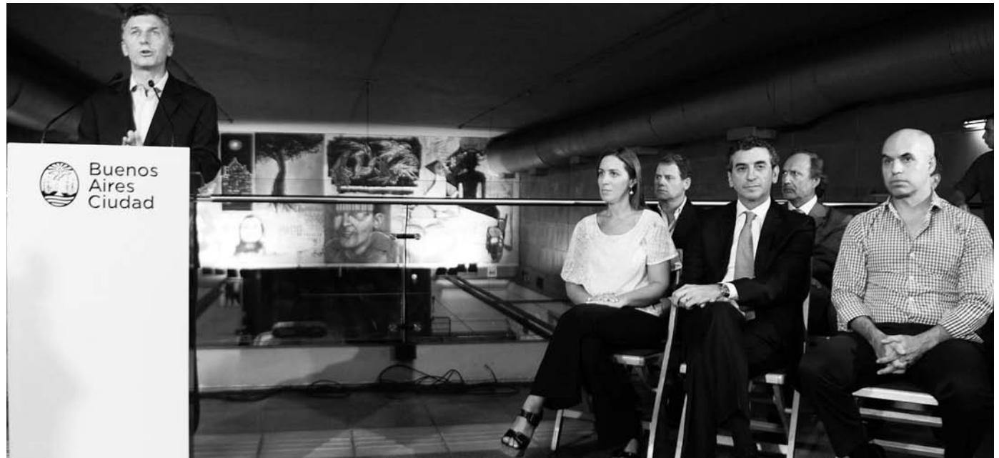
La Justicia porteña autorizó otro aumento en el subte. Durante una década, los K socorrieron a las privatizadas; ahora, fundidos, quieren prolongar el rescate con un tarifazo.

Pero el tarifazo es solamente un aspecto del 'ajuste' en ciernes. Lorenzino-Boudou han habilitado a una negociación que reúne a todos los fondos buitres -los que entraron en los canjes de deuda de 2005 y 2010, y aquéllos que no aceptaron reducir el valor de sus títulos. El resultado será nuevos pagos por deuda externa y un mayor endeudamiento en los mercados internacionales. Está claro que la garantía que el gobierno ofrece a la nueva deuda es la dolarización de las tarifas, como ya ha comenzado con los