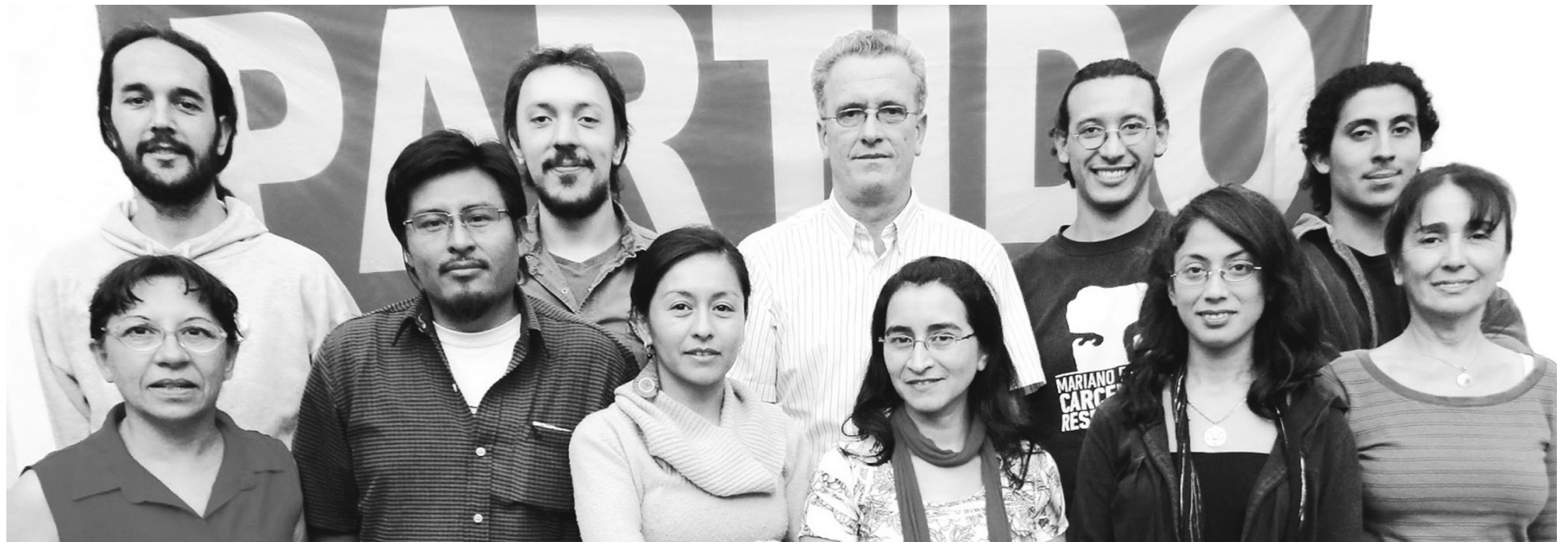
Candidatos del Partido Obrero de Salta. Mientras el crecimiento electoral de nuestro partido establece una concentración de fuerzas populares en un polo político definido, en el campo contrario reina la dispersión de las fuerzas capitalistas.

La tapa de nuestro periódico, "Una votación histórica", se aplica en especial a Salta. Otorga un respaldo político gigantesco a la lucha por la reorientación del movimiento obrero y poner fin a la regimentación estatal de los sindicatos que ejecuta la burocracia sindical. Es un paso enérgico para fusionar al movimiento obrero y la izquierda revolucionaria. Este es el sentido estratégico que impulsa la acción parlamentaria del PO. La disputa por la dirección de las organizaciones del movimiento obrero, la juventud y las masas debe apoyarse en esta perspectiva. En Salta, esta tarea se concentra en la necesidad de recuperar el sindicato docente, por un lado, y desarrollar una vanguardia sólida en el de los petroleros. La burocracia sindical docente que ha entregado su propia consigna de aumento del 30% por un aumento en cuotas del 25%, sólo para docentes con cierta antigüedad y cargos. Debemos abrir una discusión sobre el método adecuado para poner fin a la burocracia de la Asociación Docente Provincial (ADP). Lo reclaman las decenas de miles de votos al Partido Obrero a lo largo de toda la provincia.