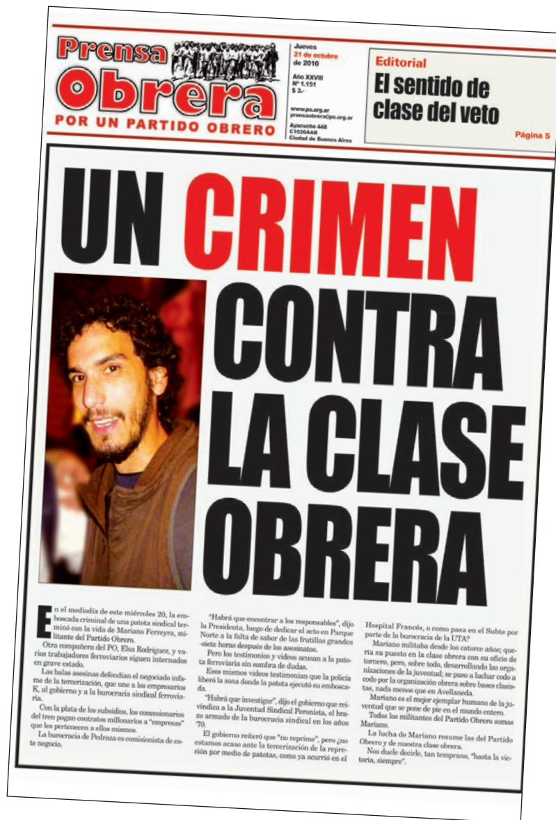
Tapa de Prensa Obrera N° 1.151, publicada el 21 de octubre de 2010, al día siguiente del asesinato de Mariano.

El kirchnerismo nunca rompió políticamente con la burocracia de la Unión Ferroviaria, a la cual continuó aliado hasta el