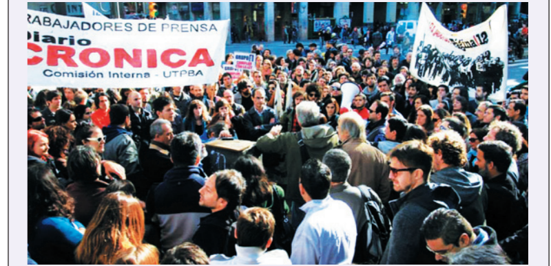
Movilización del gremio de prensa. Un sector de la burocracia plantea una 'democratización' para neutralizar el proceso de lucha en curso por una nueva dirección en el movimiento obrero.

La crisis de la burocracia sindical (que alcanzó un punto explosivo con el asesinato de nuestro compañero Mariano Ferreyra y su atomización, al ritmo de las fracturas del PJ, ha instalado en la agenda política la cuestión del régimen de los sindicatos. El ascenso del activismo en empresas y sindicatos ha sido uno de los factores principales de esta crisis. Varias decisiones de la Corte Suprema, las que reconocen la capacidad de representación colectiva a los sindicatos simplemente inscriptos, han convencido a la burocracia de que el viejo régimen ha entrado en contradicción con los trabajadores y con el régimen político. Por eso, han comenzado a pronunciarse en favor de cambios parciales, que les permitan conservar el monopolio de las organizaciones. También dio lugar a que Massa y el moyanismo hayan comenzado a plantear "democratizar algunos aspectos" y "perfeccionar el modelo sindical". Facundo Moyano anunció un proyecto de ley para "terminar con la reelección indefinida y algunos aspectos de los estatutos que impiden la presentación de listas opositoras". Ante los respingos de Caló, Facundo tuiteó que "la falta de democracia obliga a algunos laborantes a crear sindicatos paralelos en vez de disputar internamente".