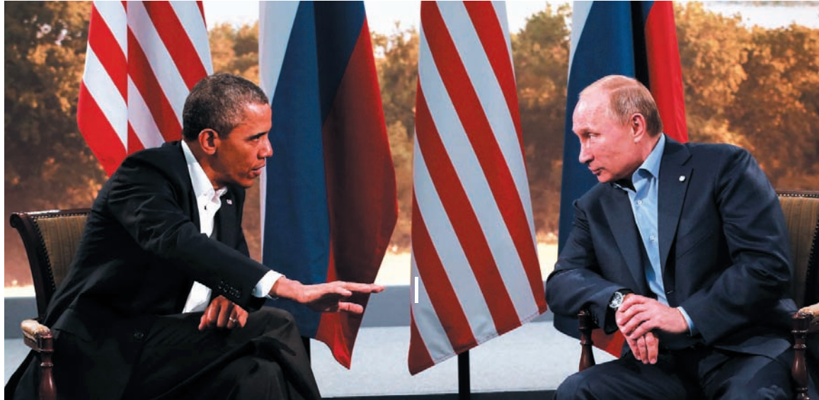
Barack Obama y Vladimir Putin. No sólo se trata de deponer a Al Assad y su camarilla, sino también poner un fin a las revoluciones árabes.

El pacto se inscribe en un compromiso político de orden más general. El anunciado propósito de realizar una conferencia de paz en Siria apunta a una transición controlada. El núcleo de este pacto fue acordado en secreto por Obama y Putin en la reciente reunión del Grupo de los 20, en Moscú, y luego presentado en cuotas a la opinión pública, como si se tratara de una aproximación espontánea. La amenaza de un ataque militar a Siria fue acordada en esa reunión, en carácter de ultimátum al régimen de Al Assad. El desmantelamiento del arsenal químico de Siria es la cobertura 'humanitaria' de un cambio de poder en Siria. Rusia y China repiten, con demora y con un cuidado mayor, la política de adaptación a la Otan, que desplegaron a su propia costa en la agresión a Libia. El plan en marcha procura una salida semejante a la que se implementó en Yemen. La escalada militar apuntó a quebrar un largo impasse y forzar una salida política tutelada.