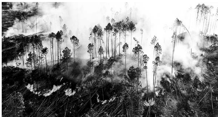
Más de 25 hectáreas arrasadas por el fuego. El gobierno resguarda los intereses de los capitalistas y no los de la población trabajadora.

Con los incendios salió a la luz que Córdoba no tiene de dónde sacar agua para sofocarlos. La población de las sierras y de otras localidades viene reclamando desde hace mucho en contra de la deforestación impulsada por los capitalistas del agro y los especuladores inmobiliarios, que cuentan con el aval del gobierno provincial