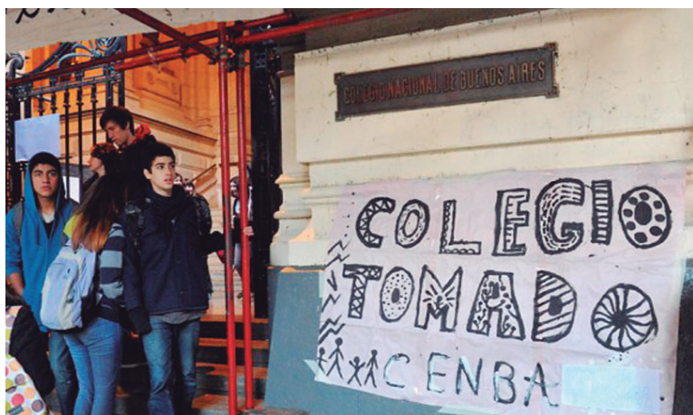
Ya son siete los colegios tomados.

Al cierre de esta edición, el Mariano Acosta y el Normal 1 se encuentran tomados, mientras en decenas de colegios más las asambleas estudiantiles debaten la posibilidad de generalizar las tomas. Desde 2012, los secundarios vienen movilizándose en rechazo a la reforma PRO-K. Las tomas son la reacción natural de los estudiantes frente a la falta de respuestas por parte del gobierno. Pero además, son la respuesta a una grosera maniobra gubernamental contra los estudiantes. En el marco de la oposición creciente a la llamada "Nueva escuela secundaria" (NES), el gobierno se había comprometido ante el movimiento estudiantil y docente a postergar su aplicación a 2014. Desconociendo este acuerdo, siguieron impulsando la reforma a través de las autoridades de los colegios, bajo la forma de 'colegios pilotos'. De esta manera, pretenden convertir la pelea por la reforma en un debate