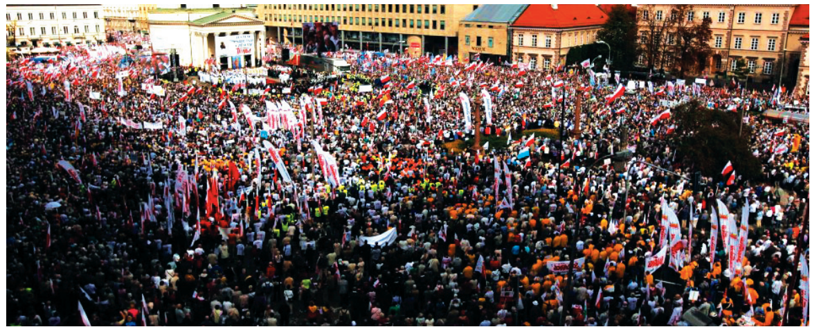
Histórica movilización de los obreros polacos contra los planes de ajuste.

Polonia, con 38 millones de habitantes, es la economía más importante de Europa central. En el primer trimestre de este año rozó la recesión, con un crecimiento de apenas el 0,4 por ciento respecto