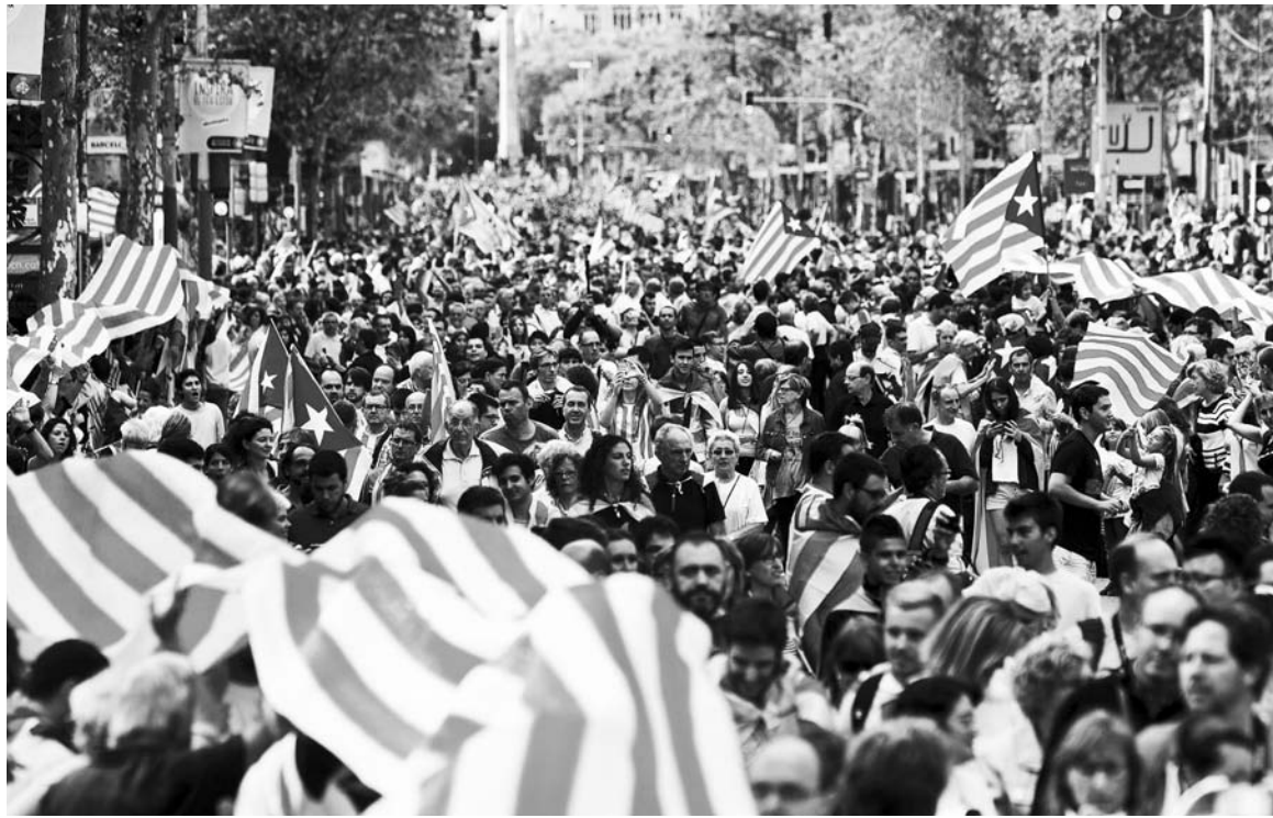
Una "cadena humana" de medio millón de personas. La crisis expresa el agotamiento sufrido por la aclamada "España de las autonomías", como consecuencia del derrumbe capitalista, ahora se trata de determinar quién paga con el costo de los ajustes y recortes.

La Asamblea Nacional Catalana, organizadora de la protesta, reclamó que el referéndum por la independencia se realice en 2014 y que tenga "una pregunta clara". Según El País , la ANC "quiso dar un paso adelante para dejar claro que no sólo defienden la opción del 'derecho a decidir' sino que abo-