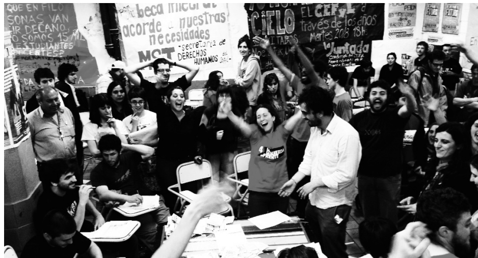
Festejo en uno de los triunfos de la izquierda en la UBA. El agotamiento del kirchnerismo abrió un proceso de transición política, el cual adquiere un sentido progresivo con el ascenso de la izquierda.

Otro mojón de la izquierda fue la gran elección de la Lista Naranja en