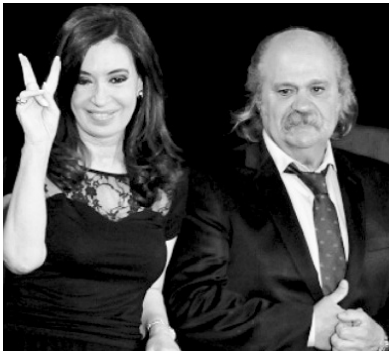
Cristina Kirchner y Alejandro Granados. Un giro represivo en regla.

No hay ninguna posibilidad de que el quebrado Estado provincial financie el salto de 58 a 100 mil hombres de la Bonaerense. En verdad, existe un ejército privado que eleva los efectivos a esa