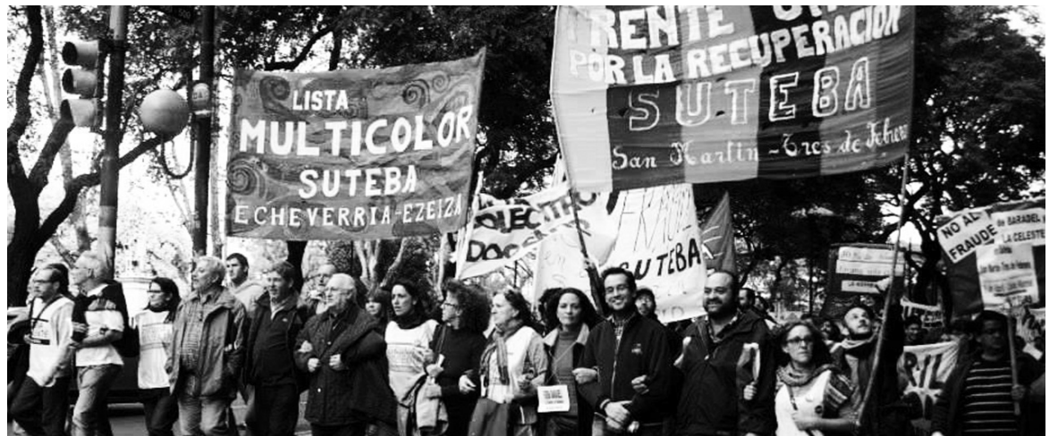
La lista Multicolor. El avance de la oposición clasista en el gremio docente, parte del proceso de los triunfos de la izquierda en sindicatos, cuerpos de delegados y en las recientes elecciones de la UBA, y en el progreso del Frente de Izquierda entre los jóvenes y los trabajadores.

La Multicolor arrasó en todos los sindicatos recuperados por márgenes abultadísimos. Se consiguió desde el 60 hasta el 80% de los votos en Aten, Adosac, Sutef, Amsafe-Rosario, los Suteba de Ensenada, La Plata, Marcos Paz, Berazategui, Quilmes, Tigre, Bahía Blanca, Escobar y La Matanza. Hubo grandes votaciones, que incluyen triunfos en seccionales enteras, en Mendoza, Chubut, Entre Ríos (la burocracia ganó por apenas dos centenares de votos) y Río Negro (en esta última provincia prácticamente hubo un empate entre la Celeste y la Multi). La elección de Ctera no sólo ratificó a las nuevas direcciones recuperadas. Abrió, además, un curso de recuperación en varios sindicatos provinciales y decenas de seccionales en todo el país. En el caso de Río Negro, la existencia de la Multicolor es una experiencia novedosa,