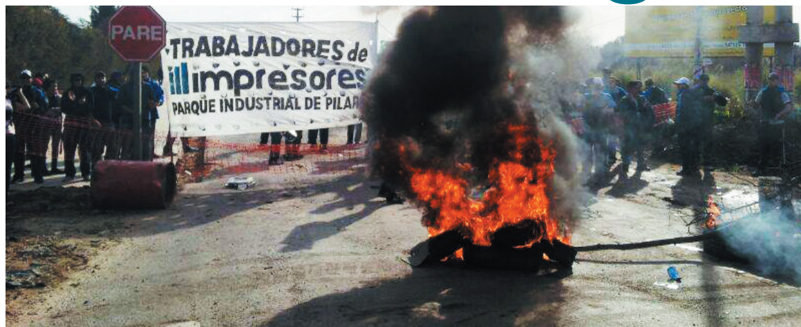
Piquete en el Parque Industrial Pilar. Los gráficos de Impresores, en la vanguardia de la clase obrera de Argentina.

Las huelgas, afirmaba Lenin, son "escuelas" de lucha de clases en las que los trabajadores toman conciencia de su poder y de su antagonismo con los capitalistas, las leyes, la policía y el gobierno.