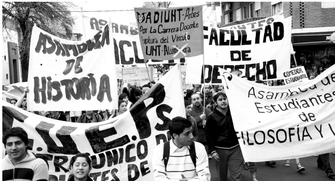
Movilización de los universitarios tucumanos. La irrupción combativa del movimiento estudiantil, al que ahora se suma la docencia, es una reacción al derrumbe y ajuste educativo, pero también a la profunda descomposición del Estado provincial.

funcionamiento una asamblea interfacultades, con reuniones masivas, desde la cual se está coordinando el plan de lucha.