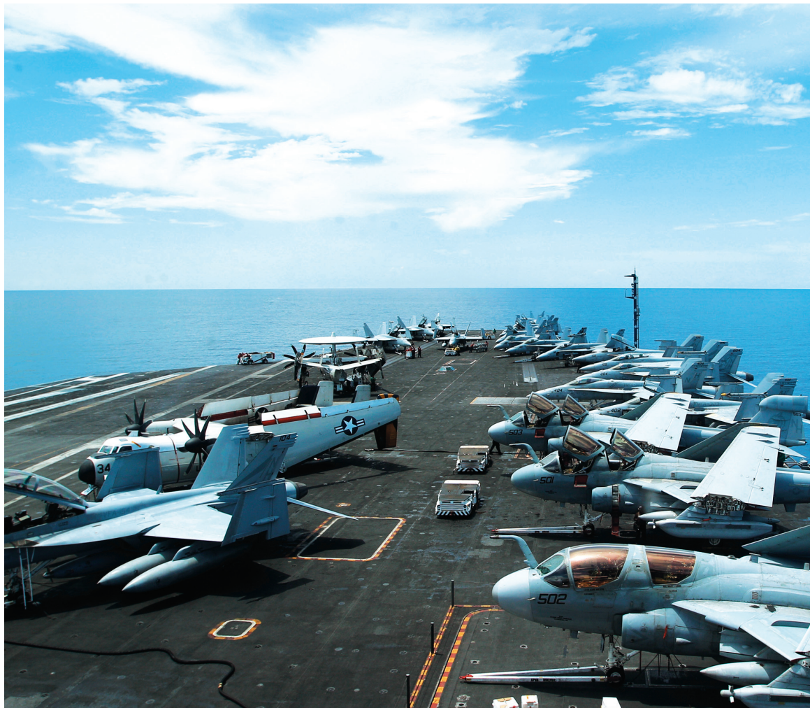
Portaaviones norteamericano, preparado para entrar en acción. Llamamos a la clase obrera, los campesinos pobres, la juventud y los pueblos oprimidos de la región y a nivel internacional a movilizarse ante este nuevo crimen en contra de los pueblos árabes y contra la humanidad.

Los planes de guerra imperialistas del gobierno de Obama, apoyados abiertamente por el primer ministro británico Cameron, por el presidente social-demócrata Ho-