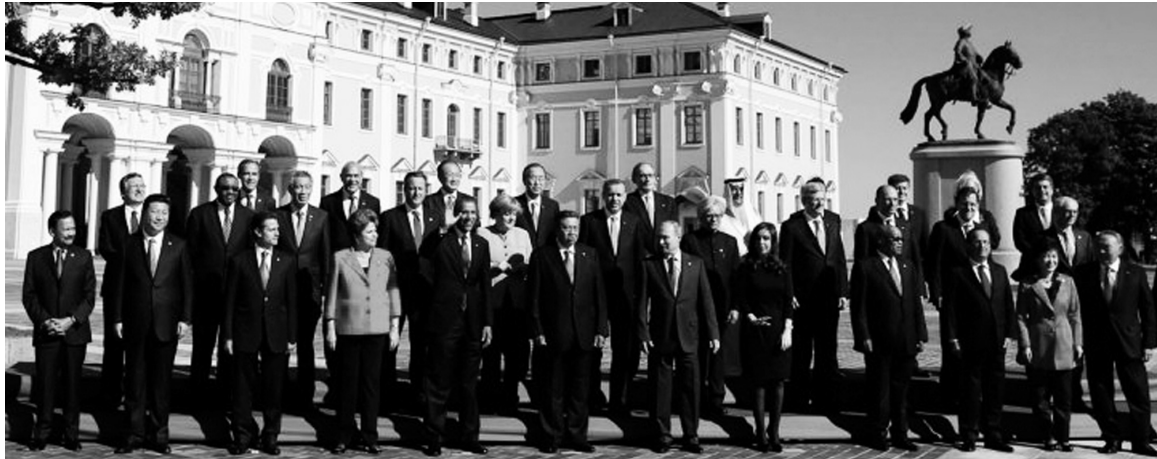
La "foto de familia" del Grupo de los 20. Presentada como la "cumbre de la producción y el empleo", la reunión de presidentes sólo aportó un relato dirigido a encubrir la política de trasladar a las masas la bancarrota del capital.

En otra expresión de imposura, la declaración del G20 "advierte sobre los riesgos que generan las guaridas fiscales". Pero en este punto, es bueno recordar cuando Wikileaks reveló las operaciones con bancos "extraterritoriales" de ministros del gobierno francés, de allegados al gabinete ruso, banqueros de Wall Street y grandes capitalistas europeos, entre otros. La mitad de las operaciones de la bolsa de Londres se maneja con fondos que provienen del dinero sucio. Es cierto que los Estados capitalistas recelan del vaciamiento fiscal que produce la creciente clandestinización de las finanzas. Pero al mismo tiempo, la gran banca depende como nunca de estos fondos sucios, que han concurrido a su rescate y le aportaron liquidez en los momentos más agudos de la crisis. La proliferación de "paraísos" revela la existencia de una masa gigantesca de capital 'en espera', cuya repatriación -o "blanqueo"- está condicionada a las oportunidades de lucrar con la crisis y la desvalorización de activos. La "preocupación" del G20, en este punto,