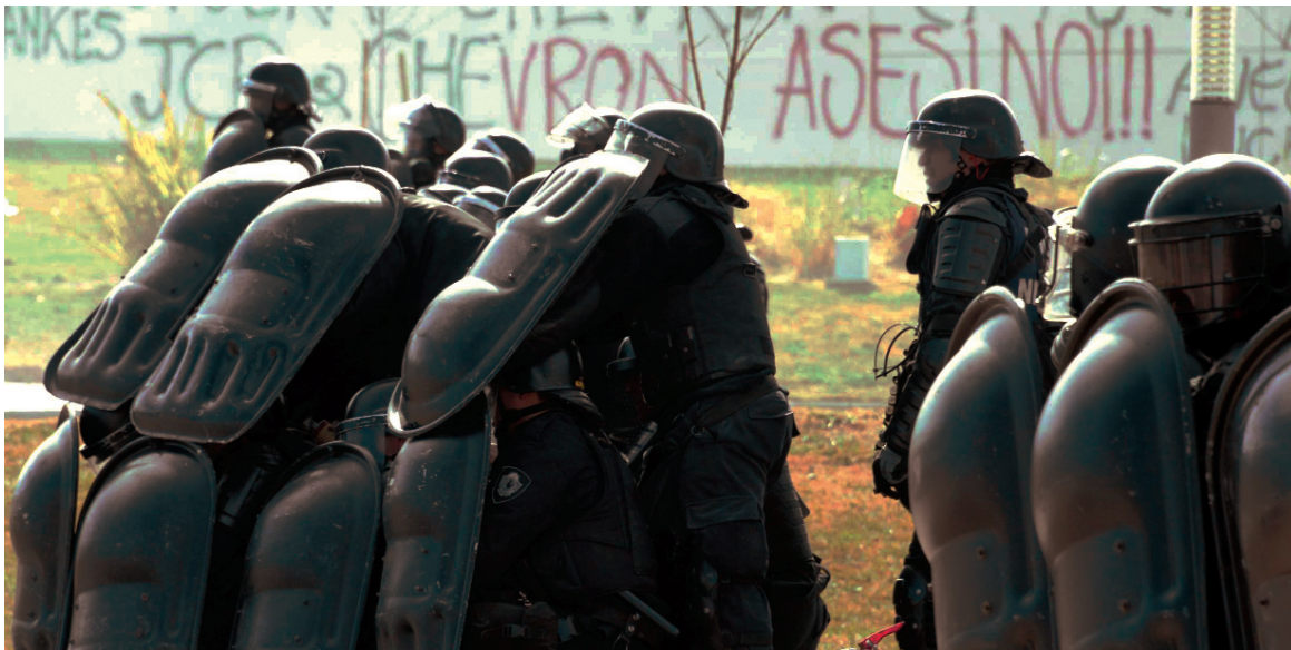
Represión frente a la Legislatura de Neuquén. Miles de trabajadores y jóvenes repudiaron el acuerdo entreguista entre Chevron e YPF.

Gran movilización popular y un nuevo paro provincial