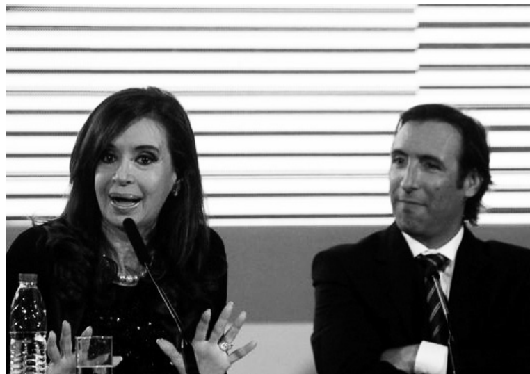
Cristina Kirchner y Hernán Lorenzino. La decisión oficial implica un nuevo aumento en la carga de la deuda externa -ello, después de haber pagado 175.000 millones de dólares.

Cristina Kirchner anunció que enviará al parlamento la derogación de la ley cerrojo. Pero no ocurre lo mismo con las condiciones