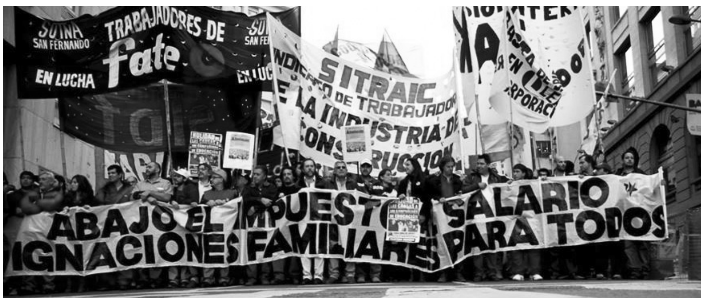
Movilización del Plenario convocado por el Sutna San Fernando. Aprovechemos el recule oficial para profundizar el debate político en el movimiento obrero y la lucha por el objetivo de anular el impuesto, que -ya aprendimos- vuelve de la mano de la inflación cualquiera sea su actualización.

Piumato se apuró a declarar "el triunfo de la CGT" moyanista. Pero es al revés: las centrales sindicales depusieron toda lucha desde aquel leja-