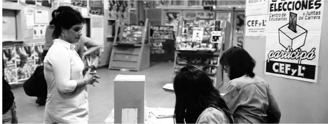
Votación en UBA. Combatimos por derrotar a las camarillas kirchneristas y radicales que someten la educación a los designios del capital.

En Farmacia, por otro lado, se encuentra a la agrupación Antídoto (UJS más independientes), que tiene el desafío de defender la gran votación del año pasado, lo cual le permitiría profundizar desde el Cefyb y el Consejo la organización para pelear contra la política de la camari-