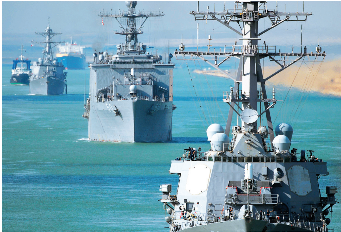
Se aceleran los preparativos para una intervención militar de Estados Unidos. La lucha por poner fin a dictaduras feroces, como la de Al Assad, sólo puede tener un desenlace favorable en el marco de una movilización independiente, de los explotados sirios y del mundo árabe.

El ataque abriría numerosas incertidumbres militares y políticas. Pero Obama parece preferir ese