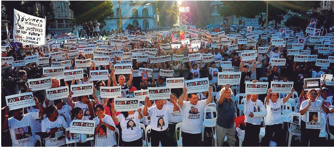
Movilización por las víctimas de la Estación Once. Por la reestatización del ferrocarril Sarmiento bajo control de los trabajadores y usuarios; por el juicio y castigo para todos los responsables políticos de las masacres ferroviarias.

Con los ferroviarios del Sarmiento y los familiares de Once