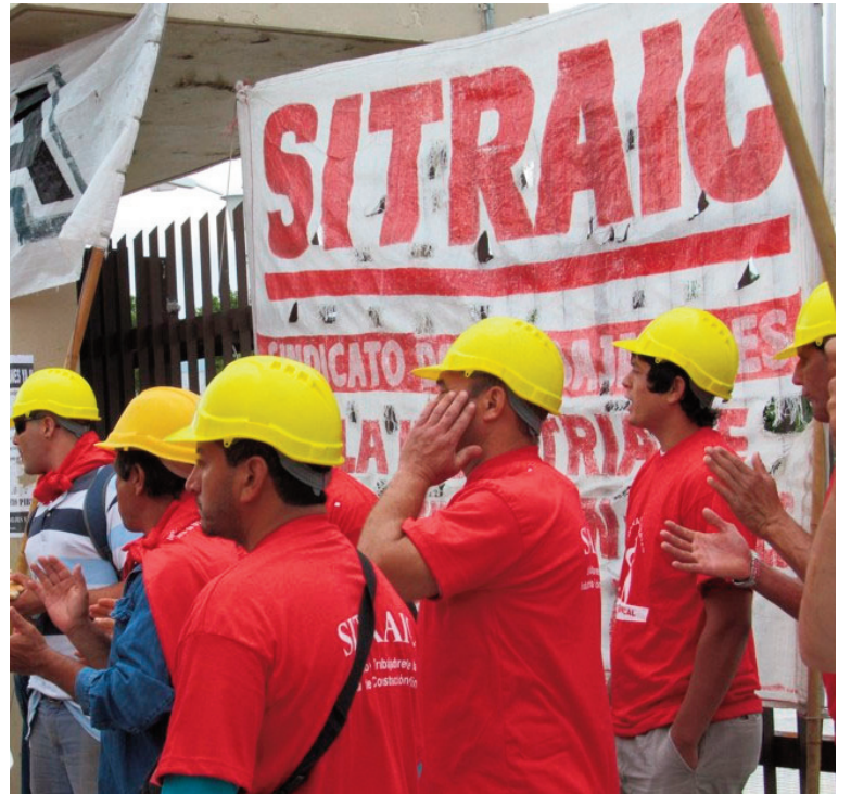
Asamblea del Sitraic. Comienza una nueva etapa para los trabajadores de la construcción.

Deberá, además, luchar por quebrar el actual régimen jubilatorio de los trabajadores de la construcción. El Frente de Izquierda impulsará en el Congreso un proyecto de jubilación de los trabajadores de la construcción con 25 años de aportes, sin pasar por la infamia de los 300 meses -que no permite nunca jubilarse a los 55 años-, garantizan-