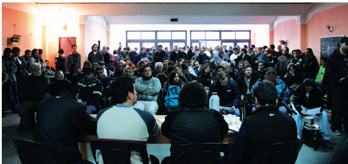
El plenario obrero en Sutna San Fernando resolvió una nueva acción de lucha. Por la abolición del impuesto al salario, la restitución de las asignaciones familiares y contra la precarización laboral.

El plenario comenzó con un informe de los miembros de la junta ejecutiva del Sutna San Fernando, sobre el alcance de la campaña contra el impuesto, las juntadas de firmas, las asambleas que se pronunciaron, la resolución de un plenario de judiciales que aprobó la consigna y las luchas que se han establecido, como es el caso del paro impuesto por los camioneros al propio Moyano o el paro portuario. Tam-