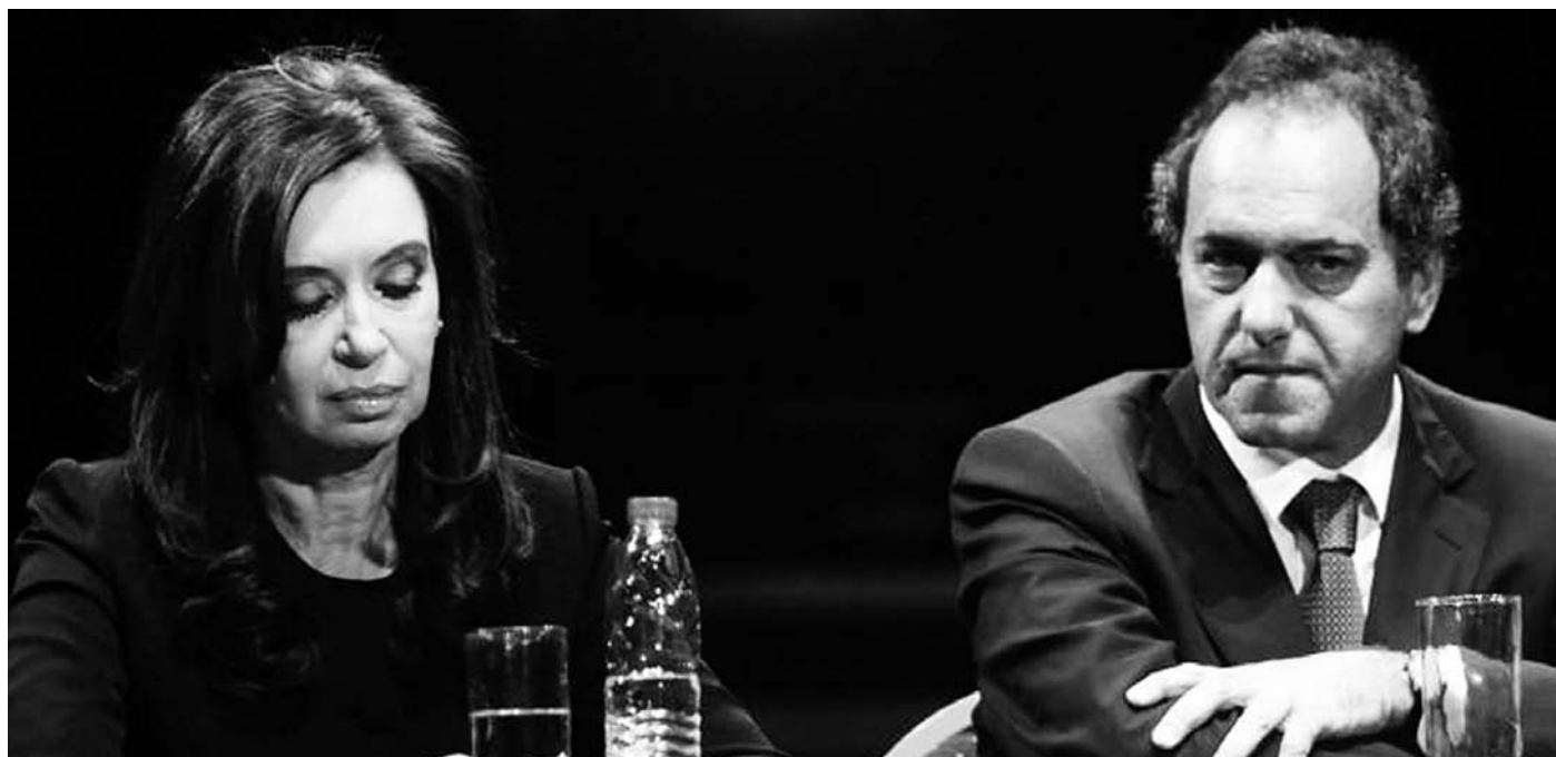
Cristina Kirchner y Daniel Scioli, otro derrotado en las Paso. La crisis política del momento se caracteriza por el descontento de todas las clases sociales.

La semana que siguió a las elecciones se caracterizó por las posiciones de ruptura de las patronales con el gobierno y también por las declaraciones encontradas de los K (ver "Adónde va el kirchnerismo"). En ese marco, las denuncias de Lanata acerca de una extraña estadía de CFK en el paraíso fiscal de Seychelles, en enero de este año, sirvió para abroquelar a la nube K -que es precisamente lo que buscan los 'opositores' para asestar un golpe definitivo al oficialismo en las elecciones de octubre. No se entiende, sin embargo, que los K se sigan desgarrando las vestiduras en favor de una imposible 'honestidad' K, luego de los años que han pasado sin que los Kirchner digan qué ocurrió con los fondos de la privatización de YPF, en 1992/94, de más de mil millones de dólares. El oficialismo tampoco desmiente la red de empresas truchas de sus secuaces que se alojan en los paraísos fiscales. La disputa gira apenas en torno al tiempo que duró la permanencia de la Presidenta en las islas Seychelles. Por último, el al-