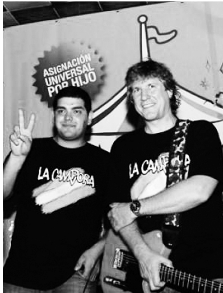
Amado Boudou y La Cámpora. La tendencia a la disolución del kirchnerismo ha abierto una transición política formidable en medio de un derrumbe financiero.

Para los intendentes del peronismo, la derrota obedece a 'la inseguridad'. Está calcado del discurso de Massa. De acuerdo con varias encuestas, los Curto y Othacehé se pasarían a las filas del intendente de Tigre, como último recurso para salvar las mayorías en los concejos y de cara a 2015. Antes, claro, deberán renegociar la propuesta de Massa de impedir la reelección permanente de los intendentes, o que entre en vigencia después de las generales dentro de dos