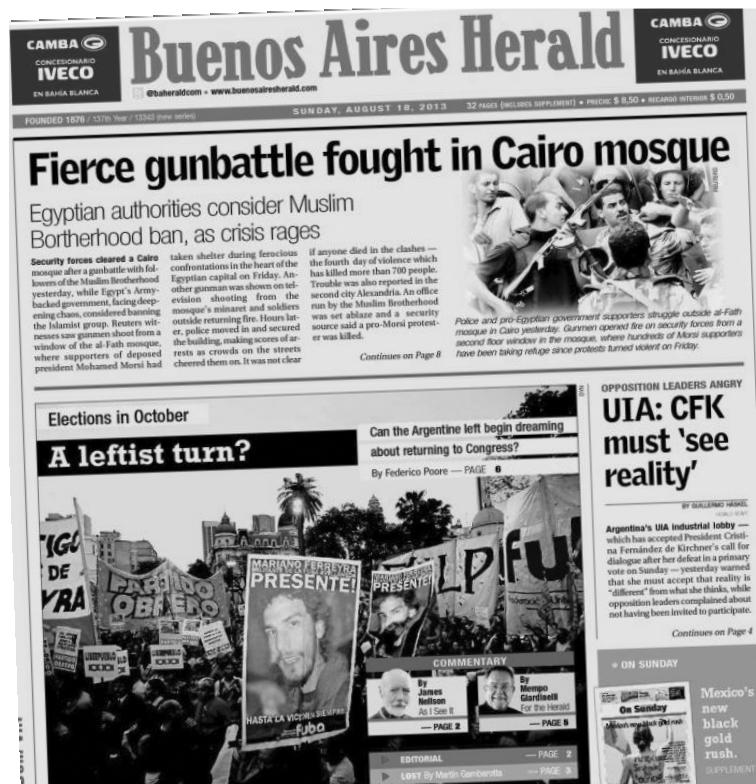
La gran votación del Frente de Izquierda reflejada en la tapa del Buenos Aires Herald (18/8)

Este gran resultado no sólo importa para Argentina, sino también para los marxistas revolucionarios de todo el mundo: es la demostración -contra todos los tipos de oportunismo que van del reformismo “realista” al movimientismo contrario a todo tipo de organización leninista- de la posibilidad y de la necesidad, a través de la combinación de la situación objetiva y de una auténtica política revolucionaria, de conquistar un amplio apoyo de las masas por parte de una fuerza marxista auténticamente revolucionaria y trotskista. En este sentido, consideramos el resultado obtenido por el FIT en las elecciones como parte de la lucha cotidiana, cuya importancia es fundamental para la refundación de la Cuarta Internacional.