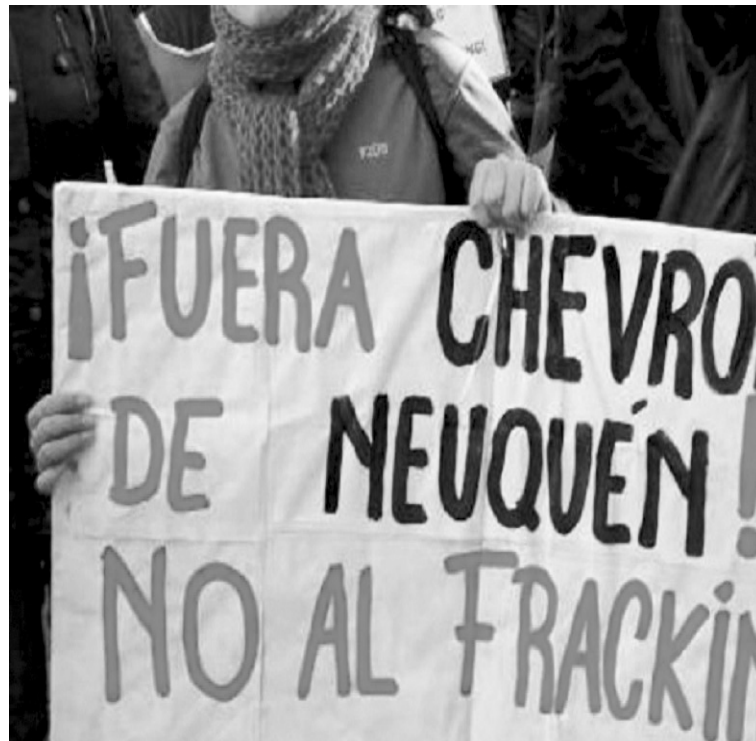
Paro y movilización. Aten, el sindicato de los docentes neuquinos, ha llamado a realizar una gran huelga provincial contra la política de saqueo de los K, el MPN y la 'oposición' patronal.