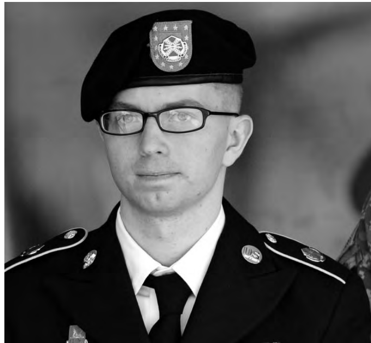
Bradley Manning. El soldado norteamericano está siendo juzgado por las filtraciones que permitieron a WikiLeaks denunciar crímenes de guerra del gobierno yanqui.

cia en traición a la patria. Utilizada en sólo tres ocasiones en noventa años, Obama la ha aplicado en seis en menos de una década. El caso más reciente, antes de Bradley, fue el del ex agente de la CIA John Kirioku, enviado a prisión por divulgar los métodos siniestros utilizados durante los interrogatorios a los acusados de terrorismo. No es sólo un problema de cantidad. Obama innova al aplicar la ley de espionaje a cualquiera que filtre información confidencial, no importa cuál sea el motivo por el que lo haga. Esto puede hacer que "las filtraciones sean cada vez más dramáticas" porque "los únicos que estarían dispuestos a asumir ese riesgo son gente que esté en una cruzada personal" (Goiten, Centro Brennan de Justicia, Ambito , 1º/8). Es una innovación que va más allá de la Constitución de Estados Unidos (cuarta enmienda, libertad de expresión) y de la tradición. Históricamente, el Estado ha protegido a los denunciantes que revelan las conspiraciones de las corporaciones o de la burocracia del Estado "contra la democracia" o "contra el pueblo". Uno de los futuros acusados podría ser Julián Assange, de WikiLeaks. Esto supondría acusar de espía a alguien que se dedica a publicar información de otras fuentes, "algo completamente sin precedentes y que pondría a cualquier periodista decente de seguridad nacional en Estados Unidos en el riesgo de ir a la cárcel" (Tim, Fundación para la Libertad de la Prensa, Washington Post , 31/7).