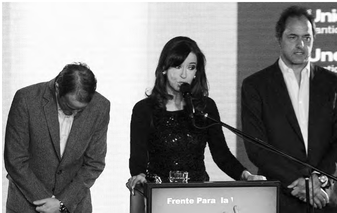
Martín Insaurralde, Cristina Kirchner, Daniel Scioli, la noche de la derrota.

En estas condiciones, para llegar a 2015, el kirchnerismo dependerá del apuntalamiento que le presten sus propios opositores, los cuales no quieren apresurar la salida del gobierno, salvo que se precipiten hechos excepcionales -como, por ejemplo, un defol. Todas las fracciones patronales necesitan darse el tiempo de una transición para ajustar las clavijas de la crisis. Es una probabilidad