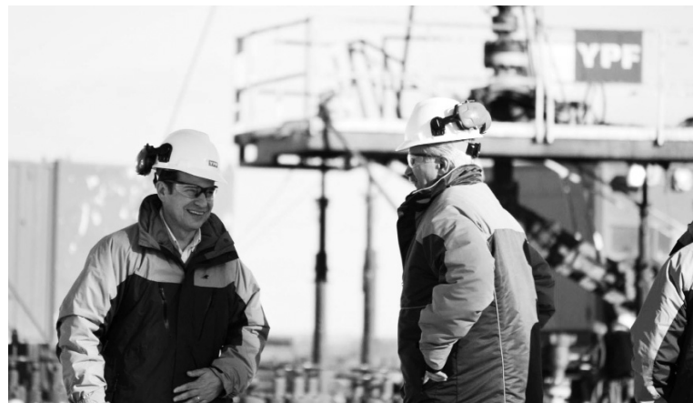
Miguel Galuccio, el CEO de YPF, y Ali Moshiri, de Chevron.

Las petroleras tendrán libertad para exportar el 20% de su producción, ¿y el 80 restante? Chevron y el resto esperan que se consume una devaluación y un "sinceramiento" de tarifas. En esa línea, el gobierno comenzará a pagar 7,50 dólares por millón de BTU -tres