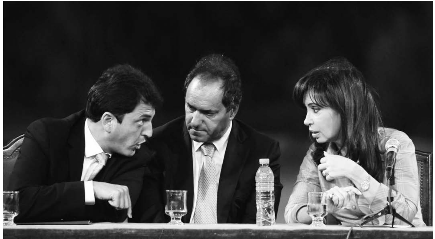
Sergio Massa, Daniel Scioli y Cristina Fernández de Kirchner.

bramiento del agente de inteligencia y represor Milani al frente del Ejército. La integración de las Fuerzas Armadas al régimen político -que el kirchnerismo quiere viabilizar a través de un alto mando propio- es un objetivo que acariciaron durante décadas los gobiernos que sucedieron a la dictadura. Ahí tenemos al punto final y la obediencia debida, los indultos y los llamados a la "reconciliación" que, alternativamente, levantaron Duhalde, De la Sota y otros. Como en todos esos casos, el gobierno de los "derechos humanos" quiere tramitar la integración de las Fuerzas Armadas al Estado a cambio de su impunidad y de devolverles un protagonismo político. Para ello, se ha empeñado hasta lo imposible en ocultar los antecedentes represivos de Milani y sigue dispuesto a sostener al represor, aun cuando esos antecedentes han salido a la luz.