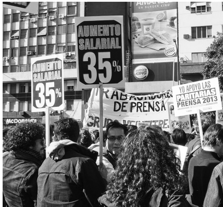
Movilización de los trabajadores de prensa.

El aumento del salario mínimo repercutirá en una franja mínima de trabajadores, ya que no afectará a la mayoría de los que se encuadran en convenios colectivos ni a los que figuran como "monotributistas", ni a más del 32% -que según el propio gobierno sigue "en negro". Si consideramos que la CGT y la CTA "opositoras" plantearon un salario neto de 4.000 pesos (bruto de