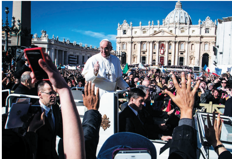
El Papa Francisco.

Contra tanto barullo en torno a las palabras de Don Francesco, importa registrar que nunca aludieron tampoco a los problemas que plantean los sectores críticos de la propia Iglesia: ninguna mención a un relajamiento de las posturas ultramontanas sobre el aborto, el matrimonio igualitario, la opresión de la mujer... Más significativo: si algún sector de la juventud efectivamente movilizaba en Brasil en el último tiempo esperaba alguna referencia a la protesta popular, la espera terminó en nada. Al revés, en el opaco lenguaje de las homilias Francesco introdujo una mención que criticaba la "protesta violenta" y le oponía el "diálogo cons-