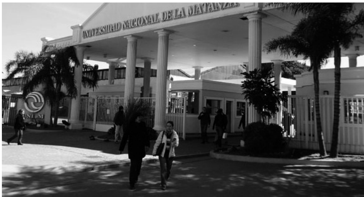
Entrada de la Universidad Nacional de La Matanza.

Se desmiente, además, la supuesta "democratización educativa" que postula el gobierno K por la creación de nuevas universidades. En realidad, también esta es una política copiada de Menem,