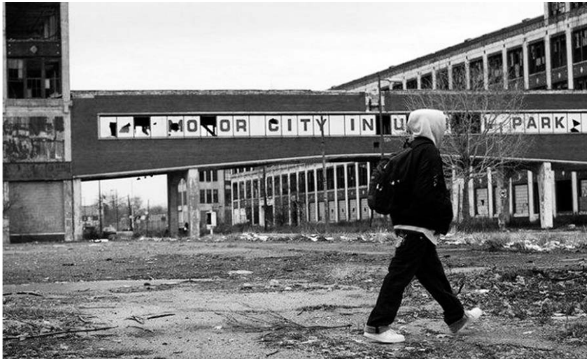
La ciudad emblema de la industria automotriz en caída libre, pero es sólo la punta del iceberg.

Después de haber destinado centenares de miles de millones de dólares a rescatar a los capitalistas -incluyendo las automotrices con sede en Detroit- el gobierno ha dejado en claro que no va a ayudar a la ciudad, endeudada tanto con bancos y fondos tenedores de bonos, como con fondos de pensión. Pero la vara no es la misma para unos y otros. En el primer caso, un acuerdo con UBS, Bank of America y Merrill Lynch les garantiza el pago de 75 centavos por dólar adeudado. En cambio, el plan de quiebra prevé que los fondos de los jubilados reciban sólo 10 centavos; a su vez, los ajustes por costo de vida serán eliminados, y se congelarán los pagos futuros de pensiones. Los trabajadores verán recortados sus ingresos y se harán nuevos ajustes en los gastos estatales