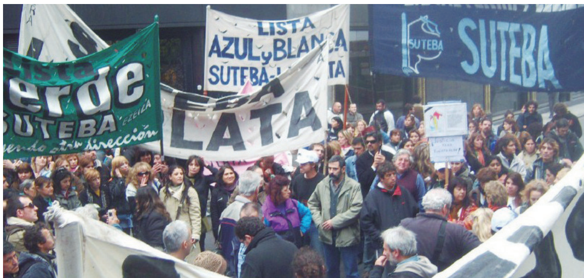
Movilización de las seccionales combativas de Suteba.

Detrás de un programa de independencia de los trabajadores y de sus organizaciones gremiales del gobierno nacional y de las provincias, de la burocracia sindical yaskista y de toda variante burocrática, de defensa de la democracia sindical, y como organización de lucha de los docentes y de todos los trabajadores, el en-