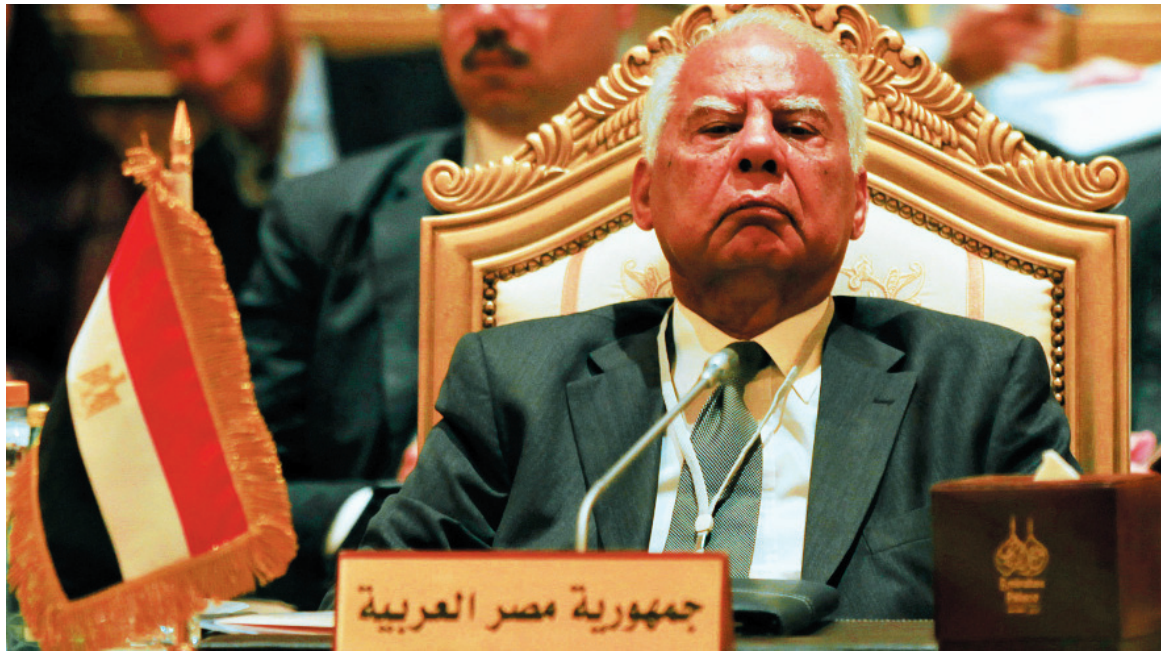
Hazem al-Beblawi, primer ministro interino.

Al Nur "mantiene una postura ambivalente frente al nuevo proceso político. Su propuesta para resolver la crisis actual se basa en