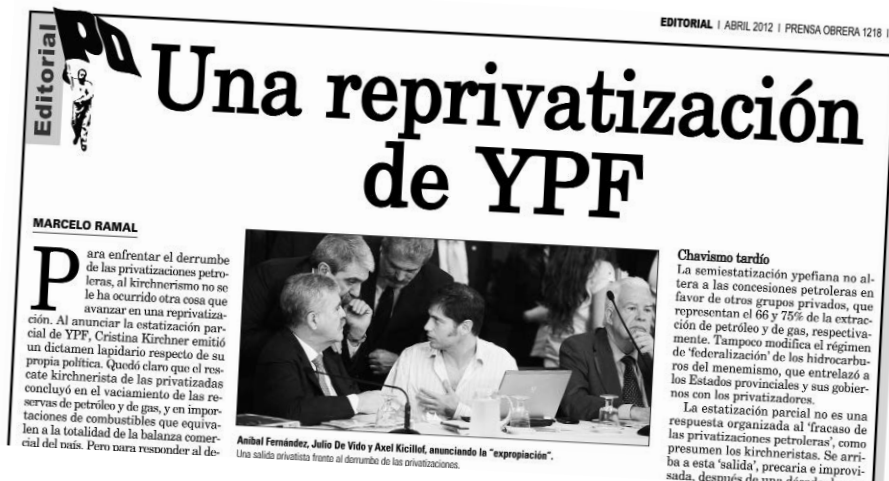
Editorial de Prensa Obrera 1218, 19 de abril de 2012.