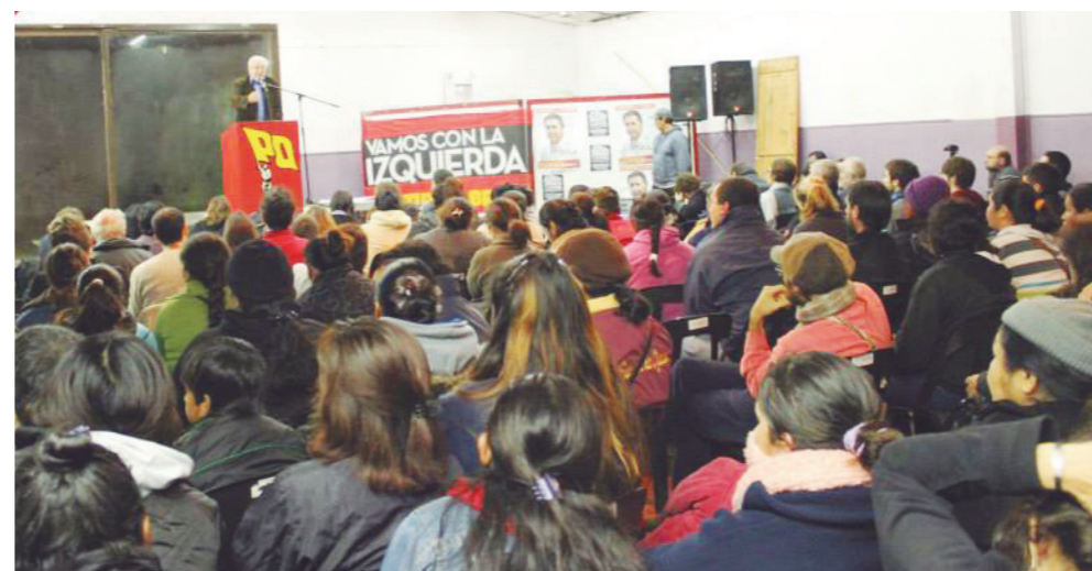
Acto del PO de La Plata. Un desarrollo sin precedentes de la izquierda revolucionaria en la provincia de Buenos Aires.