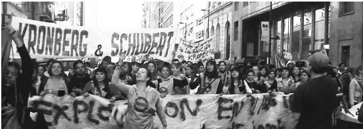
Las obreras de Kromberg & Schubert. El paro, los cortes y manifestaciones serán clave para arrancar la victoria.

Frente a esta situación, se votó un paro de 48 horas, bloqueando la puerta de la fábrica. La policía, con orden de la fiscalía lo-