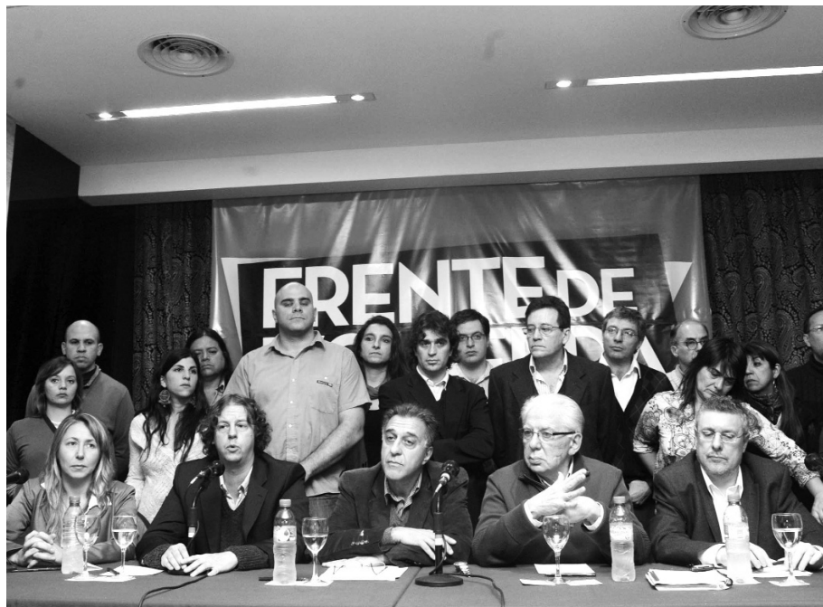
Presentación de los candidatos del frente.

Las encuestas vienen a confirmar uno de los hechos políticos más nota-