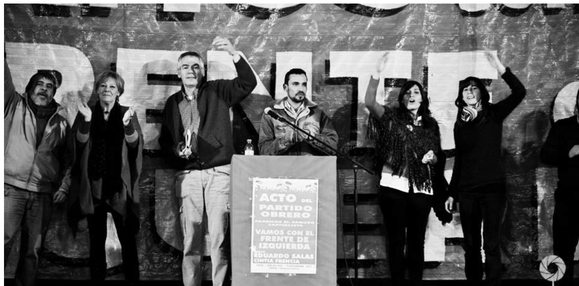
Los candidatos de Córdoba. Nuestro desafío es superar la votación de hace dos años y colocarnos firmemente como una alternativa política para la masa de los trabajadores.

tas, una del PRO y otra de los Rodríguez Saá con Cavallo a la cabeza. A esto se suma la presentación de Olga Riutort (la ex mujer de De la Sota) que viene superando por fuera al PJ en la Capital.