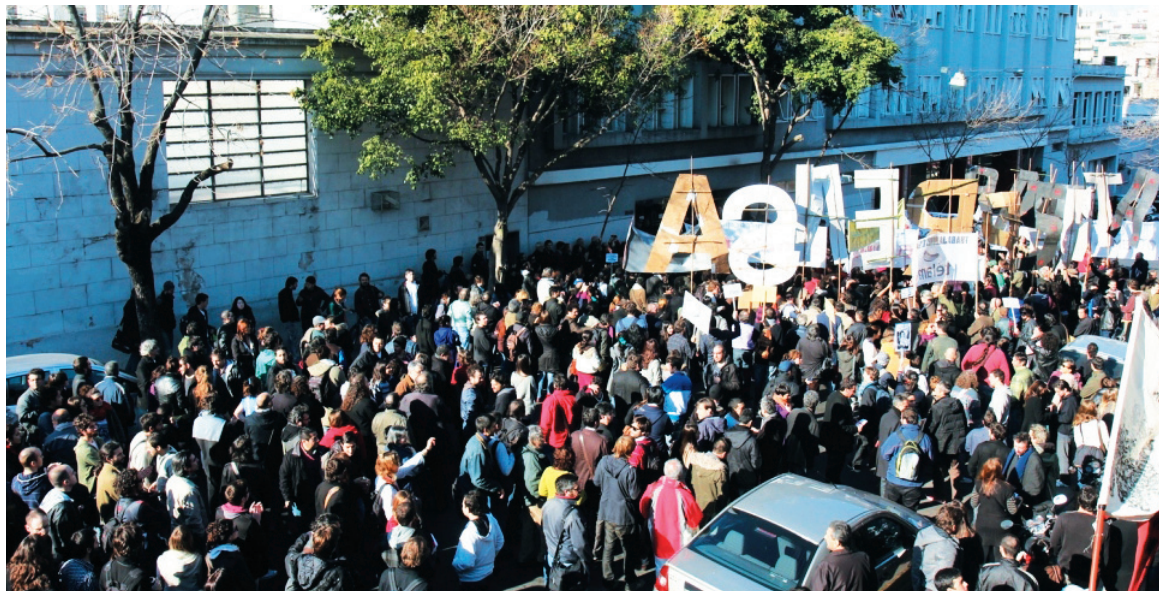
Movilización de trabajadores de prensa frente a Clarín. La patronal aspira a quebrar la unidad y el ascenso que vive el gremio.

Con una propuesta salarial a la baja, las patronales buscan no sólo bajar costos, sino -por sobre todo- asestar una derrota al vasto movimiento de lucha en ascenso que vive el gremio de prensa con paros, asambleas, retiros de firmas y marchas. Las empresas aspiran a quebrar la unidad que hemos logrado los trabajadores y ha-