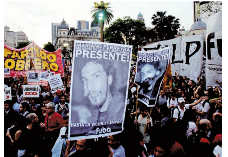
Movilización por el juicio y castigo a todos los responsables.