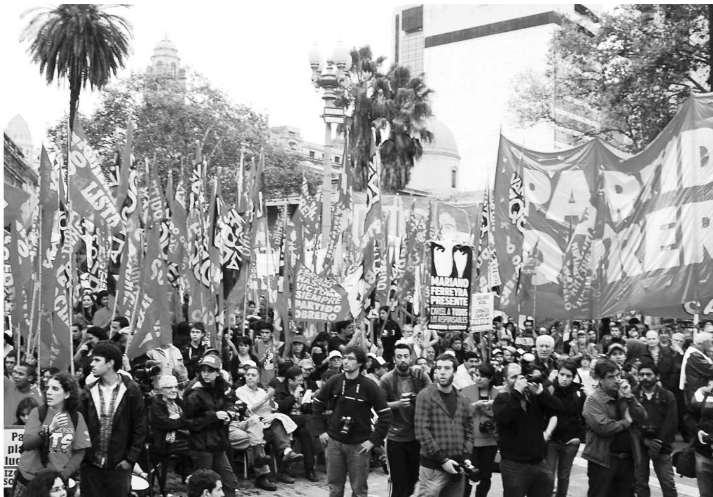
Acto del Frente de Izquierda, el Primero de Mayo. La izquierda anticapitalista prepara su lista en medio de una crisis de régimen.

Massa le ha ofrecido a la base empresarial del kirchnerismo un cambio de frente -sin cepos, ni Báez, ni Cámporas. La especulación inmobiliaria en Tigre es su carta de presentación. El "frente renovador" de Massa no ha renovado nada, es sólo una