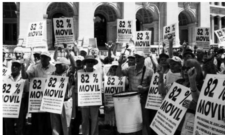
Cerca de 80 por ciento de los jubilados cobra la mínima. Para los trabajadores, la década kirchnerista significó un aumento de la explotación; para el país, del derrumbe y el saqueo.

La supuesta recuperación de la soberanía económica, sobre la base del "desendeudamiento", es una farsa. Mientras, por un lado, el gobierno aguarda la decisión de la Justicia norteamericana en el caso de los fondos buitres, debido a la cesión total de soberanía perpetrada con los canjes de deuda de 2005 y 2010 (realizados bajo jurisdicción extranjera); el monto de la deuda pública actual ya supera los 220.000 millones de dólares. Es la deuda más alta de toda la historia argentina, superando en 75.000 millones de dólares a la de diciembre de 2001. Tomando la deuda actual -la cual es escondida por el gobierno, el que ha dejado de presentar los informes trimestrales sobre la misma desde hace un año, el índice de deuda/PBI "oficial" es del 41,5 por ciento-, pero, en realidad, se eleva a más del 50 por ciento. Este indicador es un 10 por ciento