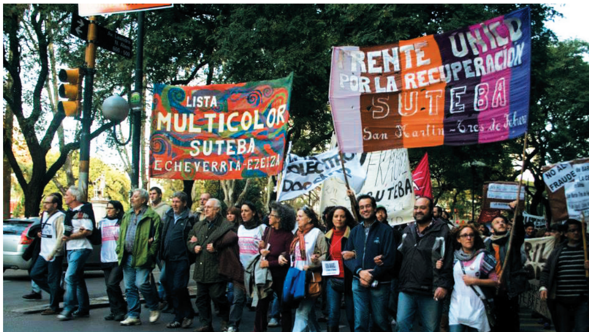
La dirección celeste del Suteba está llevando los docentes a un callejón sin salida. Es necesario reorganizar el plan de lucha desde otras bases, las planteadas por la Lista Multicolor en su campaña: con un Suteba que rompa con el gobierno, democrático y de lucha.

El paro mediático del Suteba y la FEB es consecuencia de que, una vez más, la dirección celeste ha colocado al Suteba al servicio de las luchas de facciones del kirchnerismo con el sciolismo, de un lado. También es consecuencia de la presión de la base docente, que ha repudiado la política de atar al sindicato al