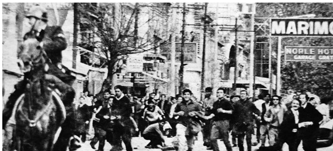
Córdoba, mayo de 1969. Los partidos de la burguesía quieren embanderarse con el Cordobazo, 44 años después, porque necesitan adaptarse al estado de ánimo y conciencia política de las masas, en especial en medio de una crisis que tendrá un estallido furibundo.