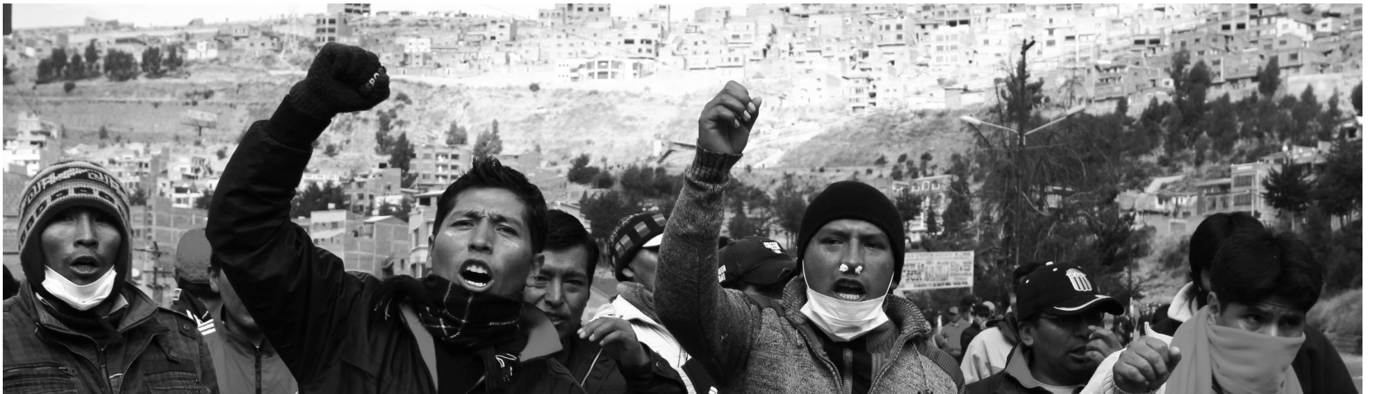
Piquete obrero en El Alto. La evolución de la huelga y el propio desenlace están indicando las enormes reservas del proletariado boliviano y los límites de la dirección de la COB.

La dirección de la COB ha resuelto el levantamiento de la huelga general, al que presenta como un cuarto intermedio de treinta días. En el interín, se producirá el 'análisis' de un proyecto de reforma de la Ley de Pensiones por una comisión conjunta de la central y el gobierno. El levantamiento se produjo cuarenta y ocho horas antes de la anunciada marcha de los cocaleiros sobre La Paz y otras ciudades en defensa del gobierno y contra el "golpe de Estado" que -según Evo- estaba por detrás de la huelga general indefinida lanzada por la COB. El gobierno había declarado la ilegalidad de la huelga y llamó a las "organizaciones sociales" encuadradas en el MAS a salir a las calles contra ella.