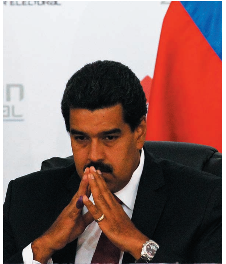
Nicolás Maduro. La política general del chavismo, en crisis.

Otro indicio importante del comienzo de la reprivatización: Globovisión, una suerte de "grupo Clarín" venezolano, otrora ariete de la oposición de derecha y estatizado por Chávez, vuelve a manos privadas y lo conducirá Leopoldo Castillo, uno de los emblemas de esa emisora durante su pugna con el chavismo, aunque ahora, según el mismo Castillo, sostendrá una línea "de centro"; es decir, de conciliación con el go-