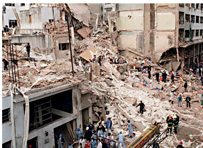
Atentado en la Amia. Crisis del acuerdo argentino-iraní.

El mismo razonamiento se aplica a la situación en Medio Oriente, donde la intervención de Hizbollah en la guerra civil en Siria, por un lado, y los bombardeos de Israel, por el otro, ponen a Irán en un frente de guerra directo. Turquía se encuentra armando un corredor propio a partir del acuerdo de paz con la guerrilla kurda, que se explica por los convenios de explotación de petróleo con el Kurdistán iraquí y con las poblaciones kurdas en Siria. El desmembramiento de Irak, a partir de esta movida de Turquía y de la guerra abierta entre sunnitas y chiitas iraquíes, es una posibilidad en caso de que la crisis