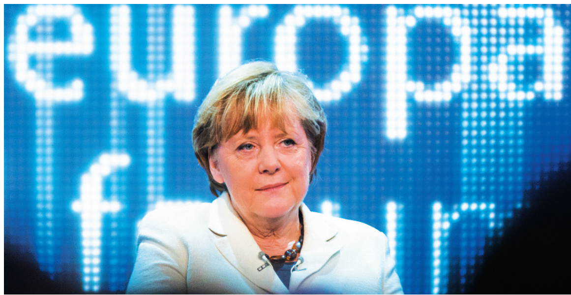
Angela Merkel, premier alemana. La Unión Europea se aproxima aceleradamente a un punto de explosión.

La novedad ahora no es sólo que Francia se sumó formalmente al pelotón de los países en recesión, sino que Alemania registró un aumento de apenas un 0,1% en el último trimestre. Este es un punto clave: "¿Qué pueden esperar los empresarios españoles e italianos -dice The New York Times - si el mercado del norte se