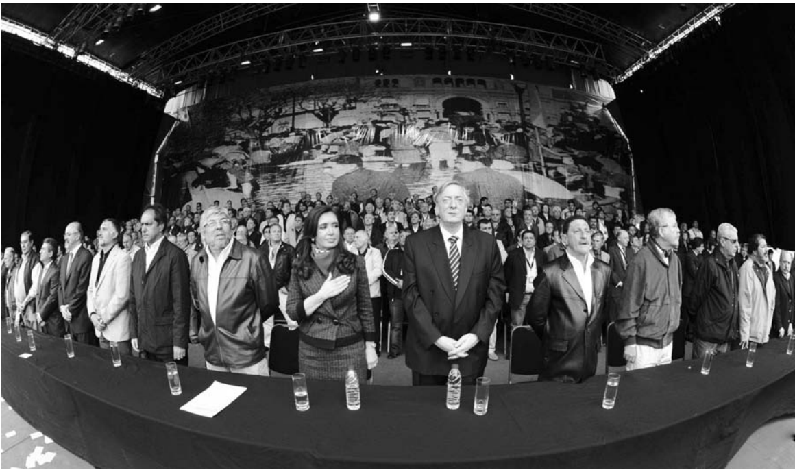
La "década ganada". La Plaza de Mayo celebrará una crisis de fondo.

El sábado 25 de mayo en la Plaza de Mayo, el kirchnerismo tiene la intención de "recuperar la calle" que nunca tuvo. El acto oficial parte así de una desventaja estratégica.