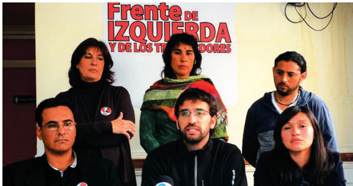
Nuestros candidatos en la ciudad de Neuquén.