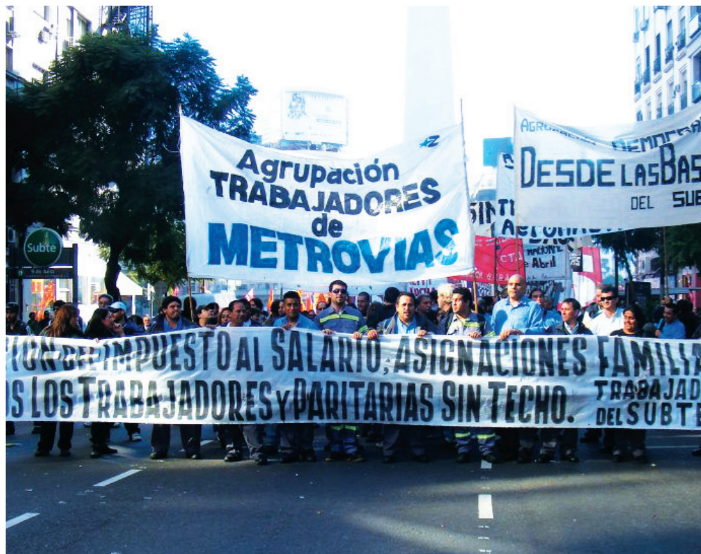
La Agrupación de Trabajadores de Metrovias, en la movilización contra el impuesto al salario. El clasismo avanza en un sector estratégico de la clase obrera.

Se realizó el primer turno de las elecciones de delegados en las líneas A, B y C, las que junto con la D, son las principales en caudal de tráfico y peso político. Sobre 40 delegados electos en tráfico, estaciones y talleres, 11 pertenecen a la oposición clasista a la conducción, hegemonizada por el kirchnerismo sabbatellista de Roberto Pianelli. Aparte, unos ocho delegados más corresponden a sectores con relativa independencia de la conducción, que han protagonizado luchas. Es el caso de los boleteros de la Línea B, contra el trabajo insalubre con la tarjeta Sube, o los paros contra la manipulación de ascensos por la patronal en tráfico de la Línea A. En cuanto al resto de los delegados, si bien se ubican en el campo de la conducción del sindicato, su composición no es homogénea: responden a fracciones lideradas por distintos miembros de la Directiva, que chocaron entre sí, sea con listas enfrentadas o disputando ciertas preselecciones para conformar listas únicas. Es el caso de tráfico de la Línea C o estaciones de la misma línea. Incluso en el armado de estas listas tuvieron que incorporar a algunos jóvenes activistas independientes.