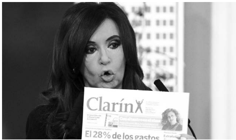
Cristina Kirchner y Clarín. Defendemos la lucha por la libre expresión del pueblo, no el monopolio de los parásitos que ocupan los dos lados del mostrador capitalista.