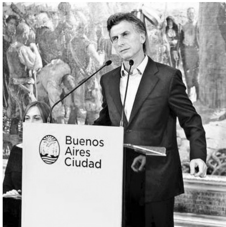
Mauricio Macri. La medida autoriza la censura judicial a la prensa y rechaza los recursos cautelares o de amparo contra esta censura, a la vez que prohíbe el derecho de huelga.