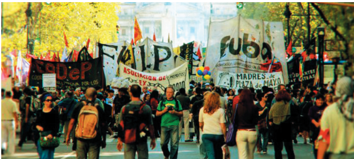
El movimiento estudiantil de la UBA calienta los motores. Debate en la Federación Universitaria de Buenos Aires.