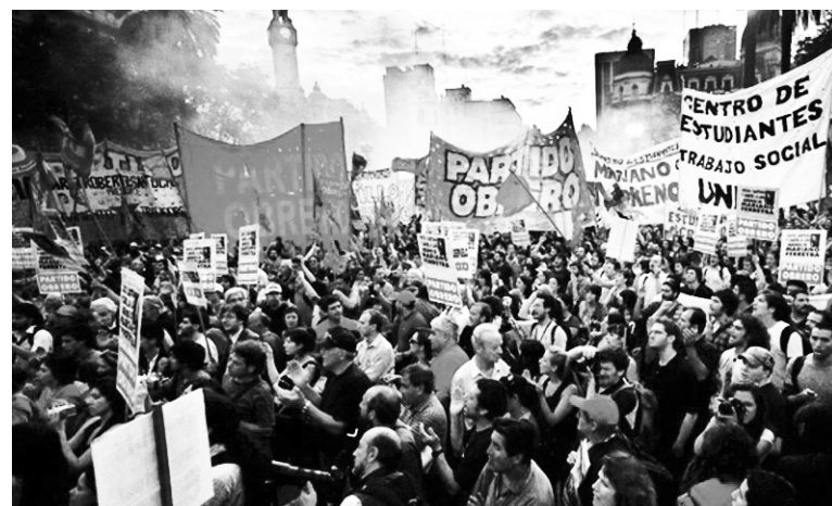
21 de octubre de 2010. Además del combate político-judicial, la lucha sigue vigente porque ni la tercerización y precarización del trabajo han sido abolidas, ni la burocracia expulsada de los sindicatos.

El asunto 'Tomada no tiene nada que ver' no está solamente en función de una reinserción política del ministro, que pretende dejar el gobierno para entrar en el Congreso. Forma parte de la exculpación de la jefatura de la Policía Federal, dado que el Tribunal asegura que los policías en el lugar les mintieron a sus superiores, sin presentar ninguna prueba de esa mentira. Por el contrario, la amplitud del operativo de ataque y fuga es inconcebible sin la participación de los jefes, lo que violaría todos los protocolos de la