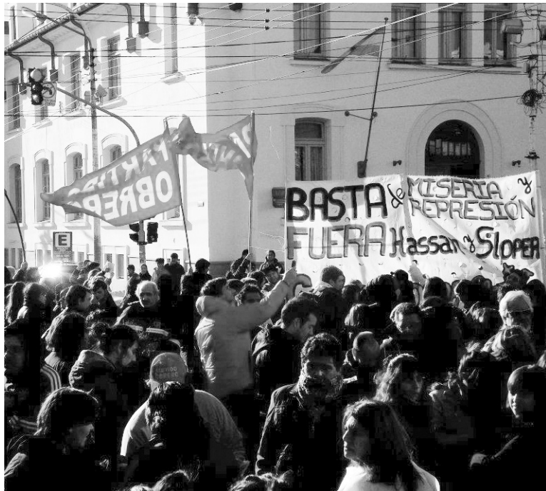
Contra la represión. Era y sigue siendo necesario organizar un gran paro provincial.

Es falso que haya habido incidentes entre distintos grupos de manifestantes. Es falso que hubiera habido algún policía lesionado en el momento en que los manifestantes retiraron parte del vallado al mediodía. Es falso que la policía hubiera recibido alguna agresión antes de la primera andanada de