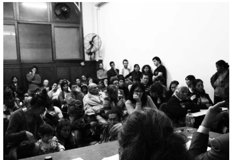
Escenas del debate en la Facultad de Derecho. Es necesario relevar el suelo urbano ocioso y aumentar los impuestos al capital, para una reorganización urbana sobre nuevas bases sociales.

ejercieron las masas. El juez explicó que no es una cuestión números, sino de poner en evidencia un encubrimiento dictado por el poder político. Lo que está en juego es el alcance de la figura legal de estrago doloso, lo que permite que cada damnificado se presente como querrelante en esta causa, exigiendo la indemnización por los daños ocasionados, ya sea por negligencia o falta de obra pública.