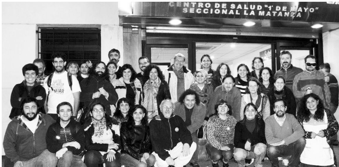
Los candidatos para la seccional La Matanza. Para terminar con este ciclo de entrega, que colocó a nuestro sindicato al servicio del gobierno.

No se trata de un rechazo episódico. El vuelco de la docencia a la Multicolor tiene un contenido clarísimo, expresado por los docentes a los que visitamos en las escuelas: repudio al levantamiento inconsulto del plan de lu-