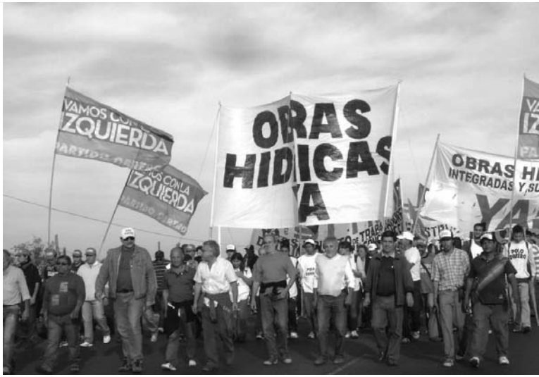
Piquete en Camino Negro. Una ruta clasista ante las inundaciones y el desempleo en la construcción.

De acuerdo con lo resuelto en la importante asamblea del Club Almafuerde de Lomas de Zamora (donde participaron 500 compañeros), el jueves 9 de mayo se realizó un corte en Camino Negro que se extendió por más de ocho horas.