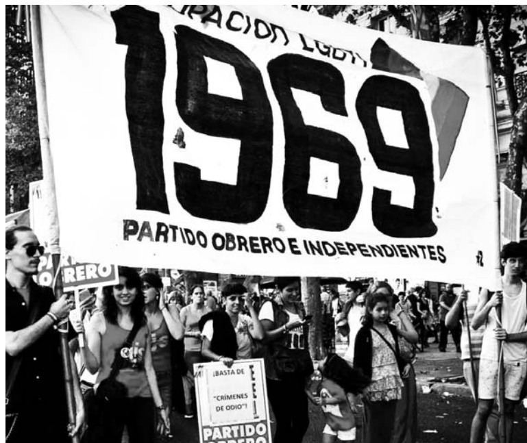
La agrupación LGBTI 1969. Hay que poner en pie de lucha al movimiento.

Luego de la difusión de distintos casos de violencia hacia la población LGBTI en general, y hacia travestis y transexuales en particular, el Ministerio de Trabajo hizo extensivo el seguro de "capacitación y empleo" a las personas cuya identidad de género actual no sea aquella asignada en su nacimiento.