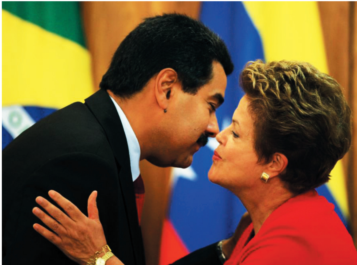
Nicolás Maduro y Dilma Rousseff. Todo el esquema que ha sostenido al chavismo se derrumba, la cuestión es quién aprovechará ese agotamiento: Capriles y la derecha, o la clase obrera y el pueblo explotado con una alternativa independiente.

La gira de Maduro por Uruguay, Argentina y Brasil tuvo un solo punto de importancia primordial: las advertencias que recibió de la