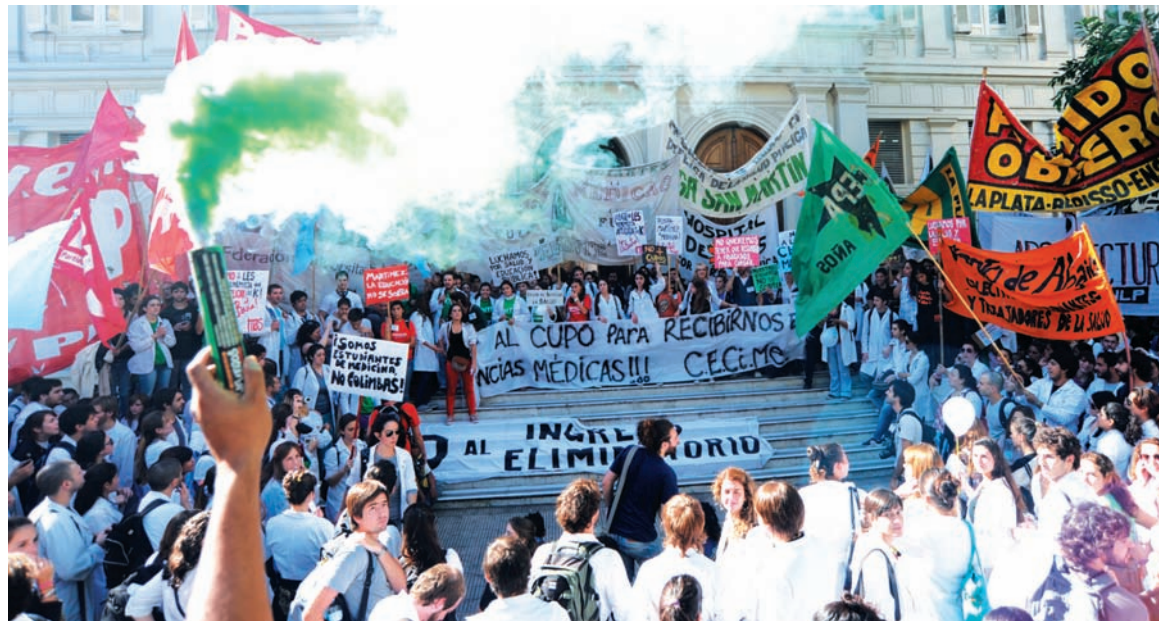
Dos mil estudiantes se movilizaron al rectorado. Una lucha para defender la educación y la salud públicas.

En 2010, los estudiantes tomaron durante 17 días la facultad contra el mismo cupo que ahora limitará el egreso a sólo cien médicos graduados en todo el año -