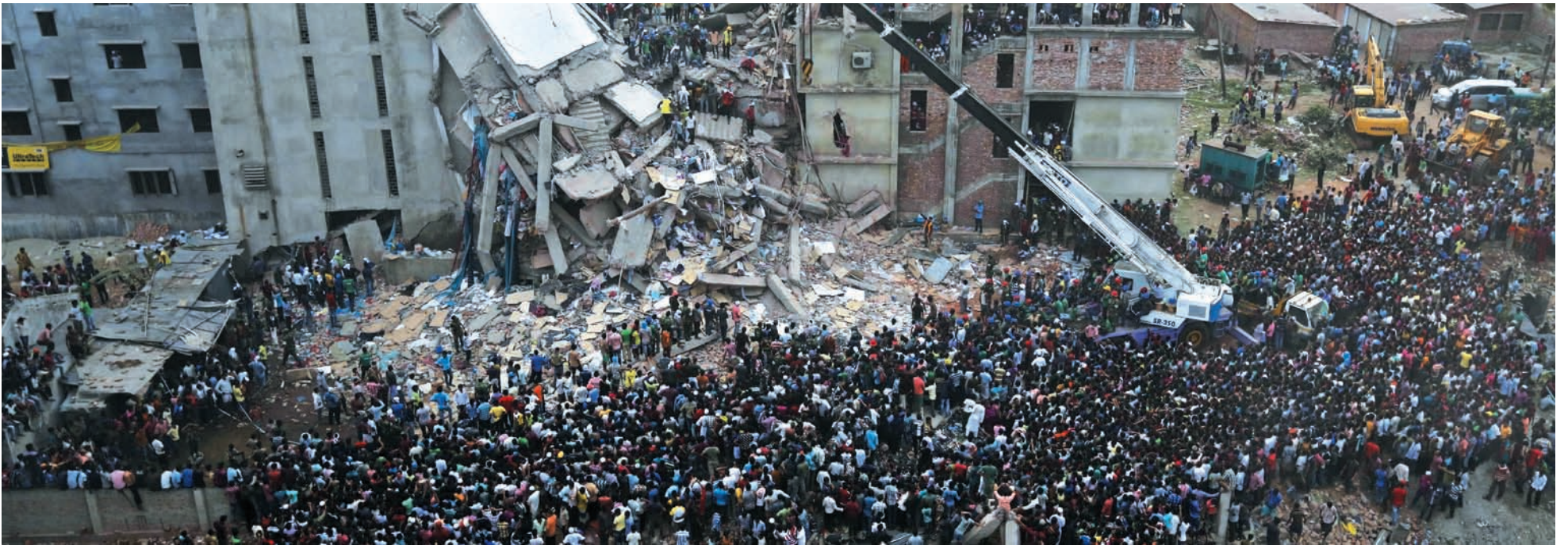
Derrumbe en Dhaka. Una rebelión obrera en respuesta a la masacre patronal, siguiendo los pasos de los trabajadores de China, Corea y Vietnam.

La mayoría de las 4.500 fábricas textiles de Bangladesh han entrado en huelga a partir del derrumbe del edificio donde trabajaban casi 4 mil obreros en la capital (Dhaka), en su mayoría mujeres. Han fallecido, en condiciones horribles, casi 400 trabajadores hasta el momento y más del doble de esa cifra ha quedado mutilada para toda la vida.