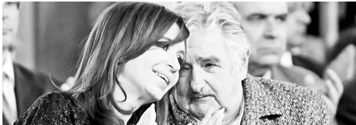
CFK y Mujica. El 'escándalo' puso en evidencia el agotamiento del Mercosur y, por lo tanto, el fracaso de la integración capitalista sur-sur.

Los dichos de Mujica en referencia a Cristina Kirchner ("esta vieja es peor que el tuerto") no son simplemente una manifestación de chochera de un presidente viejo.