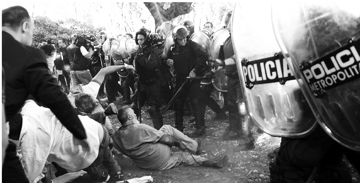
La Metropolitana carga sobre médicos, enfermeros y pacientes. La defensa del Borda está en manos de sus trabajadores.

No es cierto que el gobierno PRO de la Ciudad se haya "equivocado" al actuar del modo brutal en que lo hizo en el Hospital Borda. Se planteó la misma política que les rindió frutos en anteriores circunstancias. Frente a la cautelar que impedía avanzar con las obras, presentaron una apelación para habilitar la ocupación y demolición de los talleres del hospital, reservados al trabajo reparador para los pacientes. Es lo que hicieron en anteriores circunstancias: "nosotros y nuestros abogados consideramos que con la apelación se podría avanzar con la obra. Así lo hicimos con otras obras en la ciudad que hoy disfrutan miles de vecinos", dice Rodríguez Larreta ( La Nación , 29/4).