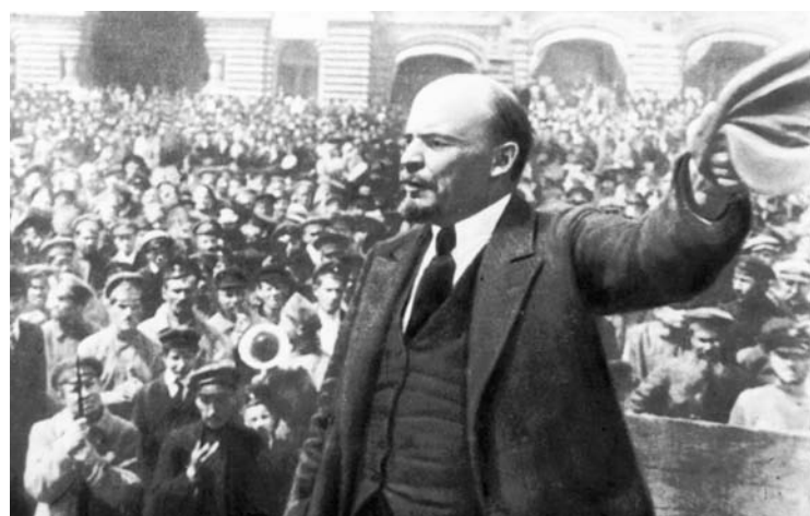
Vladimir Ilich Lenin en la Revolución Rusa.

Tomemos el tipo del círculo socialdemócrata más difundido en los últimos años y examinemos su actividad. "Está en contacto con los obreros" y se conforma con eso, editando hojas que fustigan los abusos cometidos en las fábricas, la parcialidad del gobierno con los capitalistas y las violencias de la policía; en las reuniones con los obreros, los límites de estos mismos temas; sólo muy de tarde en tarde se pronuncian conferencias y charlas acerca de la historia del movimiento revolucionario, la política interior y exterior de nuestro gobierno, la evolución económica de Rusia y de Europa, la situación de las distintas clases en la sociedad contemporánea, etc.; nadie piensa en establecer y desenvolver de manera sistemática relaciones con otras clases de la sociedad. En el fondo, los componentes de un círculo de este tipo conciben al militante ideal, en la mayoría de los casos, mucho más parecido a un secretario de sindicato que a un jefe político socialista (...). En una palabra, todo secretario de un sindicato sostiene y ayu-