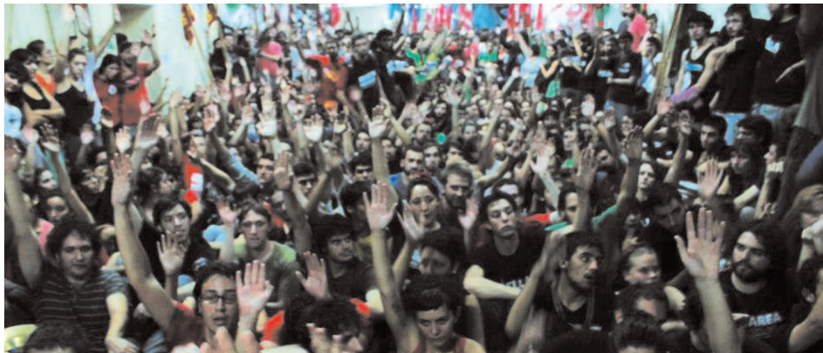
Plenario del congreso de la Federación Universitaria de Buenos Aires. El gremio estudiantil tiene el extraordinario desafío, en 2013, de desatar un intenso movimiento por la transformación de los órganos de gobierno - la "democratización".

La "foto" final del congreso estuvo precedida por una aguda lucha política. La UJS realizó una intensa campaña acerca de los desafíos de