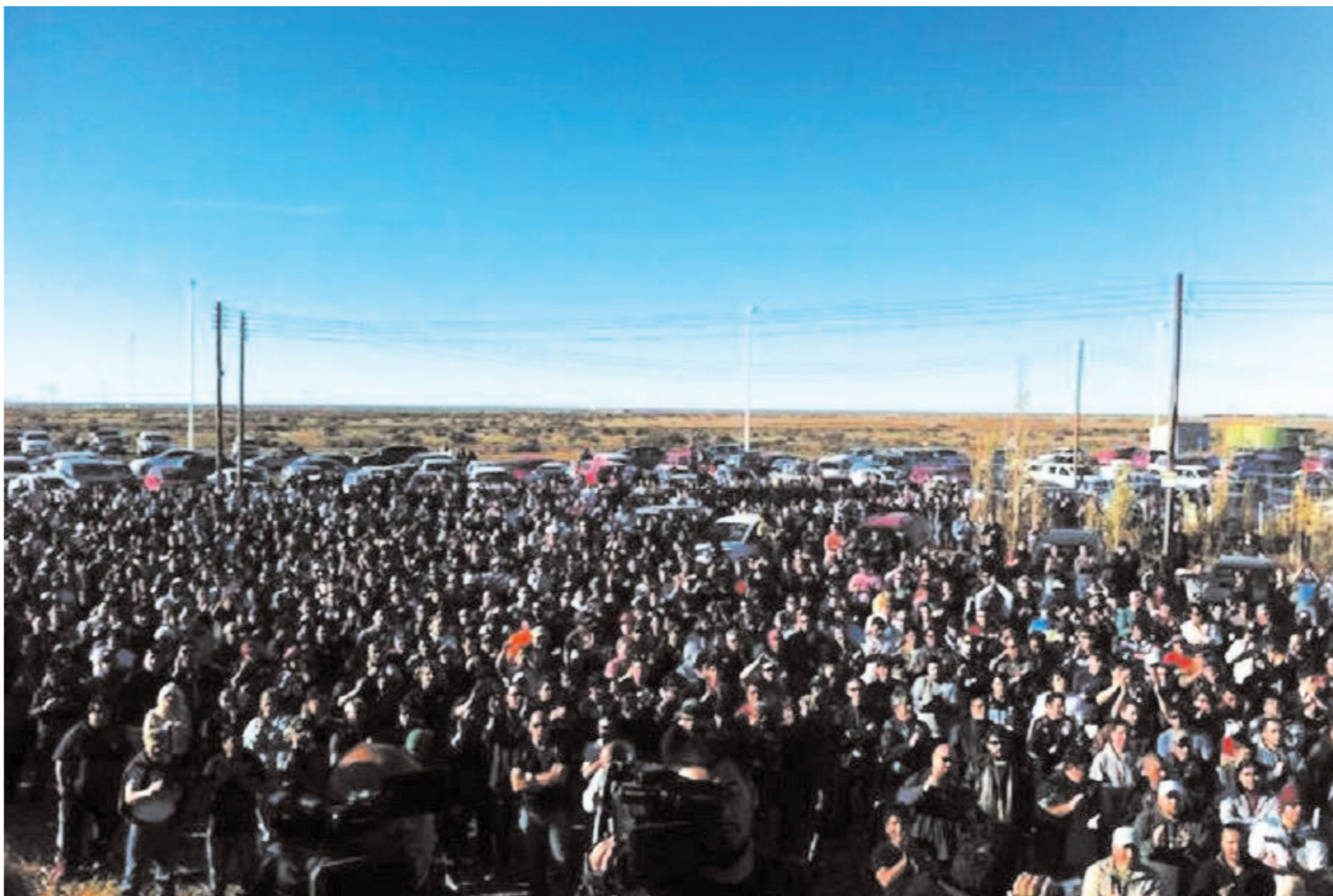
Asamblea de los petroleros. Luego de la victoria obrera vamos por una lista independiente de la burocracia, el gobierno y las patronales.

Terminó con la intervención al sindicato