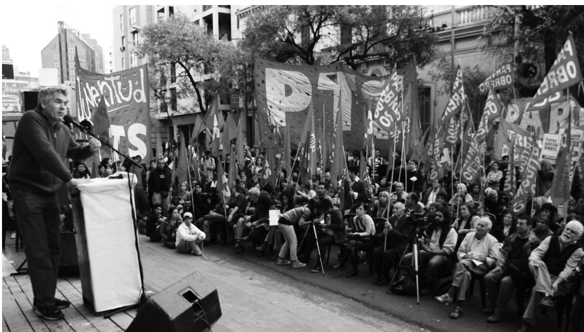
Un acto del Frente de Izquierda en 2011. El PO cordobés ya inició una gran campaña.

Las diversas reuniones y charlas convocadas por el Partido Obrero de Córdoba, en el marco de la campaña política, dieron lugar a iniciativas y resoluciones de gran importancia luego de intensos y concurrecidos debates.