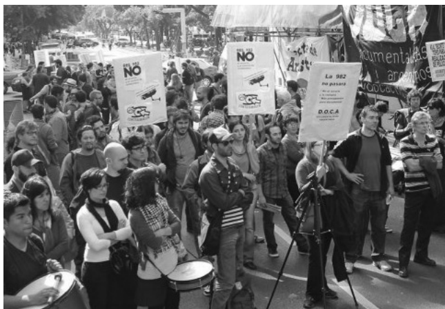
Movilización en defensa de la creación documental independiente.

El rechazo de la comunidad documental es generalizado en todo el país. Las seis asociaciones de directores entregamos una carta en el INCAA el lunes 8 de abril, en la