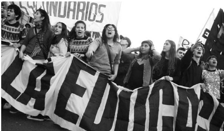
Secundarios en defensa de la educación pública. La juventud está siendo fuertemente golpeada, se entiende la negativa oficial a convertir al voto juvenil en universal.

En la cuestión del voto a los dieciséis años, el gobierno está mostrando la hilacha. Ocurre que, para poder votar, los jóvenes deberán obtener el nuevo DNI. Sólo de ese modo quedarán inscriptos en el padrón electoral. Los que no lo hagan quedarán automáticamente excluidos de la elección.