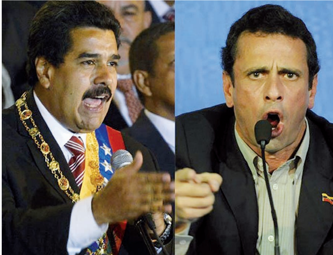
Nicolás Maduro y Enrique Capriles. El avance de la derecha es un resultado de las limitaciones y contradicciones del chavismo; quedó en evidencia que este no ha construido un gobierno de trabajadores y que no se ha establecido ninguna transición al socialismo.

La masa bolivariana no transfirió su confianza en Chávez a las camarillas en que se dividen sus sucesores. La tendencia no surgió ahora: el recelo contra la llamada 'derecha endógena' y la 'boliburguesía' viene de larga data. Maduro, sin embargo, fue elegido por Chávez como su delfín, precisamente porque parecía el más alejado de estas imputaciones. Las