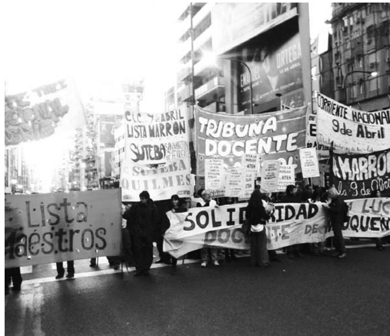
Corte en Callao y Corrientes, en apoyo a los docentes neuquinos.

la vanguardia de Aten, así como la quiebra de la paz social firmada con el gobierno por el resto de los gremios de la provincia, plantean una perspectiva para los trabajadores de la educación. El gremio de judiciales, Sejun, realizará el jueves 17 su segundo paro de 24 horas, el cual empalmará con una movilización provincial común con Aten. Los municipales de Senillosa y Plottier también han salido a la lucha. ATE convoca a un paro provincial para el día 24. Este cuadro le da un nuevo aire a la lucha de