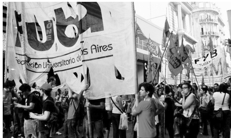
La Federación Universitaria de Buenos Aires inicia un nuevo congreso. Para robustecer a la Fuba se precisa una agenda de lucha y un programa claros.

El Congreso de la Fuba será escenario de una intensa lucha política con relación a las tareas del movimiento estudiantil. Los paneles del martes 23 anteceden a los despachos que votarán las comisiones del jueves 25. Por caso, el debate sobre educación tendrá que considerar su completa crisis, ya que luego de una década, existe un cuadro análogo al del transporte o la infraestructura nacional. Medicina sin gas por sexto año, docentes sin salario y una creciente inserción del capital en el terreno educativo. La lucha contra la política educativa de los K tiene que ser una conclusión de primer orden, y es necesario que el Congreso establezca un plan de acción, en unidad con los docentes. Además, habrá un panel sobre situación política, que estará enmarcado por la crisis conjunta que atraviesan el gobierno y su oposición tradicional, embarcados por distintas vías en descargar ajustes sobre el pueblo. Allí estará planteada la intervención del movimiento de la