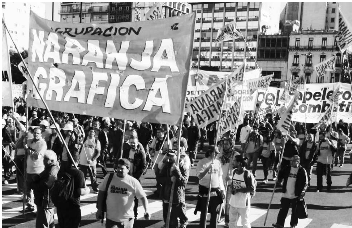
El clasismo gráfico. Frente a la crisis del 'modelo', autoconvocatorias por los reclamos obreros y por un plan de lucha de las centrales sindicales.

Contra estas tentativas, afloran luchas fundamentales como las de los metalúrgicos y los