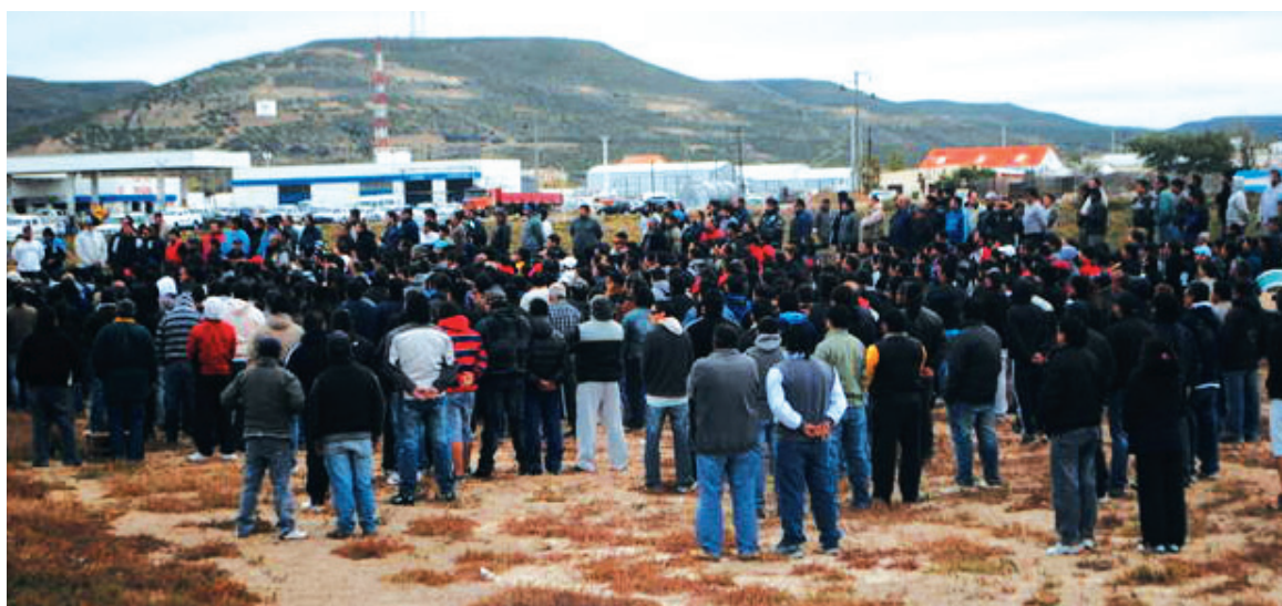
Asamblea de trabajadores en Cañadón Seco contra la intervención del gremio. Para recuperar el sindicato es necesaria una acción de todos los petroleros unidos, de los que quieren elecciones independientes de la burocracia, las operadoras y el gobierno.

Realizada la pregunta en voz alta, para que los petroleros respondan a mano alzada: "¿Quieren que continúe la intervención