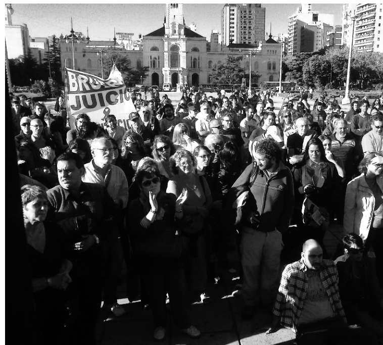
Asamblea de coordinación de inundados y afectados. Los barrios continúan sin salida, el impulso a la construcción de las asambleas populares es crucial para la victoria del movimiento.

A las asambleas de los barrios, se sumaron las de distintas facultades de la UNLP. Una movilización de 600 estudiantes en Trabajo Social relevó la situación real de los damnificados, a la que se sumaron los organismos de Derechos Humanos -convirtiéndolo, en los hechos, en una comisión investigadora independiente. En cada lugar de trabajo y centro de estudiantes organizamos las donaciones, exigimos a nuestras autoridades el pliego de los reclamos, organizamos las asambleas barriales y llamamos a coordinar juntos una acción en común. El impulso a la construcción de las asambleas populares es crucial para la victoria del movimiento.