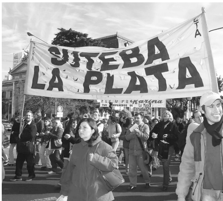
Suteba Legítima de seccional La Plata. Para parar la ofensiva del gobierno sobre los docentes y la educación pública, resulta estratégica la lucha por una nueva dirección en el Suteba.

La inmensa mayoría de las corrientes sindicales opositoras,