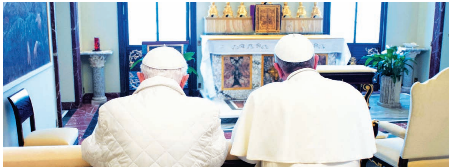
Ratzinger y Francisco. Crisis del capitalismo, bancarrota del Vaticano y conspiraciones que "ya están en marcha".

Según algunos analistas, las denuncias del libro con este título que el periodista italiano Gianluigi Nuzzi publicó no hace mucho, marcaron el principio del fin del papado de Benedicto. Revela con un detalle minucioso la saga de crímenes y negociados del Instituto para las Obras Religiosas (IOR), el piadoso nombre del Banco del Vaticano. La fuente es el archivo del monseñor Renato Dardozzi, de larga trayectoria en el manejo de las finanzas vaticanas. Dardozzi, poco antes de morir, le entregó ese archivo al periodista, en una suerte de exculpación testamentaria.