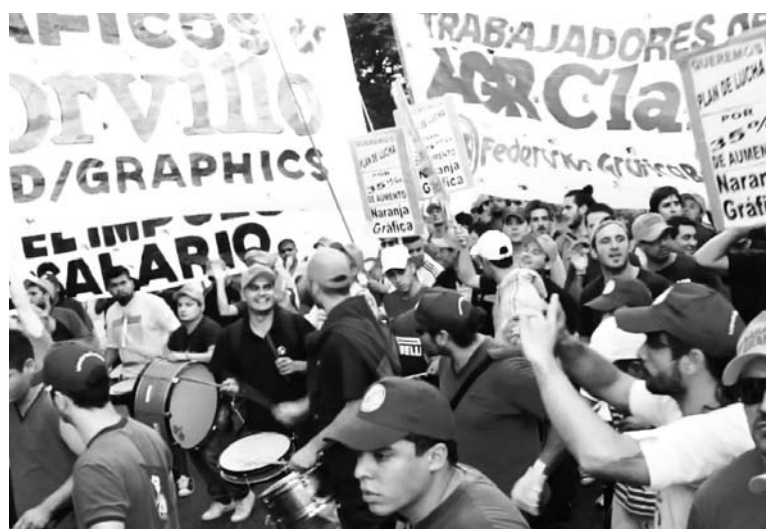
La movilización de las listas opositoras sitió la Federación Gráfica.