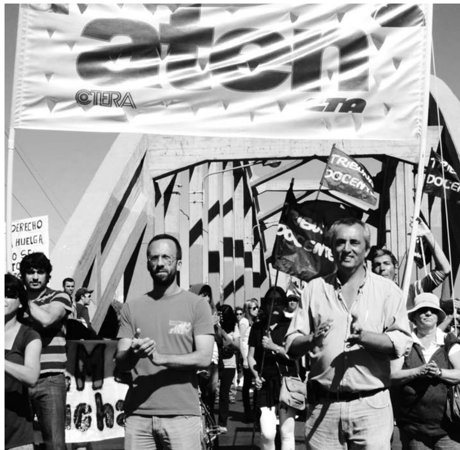
Aten: 72 horas de paro en la primera semana de abril. Una intensa campaña política por la victoria de estas huelgas, es inseparable de la batalla por desarrollar una alternativa de izquierda en 2008.

El kirchnerismo podrá chicanear a Scioli, pero no quiere una victoria obrera en el principal distrito del país, cuando aún están en discusión las principales paritarias. Los K le han endosado a Scioli el trabajo sucio de enfrentar a los docentes y afrontar la quiebra de la provincia, con un ajuste de características brutales. Está en marcha un recorte general de gastos en la administración provincial, con su secuela de trabajadores despedidos y tercerizados. Más grave aún es la situación en los hospitales, donde faltan insumos esenciales. Como ocurre a escala nacional, los K tercerizan el ajuste. Scioli reclama a los K la aprobación de un préstamo externo para pagar los au-