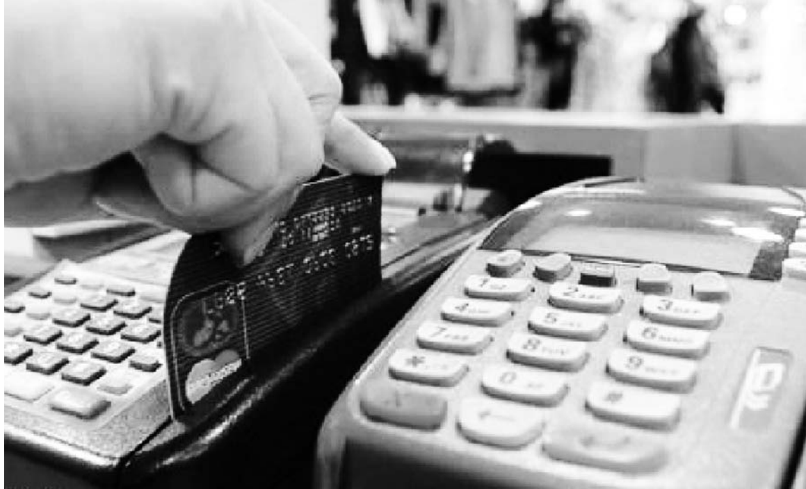
El gobierno va de improvisación en improvisación: ahora, la "Moreno-card".

Queda claro, de todos modos, que una reducción de la comisión de las tarjetas no puede absorber, en el tiempo, el aumento de precios sucesivo que provoca la inflación. Lo que ocurrirá en realidad es que los supermercados se quedarán con una parte de las ganancias que ahora van a los bancos. Los súper que no integran las grandes cadenas no tendrán esa ventaja. Los bancos, por su parte, buscarán compensar esa reducción de sus beneficios con un recargo a las tarjetas que operan en otros rubros del comercio. El interés del 22% anual sobre los saldos de los consumidores es -en un marco de congelamiento de precios- una tasa confiscatoria.