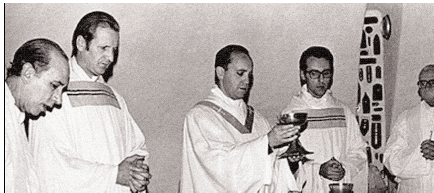
Bergoglio, Jalic y Yorio, en una misa en 1976. La nominación de Bergoglio, el accidente histórico que ha dejado al desnudo la inconsistencia del kirchnerismo, otro accidente de la historia; pero no zanja la veracidad de la denuncia de Verbitsky, que debe ser esclarecida.

Que el Estado y la Iglesia abran los archivos