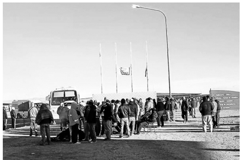
Trabajadores de Vale deliberan medidas de lucha.

Naufragio de la Unasur y el Mercosur, los dos modelos de la "integración continental".