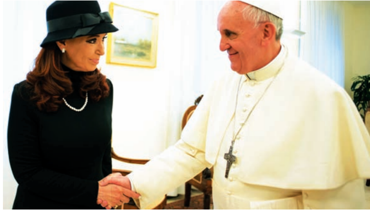
La presidenta y el Papa. La división producida en el cristinismo (y en el chavismo) es la expresión circunstancial de un impasse definitivo del actual régimen político.

Si el gobierno creyó, siquiera por un momento, que el Vaticano podía rechazar un candidato por haber colaborado con una dictadura, debería despedir por lo menos a todo su servicio exterior. Bajo la dictadura, como cuando cayó por la derrota en Malvinas, la Iglesia local y el Vaticano demostraron ser cabales instituciones de Estado -un recurso último para salvar al sistema social capitalista y a su aparato político. Lo volvió a demostrar en la bancarrota de 2002, y vuelve a hacerlo ahora, cuando le tira una sogá a la ahogada.