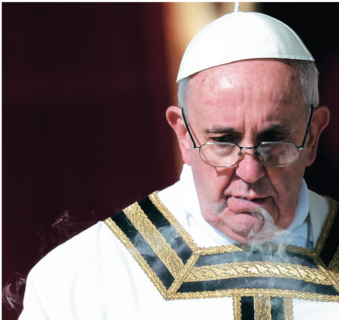
El nuevo Papa, en su primera misa. Bergoglio está obligado a jugar de rescatista, tarea imposible para una institución decrepita.

Pasado el fasto y la pompa que abruma como una inundación, Francisco tendrá que actuar. Por ahora, en los principales puestos vaticanos siguen los hombres del “partido romano”, provisoriamente confirmados. Todos los analistas insisten en que a Bergoglio lo caracteriza la “cautela”, abriendo el paraguas sobre los compromisos que vendrán para conformar su gabinete en el reinado de Roma. Veremos.