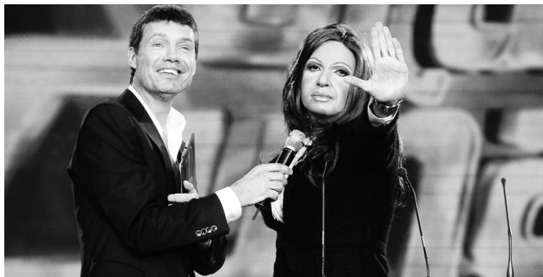
"Affaire Tinelli". "Pluralidad de voces", un chamuyo, aun al costo de una tinellización general.

Los vaivenes de Marcelo Tinelli, el hiperexitoso conductor televisivo, para decidir la pantalla que cobijaría durante 2013 a su programa Showmatch fueron fruto de una precisa operación digitada desde la Casa Rosada. Cristóbal López (cuándo no) le propuso a Tinelli la compra de parte de su productora Ideas del Sur -de la que es socia la Corpo Clarín- con el objetivo de que su programación pase de Canal 13 a Telefé, cuyo dueño es la española Telefónica y que se ha mostrado afín al gobierno para preservar en paz sus negocios y negociados. Una de las cláusulas del trato implicaba que no debía salir el segmento "Bailando" en el que participarían imitadores de políticos, sketch que en 2009 fuera muy favorable a Francisco De Narváez, que terminó derrotando al mismísimo Néstor Kirchner en la provincia de Buenos Aires. Finalmente las arduas negociaciones quedaron en la nada, pero con el "logro" de sacar a Tinelli de canal 13, un duro golpe comercial para la Corpo. Las últimas novedades dan cuenta de un año sabático por parte del conductor o de la posible compra de Tinelli de Canal 9, un negocio redondo para el empresario mediático y showman y un pase de manos de un canal repetidor de la esfera de informaciones estatal. Los planes de la Rosada, sin embargo, revelan que la pontificada "pluralidad de voces" es sobre