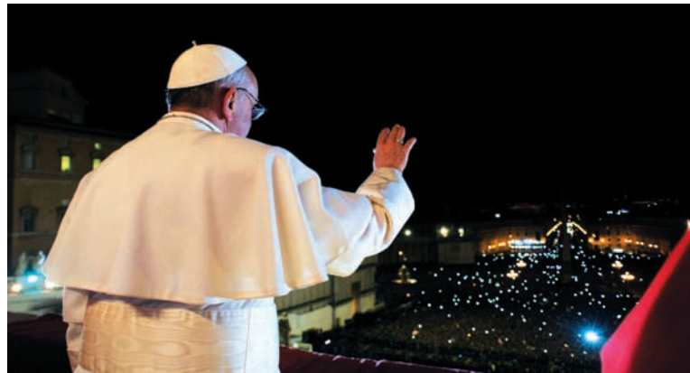
"Humilde y austero". Los gestos de Bergoglio no contradicen en absoluto su lealtad a la cúpula vaticana, responsable de dictaduras y violaciones de todo calibre.

Más clara, en cambio, fue su pertenencia política en los años 70: opositor férreo a la Teología