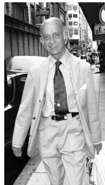
José Alfredo Martínez de Hoz.