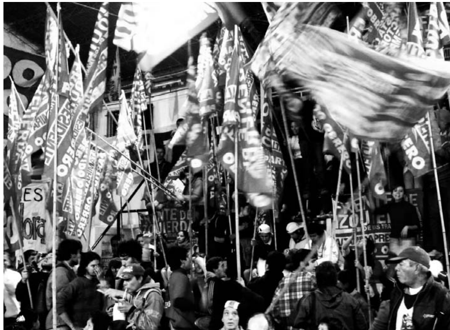
Acto del Frente de Izquierda. Es necesario reconocer el alcance de la realidad política actual, para poner en marcha una gran campaña.

La asunción papal dejó ver las brutales contradicciones del kirchnerismo. Las expectativas doblemente reeleccionistas se encuentran disminuidas. La oposición de centroizquierda promueve un frente que reuniría, por un lado, a Carrió junto a Solanas y, por el otro, a Prat