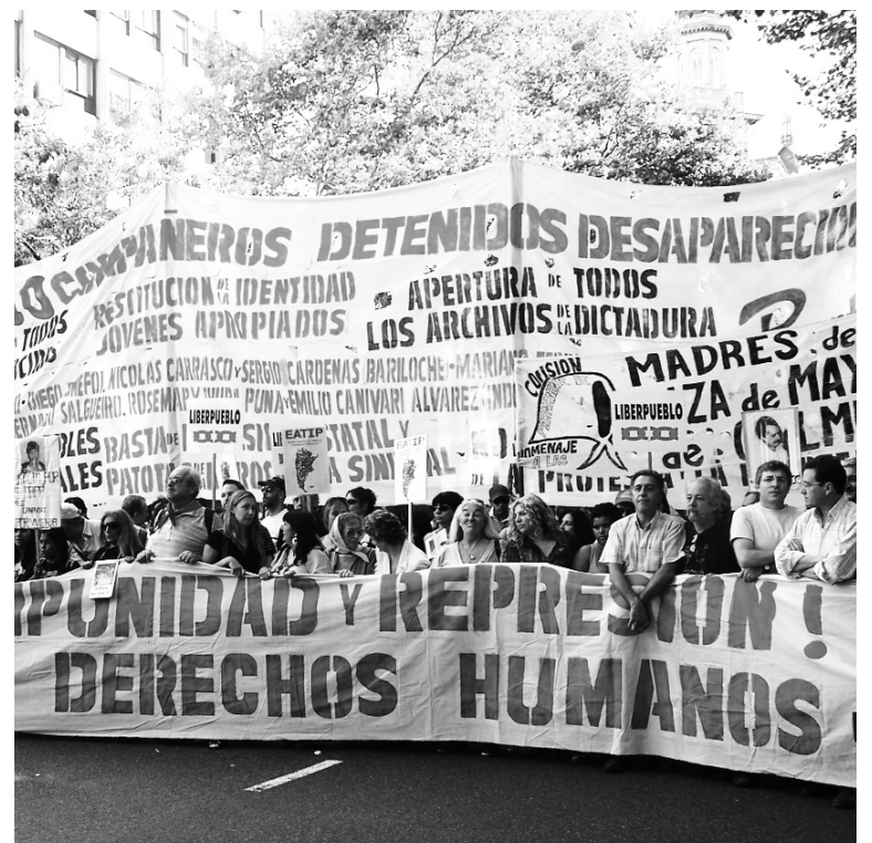
Cabecera del Encuentro Memoria Verdad y Justicia. Los organismos oficialistas, bajo la tutela de Unidos y Organizados, maniobran para bloquear el desarrollo del acto independiente.