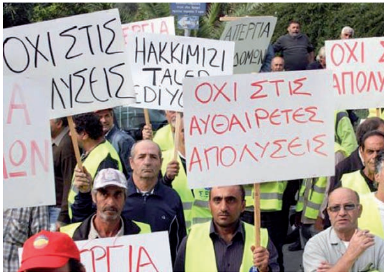
Movilización de obreros chipriotas en lucha.

El corralito bancario en Chipre, otro episodio de la crisis mundial capitalista.