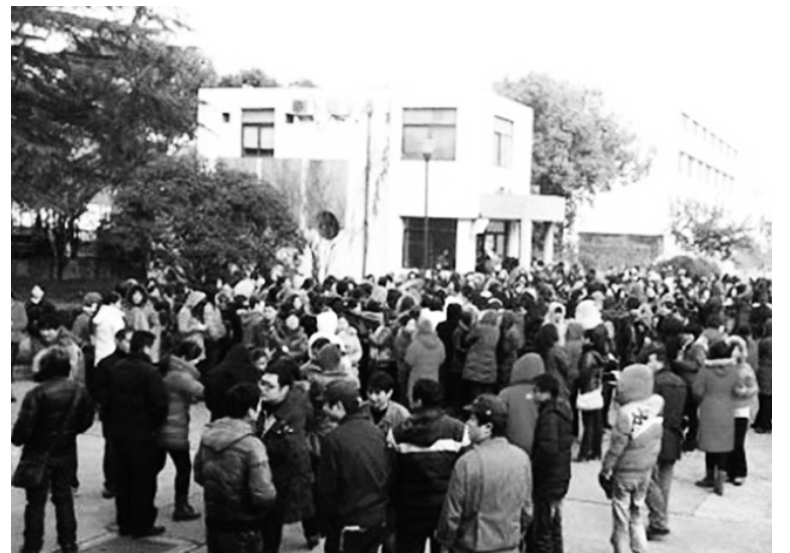
Huelga en Shangai Shinmgi Electric. Luchas obreras y levantamientos campesinos, en un cuadro de desaceleración industrial y descomposición.

Ninguno de estos conflictos tuvo la iniciativa o el acompañamiento de la Federación Sindical de Toda China (FSTC), una burocracia que cuenta con 193 millones de miembros y ejerce el monopolio absoluto —no se permiten sindicatos que compitan con ella— y es un agente despiadado del gobierno contra las luchas obreras. En China, el derecho de huelga está prohibido por la Constitución, lo que significa que la mitad o más del movimiento obrero, intermitentemente, actúa en la ilegalidad. Cuando el proceso de rebelión obrera comenzó a desenvolverse (2008), la FSTC ensayó un acuerdo con las empresas para “tener sindicatos en todas las compañías que no son propiedad del Estado chino para 2010” (2) y regimentar las luchas en su inicio. El intento fracasó y, lejos de atenuar su empuje, la clase obrera china abrió una nueva etapa, extendiendo huelgas “sal-