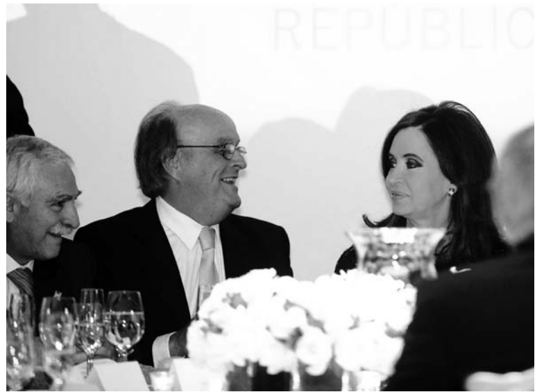
De Mendiguren (UIA) y Cristina Kirchner. La devaluación atendería a las necesidades de los capitalistas y al crisis fiscal del Estado, a costa de los trabajadores.

La devaluación haría saltar por los aires el congelamiento de precios de Moreno y las negociaciones