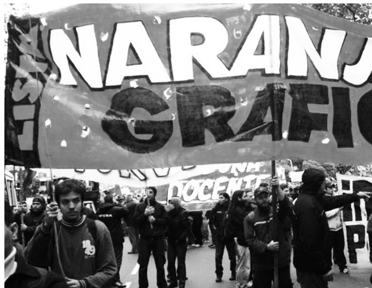
Otra victoria del clasismo en el gremio gráfico

La formación de la ganadora Lista 2 es producto de esta experiencia, recorrida por el conjunto del taller, que la intervención de La Naranja ayudó a asimilar y traducir en un reagrupamiento. En él confluyeron activistas de diversas trayectorias personales, incluyendo a un miembro de la vieja interna que sobre la base de una autocrítica rompió pública-