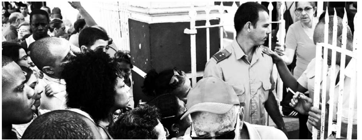
Largas filas en la oficina de Migraciones. La nueva Ley empalma con la política de legalización de la acumulación de capital privado.

Los sectores privilegiados de la población, quienes tienen acceso a los dólares (o su equivalen-