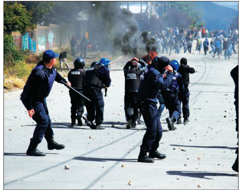
Represión durante los saqueos. Los detenidos son el pato de la boda de una crisis política y social que supera ampliamente el episodio de diciembre.

La crisis política es el trasfondo del ajuste que envuelve a to-