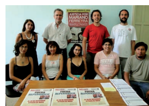
Voceros del PO salteño. Vamos por la extensión de la organización popular y más bancadas del PO.

Por estos días, Urtubey ha dado otra vuelta de tuerca a su política de defensa de los negocios del gran capital y del saqueo de los recursos naturales, habilitando un emprendimiento para fabricar nitrato de amonio (materia prima para producir explosivos para la minería) en la localidad de El Galpón. Esto a pesar de las fundadas denuncias sobre sus graves consecuencias ambientales y de una amplia movilización popular en todos los pueblos de la zona sur de la provincia, que rechazan su instalación.