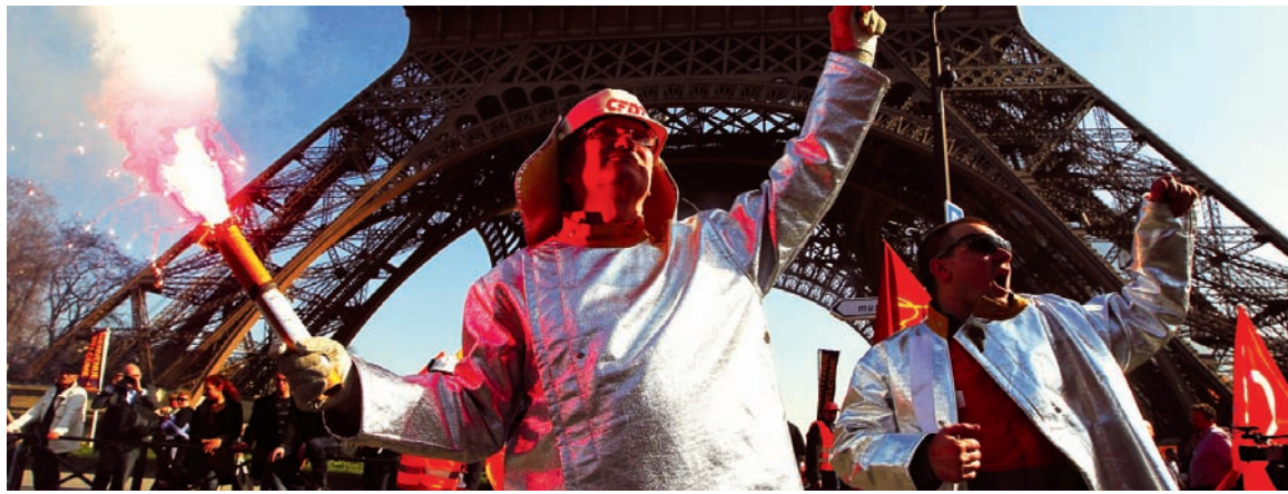
Francia en crisis. Cada día se anuncian cierres de fábricas y despidos, junto a un ataque sin precedentes contra las condiciones laborales.

La reforma apunta a reducir lo que los empresarios denominan la "judicialización" de los conflictos laborales. La patronal francesa "propone limitar al máximo los recursos frente a los tribunales" ( Le Monde , 22/12/12). Se trata de una variante de lo que, en Argentina, implicó la reforma de la ley de ART, la cual le impide a los trabajadores tener una doble vía para reclamar por sus indemnizaciones por accidentes. Un acuerdo previo con el sindicato, o su homologación por parte del Estado galo, sería suficiente para impedir -o limitar drásticamente- la posibilidad de apelar a la justicia. "Las empresas deberán someter los despidos colectivos y sus condiciones a un acuerdo mayoritario de los trabajadores o a una homologación del Estado. Se reduce el plazo de los