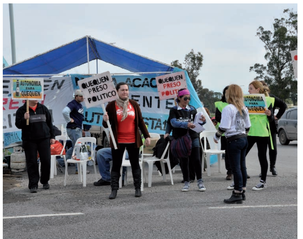
Reclamo del movimiento autonomista. Unificamos la lucha por la autonomía de Quequén con el reclamo de una Asamblea Estatuyente Municipal, que establezca las condiciones y prioridades del municipio en beneficio de los trabajadores.