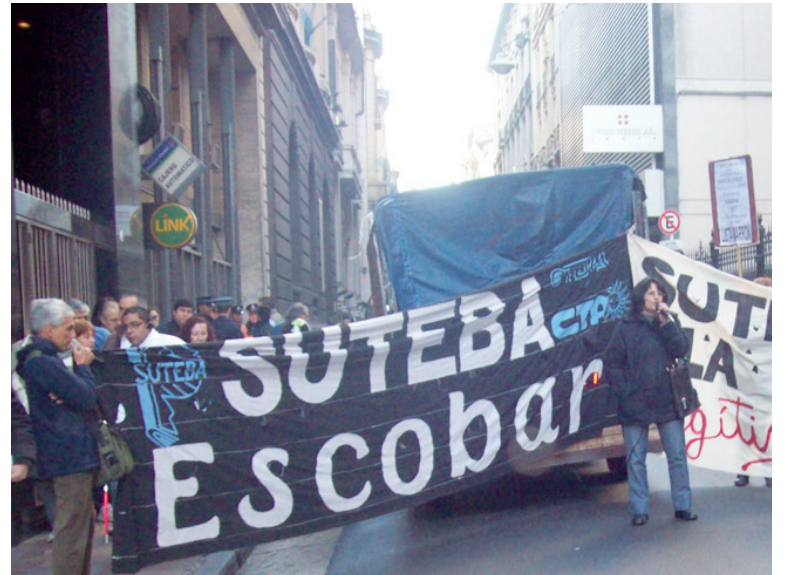
Marcha de los docentes combativos. El 15 de febrero, congreso nacional de Tribuna Docente.

A partir de allí, se trata de establecer un programa: Paritarias libres, $5000 de inicial y $4000 de básico de emergencia ya por cargo testigo; restitución de asignaciones familiares; eliminación del impuesto al salario; defensa del 82% móvil y de todos los regímenes ju-