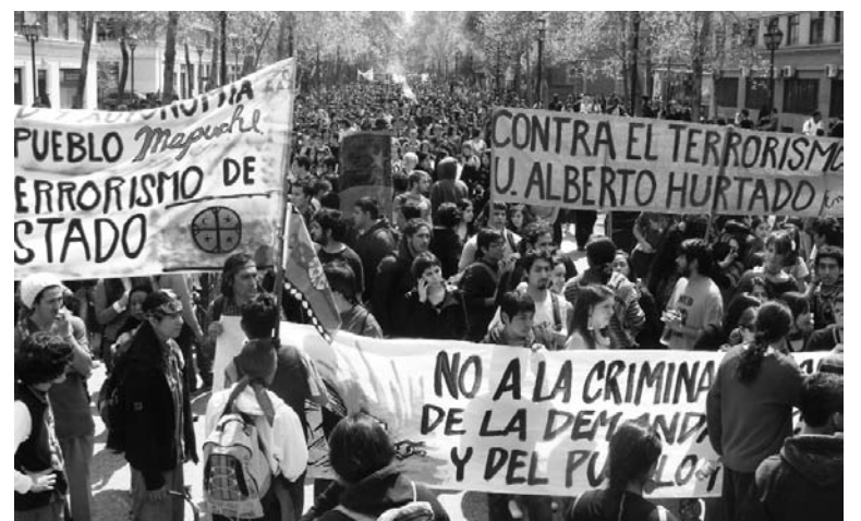
Marcha en apoyo al pueblo mapuche.

Tras la desarticulación de los comuneros y el objetivo de liquidar el Convenio 169, está la mano de los consorcios económicos y de las transnacionales. Su objetivo es saquear los territorios de los mapuches: explotar los recursos naturales como los bosques nativos, los minerales y la enorme reserva mundial de agua dulce que allí existe. La explotación