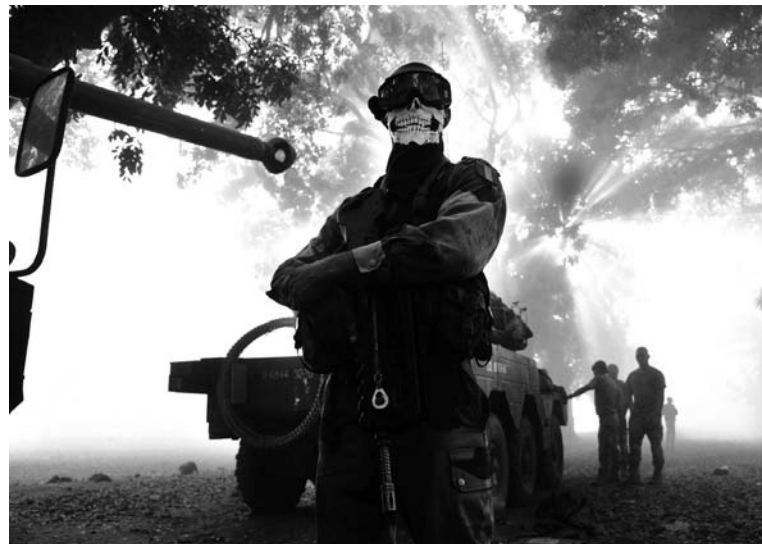
Soldado francés en Malí. La opresión imperialista, en su crisis, crea otro pantano de lodo y sangre.

Un portavoz de las guerrillas, en diálogo con El País (13/1), explicó que en el norte -dominado por ellos- han instaurado la ley islámica, la sharia, por la que han lapidado mujeres adúlteras y mutilado ladrones, y han prohibido escuchar música y beber alcohol, así como demolieron todo lo que consideraron símbolo de herejías. “No nos importa lo que opine Oc-