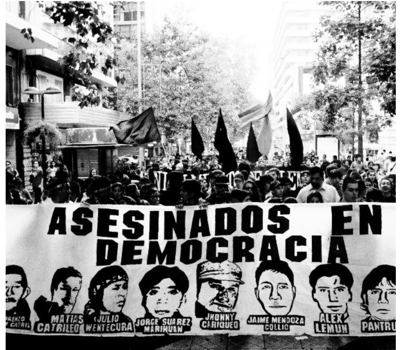
Marcha en defensa de la comunidad Qom