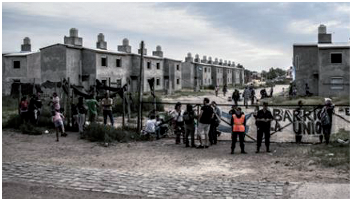
Estalló la lucha por la vivienda en Bahía Blanca.

El intendente Bevilacqua (FpV) acusa a los vecinos de usurpación. Su respuesta a la necesidad es la represión. Les ha cortado el agua y la luz, cuando en la ocupación hay chicos, mujeres embarazadas y bebés. Ha