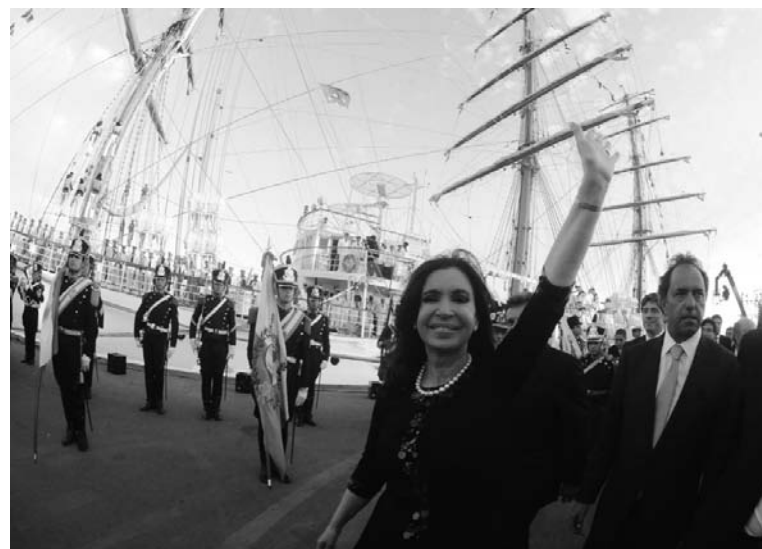
Cristina Kirchner, al recibir a la Fragata: "cuando no tengamos nada, pelearemos en pelotas". La cuestión de la deuda externa precipita una nueva crisis.

La certeza acerca del resultado oneroso del litigio, ha desatado una fuerte especulación contra la deuda de Argentina y, en consecuencia de ello, contra el peso. Los