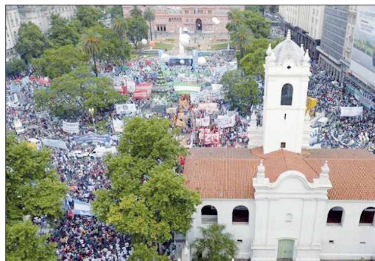
Panorámica de la Plaza de Mayo. Desde un punto de vista objetivo, la ausencia de una delimitación política concluye en una adaptación a la burocracia sindical y su política.

Bien visto, esta vez, más que nunca, el Frente de Izquierda debía desplegar toda su fisonomía. A nadie escapa que las reivindicaciones contra el impuesto al salario y otras ocultan la política de la dirección de la marcha de procesar un acuerdo opositor de carácter patronal. Para las reivindicaciones, no hay plan de lucha. Se ha sustituido la política revolucionaria por el sindicalismo. En las actuales circunstancias políticas sólo una columna del Frente de Izquierda puede cumplir el objetivo de establecer una clara delimitación política, solamente así podemos elevar la comprensión de las relaciones con obreros con 'prejuicios', que son un puñado. La batalla es de orden político y requiere separar aguas políticamente. El PTS boicoteó la marcha anterior por su carácter patronal, ahora da una voltereta redonda y no quiere siquiera plantar una diferenciación política plena. Gira hacia el