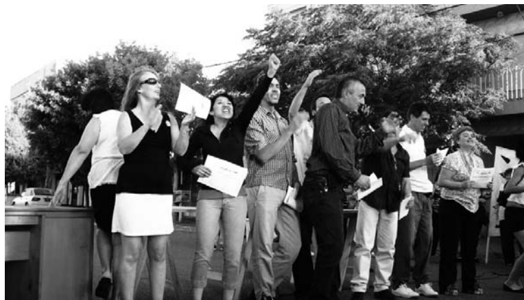
La nueva directiva de Aten.

"Porque hay un colectivo de lucha que se hace cargo de Aten para orientarla al servicio no sólo de los trabajadores de la educación, sino de la educación misma. Lo cual significa discutirle al gobierno las condiciones de dirección política de la provincia. Podemos. Quiero sacar las conclusiones más ricas posible de esta enorme victoria que es de ustedes, las conclusiones que más nos puedan servir para que unamos al movimiento obrero y al movimiento político de la izquierda y del socialismo que nos lleve a una gobierno de trabajadores y la unidad socialista en toda América Latina. Muchas gracias".