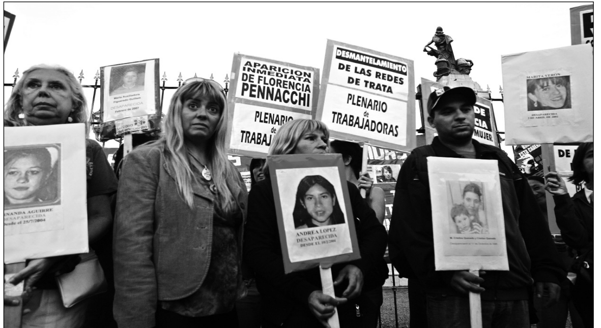
Después de ser cajoneada, se aprobó una modificación -por lo menos insuficiente- de la ley. El gobierno cedió contra su voluntad con la vana intención de descomprimir la indignación producida por el fallo -hasta el próximo escándalo.

que colocan a la Presidenta en las antípodas del proxenetismo, evidentemente se interesan por ciertas mujeres, no por las niñas y mujeres sometidas a prostitución. El jefe o la jefa de cualquier Estado es el primer responsable del tráfico de personas, incluso internacional, en su propio territorio. Los que gobernaron la patria chica K son los responsables de la protección a Las Casitas de Río Gallegos, desde el año 1989, y también del ingreso sin controles en su provincia de mujeres para ser explotadas, incluso desde otros países. Por último, ninguna ley eliminará la trata; solamente lo conseguirá la destrucción del aparato capitalista del Estado. No es casual que la trata de personas se haya convertido en el cuarto rubro en importancia en el comercio internacional. La Unión Europea es un paraíso de la trata de niños y mujeres del este del continente; lo mismo ocurre con los países del sudeste asiático.