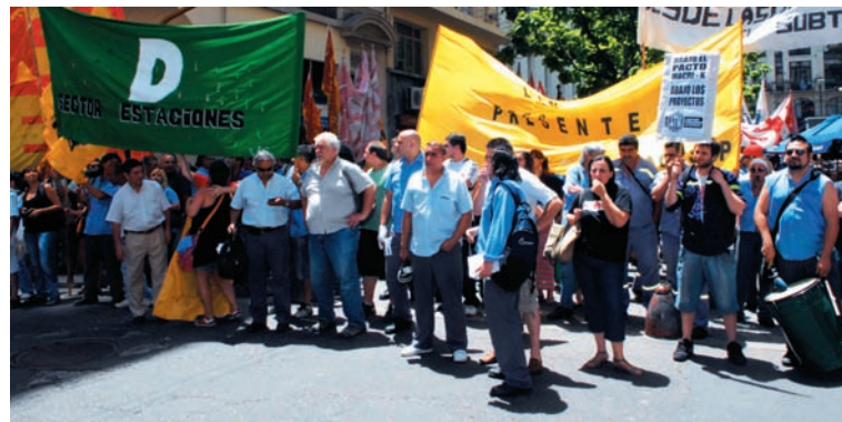
Movilización de los trabajadores del subte frente a la Legislatura.

Los bloques no K de la oposición, Proyecto Sur, FAP Lozano, CC, coincidieron con el traspaso, la tercerización del gerenciamiento a