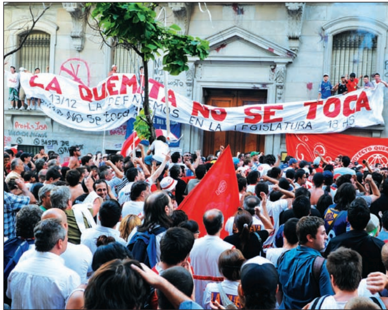
La hinchada de Huracán, en defensa de su club. Enfrenta un inmenso negocio en el que, una vez más, Macri y el gobierno nacional tienen intereses comunes.