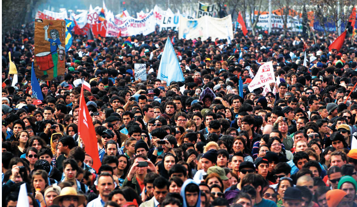
Marcha de los estudiantes chilenos. Una nueva oportunidad para el movimiento estudiantil, donde la demanda de educación pública y gratuita exige -más que nunca- la independencia política frente a las alternativas capitalistas.