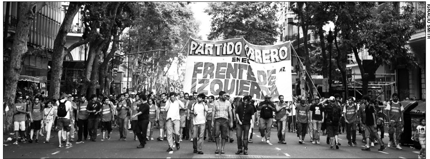
La columna del Partido Obrero en la marcha del 19 de diciembre.

Los organizadores llamaron a los caceroleros a la marcha del 19, pero no para sumarlos a las reivindi-