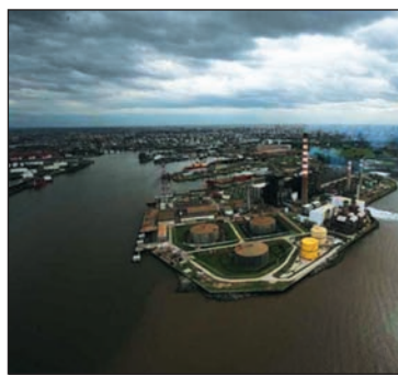
La Isla Demarchi.

-En la mesa, varios oradores plantearon la necesidad de darle continuidad a la huelga del 20 de no-