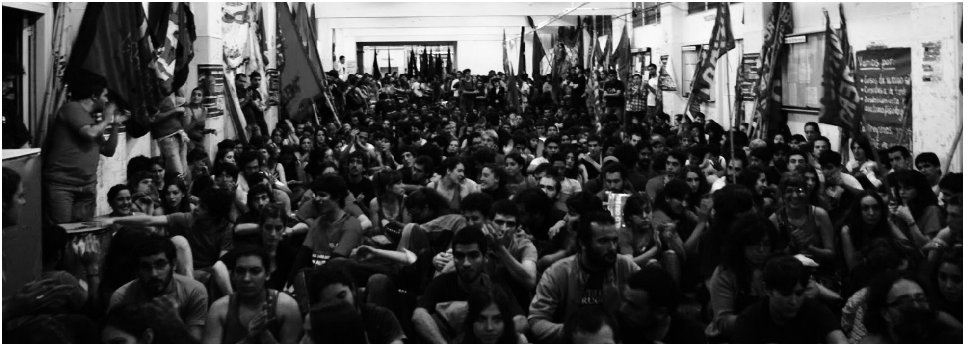
Asamblea de la Federación Universitaria de Buenos Aires. La UJS toma en sus manos la responsabilidad de impulsar un gran Congreso cuando se inician las clases.

La UJS planteó que el Congreso de la Federación debe realizarse una vez iniciadas las clases en 2013. Luego de un debate y una reflexión, revisamos nuestro voto en la Junta Representativa para realizarlo durante las fiestas. En primer lugar, hace a la tradición de la izquierda que los congresos de la Federación deben hacerse de cara a los estudiantes, no sólo para rendir cuentas de lo actuado sino también para impulsar el debate, la lucha y la movilización. Como señalamos en una declaración, no es un tema de calendario sino un objetivo preciso: impulsar la movilización del movimiento estudiantil contra el gobierno y su ajuste, y las camarillas universitarias y su intento de perpetuación en el poder. Además, debemos unir a los estudiantes junto a los trabajadores en lucha, y desarrollar una acción política y práctica demarcada de la oposición política tradicional, que representa intereses hostiles al pueblo. Dichos objetivos sólo son posibles mediante una deliberación masiva, algo que no puede hacerse en diciembre, con facultades vacías.