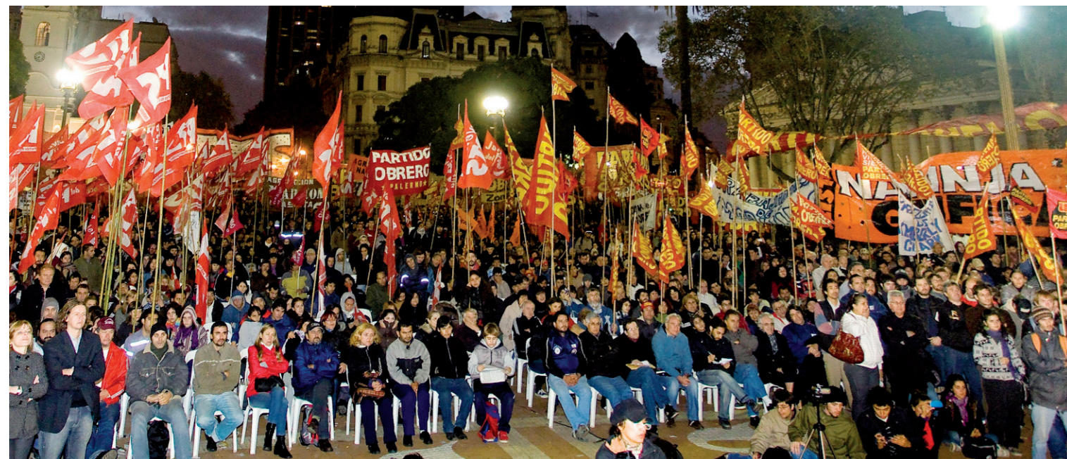
Acto del Frente de Izquierda en Plaza de Mayo.