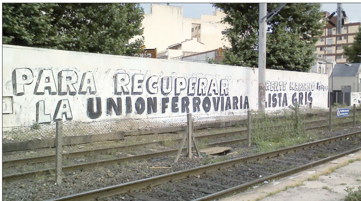
Pintada de la Lista Gris del Roca. Las lecciones de estas elecciones tiene que servir al desarrollo del movimiento clasista.