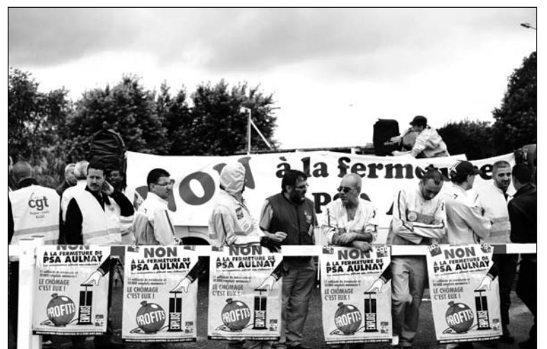
Protesta en Peugeot.

cierre y el despido de 600 trabajadores. Los altos hornos de esa planta se encuentran paralizados desde el año pasado. No apareció ningún privado interesado, por la simple razón de que se excede a la capacidad de la industria en más del 50 por ciento. El desplome de la industria de la construcción y de las terminales automotrices ha golpeado fuertemente a la industria siderúrgica. Las arcas del Estado están exhaustas (la deuda pública se acerca al 100% del PBI). El espectáculo de París en penumbras por un apogón planificado por el gobierno, en una búsqueda desesperada de achicar la erogación que representa la importación de energía, habla por sí mismo.