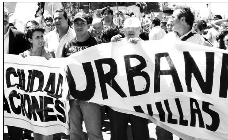
Marcha contra el negociado. Una tentativa de reorganización de la Ciudad en favor del capital financiero.

En este cuadro, el repudio masivo que se ha expresado en las au-