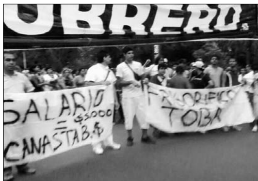
Obreros del Frigorífico Toba.

Pero el gobierno se juega hasta el final para quebrar la organización de los trabajadores y se niega a dar el alta a todos los compañeros del ex Toba, por lo que deja afuera a la comisión interna y a otros compañeros. En total, sumamos 50 despedidos. También llegaron despedidos en distintas localidades. Tanto la reapertura del frigorífico Toba como la de Gran Chaco implicaron, además de los despidos, un retroceso en las condiciones laborales de quienes ingresaron. El frigorífico fue reabierto a tra-