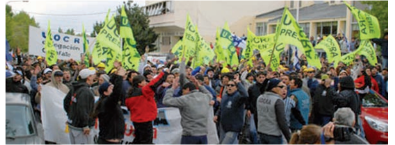
Patota de la Uocra en Río Gallegos, contra los trabajadores. El sindicato de los obreros de la construcción ya no es una organización sindical, se parece mucho más a una asociación ilícita.

ner la democracia sindical, terminar con las patotas sindicales. Impulsar la creación de una federación nacional de los trabajadores de la construcción, donde las decisiones generales sean tomadas en