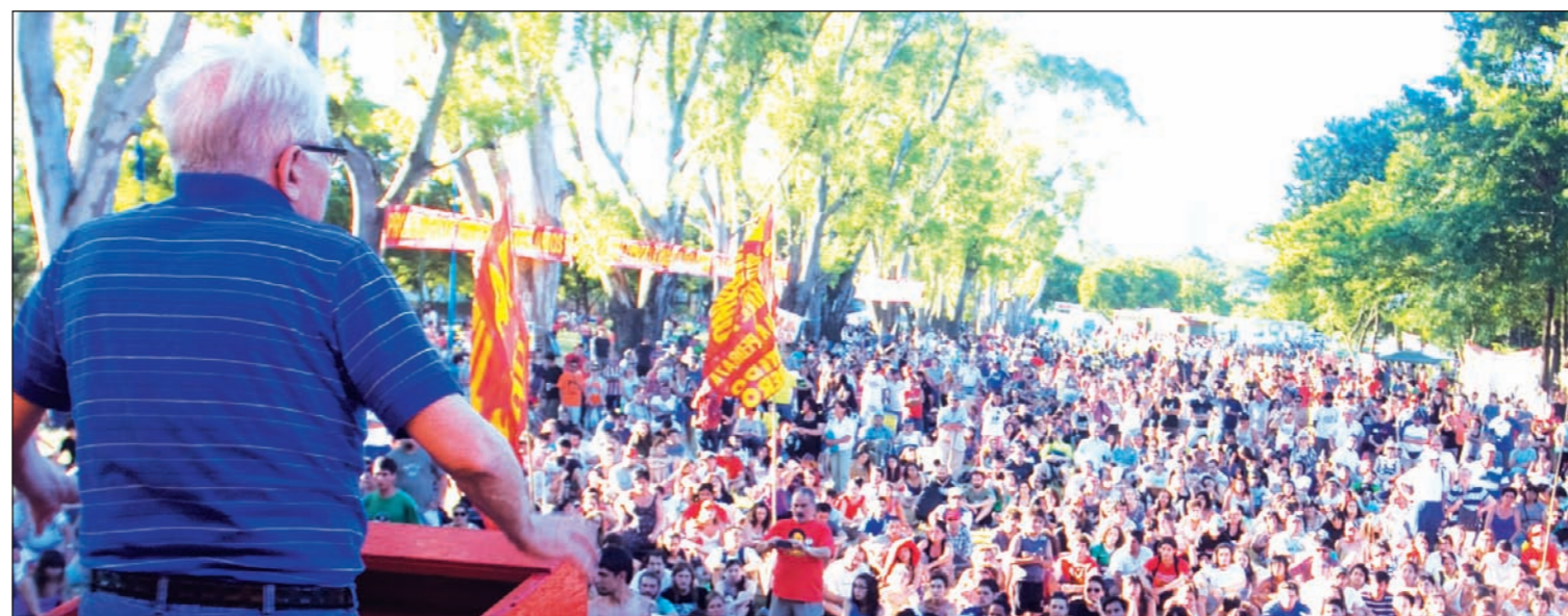
Una multitud en el cierre de la jornada. "Tenemos que hacer nuestro planteamiento de poder".

Mariano Ferreyra sigue siendo -y lo será más todavía con el tiempo- la figura de la juventud luchadora argentina. Celebramos este año una lucha que no concluyó (...). Estamos creando la conciencia de que el aparato del Estado es, en definitiva, un aparato de represión para mantener sojuzgada a la clase