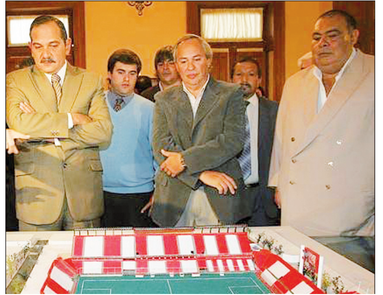
El gobernador José Alperovich con la "Chancha" Ale. El caso Marita hunde sus raíces en el corazón del régimen.