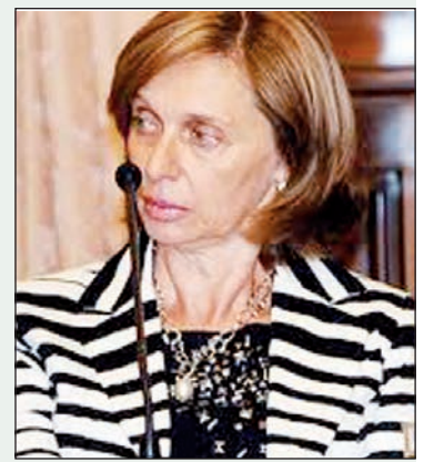
Beatriz Alperovich. La senadora oficialista es la segunda en la sucesión presidencial.

Casi presentándose como una "perejil", la jueza resumió las relaciones entre la prostitución y los poderes políticos, empresarios y policiales: "me pregunto, las grandes cadenas, los hoteles cinco estrellas, ¿en algún momento hay