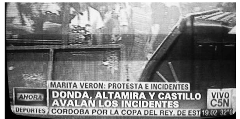
Captura de la pantalla de C5N. La prueba de la provocación.

Denunciamos que la policía aprovechó los incidentes para desatar una brutal represión contra el conjunto de la manifestación, con un único y claro