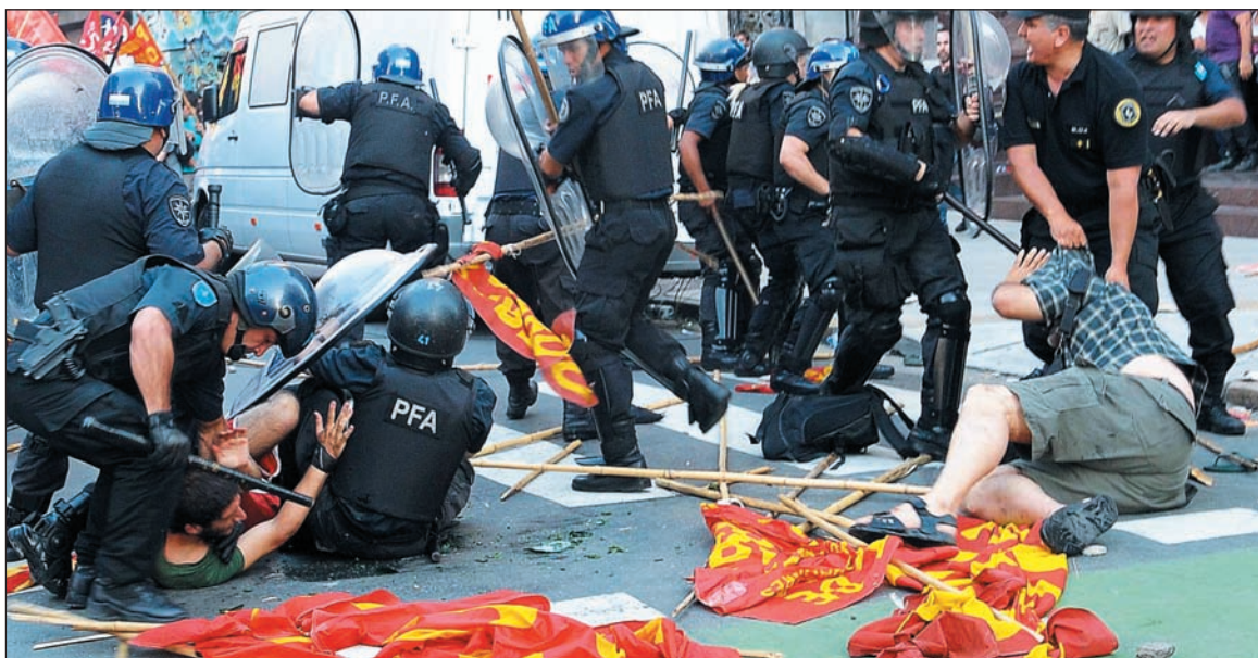
Represión durante la marcha en Buenos Aires.