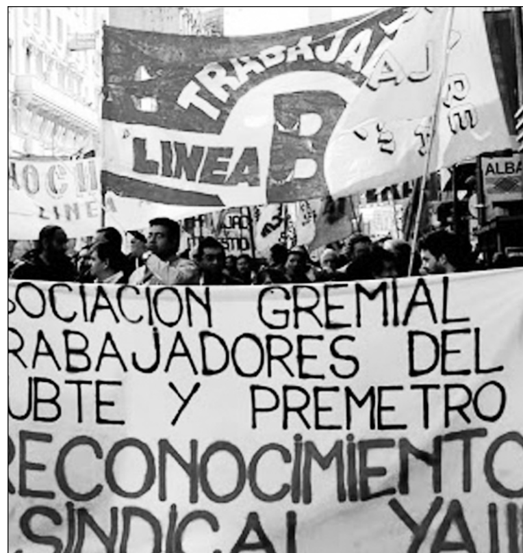
Movilización de los trabajadores del subterráneo, en defensa de su gremio. Defendamos las conquistas de los trabajadores del subte, que son de todo el movimiento obrero.

quier caso, el macrismo ha dado sobradas muestras de que va a arremeter, artículo más, artículo menos, contra los trabajadores y contra la AGTSyP. Lo hace con los docentes, con los trabajadores del Colón, con los estudiantes. Los trabajadores del subte de la Agrupación Trabajadores de Metrovías vienen librando una gran campaña por el retiro de los proyectos legislativos y el reconocimiento del sindicato del subte, sin tarifazo, sin impuesto y sin tocar las conquistas de los trabajadores. Por la anulación de la concesión a Roggio y la investigación de sus cuentas y destino de los fondos. Este reclamo va indisolublemente unido a la exigencia de que el ministerio de Tomada otorgue la inmediata personería gremial para la AGTSyP, única organización legítima de los trabajadores del subte. Macristas y kirchneristas reconocen a la burocracia de la UTA como representación gre-