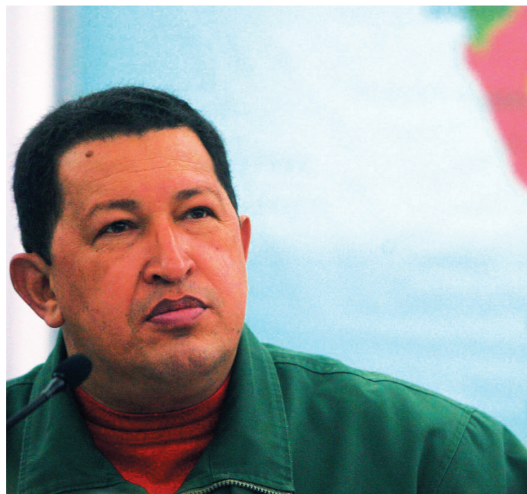
Chávez. Una salida del presidente colocaría al régimen venezolano ante la disyuntiva de convertirse en militar o co-gobernar parlamentariamente con la oposición.