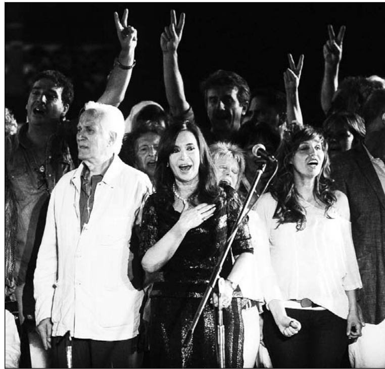
Cristina Kirchner en el festejo que no fue. Otro golpe al "gobierno del 54 por ciento".