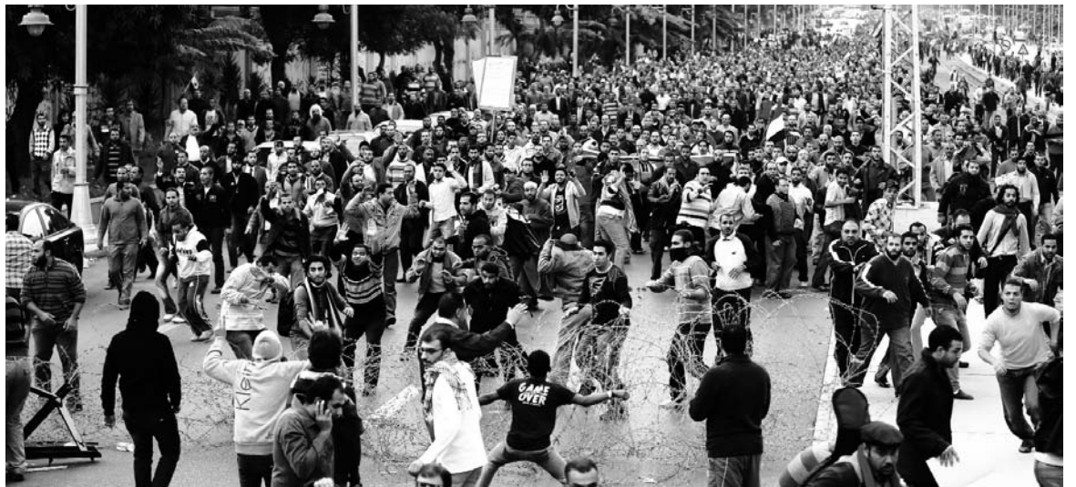
El pueblo en las calles reclama una Asamblea Constituyente libre y soberana. Ha quedado diseñada una situación revolucionaria.