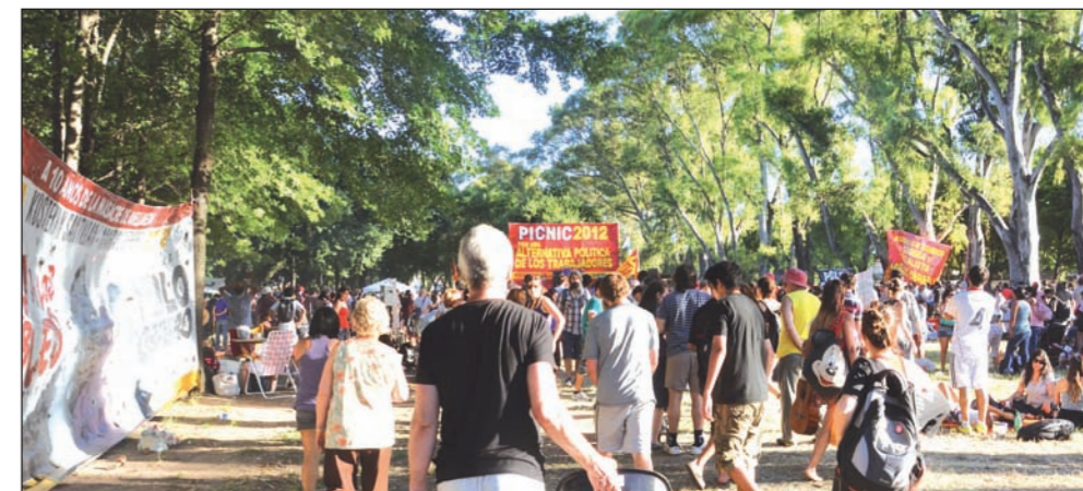
Una fiesta de la clase obrera. Miles de personas participaron de las diferentes actividades políticas, culturales y deportivas.

A nosotros nos importa, en ese sentido, la experiencia internacional. Que un partido de la izquierda reformista en Grecia, que se pasó toda la vida en el 3 ó 4%, en dos semanas pasara al 26%; que lo mismo haya ocurrido en Galicia y en Cataluña, en grados diferentes, nos está avisando que el ritmo del ascenso de la izquierda no es lo que era: empieza a ser veloz. Esa izquierda que asciende es re-