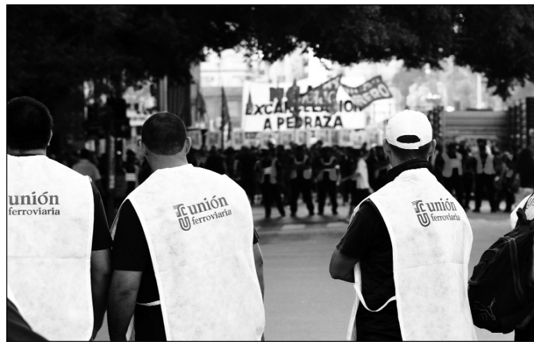
La patota de la Unión Ferroviaria. Ante la contundencia de las pruebas, sólo una fuerte presión del poder político podría torcer un veredicto condecoratorio.