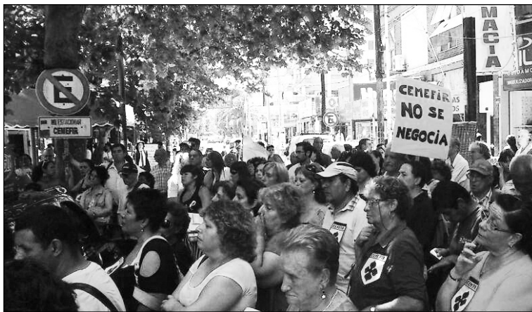
El ataque a la atención materno infantil está en el centro de la política de ajuste de Scioli

La concentración convocó a organizaciones del FAP como Libres del Sur, CCC y concejales del GEN, además del PRO. Los concejales del FAP, por un lado mencio-