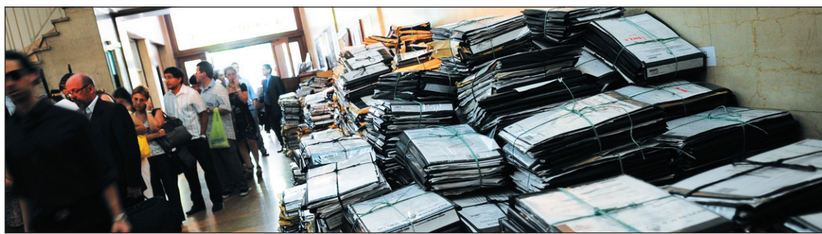
Miles de juicios de jubilados parados, mientras pagan la deuda con la plata de la Anses.

Si además se tiene en cuenta que el 60% de la deuda pública se encuentra nominada en dólares, se puede asegurar que la deuda propiamente externa, bien calculada, oscila en torno de los 150 millones de esa moneda.