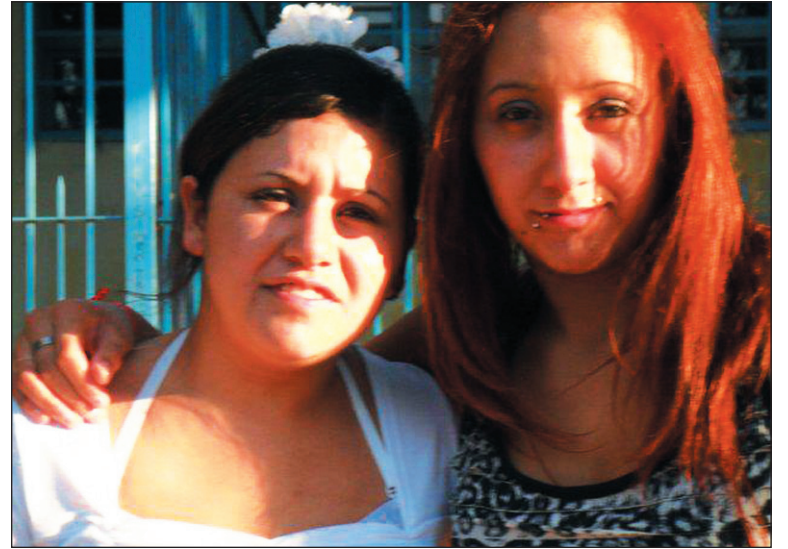
Las Hermanas Jara.

No hay vuelta que darle: la opresión de género es un pilar del capitalismo, que bajo la crisis propia del sistema asume las formas más bárbaras. Existen cientos de casos aún impunes. Debemos movilizarnos por nuestros derechos de manera independiente a las va-