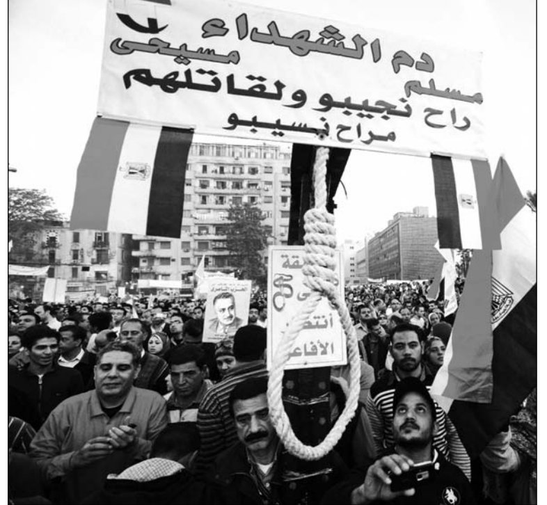
Egipto se encuentra en su punto de mayor ebullición política desde la caída de Murabak.

La situación es explosiva. Morsi podría convocar a un gobierno de unidad nacional, pe-