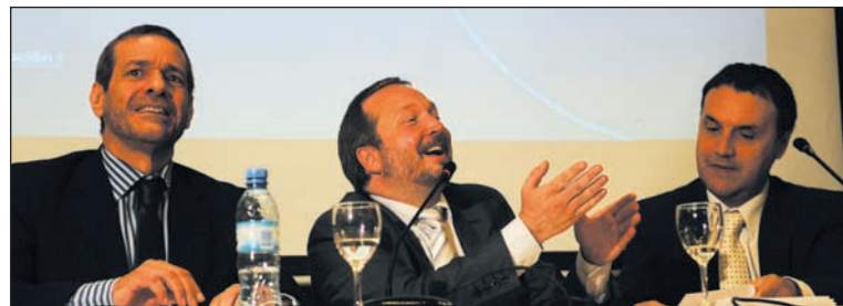
Sabatella recomienda "desinvertir" en parientes.

En el entrevero, la oposición patronal, en especial la de centroizquierda, ha cerrado filas con Clarín. Para conquistar la li-