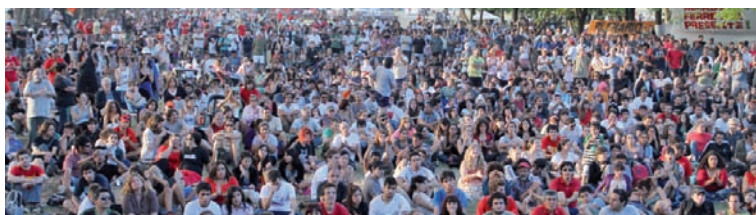
Más de 6.000 personas participaron del cierre del picnic 2011.