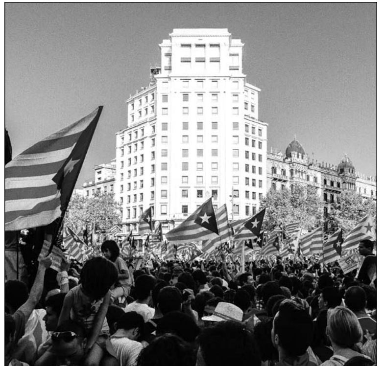
Mobilización por la independencia en Barcelona, dos meses antes de las elecciones. El oficialista CiU paga el precio de su política de ajuste, crecen los votos de la izquierda.