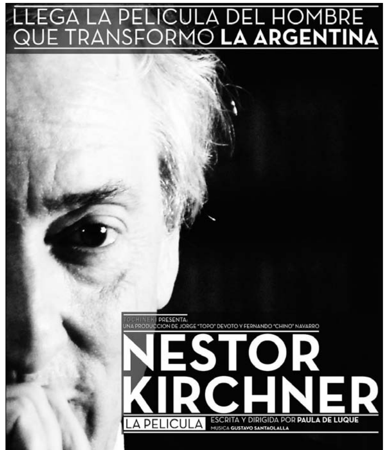
"Néstor, la película". El film de Paula de Luque reitera la pobreza creativa de todo producto "cultural" sometido a la vara de la regimentación estatal.

como representación o continuidad del proceso popular que llevó al Argentinazo, del cual fueron sus verdugos. (CFK acaba de evocar a "Kosteki y Santillán"... para oponerlos imaginariamente a la huelga del 20N). Pero la peor manipulación del film se presenta hacia el final: mostrando las vías y estaciones del tren, se hace referencia al asesinato de Mariano, e inmediatamente después aparece la gente llorando y movilizada. Pero no por el crimen de Mariano, sino por la muerte de Néstor. Esta usurpación apunta a otro de los conocidos relatos oficiales: Néstor Kirchner habría muerto por el disgusto causado por el crimen de Mariano. Pero incluso si fuera así, esa crisis política y personal del ex presidente debería ser caracterizada. "No sería la primera vez que las contradicciones insuperables de una política y de un régimen político se cobren la vida de su articulador" (El Partido Obrero ante la muerte de Néstor Kirchner, 10/2012). Kirchner se encontró con un asesinato cuyos culpables estaban afincados en la columna vertebral del armado oficial. La película recorta el cimbronazo político y la reacción popular que desató el cri-