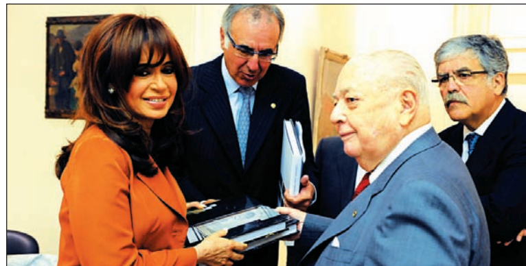
CFK y Blaquier, otros tiempos.

Decenas de testigos han declarado que los secuestros se hicieron en camionetas de la empresa. Este año, en un allanamiento a las oficinas comerciales de Ledesma, se encontraron carpetas con informes sobre trabajadores, activistas, vecinos y organizaciones so-