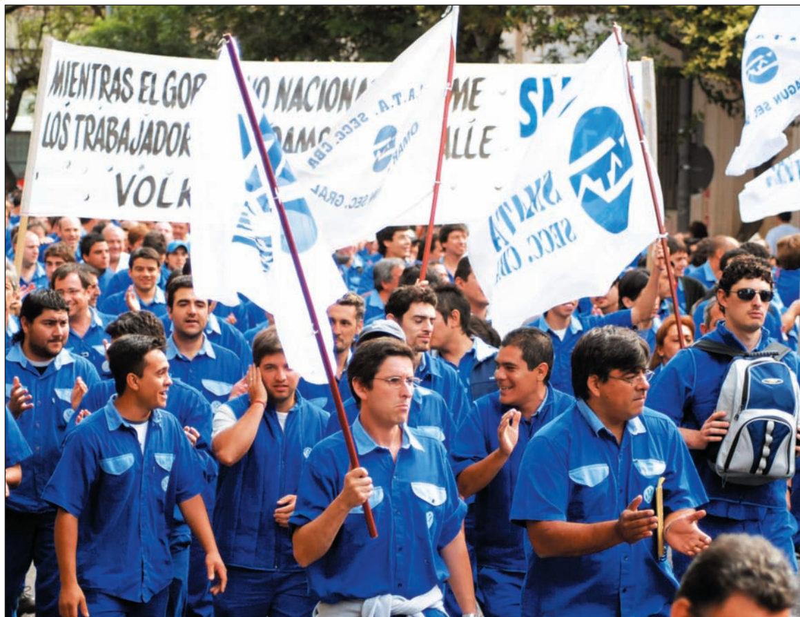
Trabajadores de Volkswagen de Córdoba.

Aunque su campaña fue "por un cuerpo de delegados independiente", no lograron trasponer la acción declamativa de este postulado para transformarlo en una lucha política y programática concreta. En el programa de la