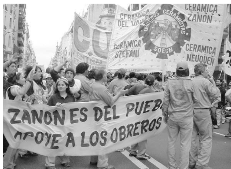
Fasinpat, otro paso de la lucha. En medio de la crisis, el Estado deja librada a la cooperativa a la competencia capitalista, está planteada una pelea en defensa de la gestión obrera.

Sin embargo, Fasinpat asumirá ese traspaso en el momento más difícil de Zanón. En el marco de la caída abrupta de la construcción y sin renovación tecnológica, el Estado deja a la cooperativa de Zanón librada a la competencia capitalista. Al celebrar el traspaso, directivos del SOECN han señalado que ahora se estaría en condiciones de solicitar préstamos para la renovación tecnológica. Los préstamos, sin embargo, reforzarán la dependencia de la gestión obrera respecto del mercado y -en este caso- del capital financiero, que sólo facilitará recursos a