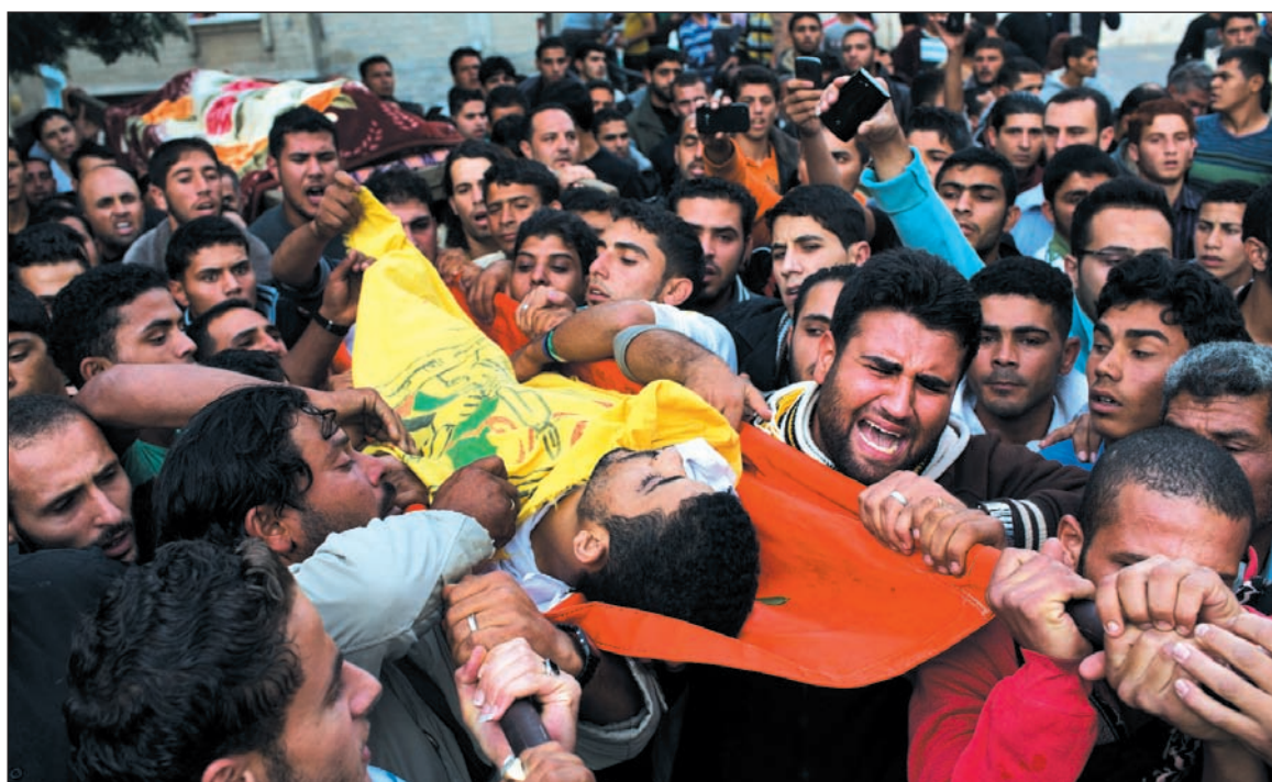
Imágenes del ataque de Israel. Manifestamos nuestra solidaridad incondicional con el pueblo palestino y su derecho a la autodeterminación y convocamos a redoblar la movilización nacional e internacional para derrotar esta nueva escalada.

primer ministro de la Autoridad Nacional Palestina, en caso de que prosperase la aprobación de dicha propuesta. La escalada militar contra Gaza es también un tiro por elevación contra Irán: Israel no oculta sus preparativos bélicos para atacarlo. Con estas nuevas matanzas, el Estado sionista quiere reafirmar su papel de gendarme del imperialismo en la región, a pesar de las convulsiones políticas y sociales planteadas por la revolución árabe.