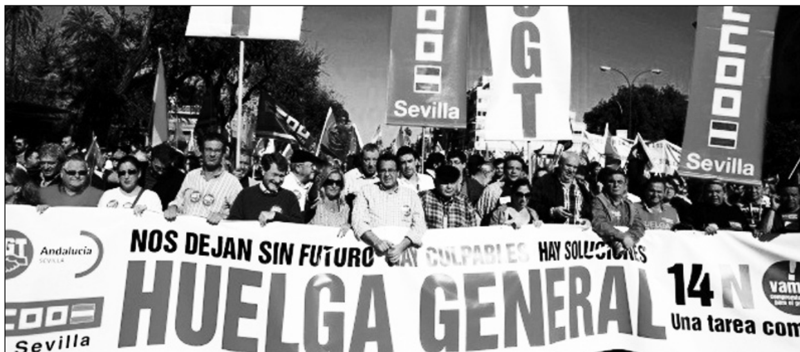
La huelga y más de cien marchas paralizaron a todo el Estado español.

La desacreditada burocracia sindical se encuentra entre la espada de la ofensiva del gobierno y de la patronal y la pared del creciente descontento popular. Enseña los dientes al gobierno para demostrar que sigue siendo necesaria como apagafuegos social, pero es consciente de que el malestar y la radicalización pueden llevar las cosas mucho más lejos de lo que le interesa. La división y el sectarismo de