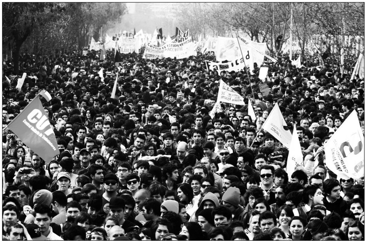
La gran lucha educativa influyó decisivamente en el resultado electoral.

La elección municipal dio una ventaja significativa a la Concertación en cantidad de alcaldes en comunas importantes -como Santiago y Concepción, donde se derrotó a la derecha dura-: en los comicios de 2008 la Concertación había conseguido 147 alcaldías mientras que en esta logró 170. Pero este fenómeno político no es consecuencia de una alternativa política que la Concertación haya planteado ante las masas, para hacerle frente a las medidas del gobierno de Piñera. De ninguna manera, porque ambas corrientes políticas son variantes distintas de la burguesía y están empeñadas en sostener, de una o de otra forma, al sistema capitalista en crisis. La ventaja que recibió en bandeja la Concertación se debió al malestar de las masas explotadas ante la serie de medidas económicas en contra de los trabajadores y del estudiantado, y al endurecimiento de la represión policial contra las manifestaciones estudiantiles. La lucha del movimiento estudiantil por la educación gratuita y por el fin al lucro se