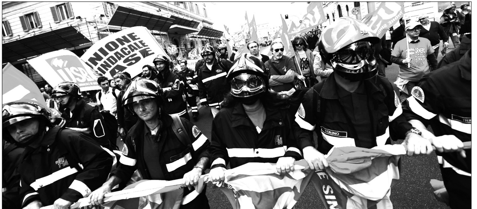
Bomberos marchan contra el ajuste. El gobierno "técnico" sigue recibiendo el apoyo de la derecha y de la "izquierda".

El gobierno suprimió 35 provincias para bajar el gasto público y el déficit; y el Parlamento aprobó una nueva ley anticorrupción. La supresión de 35 de las 81 provincias con estatuto ordinario y de organismos intermedios entre los 8.300 municipios y las veinte "regiones" sería el primer paso para realizar una reorganización de la administración territorial, supuestamente para combatir el derroche de recursos públicos. A eso se agrega una corrupción