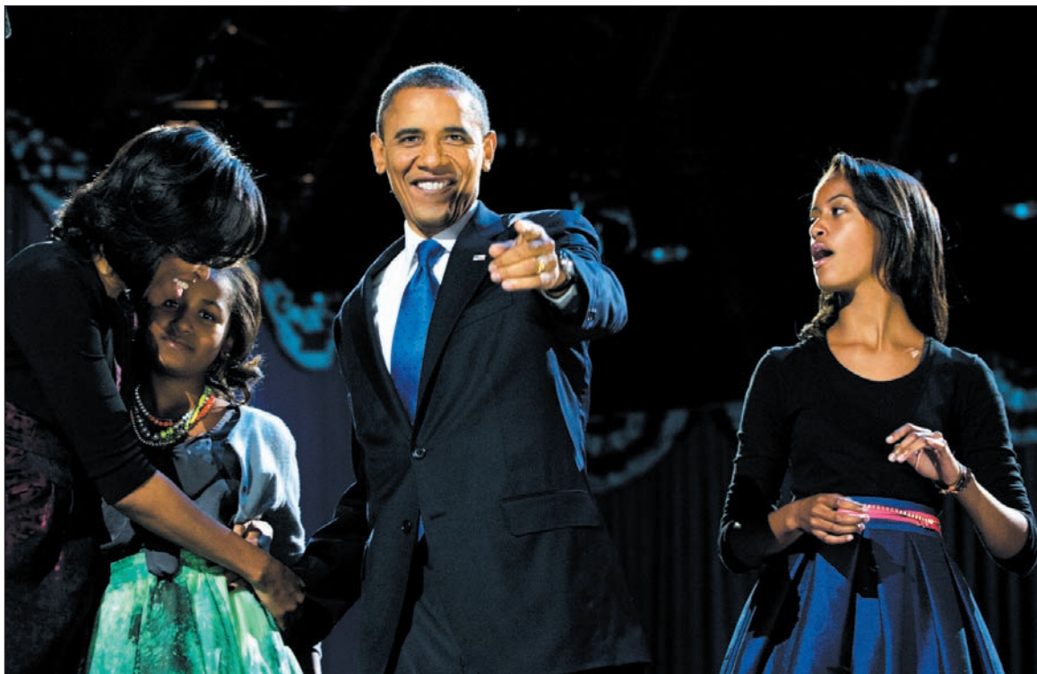
Barack Obama festeja los resultados electorales con su familia. Aunque el demócrata logró la reelección, su segundo mandato deberá enfrentar una agudización de la crisis mundial y la impasse del régimen político norteamericano.

En estos meses, se destacó mucho el hecho de que los grandes aportistas capitalistas habrían abandonado a Obama en rechazo a su -tibia- reforma financiera. Pero el apoyo económico que tuvo la campaña de Romney no puede ser leído como un cambio de frente del conjunto de la burguesía. Obama terminó recaudando casi lo mismo que Romney, en una campaña electoral que superó todos los límites