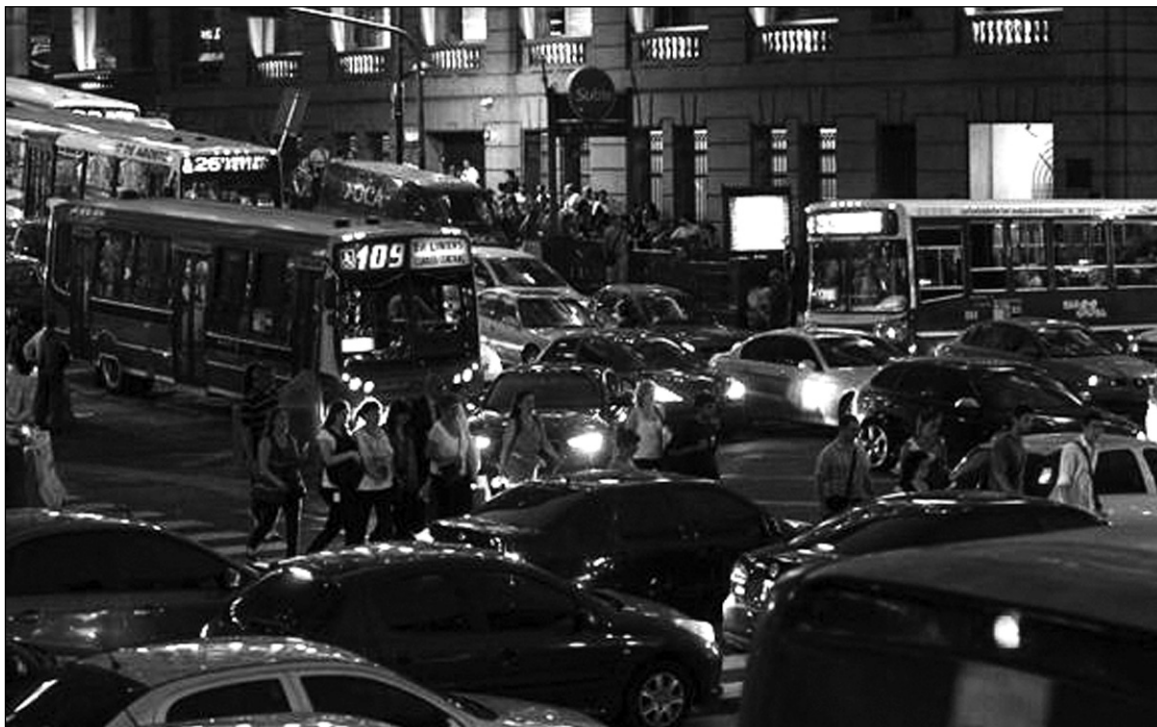
Colapso de tránsito durante el apagón en la Ciudad de Buenos Aires, consecuencia del desfalco de las privatizadas.

Una 'normalización' con Repsol no resolvería, de todos modos, las demás exigencias de los monopolios petroleros. Pero cargaría sobre YPF una nueva hipoteca, que reforzará la tendencia a los tarifazos.