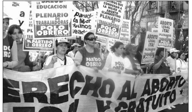
Movilización por el derecho al aborto. En la interna del gobierno K, hace mucho tiempo que los derechos de las mujeres han perdido la pelea, hay que redoblar la lucha independiente.

La única vía posible para encarar una lucha real y sincera contra los bloqueos al aborto no punible, de los que ahora se queja Pichetto, es la aprobación del