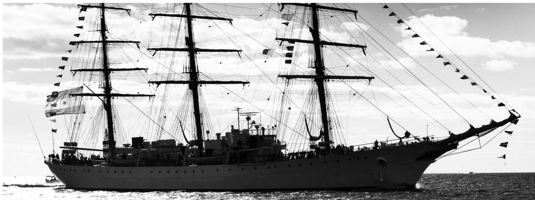
Fragata Libertad, secuestrada. Un Estado soberano debería nacionalizar la jurisdicción de la deuda y suspender indefinidamente su pago.

De lo contrario, como hay que esperar, el secuestro de la Fragata Libertad será otra evidencia del naufragio nac&pop.