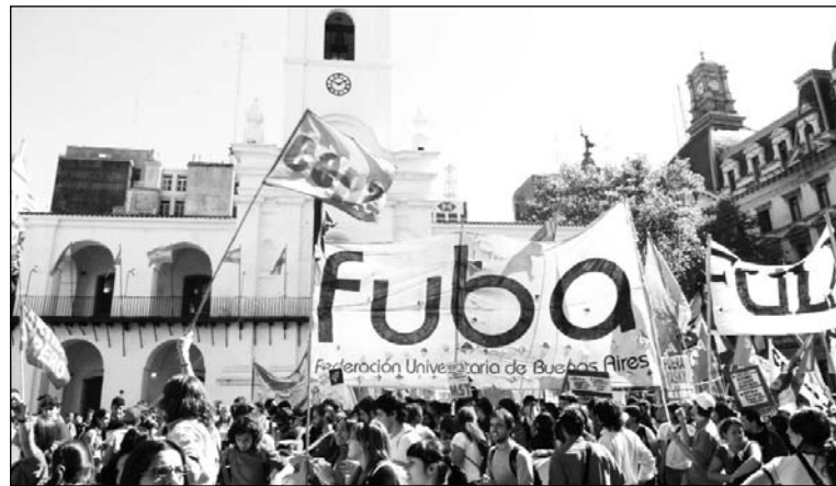
Culminan las elecciones en la UBA. Los resultados plantean el desarrollo de un plan de lucha y una campaña por la realización del Congreso de la Fuba, en forma inmediata.

Con la votación ya realizada en once sobre trece centros van cerrando las elecciones estudiantiles en la UBA. Sólo restan Psicología -la semana del 29 de octubre- y Agronomía -a partir del 15 de noviembre. El principal derrotado es el gobierno; un retroceso de las listas de La Cámpora y de sus aliados en todas las facultades, incluidas aquellas donde su aparato administrativo y profesoral es mayor. El revés afecta la política de armar una Fuba paralela, y a todo el bloque que oportunamente quitó quórum a la Fuba -un acuerdo entre K, radicales, PS y PRO. Franja Morada, si bien mantuvo aquellas facultades que ya conducía, no puede exhibir nin-