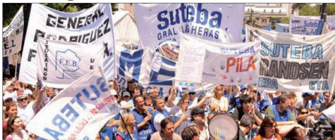
Marcha docente. Hay que superar los paros aislados y la división de los aparatos sindicales.

Esta semana, el Frente Gremial de Suteba y FEB convocan paros de 48 horas para los días 23 y 24 de octubre; y Udocba, a otras 48 horas los dos días siguientes. En las escuelas crece la decisión de los docentes de ir a la huelga los cuatro días, lo que es testimonio de que la base quiere ir a una lucha contundente por la reapertura de las paritarias, por el aumento de nuestros salarios para