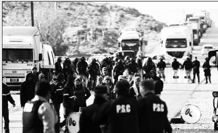
Violento desalojo policial en Caleta Olivia. Veintiseis compañeros siguen detenidos e incomunicados.

El lunes 22 de octubre, la policía provincial desalojó brutalmente a los trabajadores de Fundación Olivia, que se encontraban en la ruta, reclamando el aumento salarial, firmado a nivel nacional del 25%, y que aún el gobierno de Santa Cruz no cumple.