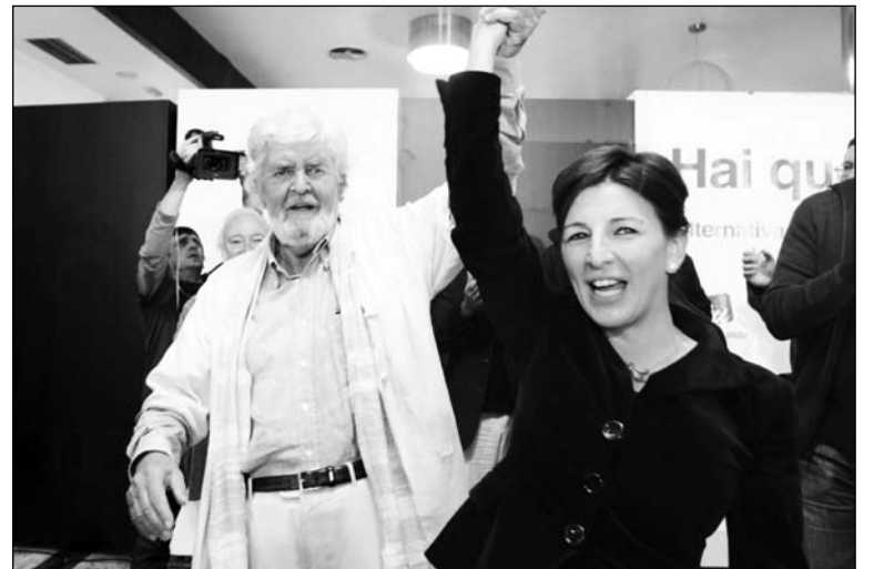
Los dirigentes de Alternativa Galega de Esquerda celebran su votación. El resultado electoral ha agudizado las contradicciones políticas.

El saldo de la elección del domingo apunta hacia una agudización de las contradicciones: mientras Rajoy pretende utilizar el triunfo del PP en su tradicional bastión de Gali-