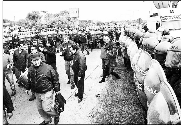
Los trabajadores de la línea 60 y la gendarmería. Se discute un plan de lucha para torcerle el brazo a la empresa, que actúa con la complicidad del gobierno.

Los delegados y trabajadores de la 60 vienen sufriendo el ataque patronal hace tiempo, incluyendo amenazas a delegados, aprietes de las patotas de la UTA