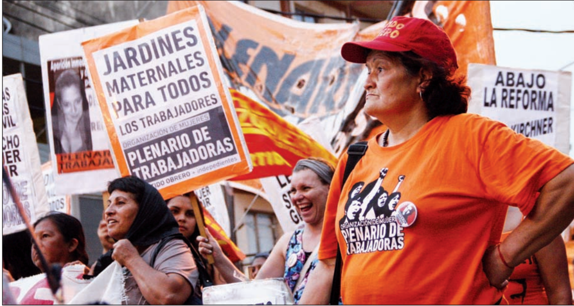
El Plenario de Trabajadoras en Misiones. Hay que reconstruir el Encuentro de Mujeres sobre nuevas bases.

En Misiones, entre el 6 y el 8 de octubre, se realizó el Encuentro Nacional número 27. Funcionaron 118 talleres en los que discutieron unas 4.300 mujeres. Se reunieron once talleres de aborto y anticoncepción, que nuclearon a unas 500 mujeres, otros cinco talleres sobre estrategias para el aborto legal; cinco sobre trata de personas, nueve entre mujer y sindicatos y mujer y trabajo. Mujeres y violencia reunió doce talleres; mujer y organización barrial y mujer y educación reunieron cuatro talleres cada una. Mujeres e identidad nucleó tres talleres, igual que mujeres y derechos humanos, mujer y sexualidad y mujer y salud. El taller único de mujer y pueblos originarios reunió a unas 350 mujeres. El resto de las temáticas nuclearon uno o dos talleres cada una, llegando así a los 118 talleres.