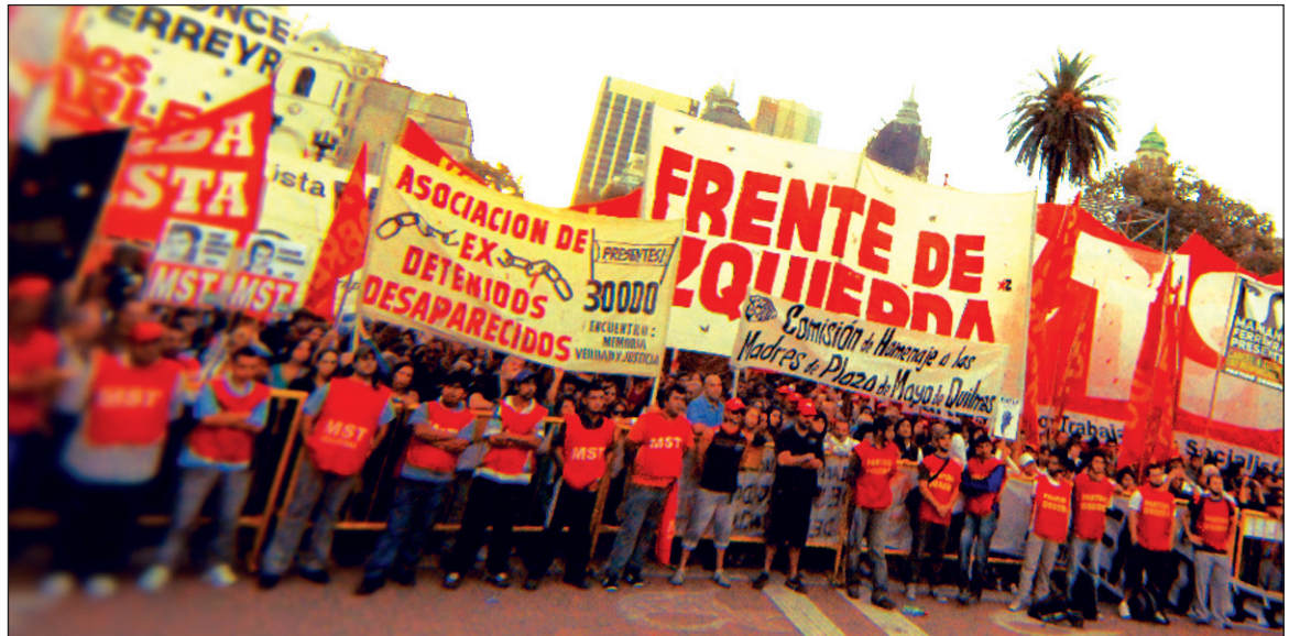
El Frente de Izquierda en el acto del 24 de Marzo. De choque en choque, la crisis de la economía y de la política se acentúa sin pausa; la izquierda, por su condición revolucionaria, tiene que tomar la iniciativa política.

Este vacío político ofrece una oportunidad singular al Frente de Izquierda. La izquierda, por su condición revolucionaria, debe tomar la iniciativa política y delimitar en sus propios términos (no en los que presentan los campos patronales), los verdaderos (históricos) campos en disputa. Sin embargo, ocurre lo contrario: el Frente de Izquierda está paralizado por los acontecimientos, incluso va a la rastra de ellos y hasta lo hace con yapa, porque no acierta en adoptar una posición común frente a ninguno de los episodios políticos de los últimos meses y, lo que es mucho peor, no se advierte un propósito de clarificar las diferencias de caracterizaciones y tácticas con vistas a reivindicar y destacar su objetivo estratégico, que es convertir a la política nacional en una lucha de clases y avanzar hacia un gobierno de trabajadores. El Frente de Izquierda debería tener a corto plazo su definición político-programática electoral y su lista de candidatos.