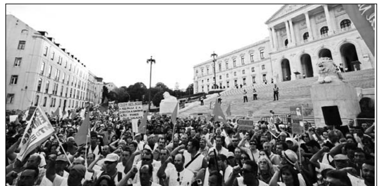
Un millón de personas contra el ajuste. Las movilizaciones más grandes desde la revolución de 1974.

El opositor Partido Socialista plantea un "ajuste" (corrección) en el memorando exigido por la Troika, como única manera de hacer-