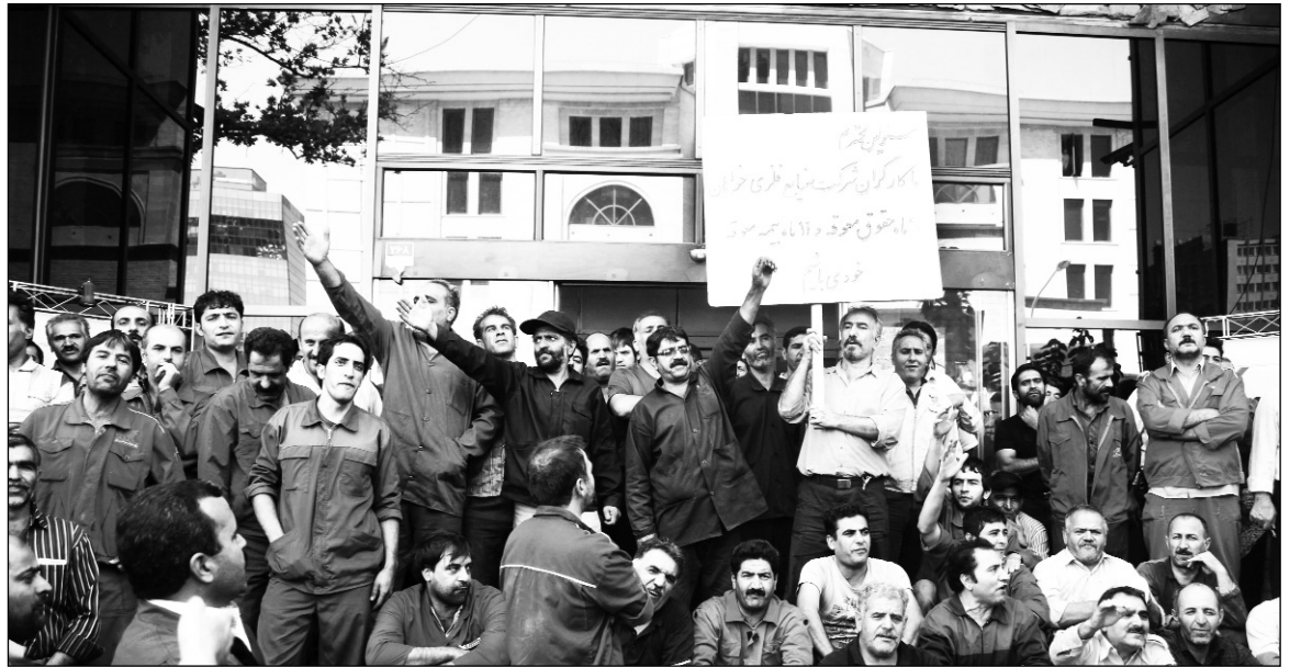
Protesta de trabajadores por salarios atrasados. Si progresa el desorden monetario y la crisis agraria, el escenario más probable es un levantamiento de masas.

El doble mercado de cambio brinda un gran beneficio. Lo aprovechan organizaciones pertenecientes al régimen -como podría ser Sepah. La importación de algunos productos básicos y el transporte a los países vecinos no registrados como exportaciones son una fuente fundamental de ingresos.