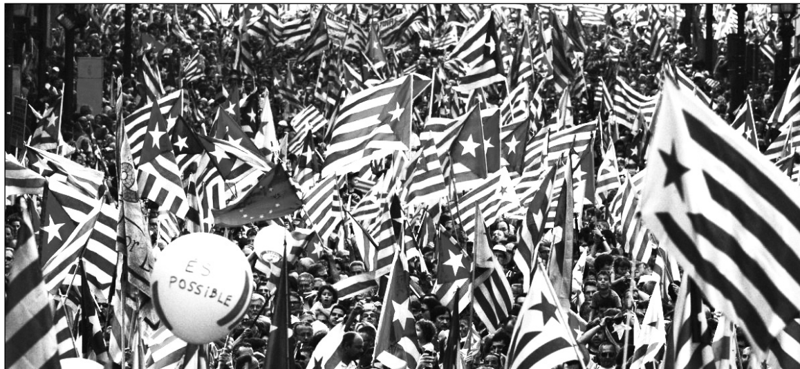
Convocatoria nacionalista en Barcelona. La crisis del Estado español sigue profundizándose sobre el telón de fondo de la bancarrota económica.

El eje de la crisis política está planteado en torno de la cuestión de la independencia de Cataluña. Luego de la manifestación nacionalista del 11 de setiembre, el gobierno regional disolvió el Parlamento -al cual le quedaba aún más de un año de mandato- y adelantó las elecciones para el 25 de noviembre. El objetivo de Convergència i Unió (CiU) -partido de la derecha catalana, actualmente en el gobierno- es montarse en el clima favorable al independentismo para obtener un triunfo abrumador, que deje en manos de la gran burguesía catalana la negociación de competencias entre Cataluña y el Estado español. Artur Mas -actual "President", que buscará su reelección- ha prometido que una victoria lo habilitará a convocar a un referéndum, que preguntará a los ciudadanos si desean que Cataluña sea "un nuevo Estado de Europa". Un planteo interesante, porque eliminaría la intermediación del Estado español en la sujeción de las naciones europeas por la Troika que componen el Banco Central Europeo, el FMI y la Comisión Europea. En lugar de una Federación Ibérica Republicana de naciones, el gran capital fantasea con una nube de mini Estados sometidos a un protectorado extra nacional. De todos