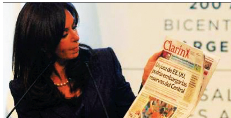
Cristina Kirchner, en uno de sus ataques a Clarín. Ambos bandos dicen defender la "libertad de prensa", pero defienden el monopolio de los medios de las grandes empresas o del Estado.

El grupo Clarín se opone a la 'desinversión' que establece la ley de medios para todos los grupos mediáticos que superan determinada cantidad de licencias. El kirchnerismo ha ofrecido a otros grupos capitalistas el desguace del grupo de Magnetto. Las telefónicas podrían ser las grandes beneficiarias del negocio de cable, debido al cableado de la red telefónica. CFK siempre señaló que las telefónicas serían las grandes beneficiarias de un negocio que ofrece telefonía-televisión-Internet. Esto demuestra que el gobierno no busca la transparencia ni la igualdad, sino quebrar a un medio políticamente rival, que influye en las decisiones electorales. Clarín protesta diciendo que, mientras a las operadoras de cable se les pone un límite de 24 licencias locales, a "sus competidores (DirecTV o las empresas telefónicas), les permite llegar a las 2.200 localidades del país con una sola licencia. Esta discriminación es uno de los motivos del juicio de fondo por inconstitucionalidad". Clarín también se queja porque los extranjeros podrán tener más licencias que los grupos locales. También está en desarrollo una rama de negocios vinculada con la producción de contenidos en múltiples plataformas. El grupo Time Warner acaba de instalar su base de operaciones para América Latina en Bue-