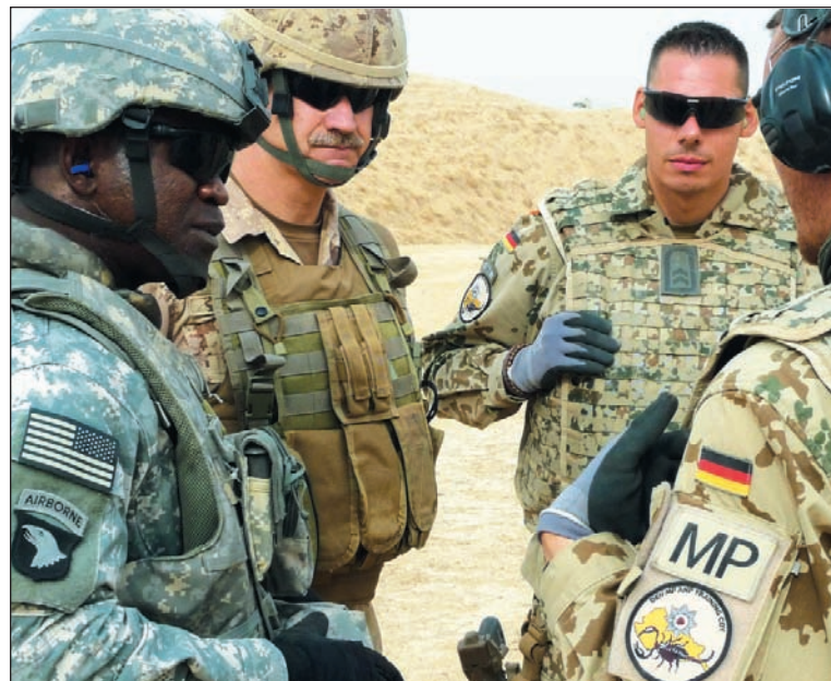
Soldados de la Otan en Afganistán. Un Nobel a la Unión Europea en la perspectiva de la intervención militar en Medio Oriente y ante el temor de su desintegración.

Mientras tanto, en lugar de un reforzamiento de la democracia, se ha intensificado la represión de los Estados nacionales. De conjunto, nos encontramos ante una tendencia a la disolución de los regímenes políticos, que ya se verifica en acto en el gobierno