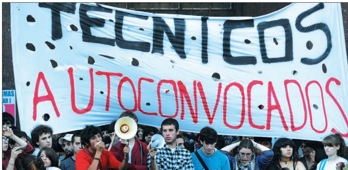
Las tomas de colegios llegan a su fin. Se abre una nueva etapa en la lucha contra la reforma y la política del gobierno.

Por otro lado, continuar desarrollando el movimiento de lucha contra la reforma reclamando al