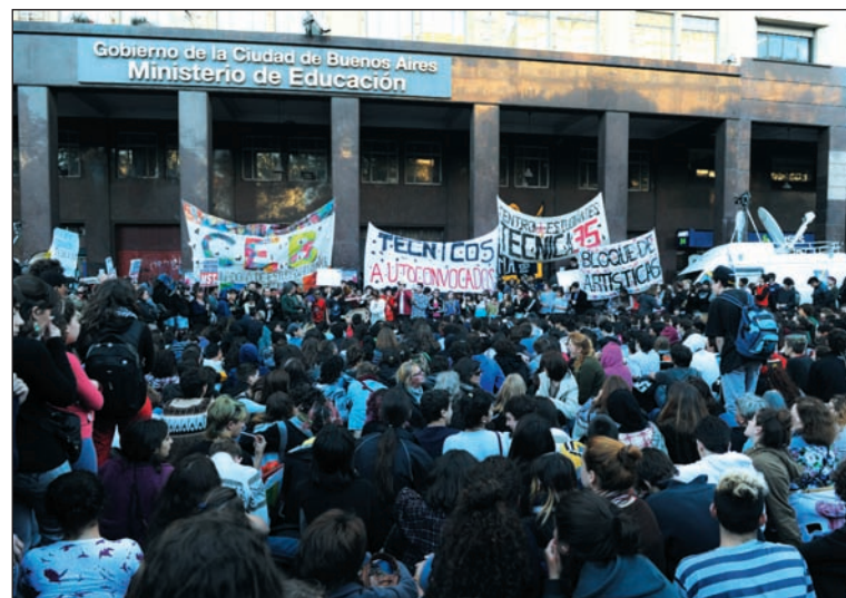
M s de cincuenta colegios tomados. La UJS plantea continuar las medidas de lucha y preparar, junto a los terciarios, una movilizaci n a la Plaza de Mayo contra la reforma educativa.

En este cuadro, se viene desarrollando al interior del movimiento una fuerte ruptura de colegios, asambleas y activistas con la orientaci n pol tica de la direcci n de la Coordinadora -o sea, de "encasillar" la lucha contra la reforma educativa como una pelea contra Macri. La OES, al igual que La C mpora, apoya la reforma educativa en cuesti n y simplemente le critica al macrismo su aplicaci n concreta. Por eso, saludaron los "avances del di logo con Bullrich" y s lo reclamaron aclaraciones sobre la participaci n estudiantil. El recurrente "aparateo" y las "patoteadas" de los "independientes" de la OES en las reuniones de Coordinadora y en las movilizaciones son expresi n del rechazo a sus posiciones en la mayor a de los centros de estudiantes que ellos mismos dirigen,