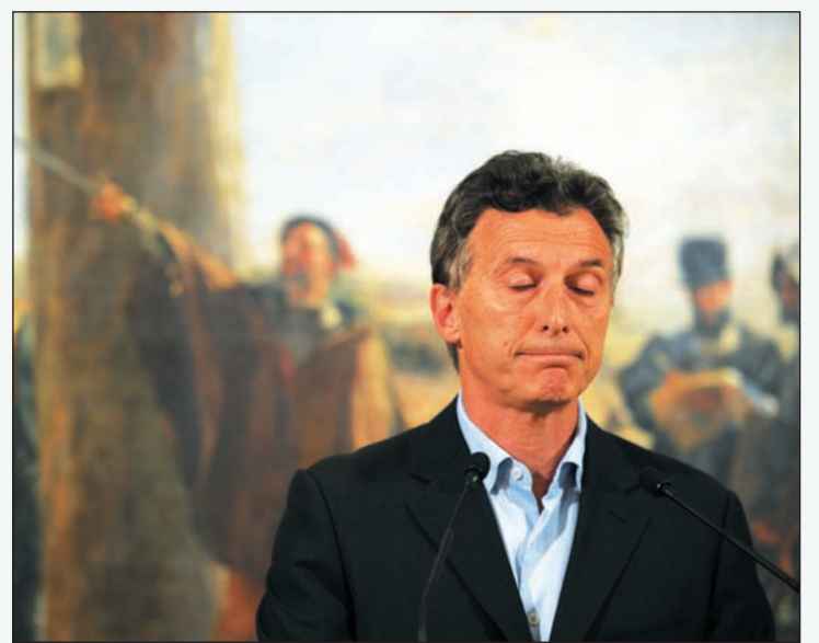
El jefe de gobierno de la Ciudad, otra vez avala el reclamo de la Iglesia. Cristina Kirchner también se opone al derecho al aborto.

M acri, como se esperaba, vetó la ley que reglamentaba el aborto no punible en la Ciudad. Lo hizo -según Clarín - siguiendo el reclamo de la Iglesia.