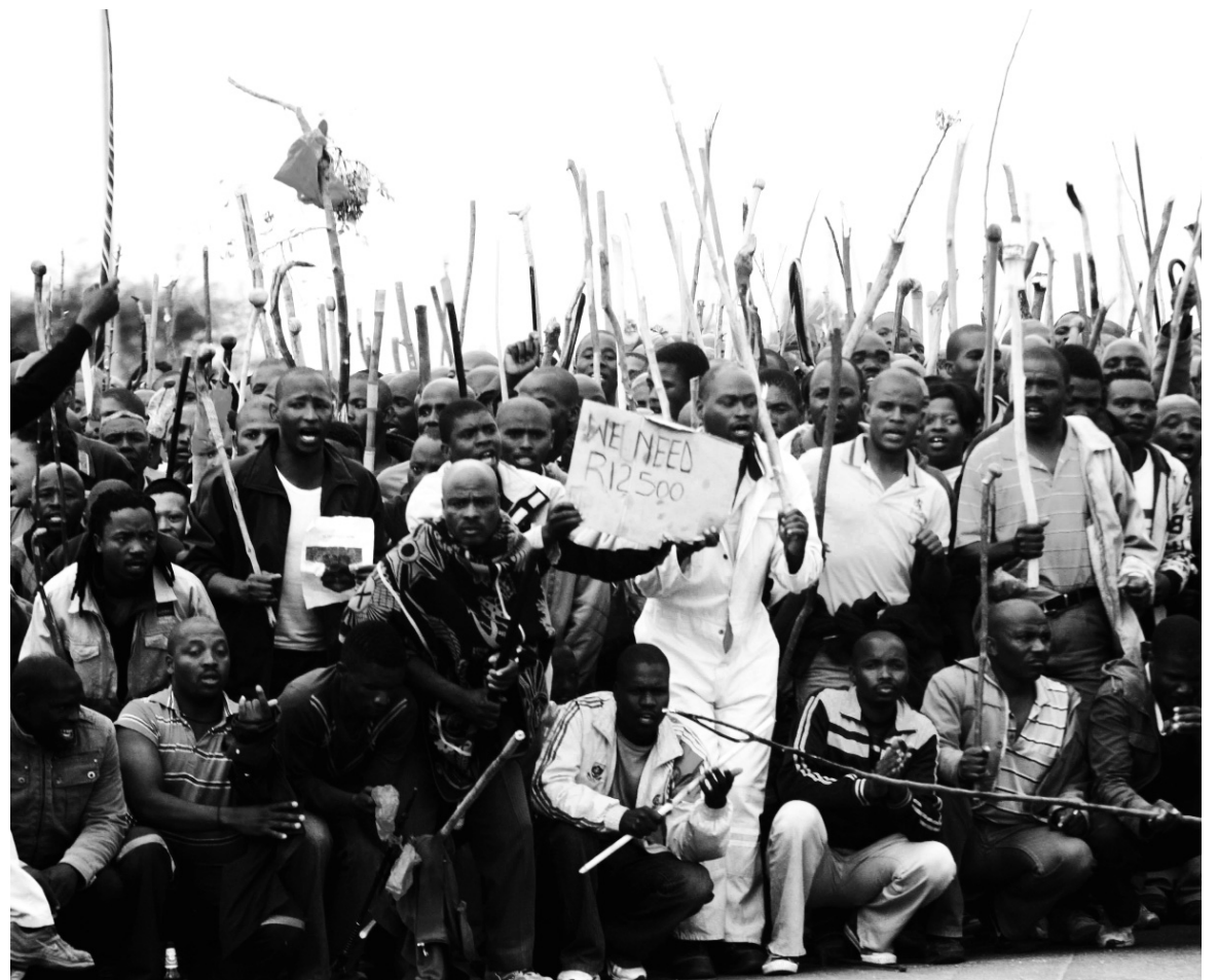
Mineros en lucha. Sudáfrica va camino de una situación prerrevolucionaria.

para la editora del PC italiano, en tiempos de su vínculo privilegiado (y esperanzado) con el efímero "eurocomunismo".