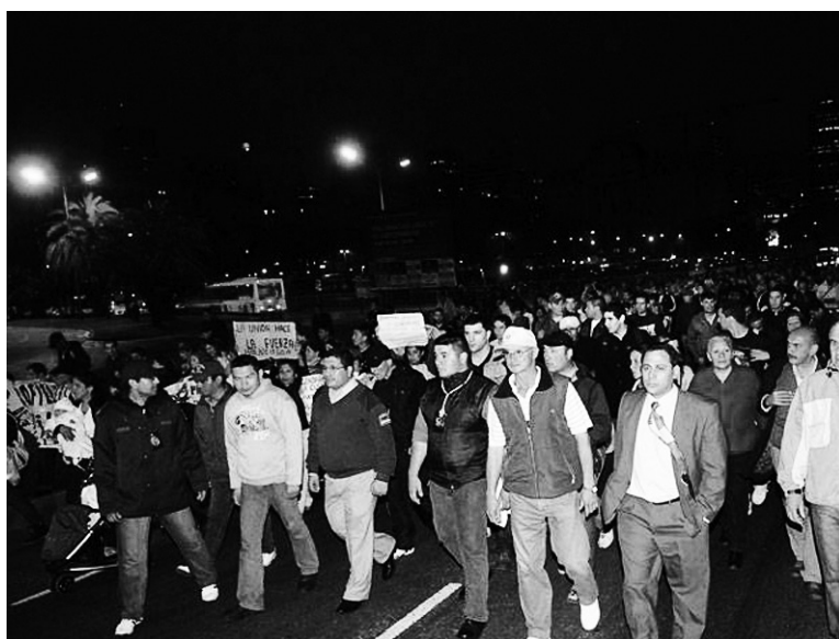
En las 'fuerzas', las mismas contradicciones sociales que en el conjunto del modelo. Un frente único único de oficialistas y opositores contra los 7.000 pesos de básico.

Esa estructura salarial sólo entró en crisis cuando dos fallos de la Corte establecieron el carácter remunerativo de los adicionales, lo que permitió que muchos efectivos se ampararan en ellos y cobraran salarios mayores. La Corte también había fallado a favor del reajuste de los haberes jubilatorios congelados entre 2002 y 2008. Pero mientras los juicios de jubilados eran apelados -o sencillamente ninguneados- por la Anses, las medidas cautelares en favor de las fuerzas de represión se pagaban puntualmente. Antes que esta enormidad alcanzara trascendencia, el gobierno decidió 'limpiar' de adicionales el sueldo de prefectos y gendarmes -y, de pa-