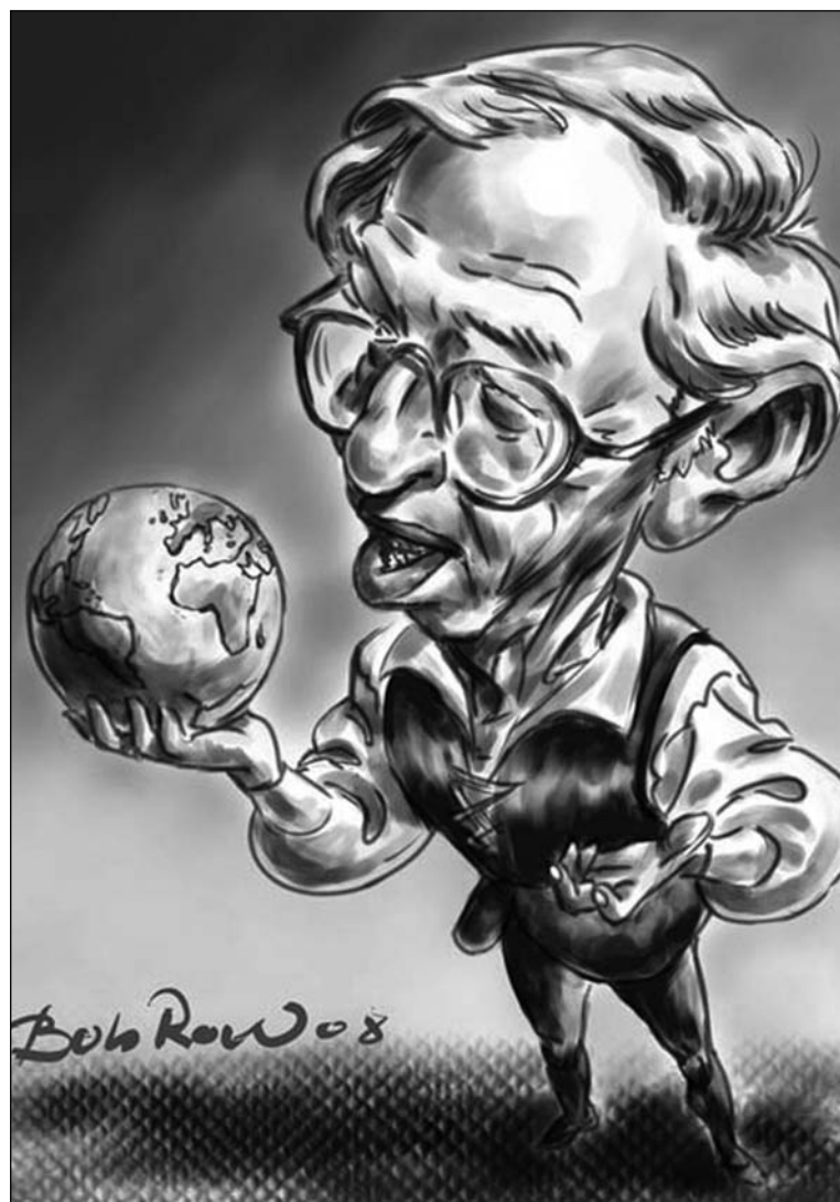
Hobsbawm dejó una obra sin par, que debe ser criticada y superada.

Hobsbawm, por otro lado, amplió considerablemente, en la década de 1960, la investigación histórica de los orígenes y manifestaciones de la rebeldía social contemporánea, ganando enton-