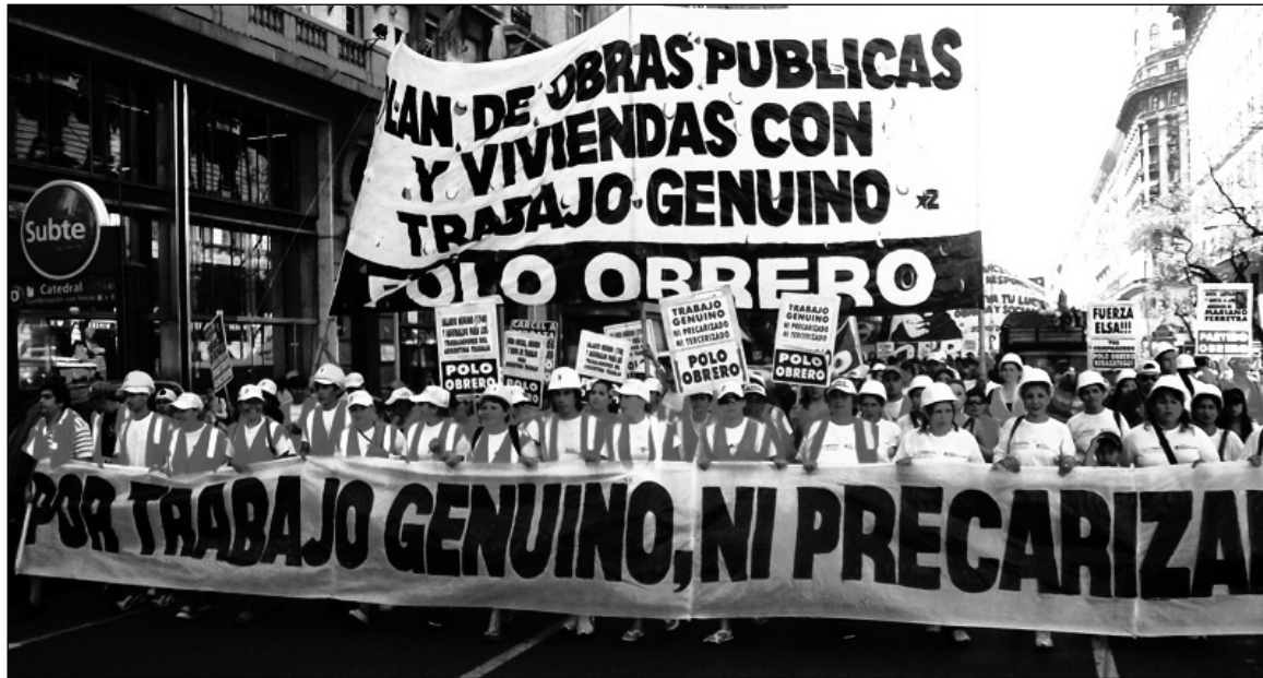
El Polo Obrero se organiza en toda la provincia de Buenos Aires. En los barrios hay un creciente descontento y voluntad de lucha.

Los delegados informaron de un creciente descontento y voluntad de lucha, especialmente en el sector de la juventud, sin salida laboral y carente de posibilidades de capacitarse, pero también de compañeras de todas las edades que están obligadas a buscar otro ingreso por los bajos salarios de sus parejas. Por eso mismo, la iniciati-