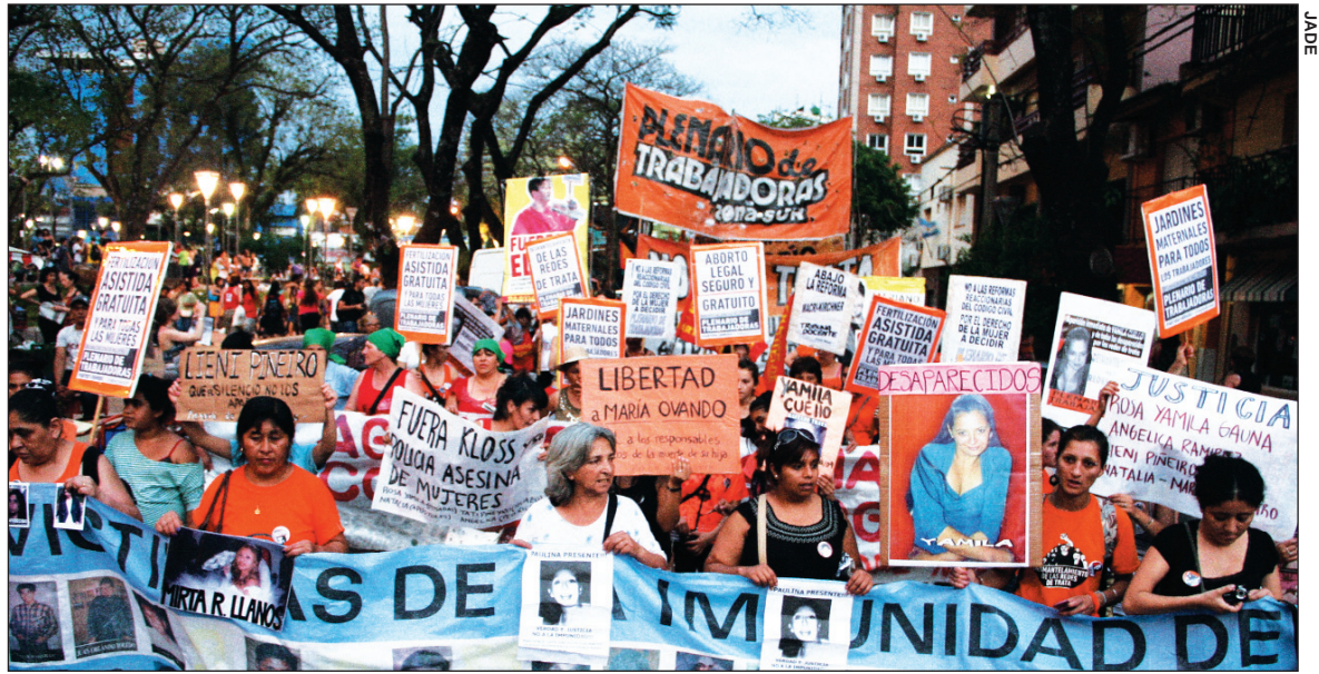
El Plenario de Trabajadoras participó en el Encuentro con una delegación de centenares de compañeras.