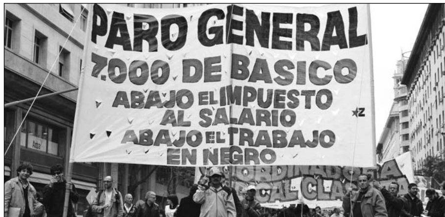
Cabecera de la Coordinadora Sindical Clasista. La gran movilización plantea profundizar un plan de lucha.

En la composición de la Plaza se destacó una columna de unos 10 mil camioneros y delegaciones de bancarios, personal legislativo, judiciales, Udocba y otros gremios de la CGT Moyano. En cuanto a los organizadores (la CTA-Micheli), se notó fuertemen-