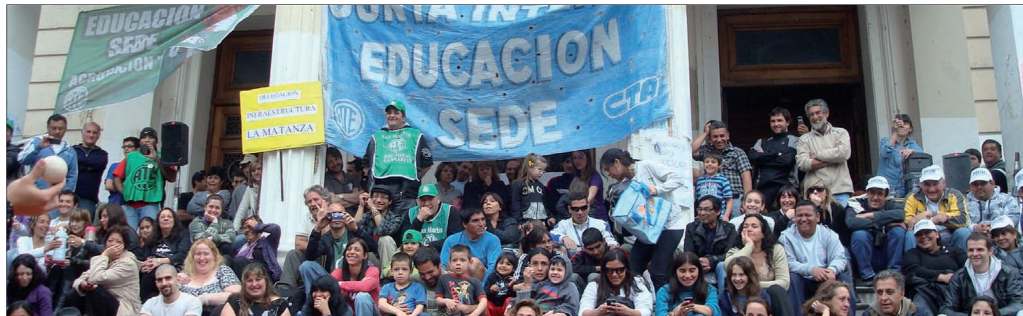
Occupando la Dirección General de Cultura y Educación. La gran lucha de sus trabajadores sobrepasó los mecanismos de contención de las burocracias y puso en vigencia el método de la huelga general y todas las medidas para garantizarlo.

El desarrollo primero, y el triunfo después, de la huelga de Educación, revolvió por completo el clima político al interior de las organizaciones sindicales de los 550 mil estatales bonaerenses. Se cayeron los mecanismos de contención de las burocracias, en primer lugar de ATE y más aún de UPCN, y se puso en vigencia el método de la huelga general y todas las medidas para garantizarlo, algo a lo que escapan como de la peste todas las burocracias. A medida que pasaban los días -dificultosamente por el ocultamiento de los medios- fue creciendo también la simpatía en las masas de los estatales de la provincia. Luego, la rebelión de prefectos y gendarmes acrecentó las dudas sobre la posibilidad de un desalojo por parte de la Bonaerense, también amenazada de recortes de módulos de horas extras.