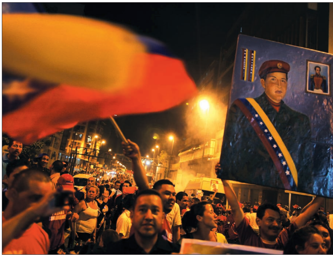
Festejos de en las calles de Caracas. Las contradicciones del 'modelo' bolivariano y el avance de la crisis mundial podrían minar a corto plazo la gobernabilidad del país, es necesaria una enérgica diferenciación socialista respecto del nacionalismo.

Por más que Capriles contrató el asesoramiento de estudios vinculados con el gobierno brasileño, lo que se tradujo en un lenguaje 'social' y a favor de la "unión nacional", la campaña demostró que la divergencia básica entre los dos campos enfrentados sigue como en el primer momento. En su programa de gobierno, Capriles declaró que pondría a PDVSA a producir petróleo y abandonar "la cría de pollos o la construcción de viviendas sociales", que es el núcleo de la asistencia social con la que el chavismo pretende defender "la redistribución de los ingresos". PDVSA representa la mitad del producto interno de Venezuela y el 95% de sus exportaciones y divisas. El planteo opositor mantiene el objetivo fundamental de