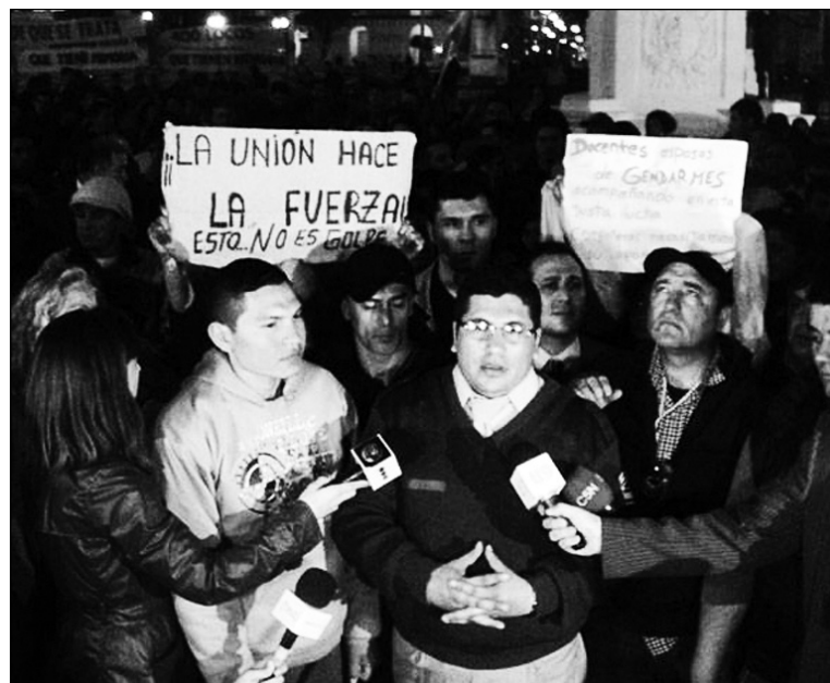
Prefectos explicando su reclamo.

La polémica que se ha desatado es objetiva, o sea que no puede ser ignorada. No se puede esperar, para tomar posición, a la llegada de los 'momentos decisivos', cuando todos los problemas de la transición política hacia ellos han dejado de existir, precisamente porque arribaron a su plena madurez y a su desenlace. El arte de la política socialista (y, más exactamente, de la estrategia) consiste, de nue-