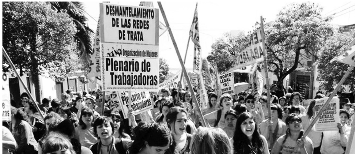
Vayamos a Misiones a convertir el Encuentro en una plataforma de debate y organización.