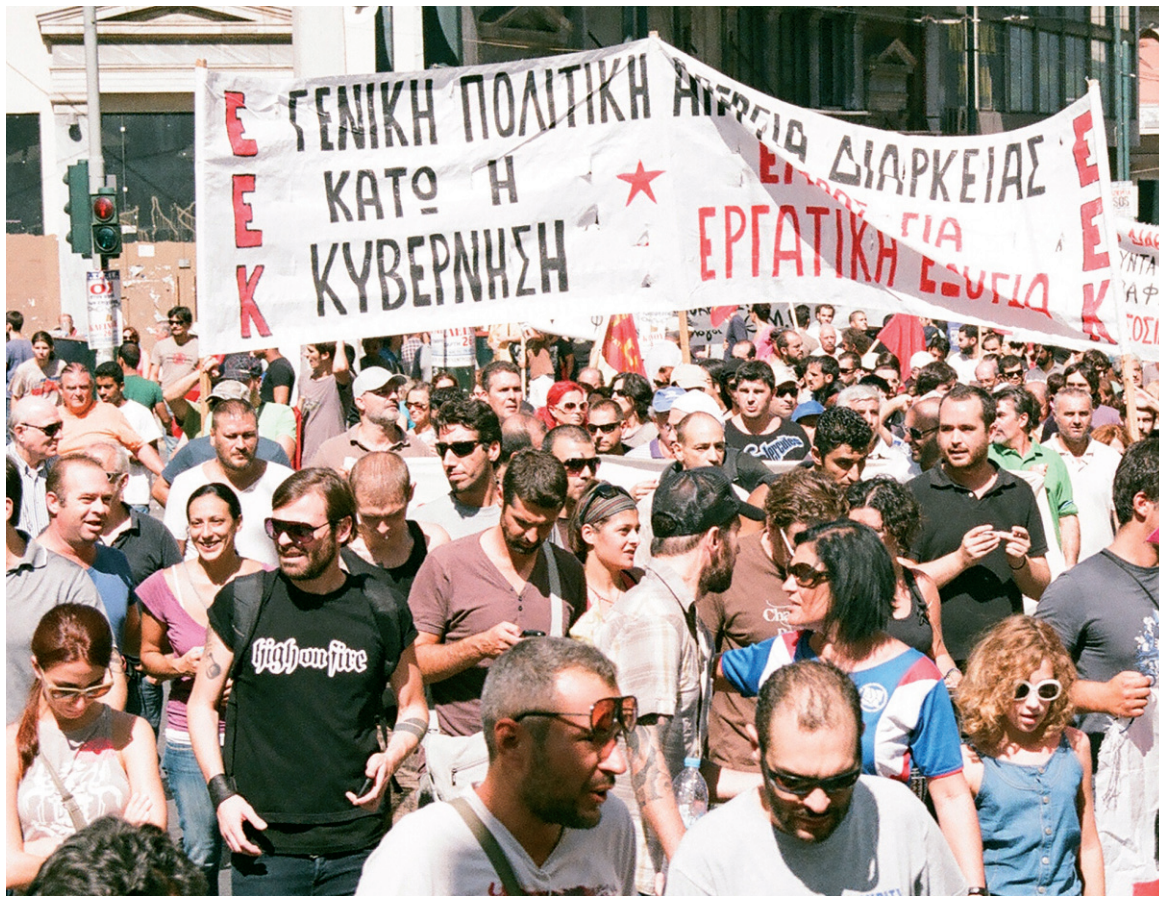
La gran huelga del día 26, un triunfo de la clase obrera

La huelga general convocada para el 26 de septiembre -con un