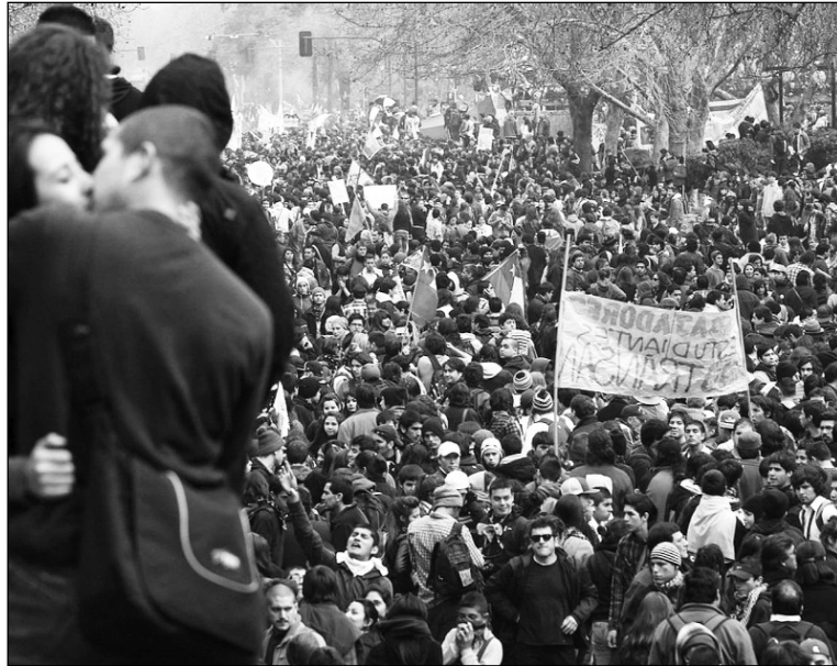
El presupuesto 2013 consolida la privatización educativa.

El domingo 30 de setiembre, Piñera dio a conocer los ejes centrales del Presupuesto 2013; según él, con "la mayor inversión en educación de la historia", con 1.200 millones de dólares ( El Mercurio , 30/9). Pero esa cifra está muy debajo de los más de 5.000 millones de dólares que el movimiento ha reclamado como necesarios para fortalecer la