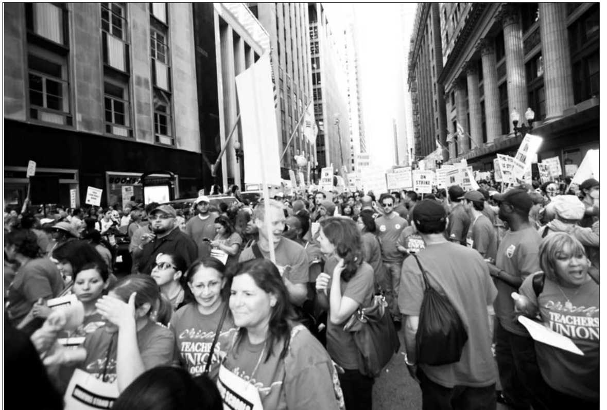
Elecciones, "ajuste" y crisis social.