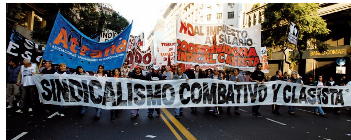
La columna del sindicalismo clasista, en la jornada del 27 de junio

En Santa Cruz, los gremios estatales, mayoritariamente encuadrados en CTA, emplazaron al gobierno de Peralta para otorgar el aumento que la provincia les viene negando. En Neuquén, luego de aumentos salariales miserables y con la consigna de reapertura de paritarias y contra los ajustes de Sapag, las seccionales opositoras de Aten serán motoras con ATE de una movilización multitudinaria. En Chubut se reabrió el conflicto de Los Dragones. Los secundarios ocupan