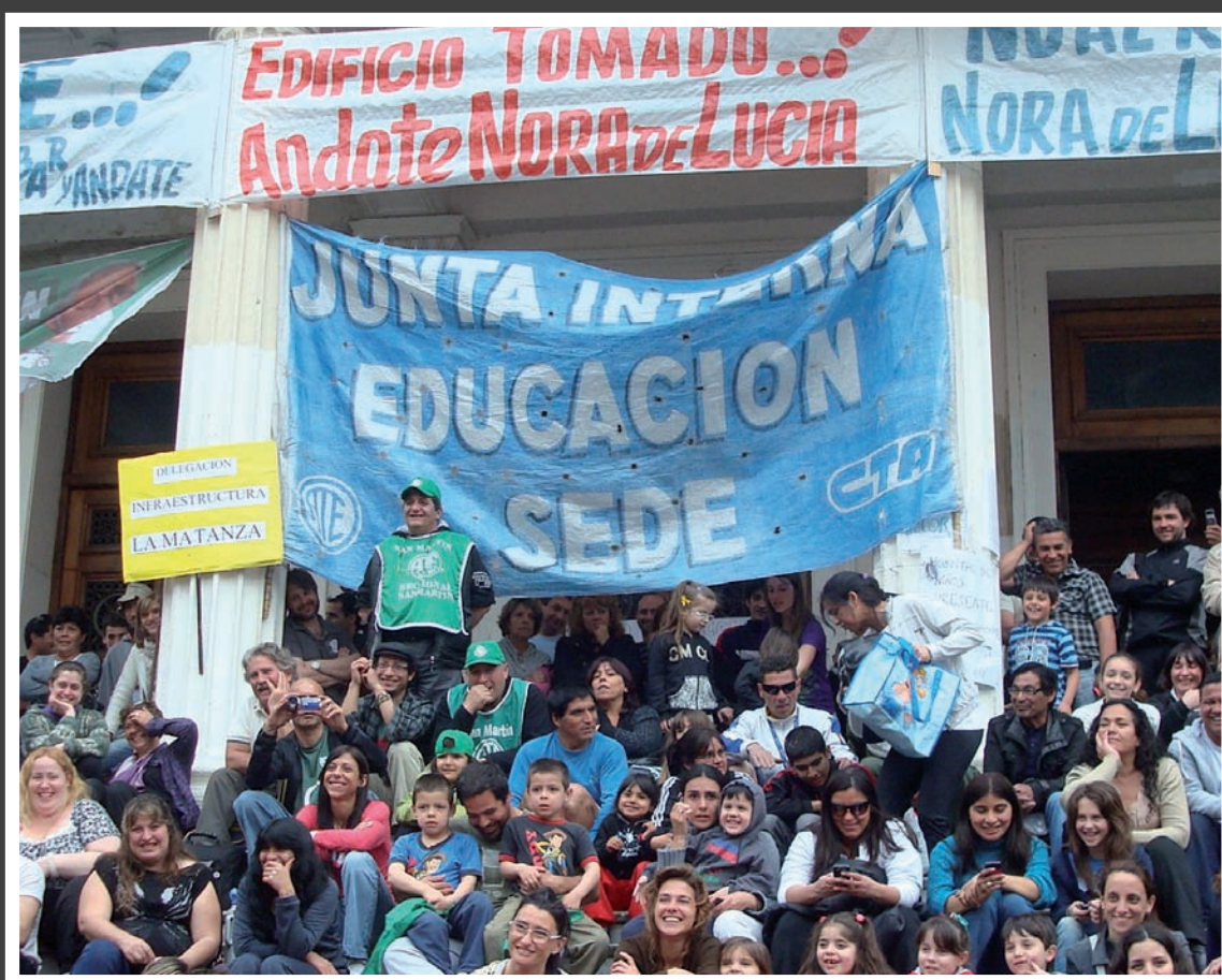
La ocupación del Ministerio de Educación, en La Plata.

Con estos planteos, vamos a la Plaza de Mayo el próximo 10 de octubre.