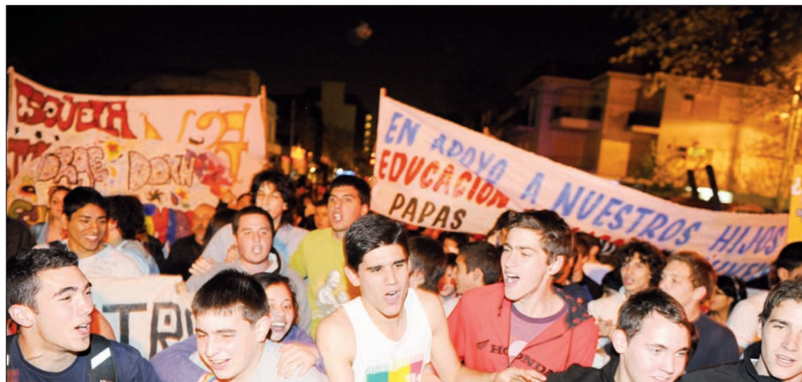
Macri y los K quieren vaciar la educación técnica.

Vale aclarar además, que la validación nacional de los títulos la dictamina el Ministerio de Educación de la Nación. Es decir, que sólo se pierde la validez si el