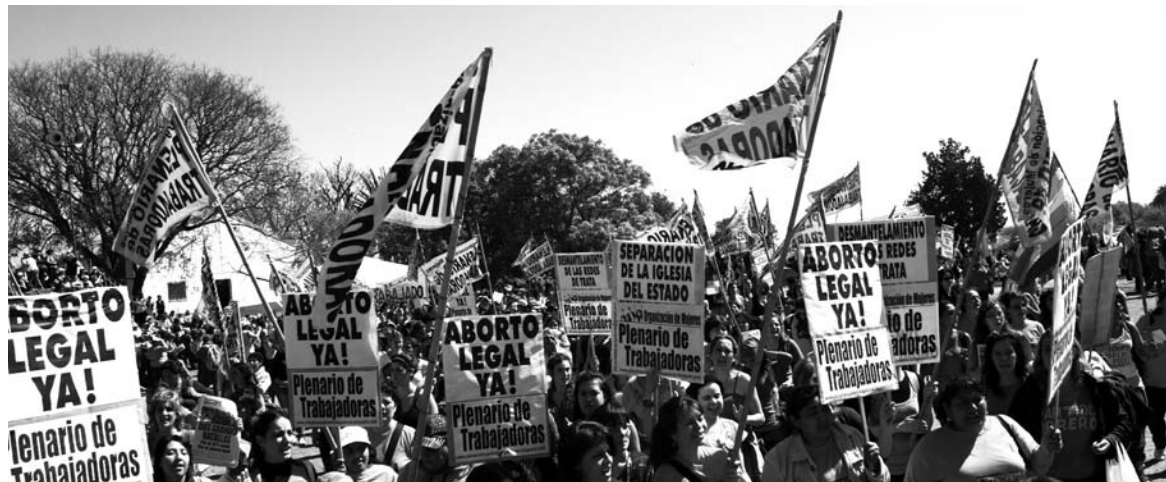
Movilización por el derecho al aborto. Argentina, con las mujeres, es menos justa que antes.

El fallo de la Corte y el retroceso posterior