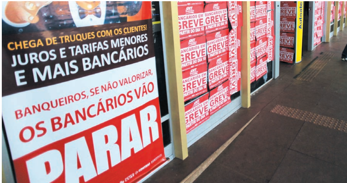
La huelga de los bancarios, los trabajadores del sector privado empiezan a salir a la lucha.

Con la economía en picada -la caída de la actividad industrial fue de un 5,3% en el último trimestre, la cuarta caída consecutiva-, el gobierno repite la fórmula de concesiones impositivas al gran capital para evitar el colapso económico, con una desgravación prevista para el año de 15,2 mil millones de reales, de los cuales casi la mitad -7,2 mil millones- corresponden a un nuevo 20% de rebaja en las cargas sociales de los salarios. Además de