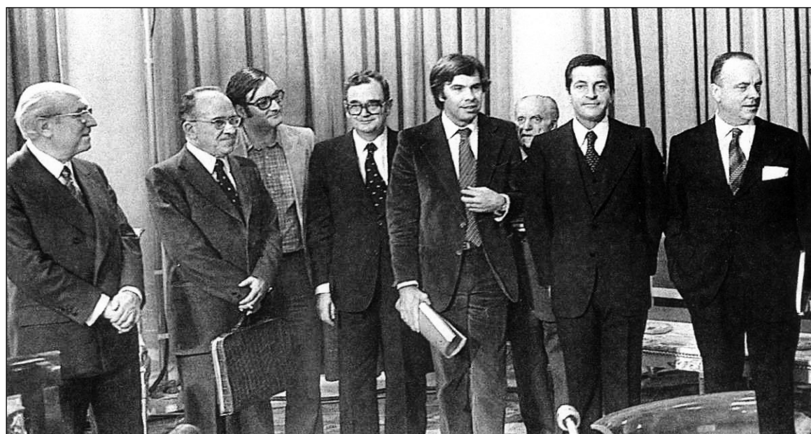
Santiago Carrillo, junto a otros dirigentes burgueses, se suma al Pacto de Moncloa. Su muerte coincide con los primeros síntomas de agotamiento del régimen que ayudó a crear.

Derrotada la república partió exiliado hacia la URSS. En las pe-