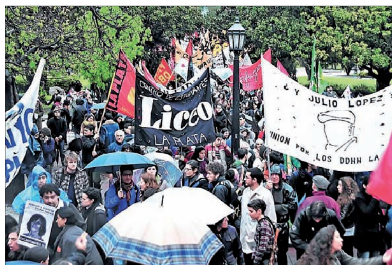
Alrededor de 4 mil personas marcharon bajo la lluvia. Partieron desde el palacio municipal, donde López dio su testimonio para encarcelar al genocida Etchecolatz, y se dirigió a la Gobernación para señalar el manto de impunidad y encubrimiento a lo largo de estos años.