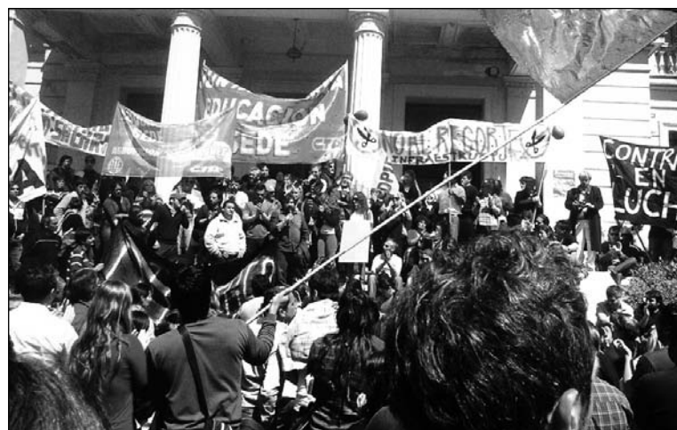
La torre central del ministerio de Educación, tomada por los trabajadores. Una lucha central contra el ajuste del gobierno.