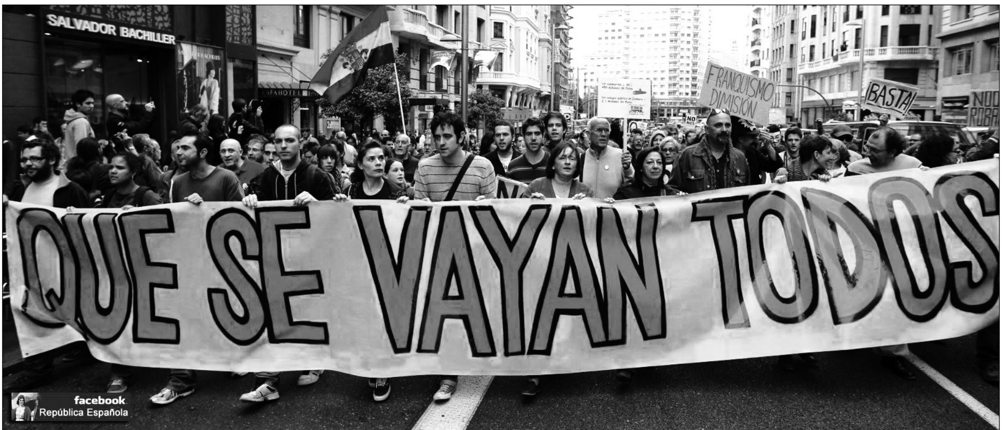
El 25 de septiembre el gobierno reprimió a una masiva movilización que rodeó al Parlamento contra el ajuste capitalista.

El gobierno del Partido Popular abrió un proceso penal contra miembros de las dos plataformas de luchadores, porque han convocado a una manifestación para rodear simbólicamente el Congreso de los Diputados el 25 de setiembre. Se les acusa "de acuerdo con los dispuesto en el artículo 486 de la Ley de Enjuiciamiento Criminal, como responsables de un presunto delito contra altos organismos de la nación", el cual se castiga con la pena de prisión de seis meses a un año o una multa de doce a 24 meses a los que promuevan, dirijan o presidan manifestaciones u otra clase de reuniones ante las sedes del Congreso de los Diputados, del Senado o de una Asamblea Legislativa de una Comunidad Autónoma cuando estén reunidos, alterando su normal funcionamiento". Semjante legislación integra lo que se llama "la transición española".