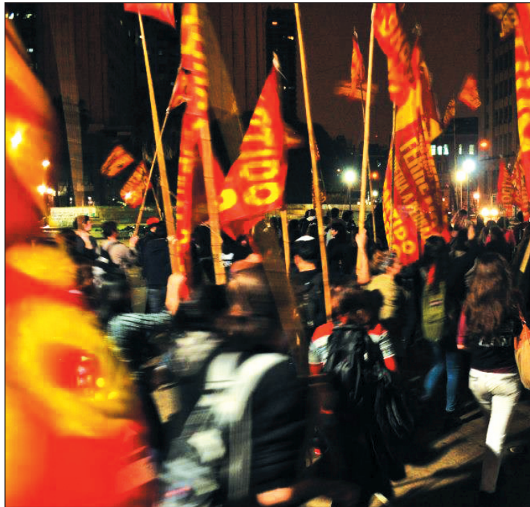
Elecciones estudiantiles en la UBA. Se ha reforzado una polarizacin entre la izquierda y Franja Morada y aliados; en paralelo al completo derrumbe del kirchnerismo.

En el caso de esta facultad, las elecciones volvieron a establecer la conduccin de Nuevo Derecho (MNR, PS de Binner), que supero por lejos al "megafrente" de agrupaciones kirchneristas (46,28% a 16,03%). Para no ser la excepcin respecto a otras facultades, los camporistas volvieron a retroceder. El Frente de Izquierda (UJS-PO y PTS) obtuvo el 3,45%, menos que el 4,33% de 2011 -aunque ms de lo alcanzado en 2010, en las anteriores no obligatorias, pues nuestra votacin crece en Derecho con la masividad. El objetivo de conquistar un delegado para la