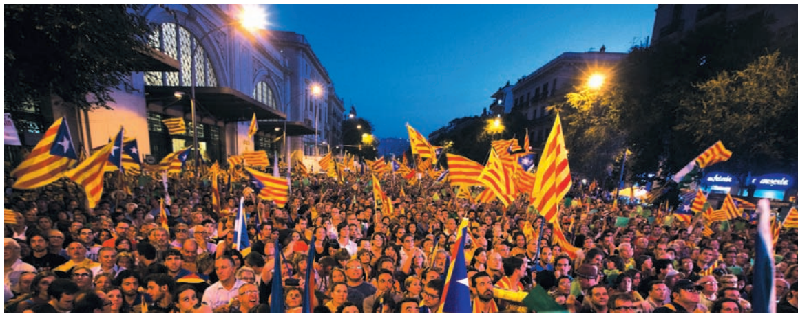
Terremoto político en Estado español. Las tendencias centrífugas tienen como base la bancarrota económica.

Un millón y medio de manifestantes en las calles de Barcelona por la independencia