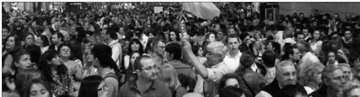
Cacerolazo en Córdoba. La alternativa de un apoyo al gobierno "para que no suba la derecha" está agotada, es necesario ganarle a la derecha la carrera de la oposición alternativa a este gobierno.

Cuando el viento sopla a favor, el arbitraje estatal recoge halagos; cuando lo hace en contra, se lo hace responsable de todos los fastidios. No vale la pena volver a explicar que la