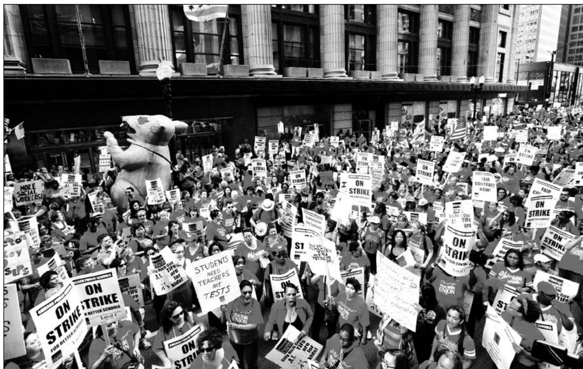
Los maestros de Chicago ocupando las calles. Después de 25 años, salieron a la huelga y conmocionaron al país a puro piquete y asamblea.

La fuerza de la lucha docente, y las urgencias electorales de los demócratas, obligaron al gobierno a negociar un acuerdo. El cuerpo de delegados del sindicato, al cierre de esta edición, había suspendido la huelga por una semana mientras se vota en las asambleas de base. Los maestros recibirán un aumento salarial promedio del 10 por ciento en los próximos cuatro años, aunque faltan fondos para cubrir el presupuesto (un logro inédito en estos tiempos de cri-