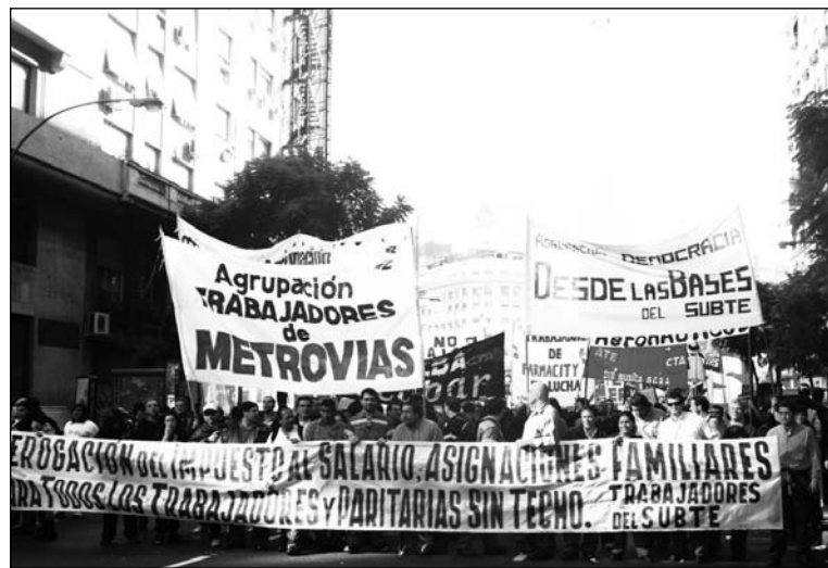
El movimiento obrero tiene que ponerse de pie. El gobierno desvía crecientemente los aportes de los trabajadores para concretar la política del Banco Mundial.

El gobierno desvía crecientemente fondos derivados de los