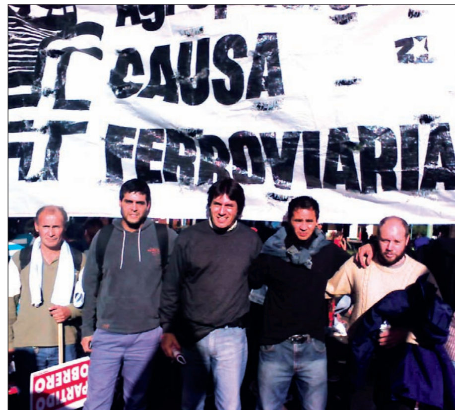
Causa Ferroviaria "Mariano Ferreyra" sigue la lucha.

La burocracia intenta renovarse ilegítimamente en las urnas mediante el fraude y la proscripción.