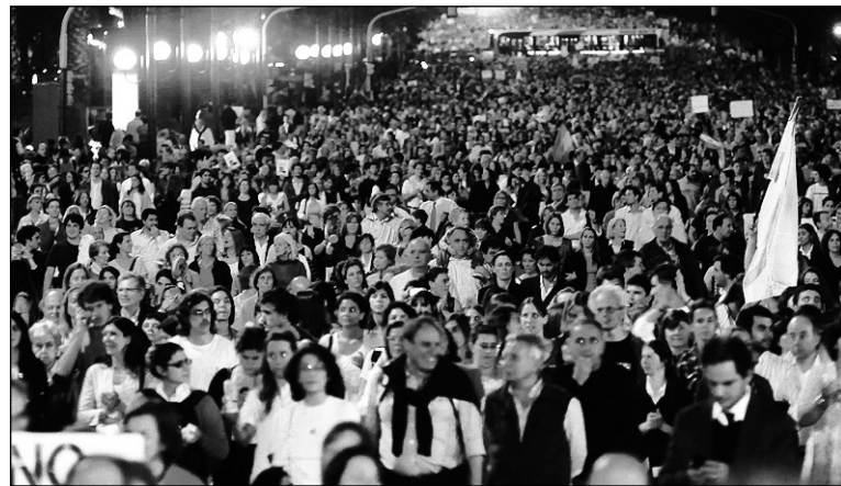
En la Ciudad de Buenos Aires. El cacerolazo debe servir para la reflexión del movimiento obrero: si no nos ponemos a la cabeza de una alternativa política a este desastre "nacional y popular", alguien terminará haciéndolo contra nosotros.

El Partido Obrero advierte que sería una tragedia nacional sustituir a los K por la laya de los Macri. Invita a los sectores genuinamente indignados a refle-