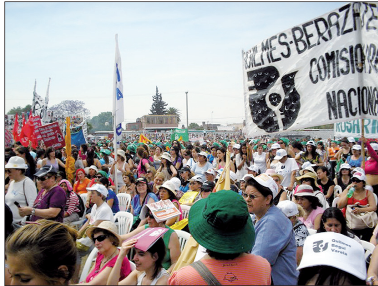
Los encuentros nacionales movilizan a miles de mujeres. Se intenta transformarlo en un lugar de componenda con los enemigos del programa de emancipación social de la mujer.

En una reunión a principio de año, el PCR llegó a proponer que un "obispo" integre una actividad previa con fines propagandísticos para debatir el problema del aborto. Los lazos con la Iglesia quedan más que claros cuando en una declaración del párroco de la catedral San José de Posadas -que sale a contestarle al Equipo Provincial de Trabajo Red Federal de Familias- dice que "...mantenemos un muy buen y respetuoso diálogo con la comisión or-