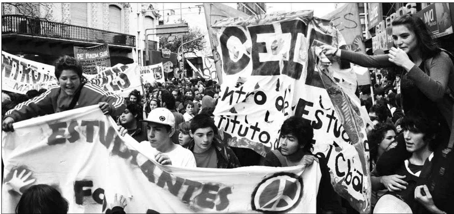
Movilización de estudiantes secundarios en Córdoba. Los partidos patronales instrumentan el derecho al voto para embrutecer a la población por medio de la mentira; los revolucionarios toman el derecho al voto para desnudar sus limitaciones y oponer, a la delegación del poder, su ejercicio directo por medio de métodos asamblearios.

El centroizquierda, por el contrario, pusilánime y mediocre por definición, ha salido a repetir lo que ya hemos escuchado en YPF o en Ciccone; a saber: que apoyan al proyecto oficial, "haciendo reserva" de las intenciones manipuladoras del gobierno. Desconocen el carácter estratégico que debe tener toda oposición real al bonapartismo y son, por supuesto, adversarios de una oposición estratégica al capitalismo y a los regímenes políticos que lo encarnan. De este modo, su voto por la expropiación de Ciccone ha servido para rescatar a Boudou; el voto por la estatización parcial de YPF,