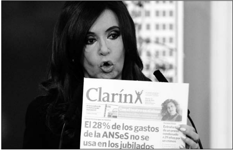
"Korpo" contra "Corpo". La libertad de expresión es incompatible con el monopolio capitalista, público o privado, de los medios de comunicación.

El gobierno está preparando un desembarco en el grupo Clarín para el próximo 7 de diciembre, cuando se vence el plazo de la medida cautelar dictada por la Justicia. Según Urgente24.com , "quienes frecuentan los pasillos de la Autoridad Federal de Servicios de Comunicación Audiovisual (AFCSA), comentan que los camporistas están dispuestos a todo con tal de desmembrar a Clarín desde las 00:00 del 8/12". El propio multimedio entiende que las últimas designaciones en AFCSA apuntan a concretar su desguace a partir del 8 de diciembre ( Clarín , 3/9).