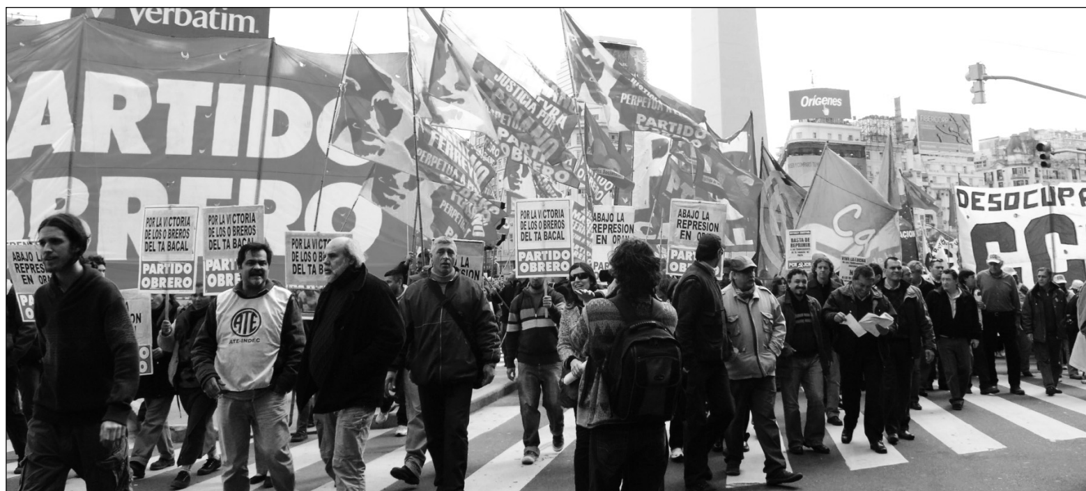
Marcha en Buenos Aires en apoyo a la lucha de El Tabacal.

Los obreros de El Tabacal propinaron con su victoria un certero golpe al mayor ícono de la superexplotación de la zona y han desenmascarado al PJ y al PRS en su carácter de lacayos de esta patronal antiobrera. En la nueva fase de lucha, está planteada la unidad entre los obreros y el conjunto de los trabajadores y explotados del departamento de Orán -no sólo en el terreno reivindicativo, sino fundamentalmente en el terreno político. La victoria completa de los obreros de El Tabacal será el primer paso para avanzar en la recuperación del ingenio en función de los intereses populares. Es necesaria una asamblea general de los obreros para balancear lo actuado y discutir cómo encarar la nueva etapa.