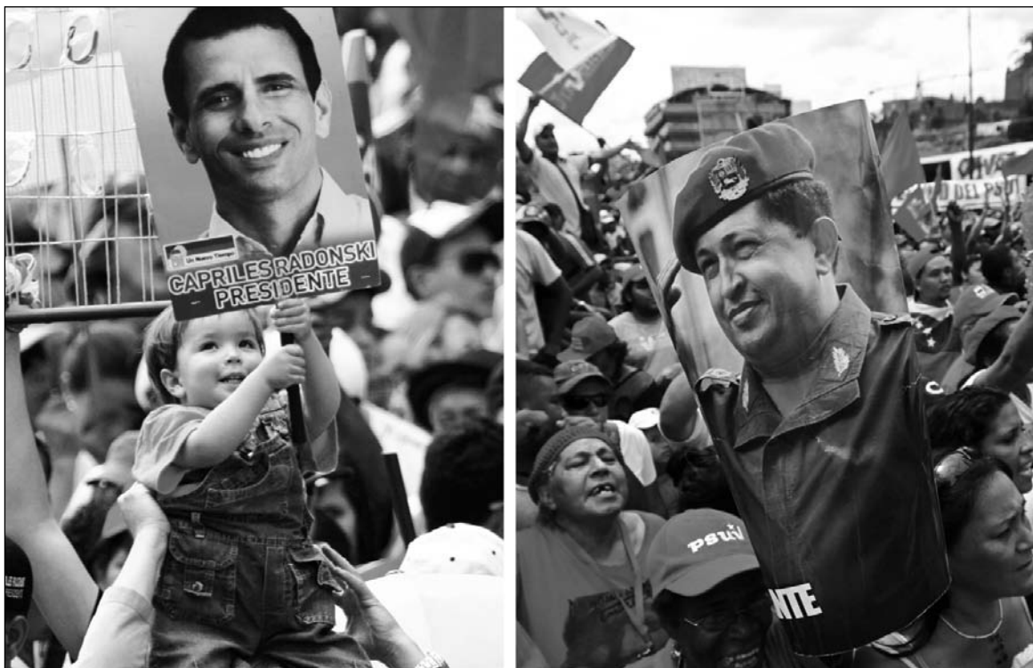
Imágenes de las campañas de Capriles y Chávez. Lo que distingue al enfrentamiento electoral en Venezuela que se desarrolla en este momento no es la 'naturaleza' burguesa de los contendientes, sino que el chavismo ha agotado sus tendencias movilizadoras.