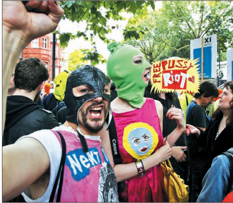
Movilización por la libertad de las compañeras rusas.

La importancia simbólica que el gobierno ruso le dio a dicha catedral no sólo pone de manifiesto los entrelazamientos políticos de Putin con el poder eclesiástico de la iglesia ortodoxa rusa -hoy dirigida por patriarcas (Kirill) con pasado de agentes de la KGB como Kirill Gundyayev-, sino que también manifiesta la impostura política que gobiernos de diferentes