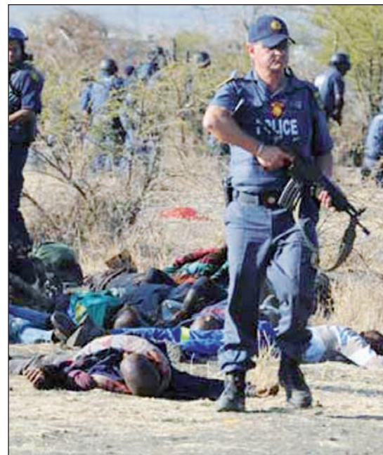
Créase o no, los obreros atacados fueron procesados por el asesinato policial de sus compañeros.

Efectivamente, pero una vieja ley de la época del Apartheid establece que todas las personas que intervienen en una protesta en la que se producen enfrentamientos con la policía son penalmente responsables si se produce la muerte de alguno de los agentes o manifestantes. La Fiscalía simplemente aplicó la ley, jamás abrogada en los 18 años que median desde el supuesto fin del Apartheid.