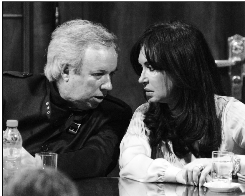
El gobernador de Santa Cruz, Daniel Peralta, y la presidenta. Del saqueo al ajuste antiobrero.

La lucha contra la destrucción de la Caja de Jubilaciones, a fines de 2011, hizo retroceder al gobierno, pero luego éste respondió con atrasos en el pago de los sueldos. La lucha por el pago en fecha fue utilizada por la burocracia de los sindicatos para relegar el reclamo del aumento salarial.