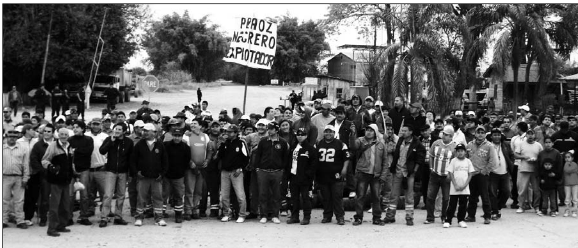
Piquete de los trabajadores, respuesta al lock-out patronal.

La simpatía y solidaridad popular en favor de los obreros de El Tabacal radica en todos los agravios