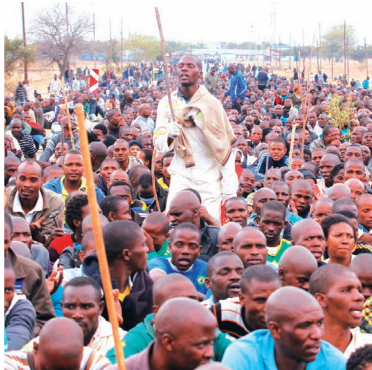
Luego de la represión sigue la huelga en la minera Lonmin. Irrupción de la clase obrera frente a la crisis y el derrumbe de la "revolución en paz" del nacionalismo burgués negro, organizado en el CNA.

Este proceso de precarización laboral, sin parangón en una industria de las proporciones y prosperidad de la minería, fue creado bajo el Apartheid y preservado íntegramente por el gobierno "negro" del CNA. En Sudáfrica sigue en vigencia el régimen de desplazamiento de los africanos de sus tierras para obtener una mano de