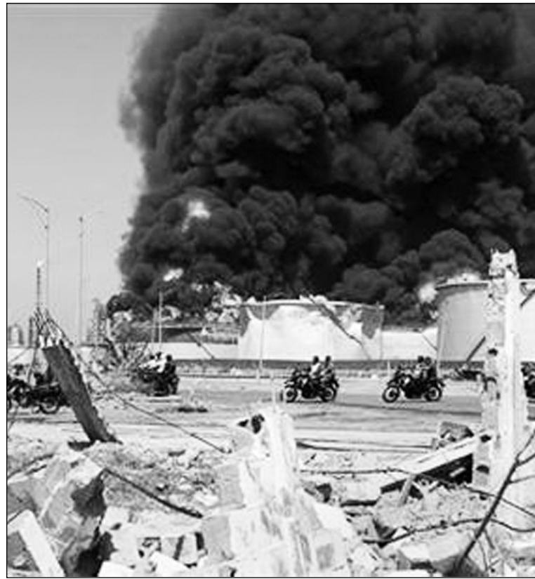
Explosión de refinería en Venezuela. Desinversión y una crisis sin antecedentes de PDVSA; la obligada apertura de su economía revela el fracaso de la "integración latinoamericana".

La Argentina -afectada por una seria crisis fiscal, que afecta la capacidad de arbitraje del kirchnerismo- asiste a un principio de ruptura de la clase obrera con el gobierno, en el marco de un principio de ascenso de la izquierda. Las medidas intervencionistas parciales han conducido a un desplazamiento económico, que agravó la fuga de capitales y provocó una recesión que afecta a sectores fundamentales de la clase obrera. La declinación política del kirchnerismo deberá conducir a una polarización política. La burocracia sindical enfrenta esta crisis, desacreditada y cuestionada por un nuevo activismo sindical que busca recuperar los sindicatos para una política independiente.