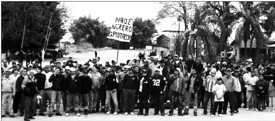
Una causa popular. Luego de derrotar la represión, los trabajadores del ingenio mantienen la huelga.