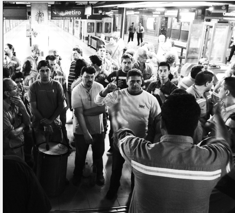
Trabajadores de Metrovías. Luego de la gran huelga está planteado un balance y votar un plan de lucha por la personería para el sindicato y la firma de una paritaria que recupere el salario.