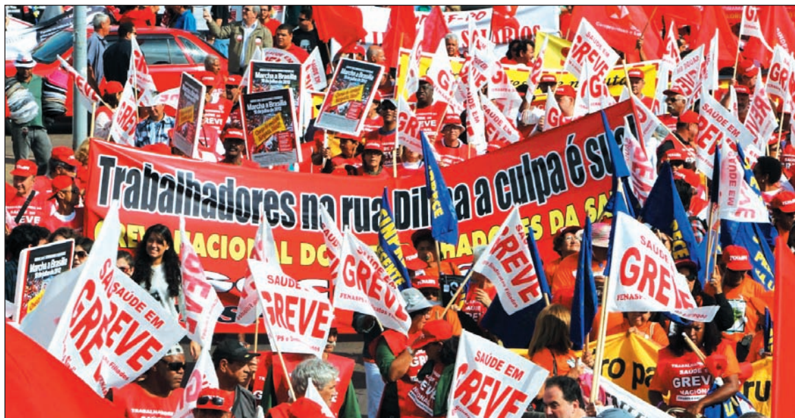
Trabajadores estatales brasileños. Frente al ajuste antiobrero del gobierno, la reacción de las masas ha transformado el escenario político.

La ofensiva antiobrera hace agua, sin embargo, por todos lados. Dilma tuvo que pedir el apoyo público de Lula, que fue satis-