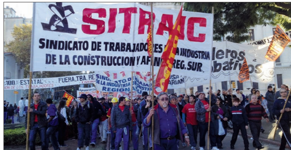
El Sitraic (Sindicato de Trabajadores de la Industria de la Construcción) marchando el Primero de Mayo.

Votamos seguir, como lo hicimos el 6 de agosto, con iniciativas locales todas las grandes movilizaciones por Justicia por Mariano. En el medio de las deliberaciones, los pre-