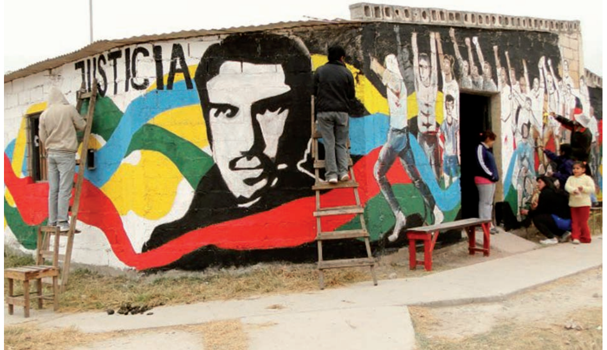
Mural por Mariano en Salta. Pintadas, festivales, videos, films, canciones, libros, poemas y convocatorias teatrales para una intensa campaña.