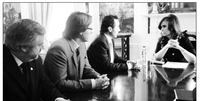
Cristina Kirchner, con directivos de Monsanto. El acuerdo convierte a la economía sojera en una dependencia del capital internacional productor de semillas modificadas.

El negocio de la semilla de soja en el país rondó los 300 millones de dólares, con sólo un 40% del mercado que paga la semilla y las regalías. Si ese mercado se extiende aproximadamente al 100%, la cifra trepa a más de 750 millones de dólares. Aquí no sólo se beneficiará Monsanto, sino también el resto de las empresas que participan del negocio semillero. El acuerdo convierte a la economía sojera en una dependencia del capital internacional, que produce semillas modificadas, y de la industria química en