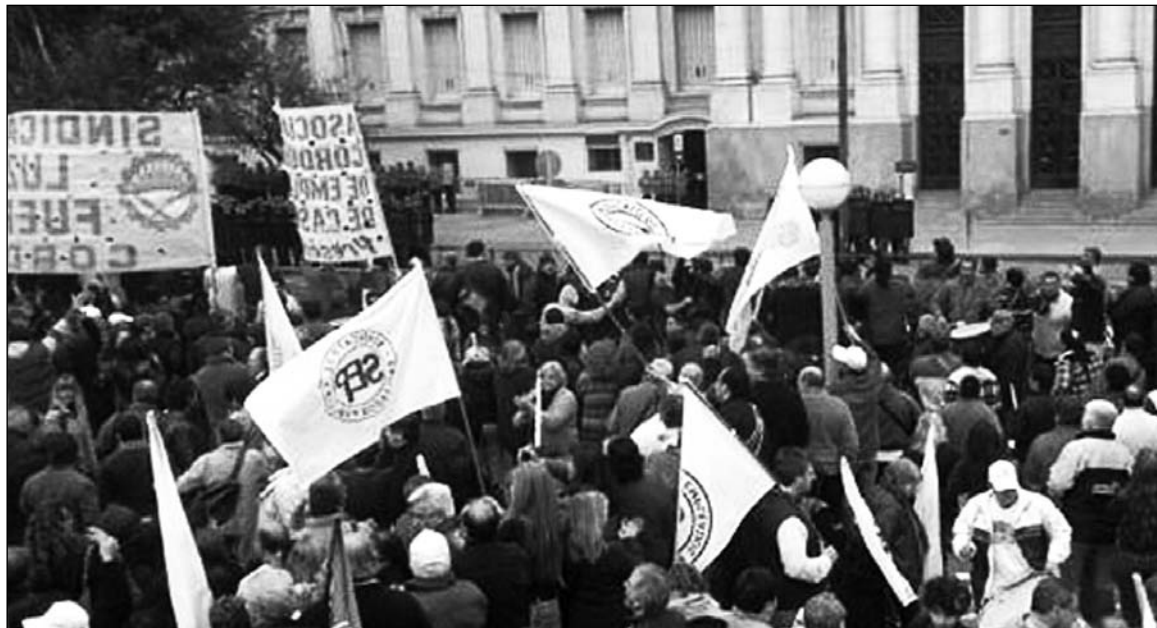
Movilización de estatales cordobeses.

De la Sota necesita fondos para sostener un régimen de subsidios y exenciones a los grandes capitalistas y los negocios de la patria contratista. Pero las suspensiones y despidos encubiertos -cada vez más frecuentes en la industria automotriz, como resultado de la caída del mercado brasileño y de la recesión en la Argentina- revelan el fracaso de esta política. Huyendo para adelante, De la Sota se dispuso a meterles la mano