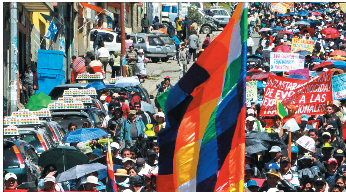
Movilización popular boliviana. No se trata de oponer al "discurso" nacionalista uno socialista, sino de denunciar las limitaciones de la política nacionalista y la hipocresía de su "discurso", para organizar a los sectores obreros más avanzados y a las masas, para disputar el poder político.

ropa. El cataclismo europeo ha planteado un principio de disolución de los regímenes políticos que emergieron de la Segunda Guerra Mundial, como se manifiesta en la aparición de "gobiernos técnicos" -impuestos por la Comisión Europea y por el FMI- y en la tendencia a la disolución de regímenes estatales, como es el caso de las autonomías del Estado español. Asistimos, además, a virajes en la disposición política de las masas, con rápidos desplazamientos hacia la izquierda, como ha ocurrido en Grecia y como se desarrolla en España. El carácter sistémico de la crisis del capitalismo se manifiesta sobre todo en el ingreso de China al circuito de la bancarrota mundial. Estados Unidos -el corazón del capitalismo mundial-, sofocado por el peso de una deuda pública de 140% del PIB, por una deuda externa inconmensurable y por el derrumbe financiero de los estados de la federación, se enfrenta a un retroceso social histórico.