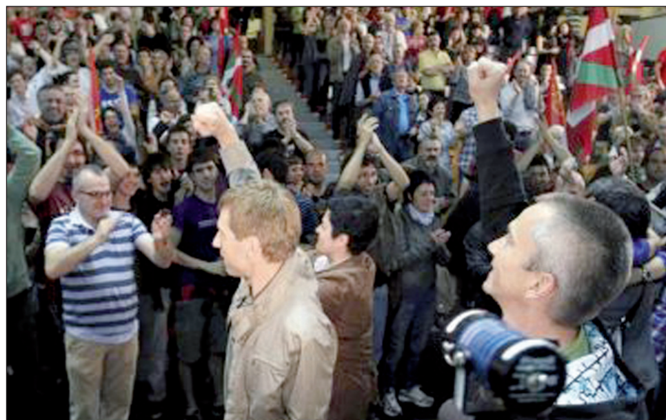
Asciende el apoyo a Bildu, la coalición de la izquierda nacionalista vasca.

el triunfador sea Euskal Herria Bildu: la izquierda vasca. E.H. Bildu es una coalición de varios grupos, principalmente Eusko Alkartasuna -que se escindió del PNV en la década del '80-, Alternatiba -una ruptura de Izquierda Unida-, Aralar y otros grupos menores. Bildu se ha convertido en el polo aglutinante del amplio movimiento de izquierda nacionalista, imposibilitado de presentarse en elecciones durante largo tiempo, debido a los vínculos que le fueron atribuidos con ETA. En las elecciones regionales de mayo de 2011, Bildu se ubicó como segunda fuerza política en el País Vasco -detrás del PNV- y como cuarta en Navarra. En noviembre participó, bajo el sello Amaiur, de las elecciones generales, en las que logró volver a colocar diputados en las Cortes de Madrid. Desde 2011 encabeza la Diputación General de Gipuzkoa, una de las tres provincias de la comunidad autónoma vasca; tiene más de 1.100 concejales en Euskadi y