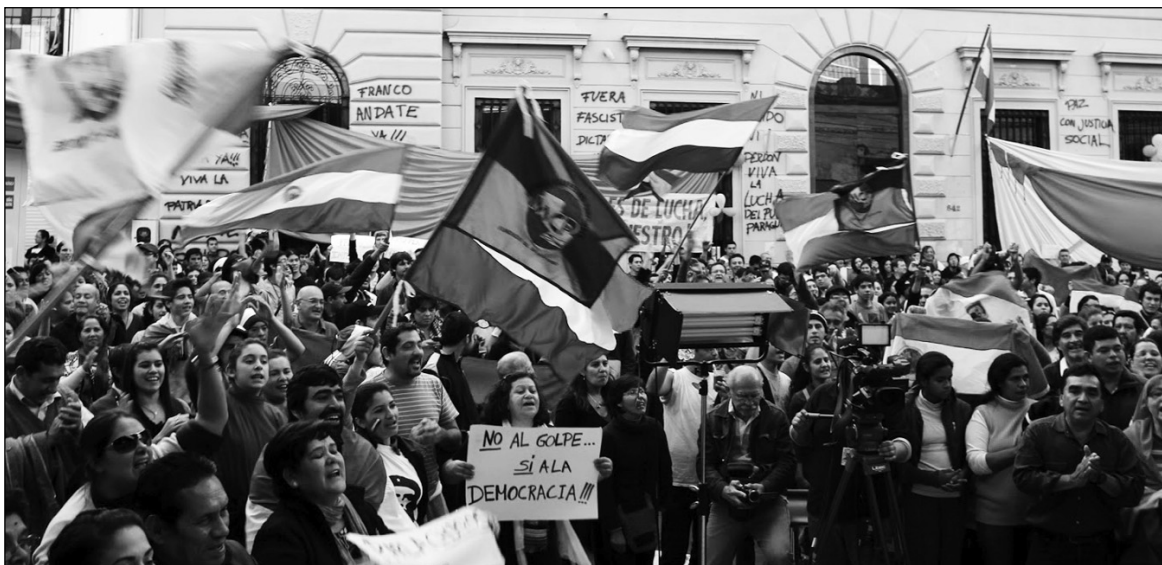
Paraguayos contra el golpe. El nacionalismo burgués latinoamericano mostró su impotencia ante los golpes de Honduras y Paraguay; Roussef y Kirchner no pueden hacer más contra el golpe a Lugo, porque protegen en sus países los mismos intereses del capital latifundiarsojo.