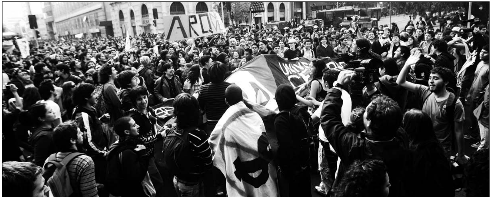
Movilización estudiantil chilena. Ante la crisis mundial y sus repercusiones en Latinoamérica, buscamos organizar el debate de la izquierda revolucionaria hacia la unidad política y de acción.

No se puede pasar por alto el papel reaccionario de estos frentes populares en el plano internacional. El PT fue artífice para convertir la candidatura del peruano Humala en un agente de los capitales mineros y de las