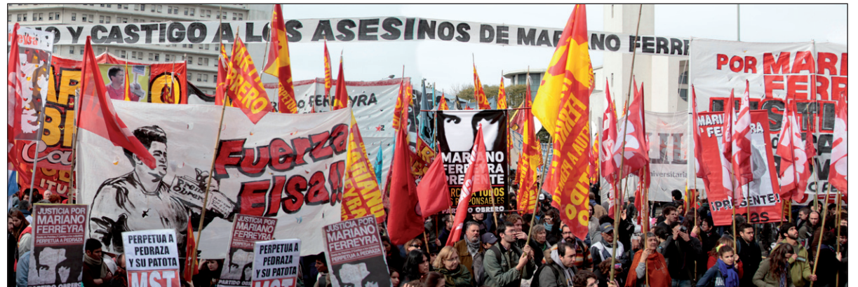
Masiva movilización frente a los tribunales de Comodoro Py.