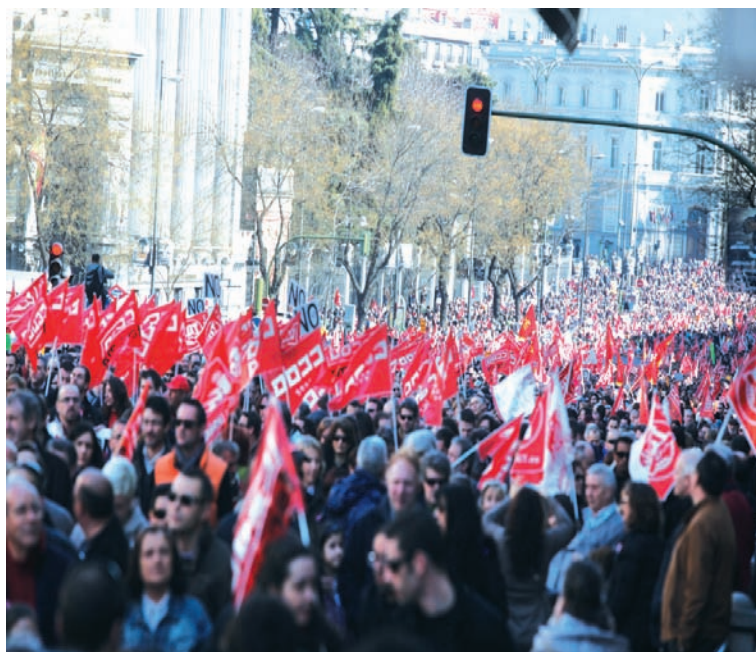
Obreros en las calles.

Los sindicatos mayoritarios están muy desprestigiados, pero todavía conservan apoyos. Probablemente en setiembre volverán a abrir la espita de la olla de presión del descontento social, por medio de una huelga general