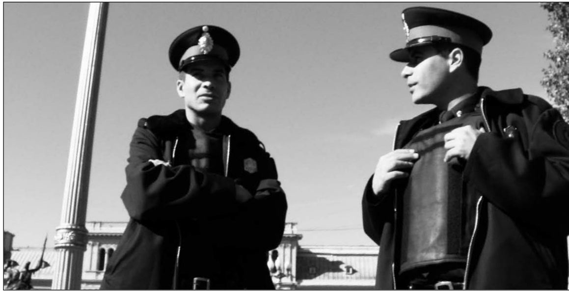
La policía fue "partícipe necesaria" del crimen. Los acusados deben ser juzgados por ese cargo, indagadas las jefaturas superiores que monitorearon la operación y los responsables políticos -dirigidos en ese momento por Aníbal Fernández.

Sabido es, y lo pudimos ver ahora en la sesión judicial, que la policía filmó todo -aunque capciosamente-; pero lo interrumpe en el momento en que la patota, reforzada, avanza y toma posición de tiro. En tanto, un cabo de calle que arribó al lugar -de apelli-