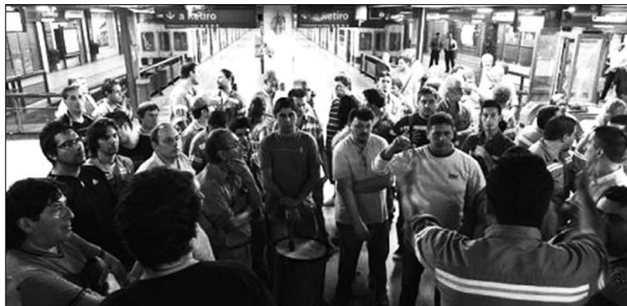
Asamblea de trabajadores de Metrovías.

El estado mayor kirchnerista azuzaba a la directiva del sindicato del subte contra Macri, negándole al mismo tiempo cualquier ámbito para llevar adelante la negociación colectiva que podía darle salida a la huelga. Esta estrategia perversa no tuvo otro propósito que desarrollar una (falsa)