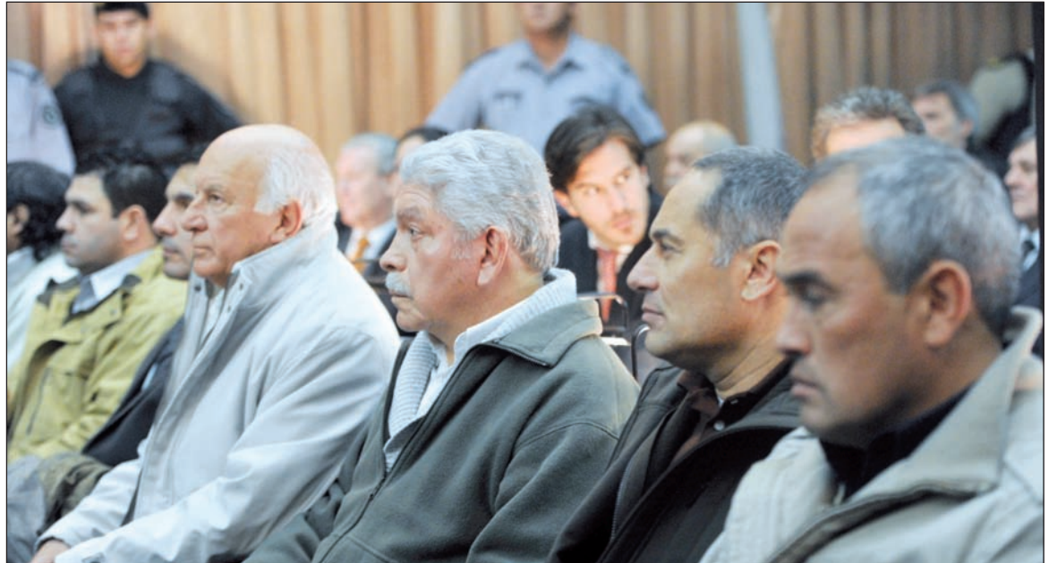
El banquillo de los acusados. Desde que comenzó el juicio, los acusados procuran ganar tiempo, a la espera de un giro político que, fuera del tribunal, les asegure su impunidad.