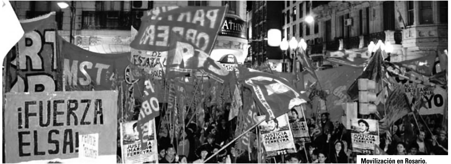
Movilización en Rosario.