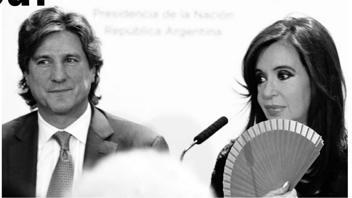
Amado Boudou y Cristina Kirchner.

La 'estatización' es simplemente el rescate de la propia camarilla de gobierno, la crisis por arriba marcha al galope.