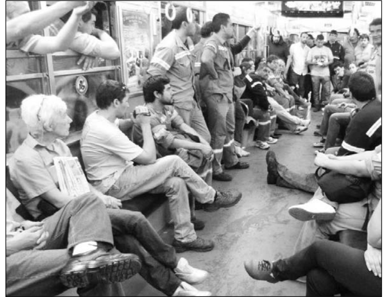
Asamblea obrera en Metrovías.

La parálisis del servicio del subte está determinada por la crisis política.