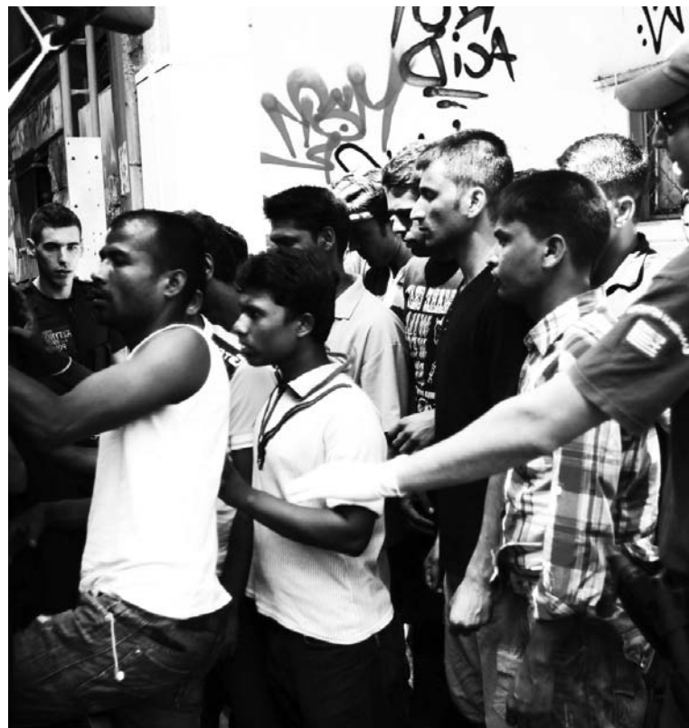
Expulsión de inmigrantes de Grecia. El gobierno hace concesiones a los nazis y ha renovado a la cúpula de los uniformados para hacer frente a una insurgencia popular.

En el mismo tablero, hay que incluir el "pogrom" que acaba de emprender el gobierno de Grecia contra los inmigrantes: 6 mil detenidos y 1.600 deportados en este primer fin de semana de agosto. La prensa informa que se tra-