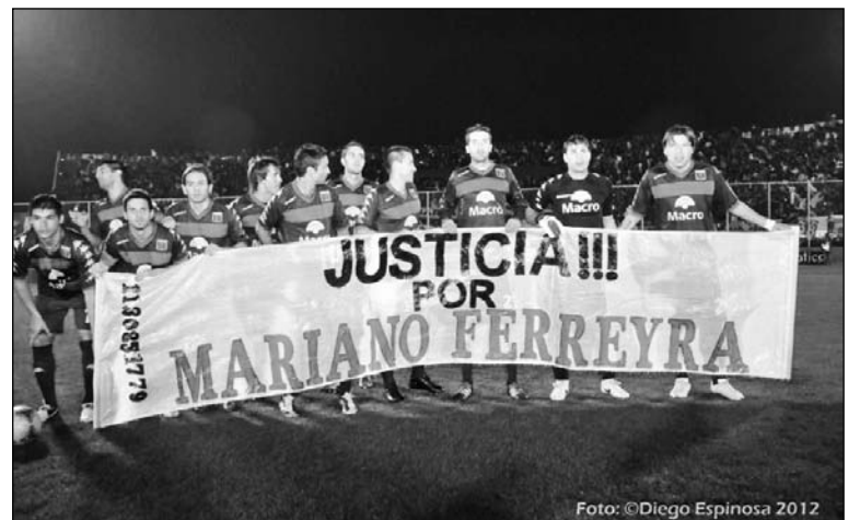
El plantel de Tigre, como otros equipos, se sumó a la campaña por Mariano Ferreyra.