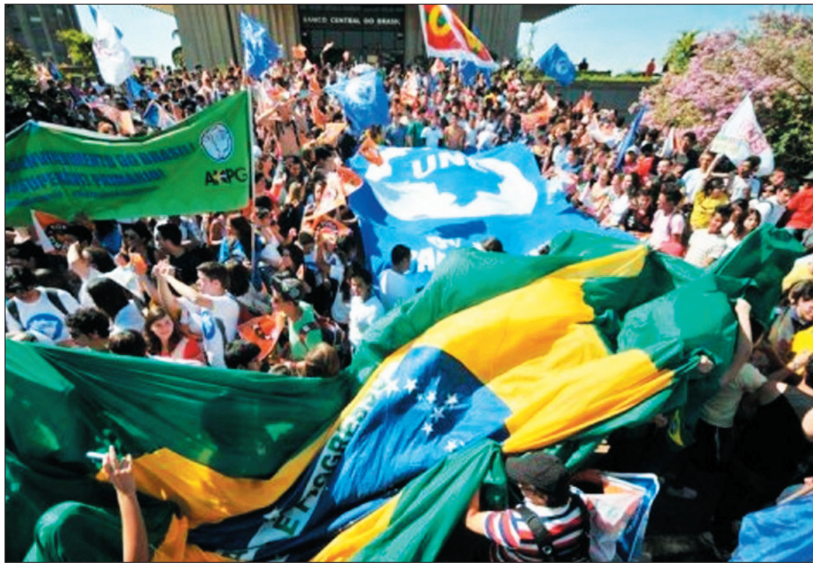
Movilización de trabajadores estatales en Brasilia. Después de una década, la base política del gobierno petista se empieza a quebrar.

La Ley de Directrices Presupuestarias (LDO) 2013 prioriza el superávit primario y no garantiza el aumento salarial de los trabajadores estatales más allá de lo negociado hasta el 31 de agosto. Sí proporciona la garantía del superávit primario para remunerar a los parásitos financieros (en 2012, la proporción del presupuesto de la Federación destinada a intereses y amortizaciones de la deuda ya supera el 47%) y crea todo tipo de obstáculos para la recuperación de la pérdidas salariales de los empleados públicos.