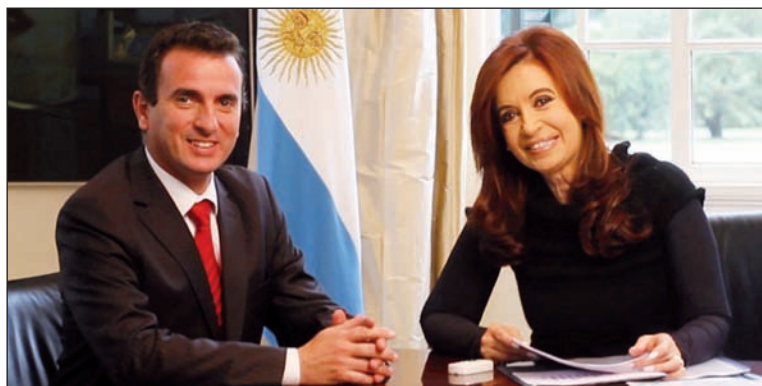
Paco Pérez y la presidenta Cristina Fernández

La destilería de Luján de Cuyo significa poco más del 20% del producto bruto geográfico de la provincia, casi 3 mil millones de pesos sólo de la refinación de hidrocarburos. No se cuenta la producción anexa, como el dióxido de carbono para gaseosas (único del país) y otros.