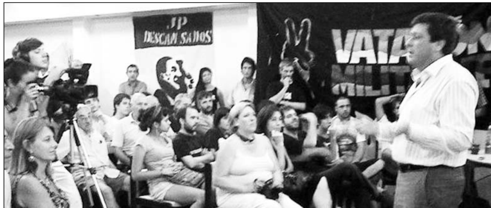
El vicegobernador de Buenos Aires, Gabriel Mariotto, en una charla organizada por "Vatallón Militante".

La Presidenta no se privó de tocar otro extremo: calificó de "ejemplar" al Servicio Penitenciario Federal, organización criminal si las hay. Obviamente, sus dichos son una cobertura grosera al reclutamiento de patoteros en las prisiones. Esa cooptación se mi-