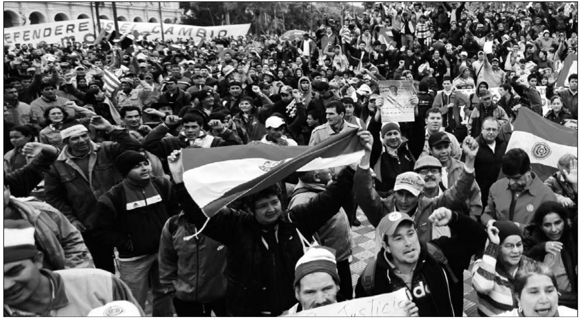
Movilización antigolpista en Asunción. Hace dos años, en nuestro XIX Congreso, alertábamos sobre la posibilidad de un golpe contra Lugo.

La crisis impactó de lleno en el régimen chavista, que avanza hacia la desintegración en un contexto inflacionario. El chavismo, enemigo de la autonomía política y sindical de la clase obrera, utiliza las milicias bolivarianas contra los trabajadores mientras apela a una jerga radical para capitalizar el voto de izquierda y bloquear la fuga de gobernadores y figuras relevantes en los últimos meses (...) El fracaso del gobierno reaccionario de la Concertación en Chile y su disgregación después de dos décadas de gobernar sin desafiar las estructuras sociales y políticas del pinochetismo abrió el camino de la victoria del derechista Piñera (...) En Paraguay, está planteada la posibilidad de un golpe parlamentario, estilo Honduras, contra el gobierno de Lugo".