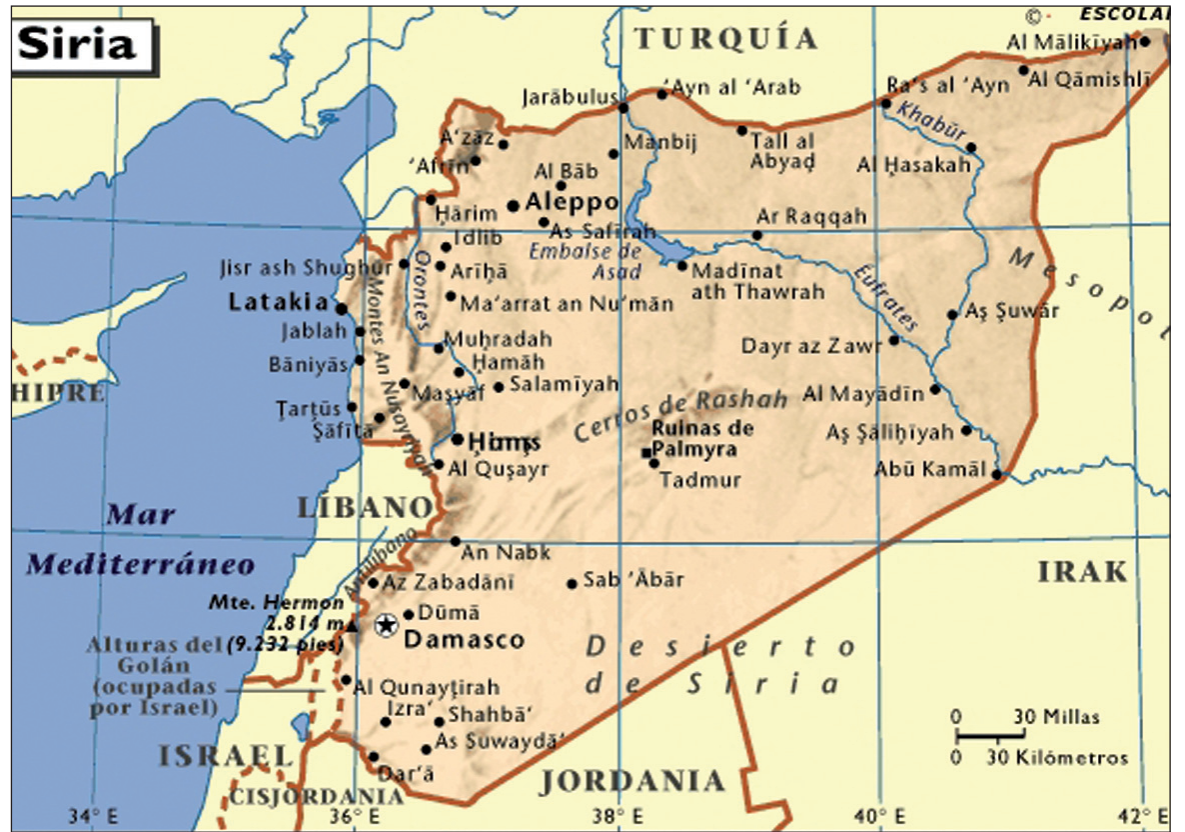
Mapa de Siria, y su ubicación central en el Medio Oriente. El imperialismo también apuesta aquí a una “transición ordenada”.

Pero el gobierno de Assad y la gran burguesía suní, cristiana y alawi no estaban listos para ceder ningún espacio importante a las demandas de las masas. La coalición contrarrevolucionaria internacional le dio la espalda a Assad solamente cuando se dio cuenta de su falta de capacidad o su rechazo. Aproximadamente seis meses después del comienzo de la re-