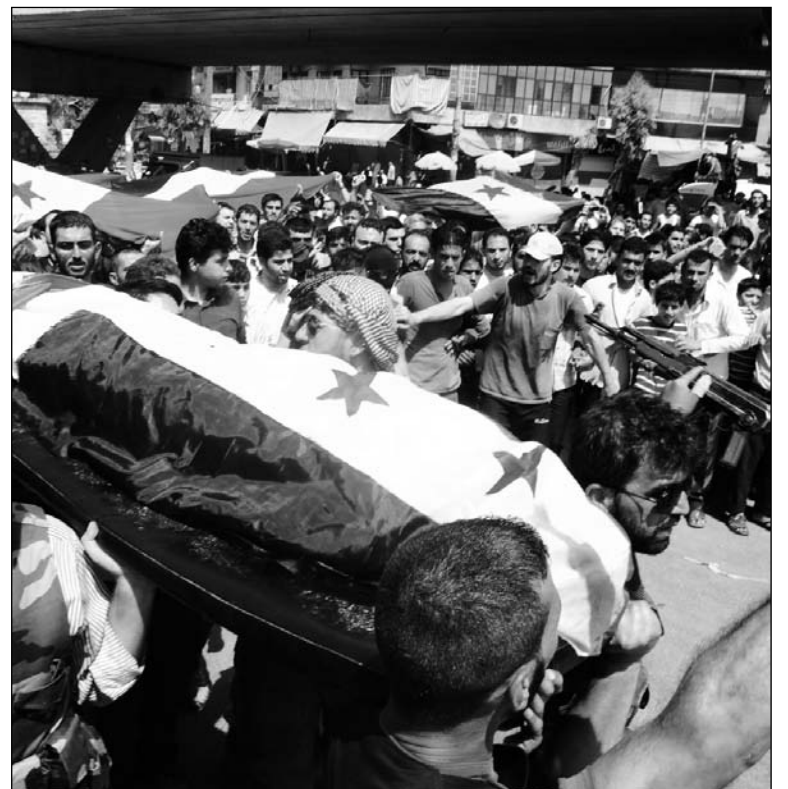
Funeral de asesinados por Assad. La revolución árabe puede avanzar si se apoya cada vez más en una revolución permanente de la clase obrera, las masas empobrecidas y la juventud.

Quinto, la facilidad con la cual las fuerzas kurdas han sido capaces de capturar las ciudades del norte de Siria crea la sospecha de que el régimen de Assad