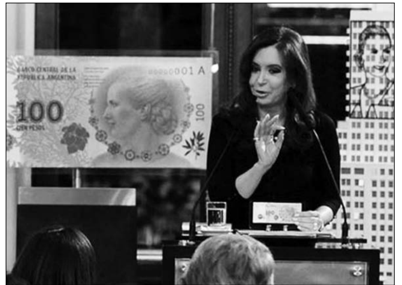
Cristina y el billete de Eva Perón. La tragedia, otra vez, se convierte en farsa.