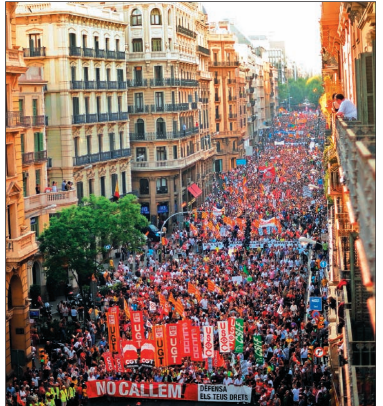
Los pueblos del Estado español siguen movilizándose.

Apenas han pasado ocho meses desde el triunfo electoral del PP, y la "imagen" de Rajoy se ha derrumbado a menos de 20 puntos. El "rescate total" de la Unión Europea implicaría la liquidación del gobierno. En los últimos días han crecido las voces que reclaman un "gobierno de unidad nacional", un editorial de un periódico financiero agrega que una "pieza fundamental" de ese gobierno "sería un vicepresidente económico de consenso", y que al mismo "deberían integrarse algunos miembros de la oposición y algún técnico particularmente calificado" (El Economista, 23/7). El País dedicó su tapa y páginas centrales del domingo, en un virtual editorial, a una entrevista con Felipe González, que reapareció para criticar al gobierno y denunciar que España está intervenida como Grecia o Irlanda, pero sin siquiera contar con los fondos de un rescate como el de esos países. El ex presidente del gobierno planteó que la situación ha "sobrepasado el límite" y reclamó que, si bien "no cree en los gobiernos de tecnócratas", Rajoy tiene la obligación de convocar a un "gran acuerdo nacional para salir de la crisis y para actuar en Europa". Es el reflejo de la magnitud de la crisis y la identidad del PSOE con el Partido Popular en la implementación del ajuste más antiobrero y antipopular en décadas; ambos tienen en