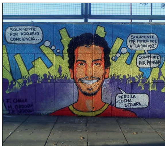
Mural en la Plaza Mafalda. Parte de una gran movilización popular de cara al juicio.

-Desde que yo estaba en Salta, el Partido Obrero siempre se caracterizó por darle un lugar a los artistas en diferentes causas; en recitales abiertos, por ejemplo, destacando siempre lo local y lo no tan comercial. Eso