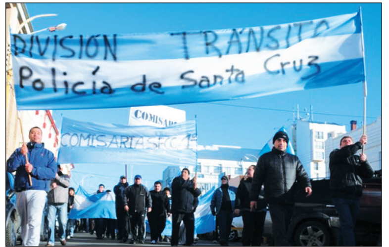
Policías en huelga. Conquistaron un aumento salarial al básico del 35,9%.

Por otro lado, la Mesa de Unidad Sindical ha consensuado un