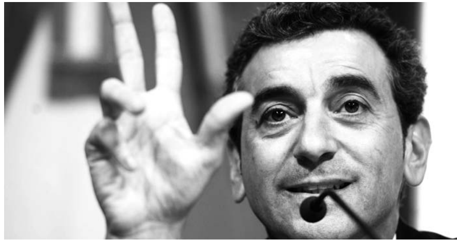
Florencio Ransazzo, ministro del Interior. Anuncian un tarifazo para engrosar los beneficios empresariales.

Randazzo hace el anuncio en las vísperas de las negociaciones pari-