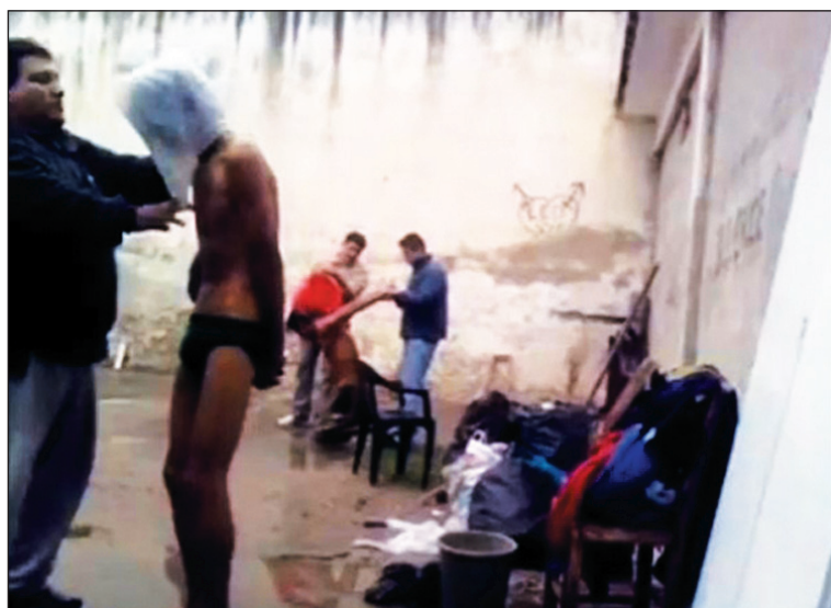
Torturas en una comisaría de Güemes. Cada caso debe tener su juicio y castigo.

No es un caso aislado. Así lo venimos denunciando desde el Partido Obrero, sobre todo desde que accedimos al parlamento. Incluso el gobierno de Romero -frente a la ola de denuncias y con varias muertes en comisarías- creó la alcaldía y el juez de garantía como una medida -inocua, claro- para evitar los "excesos" policiales. Hace poco, se aprobó un proyecto de ley para crear una comisión con-