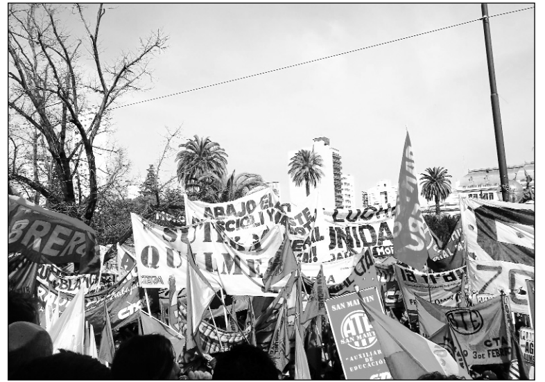
Movilización de estatales. Los trabajadores ganaron terreno para los próximos rounds.

Se trata de explicar, entonces, que el ajuste es nacional. Cristina sólo terceriza esta política antiobrera mediante los gobernadores, incluido el de Santa Fe, del FAP. Los límites del análisis de la Verde pasan por sus ataduras a Bin-