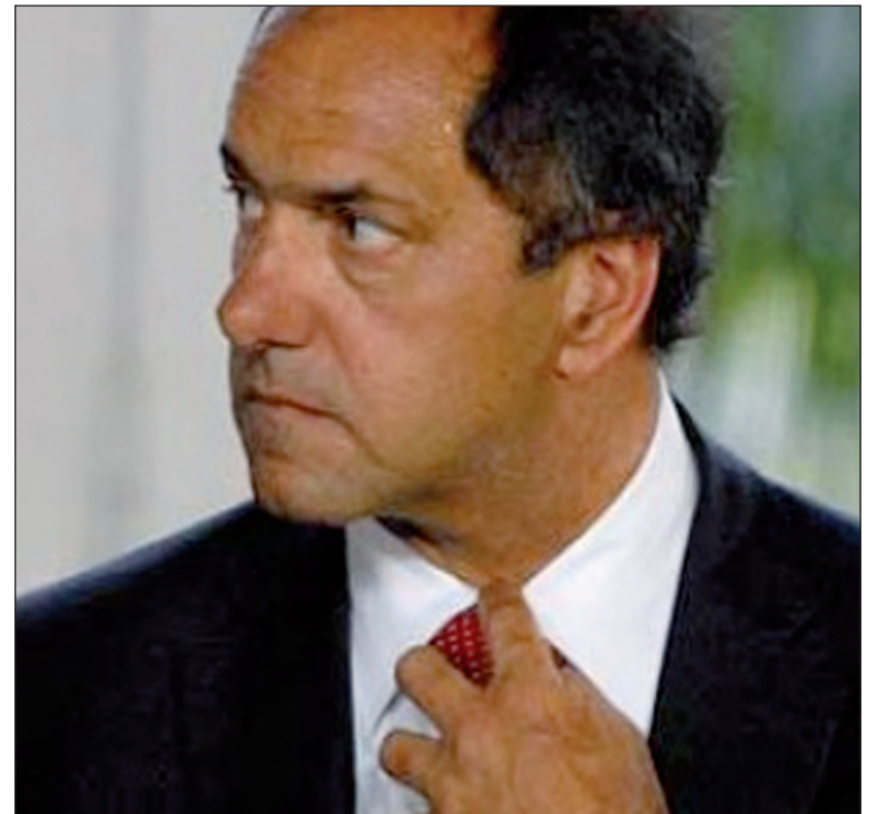
Daniel Scioli. La batalla "antineoliberal" de los mariottistas es el barniz del cristinismo también ajustador; a Scioli lo tienen que sacar los trabajadores, no Cristina.

Nuestro partido apoya y organiza la huelga del medio millón de estatales bonaerenses. Incluso -especialmente- proponemos superar la estrechez de los paros aislados mediante la huelga general hasta arrancar el pago del aguinaldo completo. Las diferentes alas de los sindicatos no creen en esta posibilidad y lanzan paros para "canalizar" la bronca.