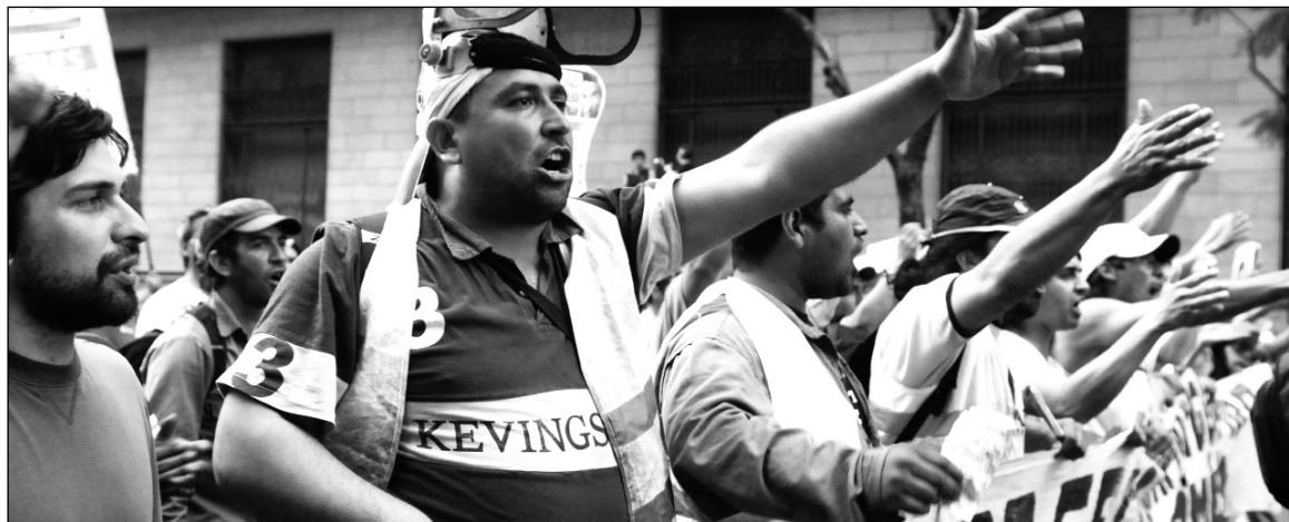
Movilización de tercerizados ferroviarios

Se trata de un proceso frágido, como el promovido en su contra por la Secretaría de Transporte en ocasión del corte de vías del 23 de diciembre de 2010 en reclamo del cumplimiento de los compromisos del Ministerio de Trabajo por el pase a planta de los ex tercerizados. En esa causa, la ministra de Seguridad, Nilda Garré, fue incapaz de corroborar con pruebas las falsas acusaciones que lanzó (durante una conferencia de prensa televisada) contra Hospital y contra otros compañeros de Causa Ferroviaria, a quienes les endilgó la promoción de desmanes en Constitución -en el mismo mo-