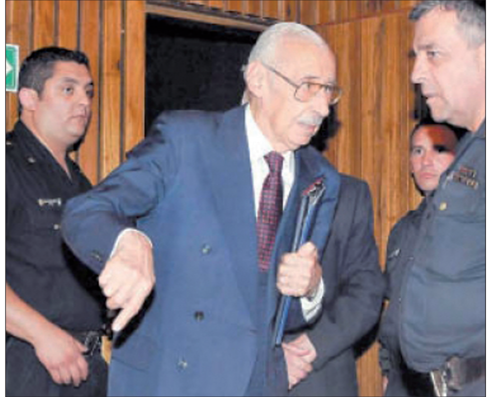
Jacyn Videla. La condena llega después de tres décadas de impunidad

A pesar de reconocer que se trató de un "plan", el monto de las condenas resulta de los casos individuales que la Justicia dio por probados, ya que el código penal tipifica la apropiación ilegal de niños, pero no su práctica sistemática. Las penas -que incluso resultan mezquinas- llegan después de tres décadas de impunidad. Actualmente, Videla tiene 87 años.