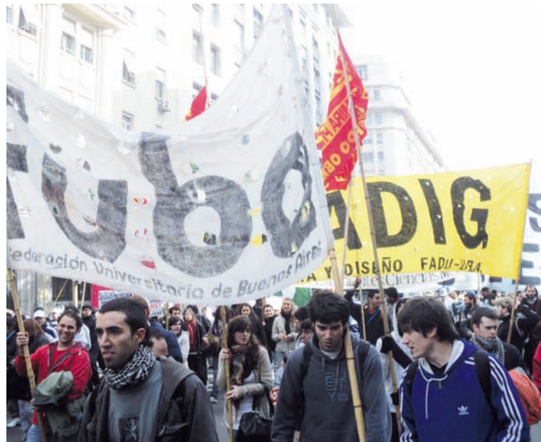
Un pacto podrido contra la Federacion Universitaria de Buenos Aires.

De cara al segundo cuatrimestre, quedan en juego importantes cuestiones. Por un lado, el esclarecimiento de este ataque 'a la paraguaya' contra la Fuba, para obtener su liquidacion. Esta batalla tendra un desenvolvimiento especial en la larga serie de elecciones de centros, que comenzara en septiembre. Al mismo tiempo, ha quedado clara que la legitimidad del movimiento estudiantil radica en