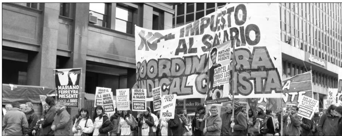
Movilización de la Coordinadora Sindical Clasista contra el impuesto al salario.

Según Infobae , "el salario es hoy el principal sostén de los recursos fiscales" ( Infobae.com , 25/6) y "su tasa de crecimiento anual (32,1%) es más alta que la del IVA (22,8%) y que la de ganancias (19,1%)" (ídem). El impuesto a las ganancias ya históricamente constituía apenas un 40% de lo que se recaudaba por el IVA; al revés de lo que ocurre en la mayoría de los países industrializados, donde la relación está invertida. En lo que se denomina impuesto a