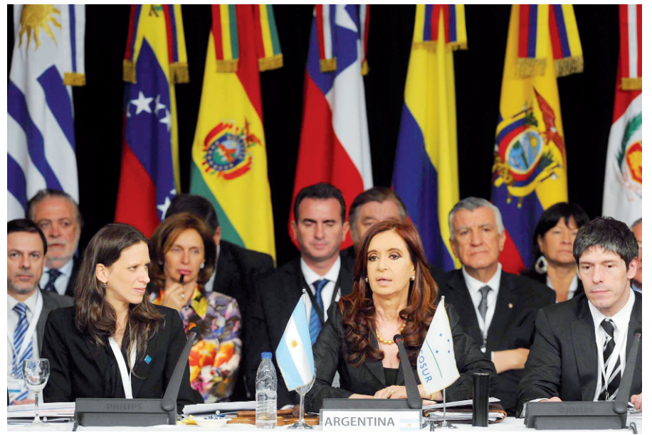
Cumbre del Mercosur. Duplicidad política de CFK y Roussef.

El gobierno paraguayo también "apretó" con Yacretá. Amenazó con "dejar sin luz a