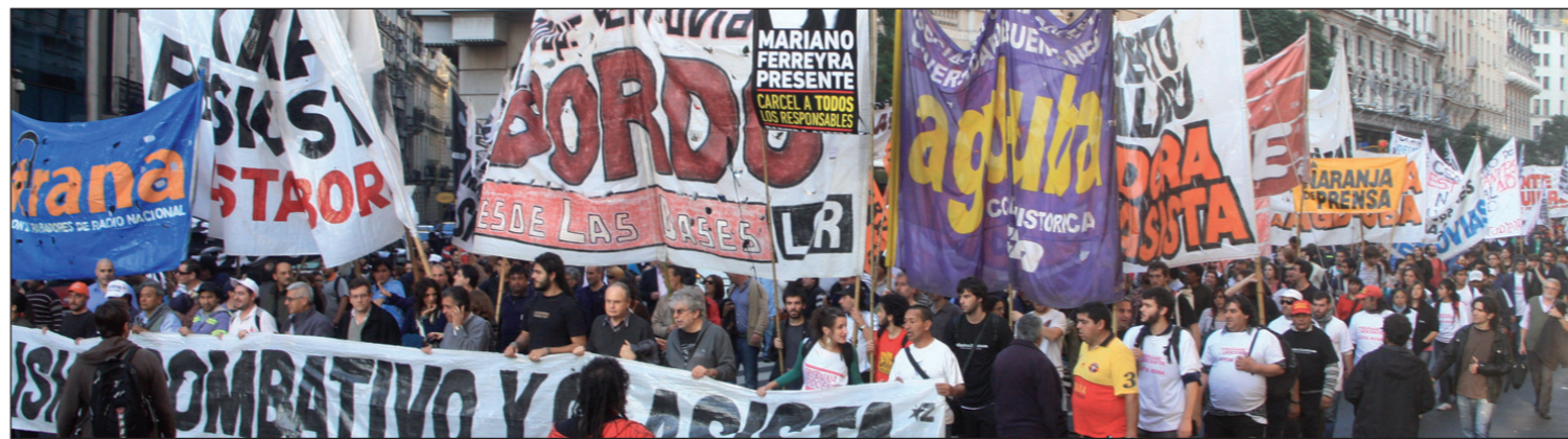
Clasistas marchan a Plaza de Mayo. Reclamamos un plan de lucha de la CGT mediante un Congreso de Bases y planteamos una salida política de los trabajadores.

Nada sigue igual después de la movilización a Plaza de Mayo.