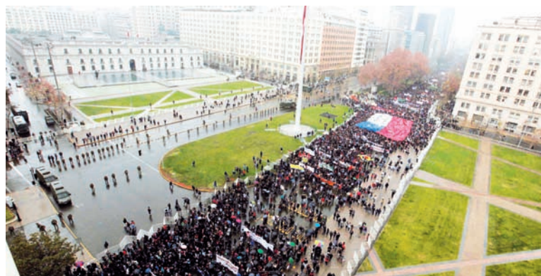
La rebelión estudiantil trasandina continúa desafiando al poder político.

tema educacional". En este se reclaman -entre otros- la gratuidad, el carácter público, la autonomía, y la democratización -o sea, la participación de estudiantes y de trabajadores en los gobiernos institucionales. Durante este año, la incapacidad del gobierno de Piñera para desarmar el conflicto permitió esclarecer que están en juego problemas de fondo y no meros "pedidos educativos". La creación de una Comisión Investigadora de la Cámara de Diputados sobre el funcionamiento de la Educación Superior desató una crisis política, pues las primeras irregularidades detectadas fueron desautorizadas por el ministro de Educación, Harald Beyer. Ocurre que el conjunto del régimen está implicado en el lucro de las privadas (justamente lo que los estudiantes reclaman que concluya): políticos de todas las tendencias son accionistas o dueños de instituciones educativas. Los jóvenes chilenos son la vanguardia que cuestiona de plano el régimen de la Concertación y